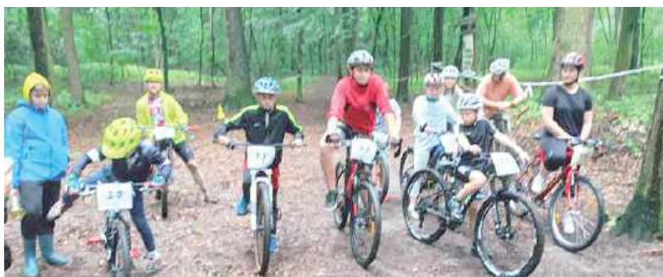
Start młodszych uczestników

Sobotni poranek nie rozpieszczał zawodników. Intensywne opady zniechęciły część uczestników, szczególnie tych najmłodszych. Mimo to blisko 30 kolarzy z całej Lubelszczyzny stawiało się na starcie i dzielnie pokonało wymagające, mokre trasy.