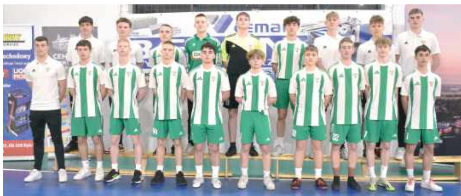
Zespół Ruchu II będzie opierać się na graczach, którzy jeszcze w poprzednim sezonie występowali w zmaganiach młodzieżowych

- Niektórym chłopakom kończy się wiek juniora. W ten sposób albo szukaliby grania w innych