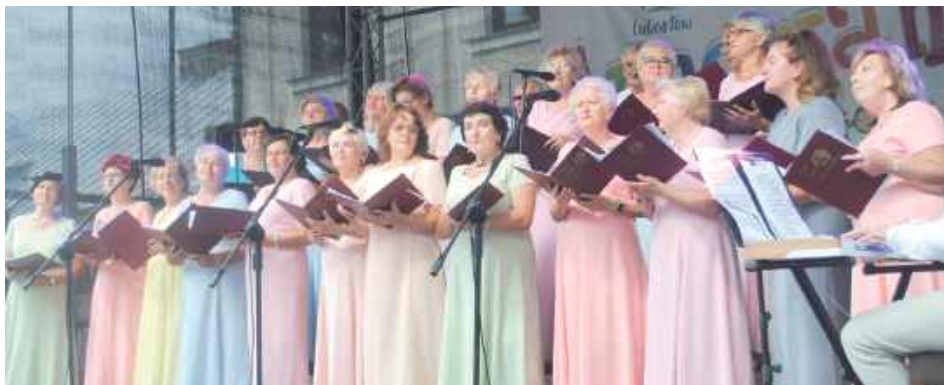
Chór Ziemi Lubartowskiej na Annowaniu

Na Anny i innych uczestników imprezy czekał imieninowy tort (Annowanie organizowane jest w niedzielę najbliższą imieninom Anny, w tym roku wypadło 27 lipca, dzień po nich).