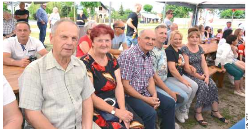
Wydarzenie miało na celu nie tylko integrację lokalnej społeczności, ale również promocję tradycji, kultury i działalności strażackiej

Nie zabrakło też loterii fantowej, pysznej gastronomii (w tym lodów, waty cukrowej, gofrów, frytek, zapiekanek, popcornu i innych smakołyków),