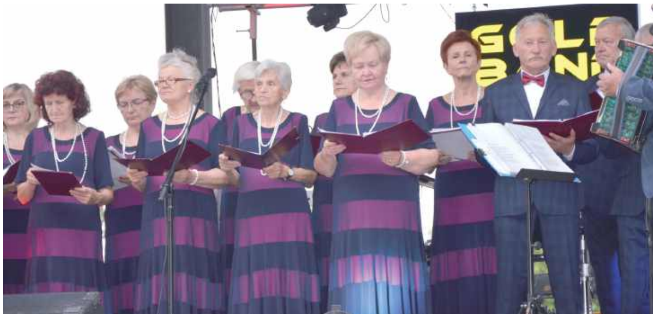
Niezastąpiony Chór Seniora „Zorza” na rozpoczęcie świętowania zaśpiewał utwory o Stężycy

W ostatni weekend lipca mieszkańcy gminy Stężycy oraz goście z okolic mieli okazję uczestniczyć w obchodach Dni Stężycy - wydarzenia, które łączy sport, kulturę i integrację lokalnej społeczności.