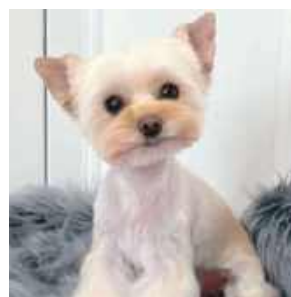
Cynka, Paweł Siadło, Zalesie