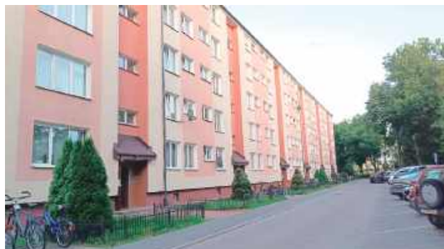
To w tym bloku dokonano makabrycznego odkrycia

Jak informuje puławska policja, z jednego z mieszkań wydobywał się brzydki zapach. Mieszkańcy zawiadomili spółdzielnię. Przekazali jednocześnie, że mieszkającego w nim sąsiada nie widzieli od kilku dni. Prezes spółdzielni powiadomił o tym fakcie policję. Pod wskazany adres udał się policyjny patrol. Niestety pukanie do drzwi i nawo-