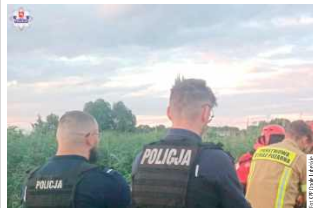
kierowani na miejsce strażacy przy użyciu łodzi wydobyli na brzeg zwłoki mężczyzny, które znajdowały się w odległości 20 metrów od brzegu