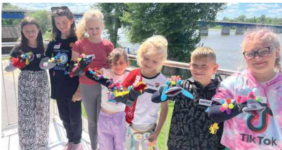
Na zajęciach krawieckich powstały pacynki uszyte ze skarpetek, a następnie odbyły się zabawy teatralne i rozwijające twórczość wypowiedzi

Cykl wtorkowych spotkań rozpoczął się 8 lipca od rodzinnych warsztatów w pracowni plastycznej MDK, podczas których uczestnicy zapoznali się z podstawami ceramiki, wykonując swój kubek i talerzyk. Następnie podczas zajęć rękodzielniczych,