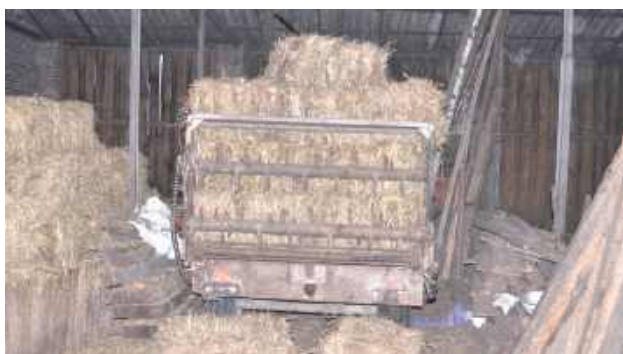
Stojący na belkach 80-latek zachwiał się i spadł z wysokości ułożonych na przyczepie belek siana prosto na asfalt

Cała akcja rozegrała się w sobotę, 26 lipca w godzinach popołudniowych w miejscowości Wólka Komaszycza w gminie Opole Lubelskie.