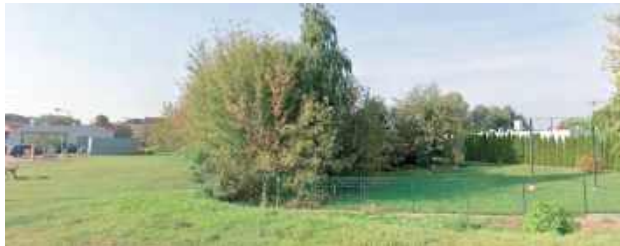
W tym miejscu ma stanąć „Mak”

Codziennie jeżdżę przez Dęblin w drodze do pracy i naprawdę brakuje mi czegoś szybkiego, gdzie można by się zatrzymać i coś zjeść bez kombinowania. Teraz, jeśli chcę burgera z McDonald'a, to muszę jechać do Puław. To ponad pół godziny w jedną stronę. McDonald's w Dęblinie byłby super wygodny. Poza tym to nie tylko jedzenie. To też nowoczesny lokal z darmowym Wi-Fi, dostępem do toalety, klimatyzacją... To przyciąga ludzi, zwłaszcza młodych.