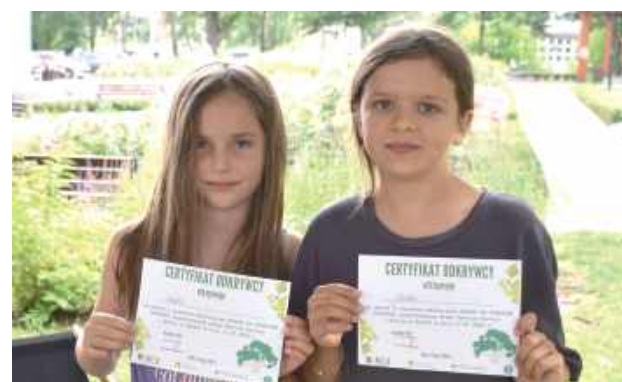
Na zakończenie spaceru czekała na wszystkich mała nagroda – piknik z CKiS i Park Cafe

Podczas spaceru uczestnicy dowiedzieli się, czym właściwie są pomniki przyrody, dlaczego zostały objęte ochroną i kto decyduje o ich statusie, jak oszacować wiek drzewa i jak długo potrafią żyć nie-