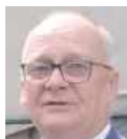
Dariusz Szczygielski starosta powiatu ryckiego