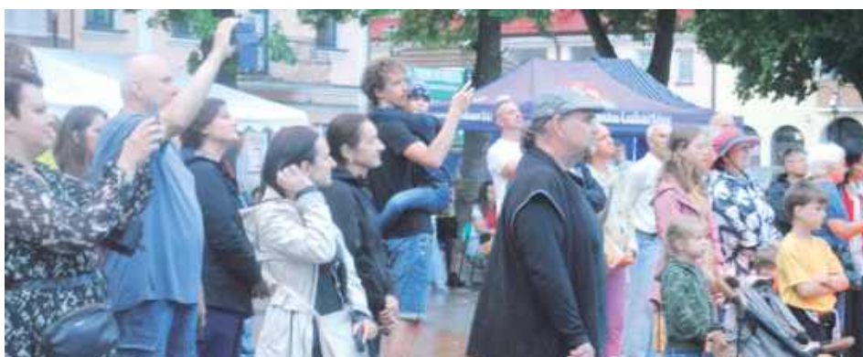
Publiczność dobrze się bawiła na koncertach mimo kapryśnej pogody