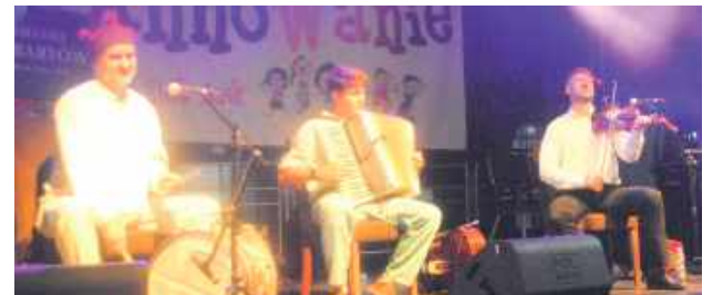
Do tańca przygrywała Kapela z Borówka