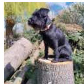
Toto na wakacjach, Wiesława Ulita, Biała Podlaska