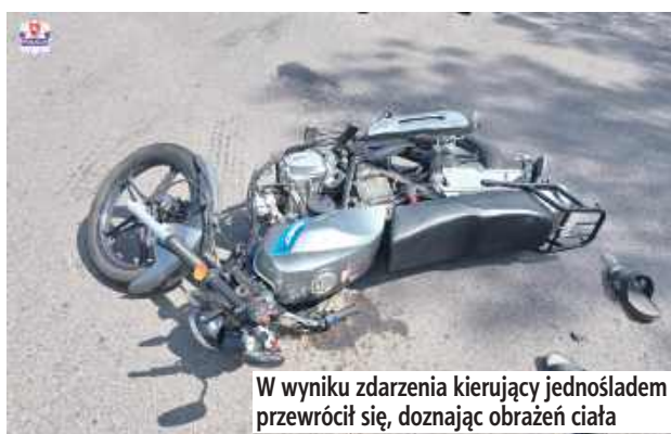
W wyniku zdarzenia kierujący jednośladem przewrócił się, doznając obrażeń ciała

W wypadku z udziałem motorowera oraz samochodu osobowego ranny został 71-letni kierowca jednoślada, który - jak się okazało - był pod wpływem alkoholu.