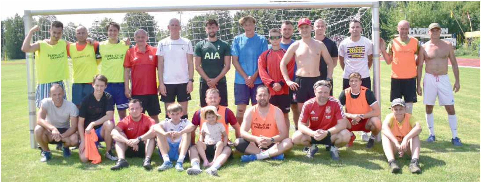
Pamiętkowe zdjęcie wszystkich uczestników zmagani

Trzy drużyny wzięły udział w turnieju piłki nożnej o puchar wójta gminy Stężycy w ramach Dni Stężycy.