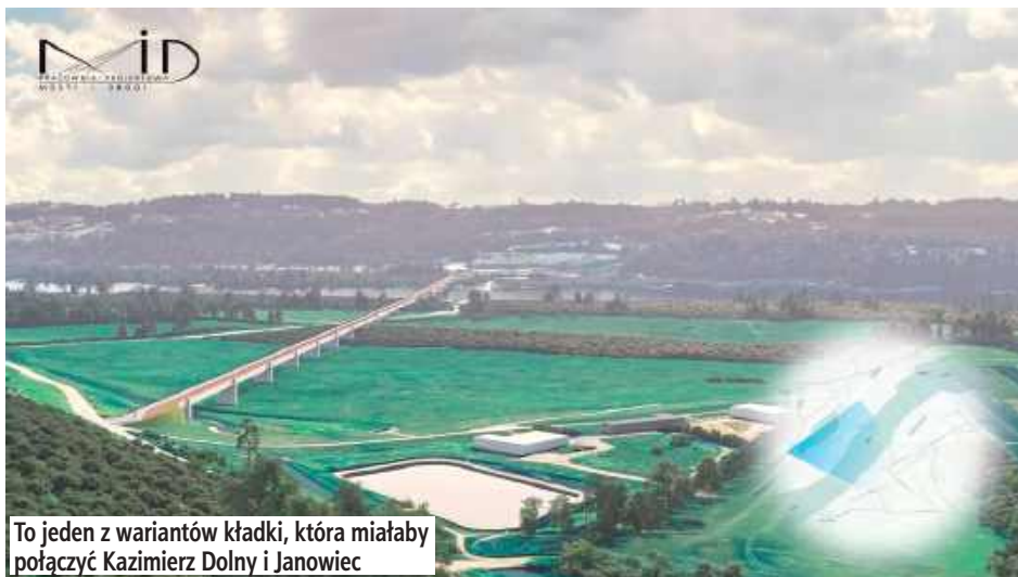
To jeden z wariantów kładki, która miałaby połączyć Kazimierz Dolny i Janowca

Latem 2022 r. Zarząd Dróg Wojewódzkich w Lublinie ogłosił przetarg na przygotowanie koncepcji programowo - przestrzennej takiej kładki. Wpłynęły 4 oferty. Najtańsza - za 874,5 tys. zł - pochodziła od Pracowni Projektowej MiD z Gdańska i to na nią się zdecydowano. W grudniu kierownictwo ZDW i przedstawiciele wykonawcy podpisali stosowną umowę. Firma miała za zadanie nie tylko