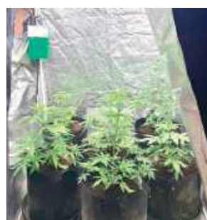
Część konopi znajdowała się w specjalnym namiocie, reszta stała na zewnątrz

- Jest podejrzany o uprawę konopi innych niż włókniste w ilości mogącej dostarczyć znacznej ilości ziela konopi innych niż włókniste, wytworzenie środków odurzających w znacznej ilości oraz przygotowanie do wprowadzenia ich do obrotu - wymienia rzeczniczka puławskiej policji.