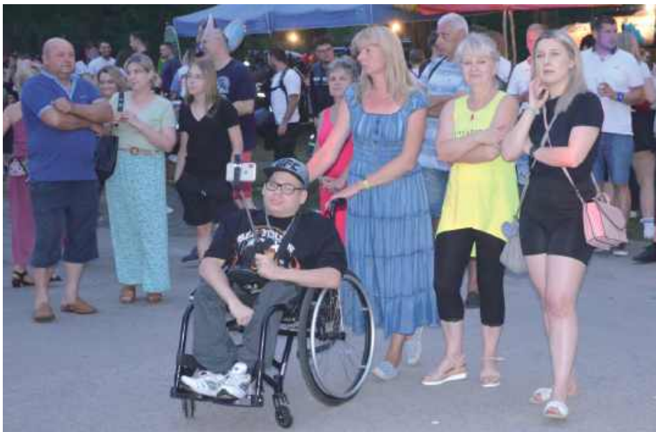
US Przed sceną tłumnie gromadzili się uczestnicy, aby zobaczyć występ gwiazdy wieczoru - zespołu Mega Dance