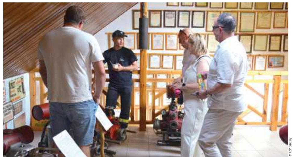
Ogromnym zainteresowaniem cieszył się także pokaz sprzętu strażackiego oraz możliwość zwiedzania sali tradycji OSP Brzeziny, gdzie można było poznać historię jednostki i zobaczyć zabytkowy sprzęt gaśniczy

a całe wydarzenie zwieńczyła wieczorna zabawa taneczna przy muzyce zespołu VERS.