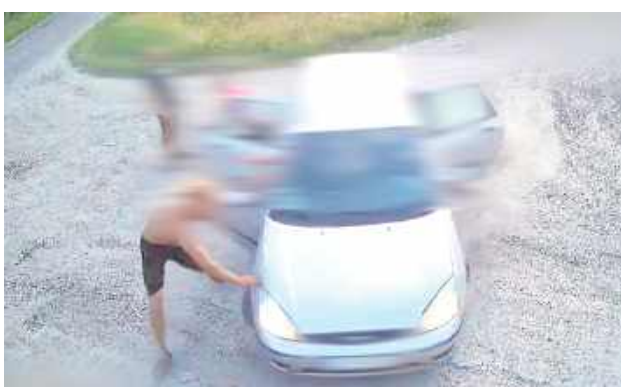
Zajście uwieczniły kamery monitoringu

Parczewscy policjanci zatrzymali 5 mężczyzn, którzy kilka dni temu po wywabieniu z domu mieszkańca gm. Dębowa Kłoda, próbowali rozjechać go samochodem, a później rzucili się za nim w pogoń, grażąc mu i próbując go pobić.