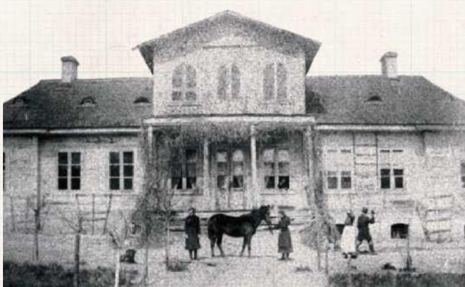
Będący centrum działalności konspiracyjnej przed powstaniem styczniowym dwór w Pieszowoli został spalony przez Moskali w sierpniu 1915 roku