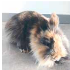
Krakers, Pola Kowalczyk, Krzywda