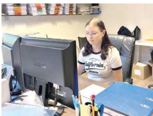
Młodzi mają możliwość zweryfikowania posiadanej wiedzy, a także zdobycia nowych umiejętności i poszerzenia już posiadanych

Uczniowie pracują w lokalnych firmach zgodnie ze swoim kierunkiem kształcenia: technik rachunkowości - biura rachunkowe i działy księgowości w firmach i urzędach, technik reklamy - agencje reklamowe, technik żywienia i usług gastronomicznych - restauracje, technik hotelarstwa - hotele i pensjonaty.