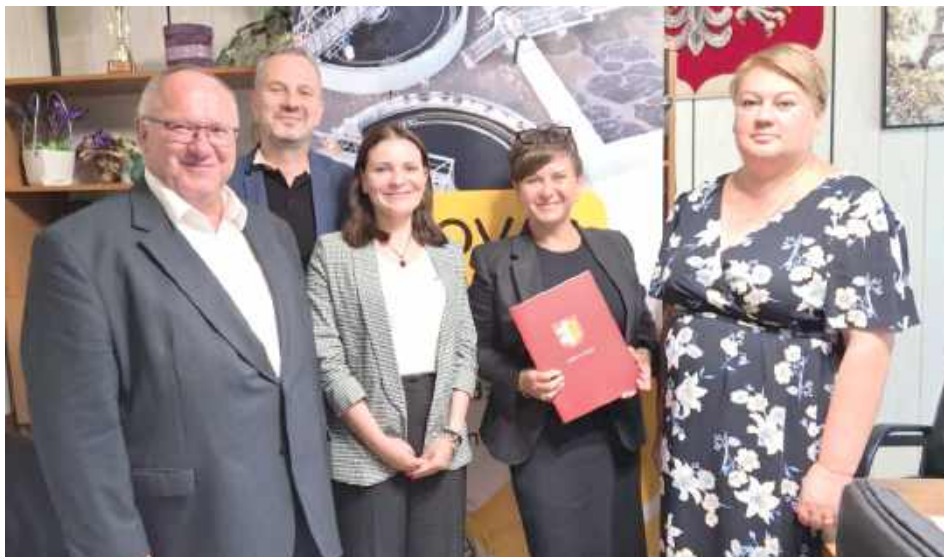
Zakres umowy obejmuje opracowanie pełnej dokumentacji projektowej budowy oczyszczalni ścieków wraz z niezbędną infrastrukturą techniczną towarzyszącą inwestycji, zlokalizowanej w Białkach Dolnych

Zakres umowy obejmuje opracowanie pełnej doku-