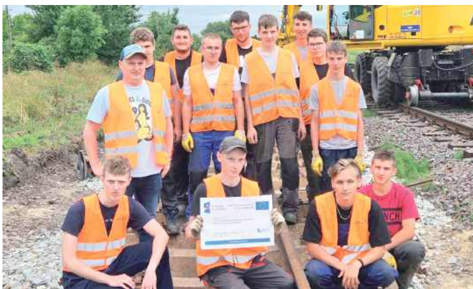
Miesięczny staż pozwala uczniom zdobyć praktyczne doświadczenie zawodowe, poznać specyfikę zawodu i rozwijać umiejętności w realnym środowisku pracy. Jest to szansa na uzupełnienie wiedzy teoretycznej z programu nauczania o praktyczne aspekty zawodu, co zwiększa szanse na znalezienie pracy po ukończeniu szkoły

W ramach tego projektu 15 uczniów technikum bierze udział w płatnych, miesięcznych