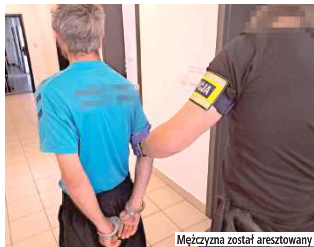
Mężczyzna został aresztowany

- Jednak w toku prowadzonego postępowania okazało się, że