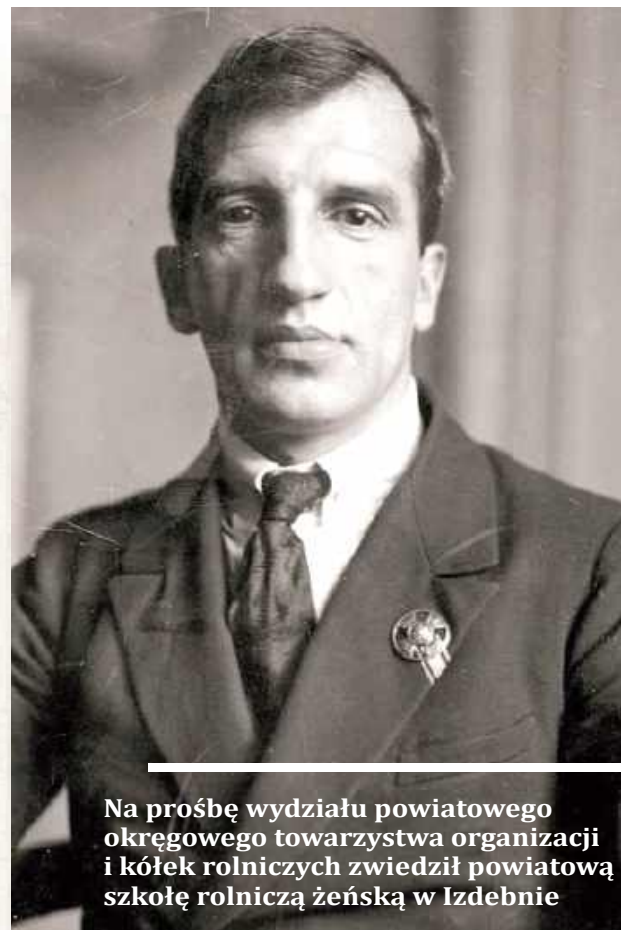
Na prośbę wydziału powiatowego okręgowego towarzystwa organizacji i kółek rolniczych zwiedził powiatową szkołę rolniczą żeńską w Izdebnie

Juliusz Poniatowski w okresie od 1934 roku aż do wybuchu II Wojny Światowej sprawował obowiązki ministra rolnictwa i reform rolnych II RP