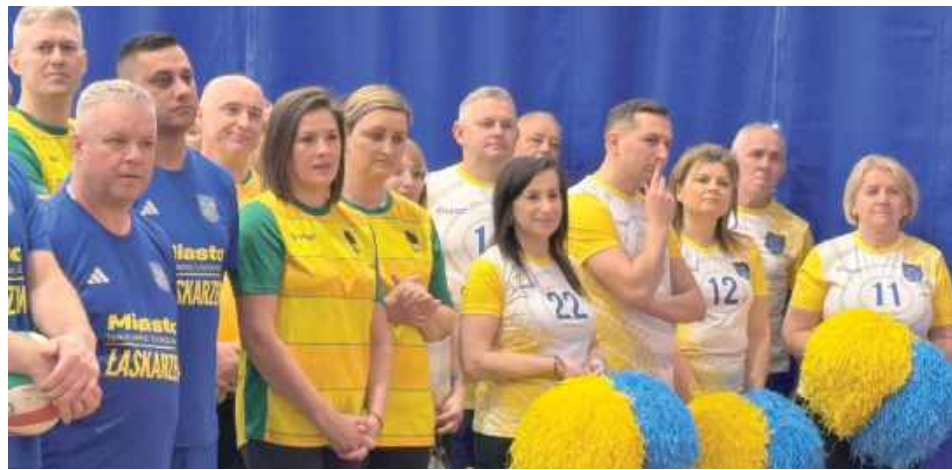
Bezkonkurencyjna okazała się drużyna z gminy Górzno