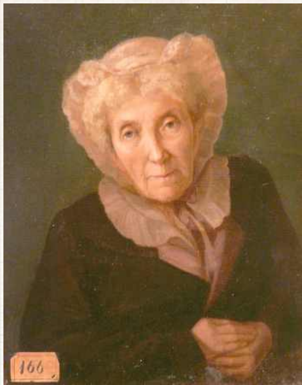
Portret Izabeli z Flemmingów Czartoryskiej - jedna z prac Adama Pilińskiego

Był uznanym grafikiem, rytownikiem i litografem. Z zamiłowania paleograf i rekonstruktor starodruków. Adam Piliński w okresie zaborów był działaczem emigracyjnym we Francji.