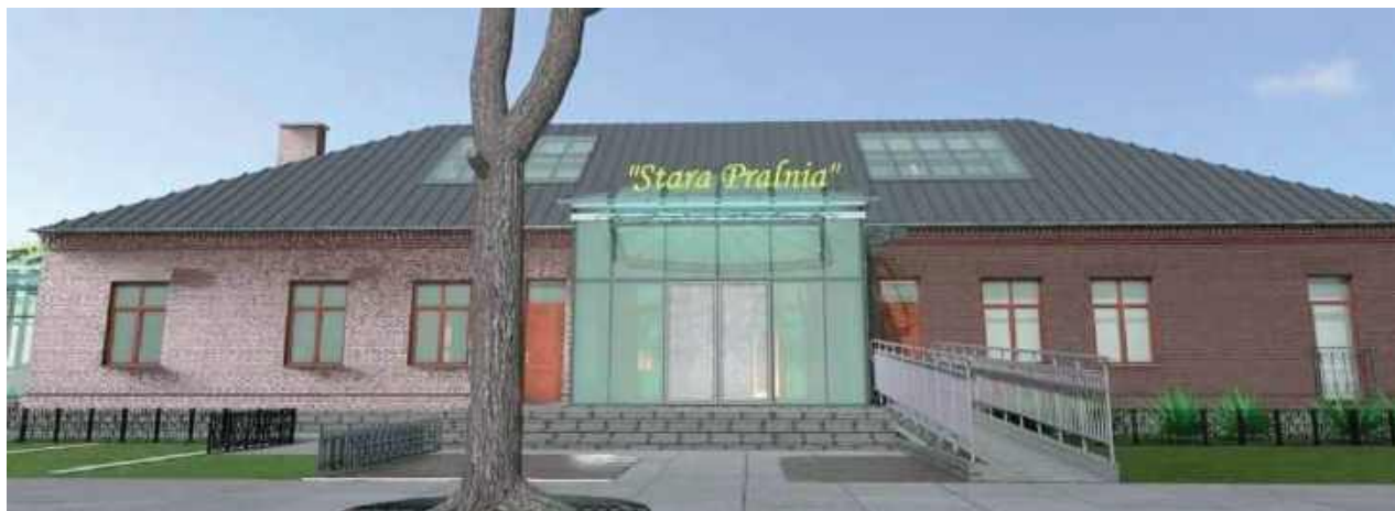
Projekt „Starej Pralni”

Burmistrz Garwolina poinformowała, że do Urzędu Miasta wpłynęły cztery oferty na realizację pierwszego etapu rewitalizacji zabytkowego budynku koszarowego Starej Pralni. Teraz przejdą dokładny proces sprawdzenia i weryfikacji.