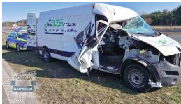
Mieszkaniec powiatu rzeszowskiego zasnął za kierownicą i uderzył w tył jadącej przed nim ciężarówki

2 kwietnia przed godz. 9 na drodze ekspresowej S17 w Mierzące w kierunku Lublina doszło do zdarzenia drogowego z udziałem