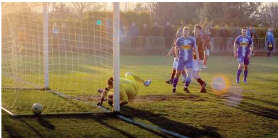
Wysoka forma Orła Parysów potwierdzona. Tym razem wygrali z Wisłą Dziecinów 2:3 po bardzo ciekawym meczu

Mecz Orła Parysów z Wisłą Dziecinów to bez dwóch zdań pojedynek ekip, których ambicjami nie jest tylko spokojny ligowy byt. Tym samym w sobotnim starciu należało spodziewać się ogromnych emocji i zgromadzeni na meczu kibice nie mogą narzekać na ich brak. Spotkanie zaczęło się bardzo niekorzystnie dla przyjezdnych, którzy już w 19. minucie musie-