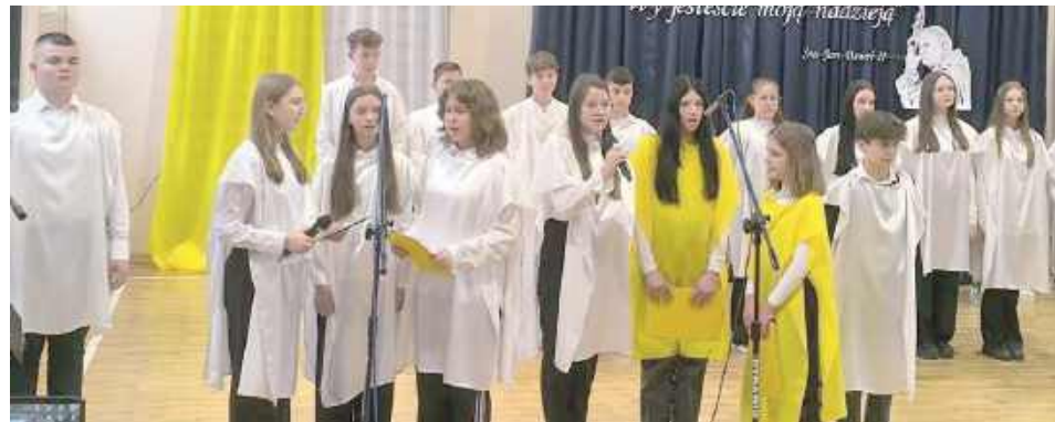
red. W wydarzeniu uczestniczyli przedstawiciele dziesięciu szkół z Diecezji Siedleckiej noszących imię Jana Pawła II