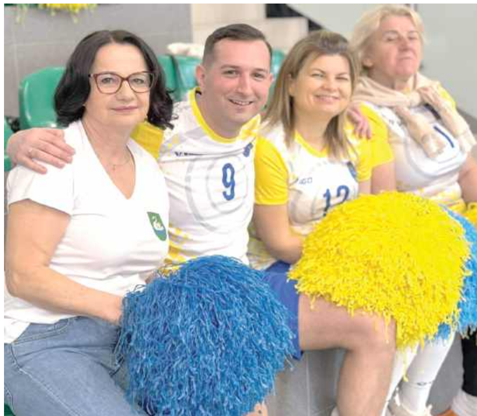
Kilkogodzinna rywalizacja sportowa pokazała, że nasze samorzady są zgranymi zespołami także na parkiecie