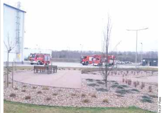
Doszło do zadymienia w budynku administracyjno - biurowym spowodowanego awarią techniczną

Poranny alarm w Akzo Nobel w Pilawie. W akcji brało udział sześć zastępów straży