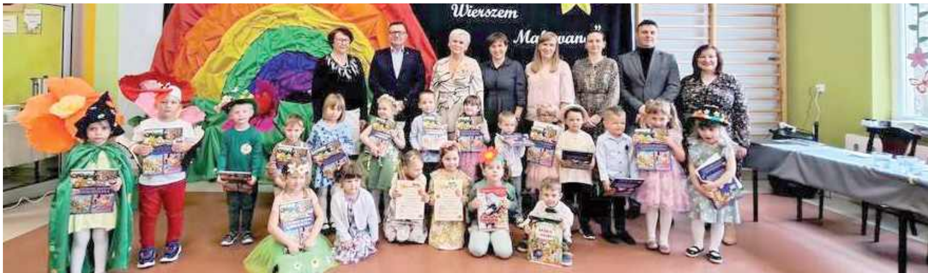
W Przedszkolu Samorządowym w Trojanowie odbył się konkurs recytatorski poświęcony wiosnie