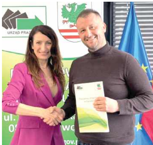
Przedsiębiorcy z powiatu, którzy otrzymali dofinansowanie, utworzą 11 stanowisk pracy w branżach

- Serdecznie gratuluję przedsiębiorcom - to niezwykle ważny krok, który nie tylko wpływa na rozwój Państwa firm, ale także przyczynia się do rozwoju naszego powiatu. Od początku 2025 roku podpisaliśmy już 55 umów na 2 532 260 zł - czytamy w mediach społecznościowych Starosty Iwony Kurowskiej.