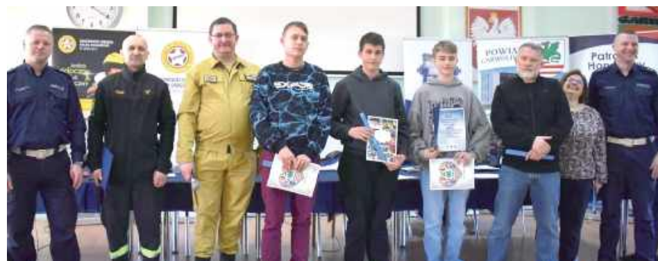
Uczestnicy musieli wykazać się nie tylko wiedzą teoretyczną, ale także umiejętnościami praktycznymi

W Zespole Szkół nr 1 im. Bohaterów Westerplatte w Garwolinie odbyły się powiatowe eliminacje Ogólnopolskiego Turnieju Bezpieczeństwa w Ruchu Drogowym dla uczniów szkół podstawowych.