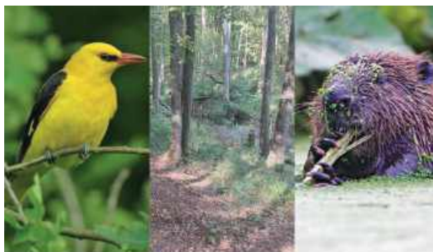
W ramach inicjatywy 100 rezerwatów przyrody na 100-lecie Lasów Państwowych na terenie Nadleśnictwa Garwolin powstaje nowy rezerwat

W górnej warstwie grądu dominuje dąb szypułkowy z domieszką lipy drobnolistnej, jesionu, brzozy, olszy czarnej i klonu zwyczajnego. Niższa warstwa drzewostanu zdominowana jest przez grab zwyczajny. W runie wiosną mienią się kolorami: zawilec gajowy, przyłasczka pospolita, fiołek leśny, kokoryczka wonna, ziarnopłon wiosenny, złoć żółta, miodunka ćma. Występują tu także takie gatunki, jak podagrzychnik