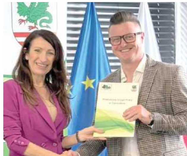
Kolejne środki trafiły do przedsiębiorców z powiatu garwolińskiego na aktywizację osób bezrobotnych

Łączna kwota refundacji wynosi 439 970 zł