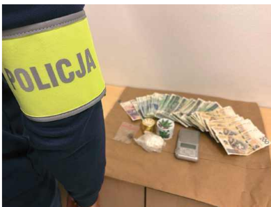
W mieszkaniu jednego z podejrzanych policjanci znaleźli narkotyki i gotówkę

Funkcjonariusze od razu podjęli czynności, by ustalić sprawców i ich zatrzymać. Praca operacyjna i dochodzeniowo-śledcza doprowadziła do zatrzymania w listopadzie 2024 r. dwóch mężczyzn