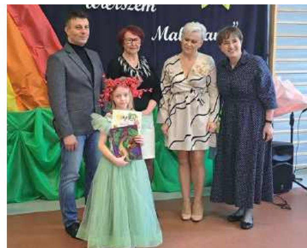
Dzieci zaprezentowały piękne interpretacje wierszy o tematyce wiosennej, wykazując się talentem pamięciowym, opanowaniem tekstu i sceniczną odwagą