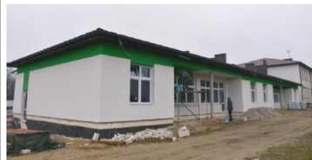
Trwają prace wykończeniowe pierwszego publicznego żłobka w Borowiu, który pomieści 40 dzieci w wieku od 1 do 3 lat

- Obecnie trwają prace wykończeniowe - mówi wójt gminy Borowie, Marta Serzysko i dodaje, że jeżeli wszystko pójdzie zgodnie z planem, żłobek zacznie działać już we wrześniu br.