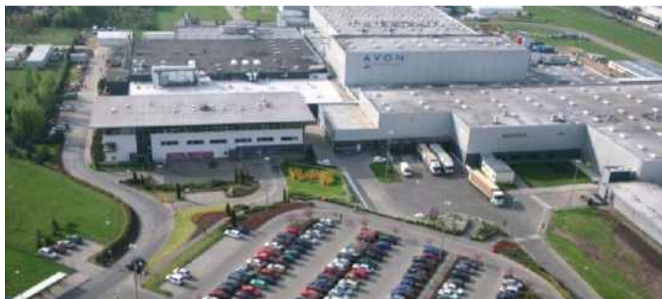
W Garwolinie działa największa i najbardziej zaawansowana technologicznie fabryka firmy Avon na całym świecie