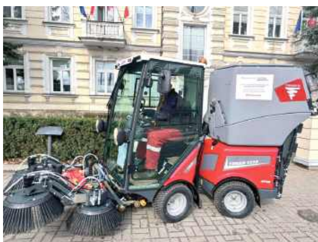
Nowa zamiatarka już niedługo wyjedzie na ulice Garwolina

- W trakcie opróżniania kosza na zmiotki z nieustalonych przyczyn doszło do zapalenia się zamiatarki. Uległa ona całkowitemu spaleni. Pracownik zauważył płomień, któ-