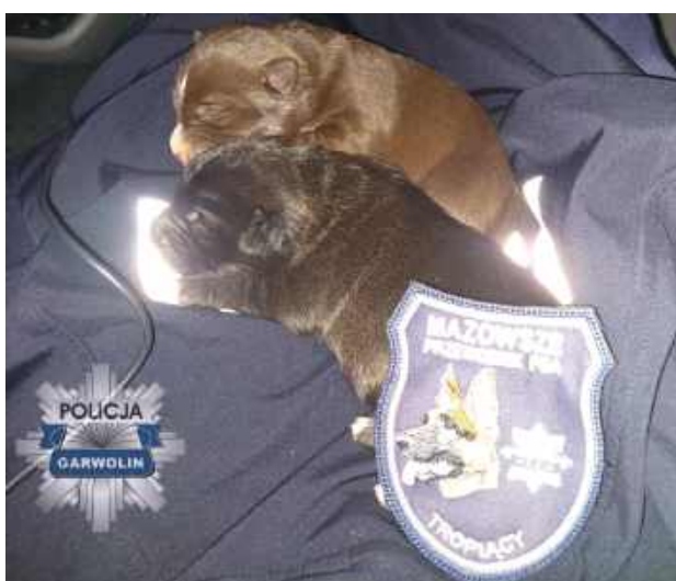
Widok bezbronnych szceniaków narażonych na chłód i niebezpieczeństwo był poruszający

W składzie interweniującego patrolu był policyjny przewodnik psa służbowego. Razem z kolegą zaopiekował się zwierzętami. Szczeniaki zostały przeniesione do radiowozu, ogrzane i otoczone troską, zanim w porozumieniu z pracownikami Urzędu Gminy przekazano je pod opiekę fundacji zajmującej się pomocą bezdomnym zwierzętom.