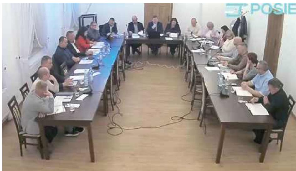
Pani wójt zdała radnym sprawozdanie

Gmina Żelechów podpisała niedawno umowę z Mazowieckim Urzędem Wojewódzkim na realizację zadania „żłobek w Żelechowie” w ramach programu rozwoju instytucji opieki nad dzieckiem w wieku do 3 lat „Aktywny maluch”. Kwota przyznanej dotacji wynosi ok. 3,4 mln zł. W ramach zadania powstanie 48 miejsc opieki nad dziećmi w wieku do 3 lat. Pod koniec lutego gmina złożyła wniosek o przyznanie pomocy z budżetu województwa mazowieckiego w ramach Mazowieckiego Wsparcia