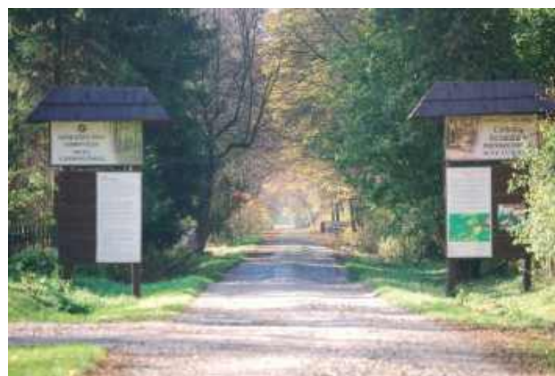
Ścieżka Przyrodniczo - Kulturowa znajduje się w Hucie Garwolińskiej w odległości ok. 7 km od Garwolina, przy szosie prowadzącej z Garwolina do Bud Uśniackich