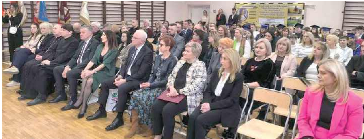
27 marca w ZS nr 2 w Łaskarzewie odbył się X Diecezjalny Zjazd Szkół im. Jana Pawła II

27 marca w ZS nr 2 w Łaskarzewie odbył się X Diecezjalny Zjazd Szkół im. Jana Pawła II wpisujący się w jubileusz 700-lecia parafii pw. Krzyża Świętego w Łaskarzewie.