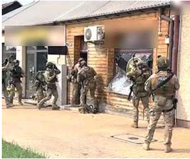
Podczas przeszukań policjanci zabezpieczyli amfetaminę, marihuane, przedmioty służące do porcjowania narkotyków oraz gotówkę

Pozostali zatrzymani to 33-letnia kobieta i 51-latek.