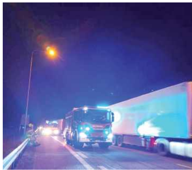
Do wypadku doszło na trasie S17 w Woli Koryckiej (gm. Trojanów)

Do groźnego wypadku z udziałem dwóch samochodów osobowych i ciężarówki doszło 3 kwietnia po godz. 23 na trasie S17 w Woli Koryckiej (gm. Trojanów). Jeden z uczestników zdarzenia trafił do szpitala.