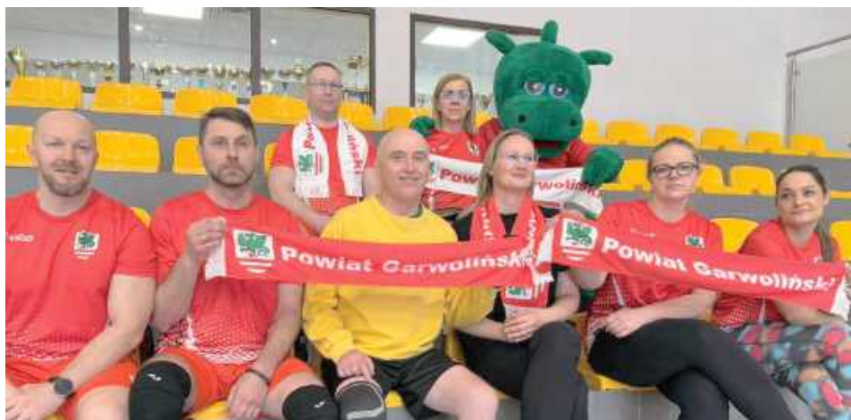
Organizatorem turnieju było Starostwo Powiatowe w Garwolinie, wspólnie z gminą Górzno