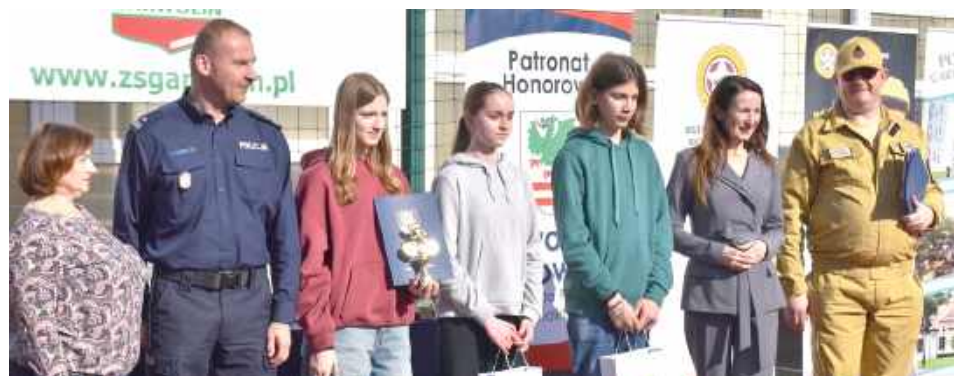
W Zespole Szkół nr 1 im. Bohaterów Westerplatte w Garwolinie odbyły się powiatowe eliminacje Ogólnopolskiego Turnieju Bezpieczeństwa w Ruchu Drogowym dla uczniów szkół podstawowych