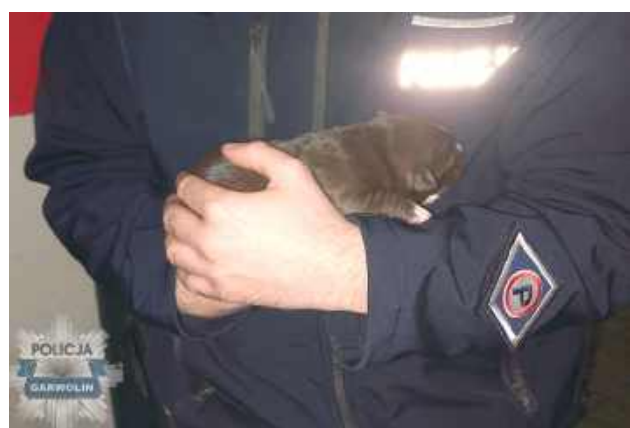
Szczeniaki przekazano pod opiekę fundacji zajmującej się pomocą bezdomnym zwierzętom

Ktoś zostawił je przy drodze w plastikowej torbie. „Zwierzę to nie zabawka, którą można wyrzucić, gdy się znudzi”