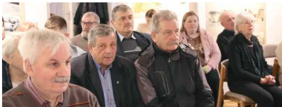
Podczas prelekcji zaprezentowane zostały sylwetki dziesięciu osób, które zostały zamordowane wiosną 1940 r. przez NKWD