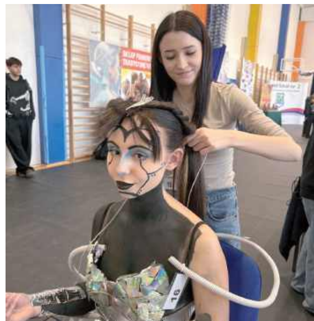
Uczestnicy mieli za zadanie wykonanie fryzury, stylizacji oraz makijażu nawiązujących do tematu przewodniego, czyli „fryzury cyfrowej”