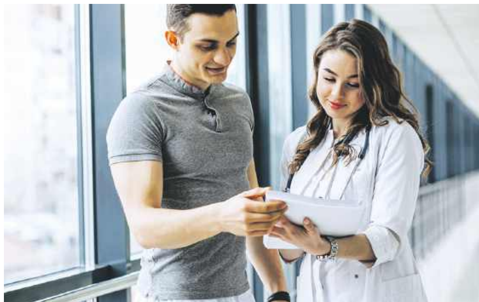
Warto skorzystać z programu profilaktycznego NFZ

Ankieta zdrowotna – wypełniana online przez Internetowe Konto Pacjenta (IKP), aplikację mojeIKP lub w przychodni POZ z pomocą