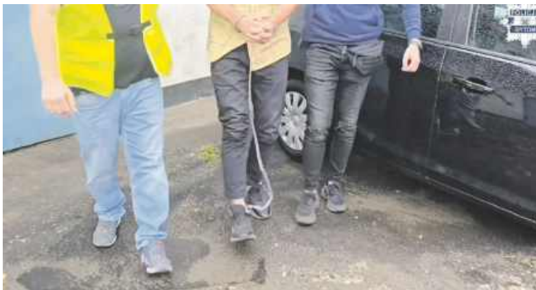
Za znęcanie się nad kobietą bandyta trafi na długo za kratki

Kilka dni temu oficer dyżurny bytomskiej jednostki otrzymał zgłoszenie, że na balkonie jednego z bytomskich mieszkań dochodzi do awantury, podczas której kobieta jest szarpana i bita przez mężczyznę. Pod wskazany adres natychmiast zostali skierowani policjanci, gdzie zastali napastnika oraz ofiarę.