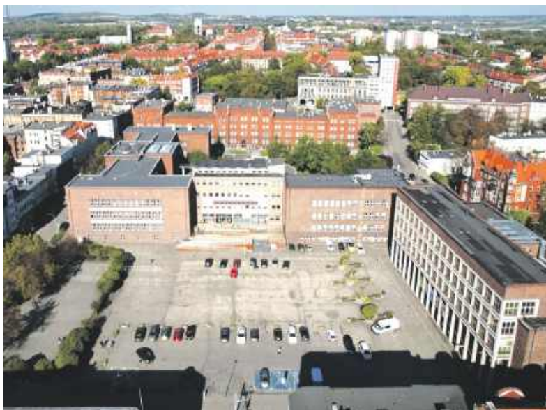
Zbiornik retencyjny mający powstać pod placem Sobieskiego uchroni nas przed potopami

Dość powiedzieć, że ta długa i ważna droga stanowi zlewnię dla około 500 ha Śródmieścia. Spływają tam wody opadowe nie tylko ze ścisłego centrum miasta, ale również z oddalonych obszarów, jak chociażby z ul. Tarnogórskiej, Chrzanowskiego czy Olimpijskiej, a nawet z parku miej-