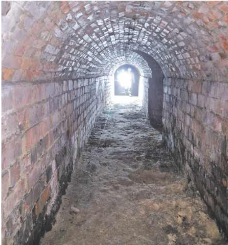
Podziemny schron jest wykonany z cegły

Schron przez wiele lat stał opuszczony. Skąd zatem tyle o nim dziś wiemy? Bo w ostatnich dniach weszli