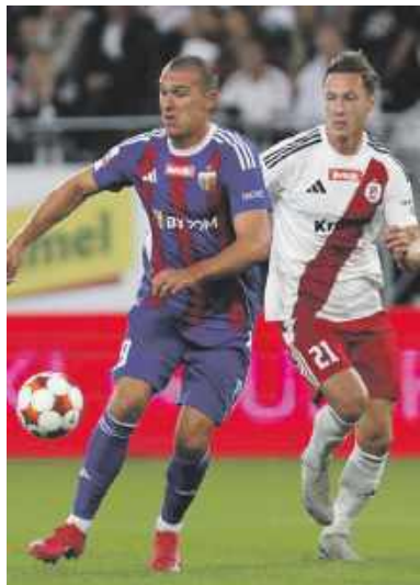
Polonia Bytom nie miała nic do powiedzenia w Łodzi