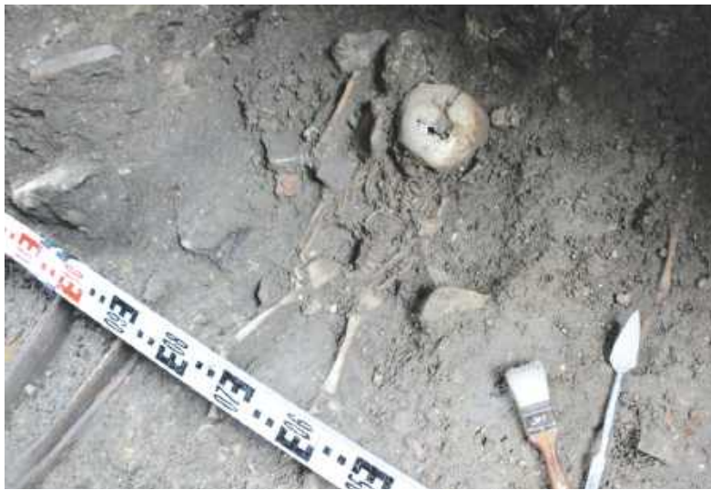
Cztery szkielety pochodzące z czasów średniowiecza znajdowały się na głębokości 2,2 metra

- Odpowiedź poznamy dzięki dokładnym badaniom, jakie zlecili bytomscy archeolodzy. Kościół pw. św. Wojciecha przy pl. Klasztornym to jedna z najbardziej tajemniczych świątyń w Bytomiu. Nie ma bowiem miejsca, w którym archeolodzy z Muzeum Górnośląskiego oraz pracownicy firmy