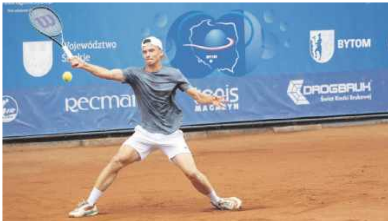
Memoriał Jacka Widawskiego od zawsze przyciąga zdolnych młodych graczy

Uczestnicy turnieju walczyli o prestiżowe zwycięstwo, cenne punkty do rankingu oraz atrakcyjne nagrody.