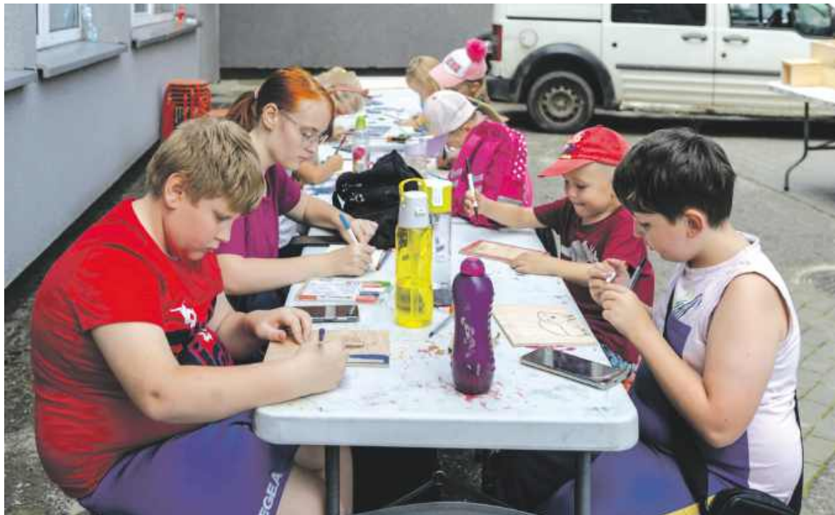
Becekobus to cykl bardzo interesujących, wakacyjnych warsztatów

A co nas czeka? Najpierw Kinobusik, czyli cykl warsztatów kreatywnych, których uczestnicy połączą zamiłowanie do kina z siłą swojej wyobraźni. Podczas zajęć zostanie poruszonych wiele tematów, do których zainspirują nas takie filmy jak „Wielki Błękit” czy „Akademia Pana Kleksa”. Dodatkową atrakcją będzie gra terenowa. Jej uczestnicy zamienią się w poszukiwaczy piegów. Kolejną przygodą dla uczestników będzie podróż w czasie – dzieci wspólnie odkryją magię retro gier z lat 90., które z pewnością doskonale pamiętają ich rodzice.