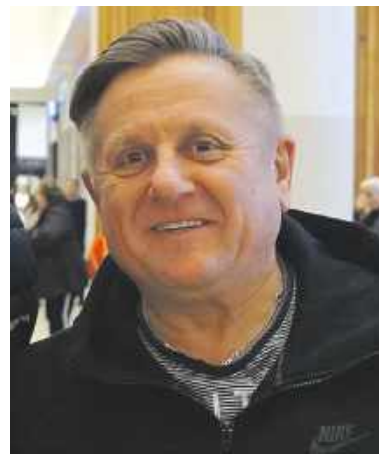
Krzysztof Hanke grół we serialu „Święta wojna” Bercika