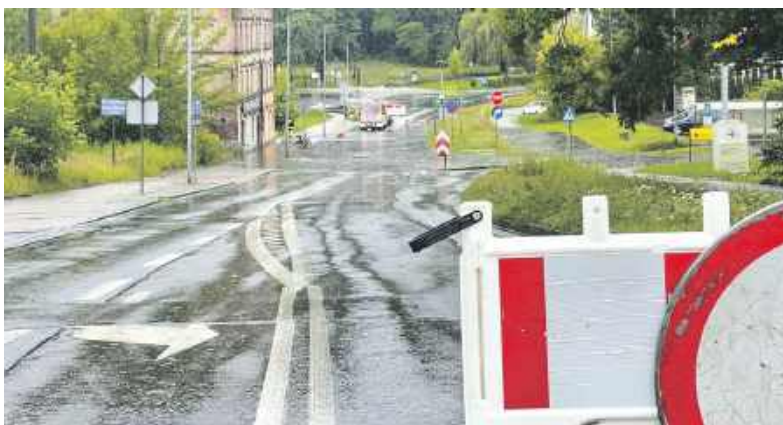
Dwa dni ulewy spowodowały zalanie kilku ulic w mieście