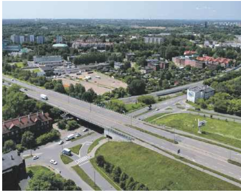
Całkowity koszt remontu wiaduktu to 33 mln zł

Zadanie podzielono na etapy. Najpierw dla bezpieczeństwa wyłączono dwa pasy ruchu, potem zaś Miejski Zarząd Dróg I Mostów przygotował niezbędną dokumentację techniczną. Miasto na jej zrobienie pozyskało pół miliona zło-