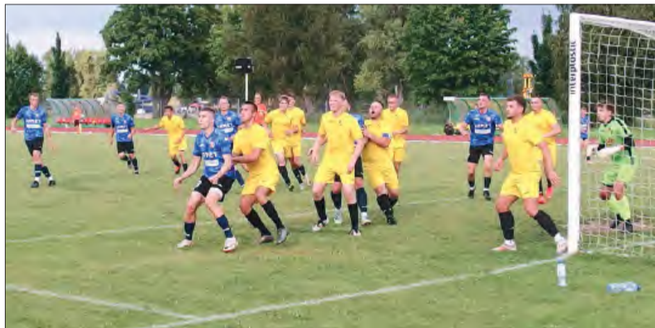
Mazowsze Stężyca porażką 1:2 z Opolaninem Opole Lubelskie, spadkowcem z IV ligi, zakończyło przygodę pucharową