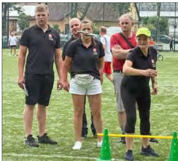
Konkurencja rzutu podkową polega na tym, aby trafić nią jak najbliżej wbitego w ziemię palika, jeszcze lepiej jak podkowa dotknie palika, a już najlepiej, gdy się wokół niego zawinie. W tej konkurencji pierwsze miejsce wywalczyło sołectwo Brzeźce, Piotrowice były drugie, a tuż za podium uplasował się Kłoczew

To sukces przez duże „S”. Dzięki bardzo dobrej postawie naszych sołectw w zawodach wojewódzkich, przedstawiciele naszego powiatu we