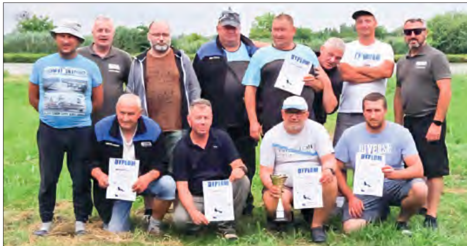
Wędkarze z Koła PZW „Czysta Woda” w Rykach po nocnych zawodach w Markuszowie