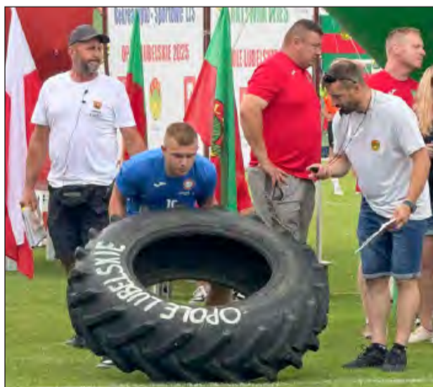
Najsilniejsi zmierzili się z potężną oponą