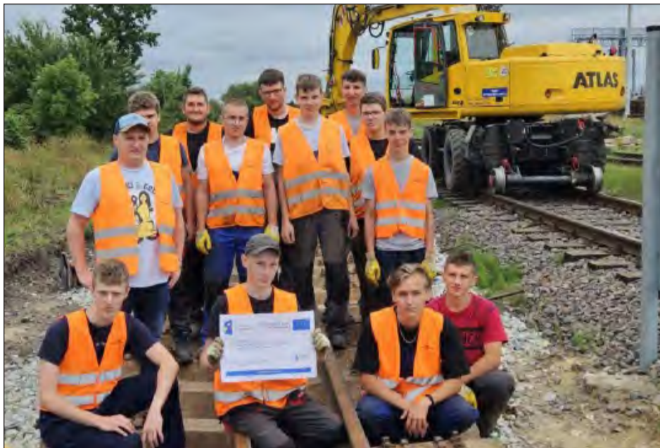
Dwunastu uczniów z kierunku technik budownictwa kolejowego pracuje w PKP Polskie Linie Kolejowe S.A. w Warszawie - Zakład Linii Kolejowych w Lublinie

Największa, dwunastooosobowa grupa z kierunku technik budownictwa