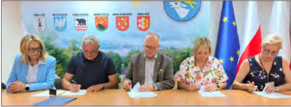
Podpisanie porozumienia zakończyło długi proces negocjacji pomiędzy Urzędem Miejskim w Dęblinie a Starostwem Powiatowym w Rykach

» To już pewne. Po wielomiesięcznych negocjacjach Specjalny Ośrodek Szkolno-Wychowawczy w Dęblinie od stycznia przyszłego roku przejdzie pod zarząd Starostwa Powiatowego w Rykach