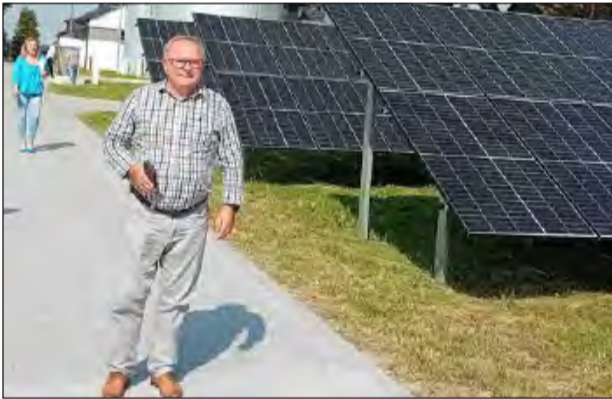
Najdroższą inwestycją zrealizowaną w gminie Ryki w 2024 roku była modernizacja stacji wodociągowych w Moszczance i Niwie Babickiej. Koszt to 5,4 mln zł

Regionalna Izba Obrachunkowa opublikowała listę samorządów województwa lubelskiego pod względem wydanych pieniędzy na inwestycje w 2024 roku. Na początku tej listy znalazły się Ryki, a na końcu Stężyca