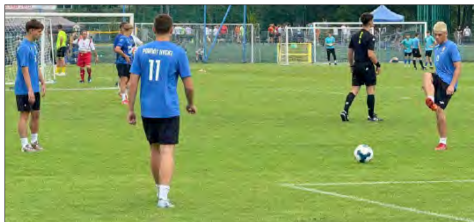
Na turnieju nie mogło zabraknąć piłkarzy z powiatu ryckiego