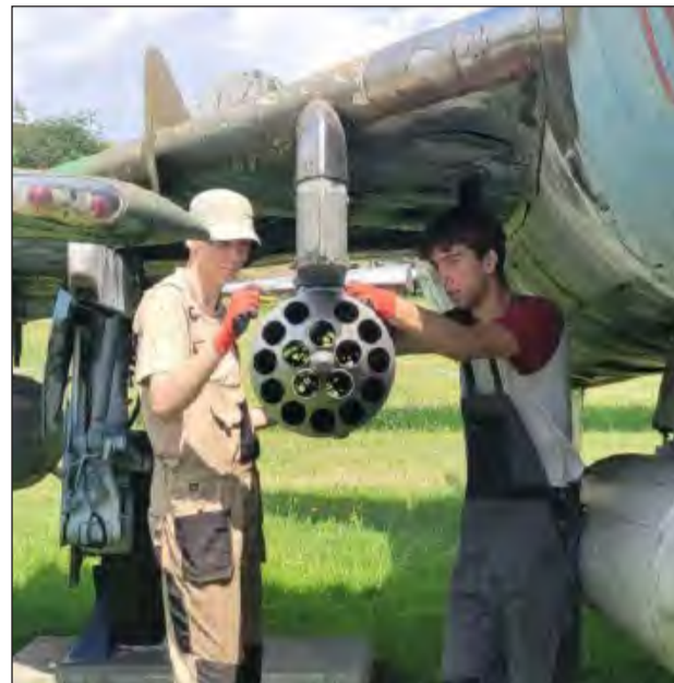
Uczniowie z kierunku technik mechanik lotniczy wykonują prace związane z mechaniką śmigłowców i samolotów

Miesięczny staż to dla uczniów znacznie więcej niż tylko wakacyjne zajęcie. To przede wszystkim szansa, by wiedzę teoretyczną zdobytą w szkole uzupełnić o praktyczne aspekty zawodu. Doświadczenie nabyte w re-