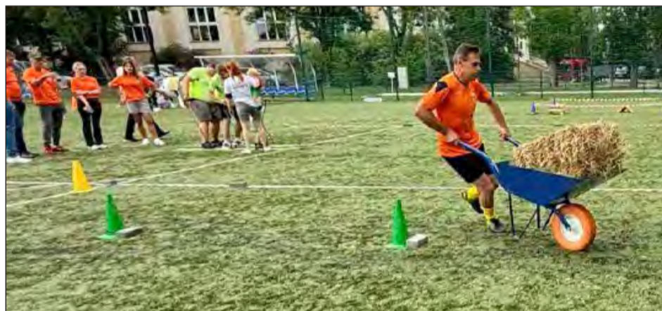
Oprócz typowych konkurencji sportowych nie zabrakło również tych, które nie są jeszcze konkurencjami olimpijskimi, jak slalom z taczka z sromą. W tej konkurencji Brzeziny zajęły drugie miejsce