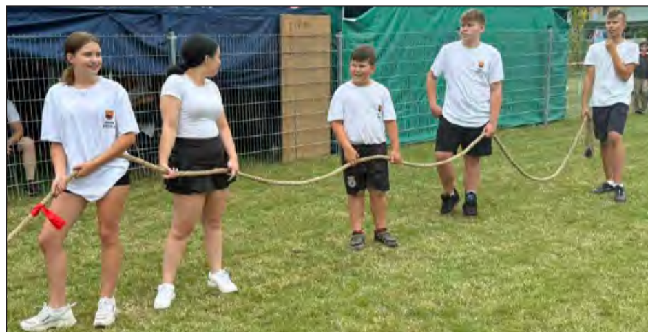
Silni i młodzi z gminy Steżyca próbowali przeciągnąć linę na swoją stronę