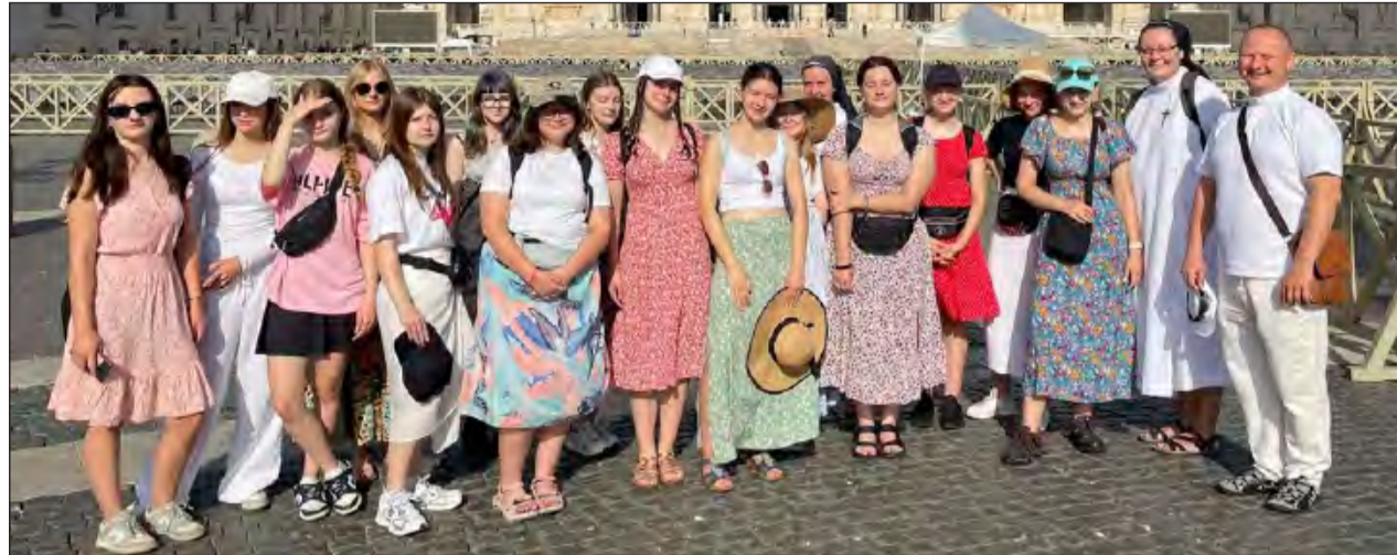
W międzynarodowym wydarzeniu w ramach obchodów Roku Jubileuszowego uczestniczyła 15-osobowa grupa dziewcząt z Ryk