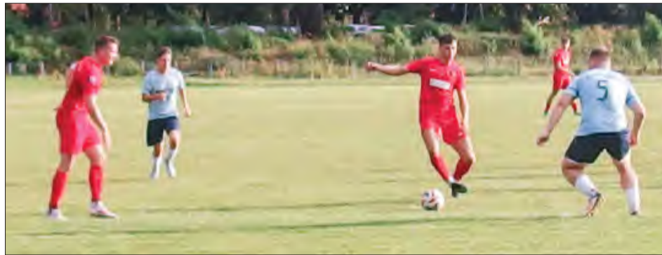
Czarni Dęblin (czerwone stroje) 4:2 pokonali GLKS Głusk i awansowali do II rundy Pucharu Polski