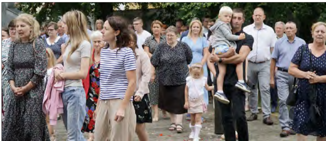
26 lipca Kościół wspominał św. Annę. Dla parafian z Bobrownik to dzień dorocznego odpustu parafialnego. W tym roku wypadł w sobotę, dlatego został przeniesiony na niedzielę, 27 lipca

» Jest patronką małżeństw, matek, wdów, piekarzy i żeglarzy. Samo jej imię oznacza „łaskę”. To także mama Maryi i babcia Jezusa. Święta Anna - jej kult w parafii Bobrowniki trwa nieprzerwanie od 435 lat