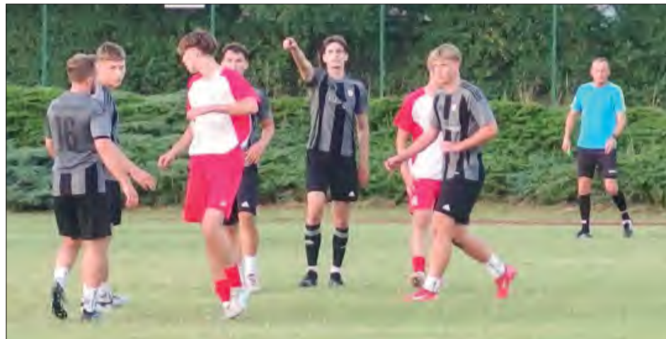
Piłkarze Ruchu Ryki w niedzielę 10 sierpnia z Ładą Biłgoraj rozegrają pierwszy mecz w IV lidze sezonu 2025/26