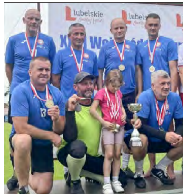
Nasi zawodnicy byli tak dobrzy, że wracali z Opolu Lubelskiego z kilkoma medalami na szyi