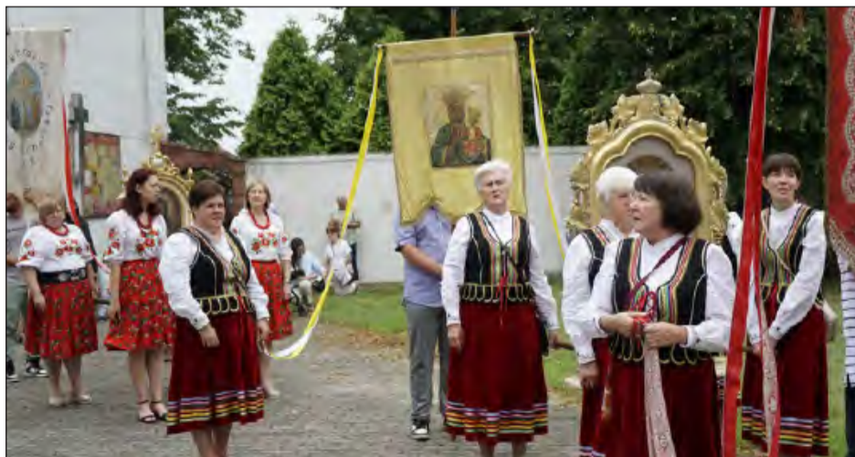
Pięknie i kolorowo wyglądała procesja eucharystyczna. Ubarwiły ją panie z KGW w Krasnoglinach i Bobrownikach ubrane w tradycyjne stroje ludowe

Ich majątek był podzielony na trzy części: dla świątyni, dla biednych i na własne potrzeby. W swojej modlitwie Anna zwracała się do Boga: „Panie, Boże wszechmogący, który obdarzyłeś potomstwem wszystkie stworzenia, zwierzęta dzięki i domowe, gady, ryby, ptaki, i wszystko to cieszy się ze