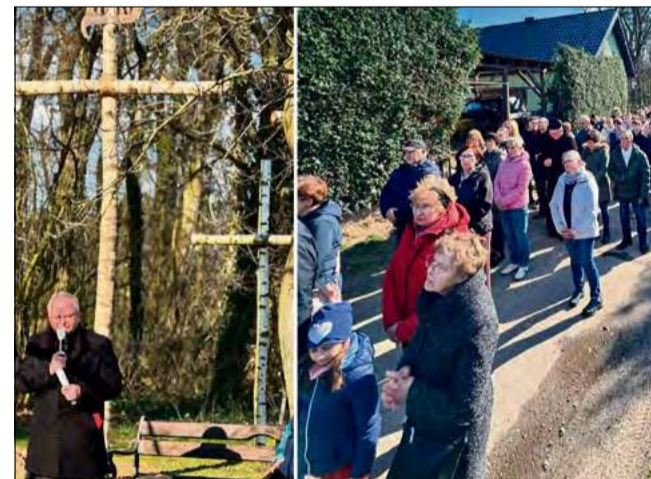
Uczestnicy nabożeństwa nieśli krzyż ulicami miejscowości.

W sobotę 21 marca w Dobrej odbyło się tradycyjne nabożeństwo drogi krzyżowej ulicami wioski. Wydarzenie miało charakter dekanalny - do udziału zaproszono wiernych z kilku parafii.