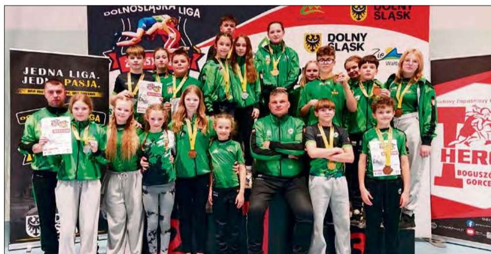
W Boguszowie-Gorcach reprezentanci ZKS-u Gogolin wielokrotnie mieli powody do radości.