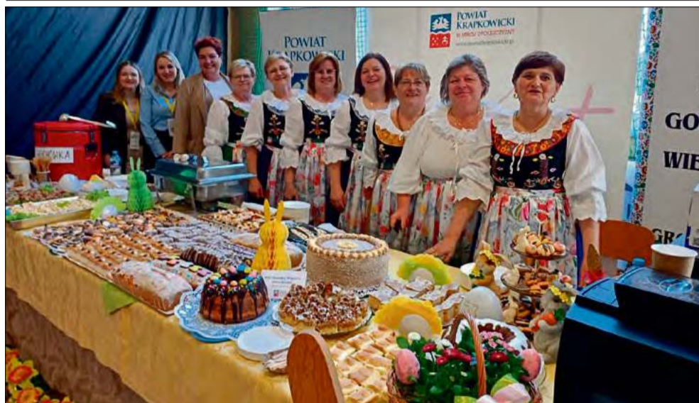
KGW Grocholub udowodniło, że tradycja, kreatywność i kulinarne umiejętności mieszkańców naszego regionu mają moc przyciągania uwagi i budowania pozytywnego wizerunku regionu na szerszą skalę.

Miniony weekend był pełen warsztatów, spotkań i wymiany doświadczeń w powiecie bytowskim. Silna reprezentacja naszego powiatu, zaproszona przez Starostę Bytowskiego Leszka Waszkiewicza, pokazała, że region ma wiele do zaoferowania.