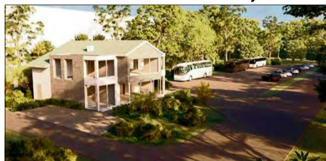
Obiekt znajduje się w atrakcyjnej lokalizacji przy drodze krajowej nr 45, w bezpośrednim sąsiedztwie dużego parkingu.

Planowany najemca to sieć sklepów Żabka, co zapewni okolicznym mieszkańcom i podróżnym wygodny dostęp do codziennych zakupów oraz usług.