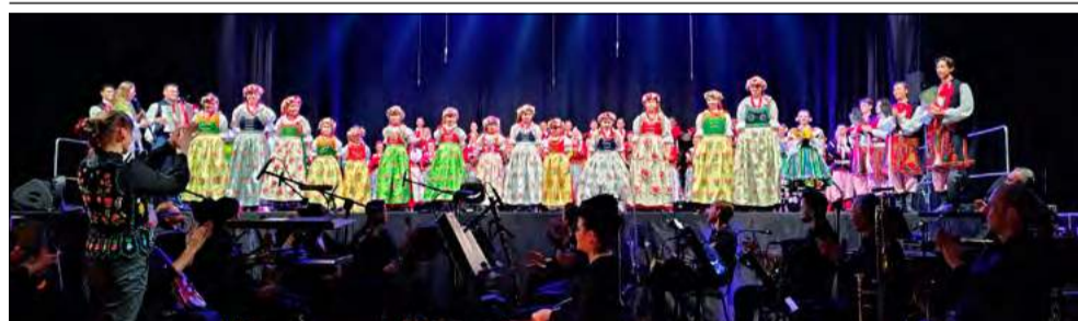
Dzięki pasji, pracy i wsparciu nawet najmłodszy artyści mogą zaznaczyć swoją obecność na scenach wielkich widowisk i czerpać inspirację od najlepszych.

To był występ, który na długo pozostanie w pamięci zarówno małych tancererek, jak i publiczności. W sobotę 21 marca Dziecięcy Zespół Taneczny „Przecinek” z Broźca wziął udział w niespodziewanym pokazie przed ogromną widownią w hali Azoty - a przede wszystkim przed artystami legendarnego Zespołu Pieśni i Tańca „Śląsk” im. Stanisława Hadyny.