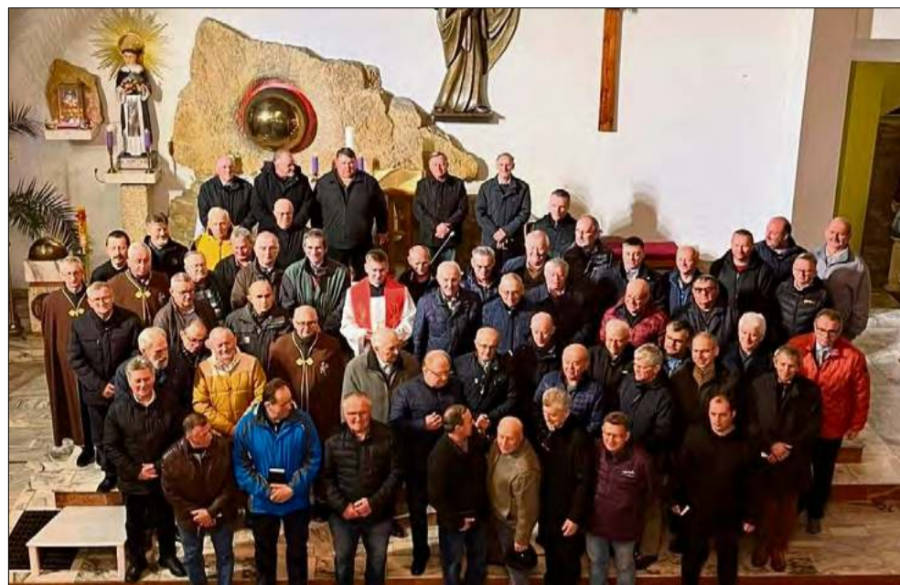
Frekwencja okazała się zaskakująca.

Frekwencja okazała się zaskakująca. W kościele w Górażdżach modliło się kilkudziesięciu mężczyzn, co