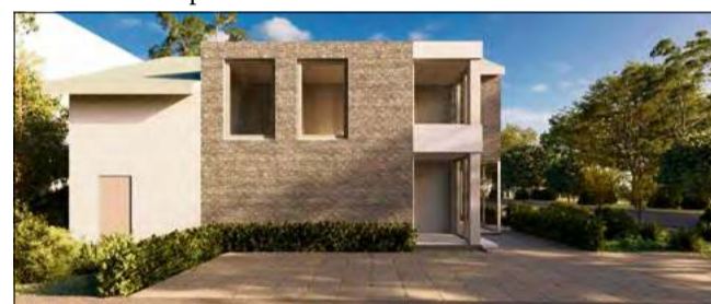
W budynku powstaną nowoczesne powierzchnie biurowe przeznaczone pod wynajem.

Osoby zainteresowane wynajmem powierzchni biurowych mogą już teraz kontaktować się z nowym właścicielem: e-mail: nieruchomosci@msiw.eu