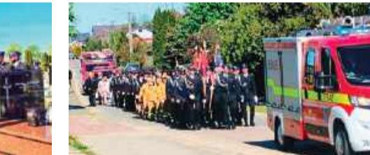
Uroczysty przemarsz spod kościoła pw. Ducha Świętego w Węgrzynowie

Po zakończeniu mszy uczestnicy, wśród których znaleźli się mieszkańcy, strażacy w galowych mundurach oraz zaproszeni goście, przemaszerali na pobliski cmentarz parafialny. Tam odbyła się główna część uroczystości – poświęcenie nowo powstałego pomnika