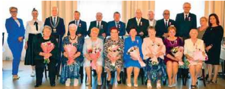
Pary małżeńskie z półwiekowym stażem