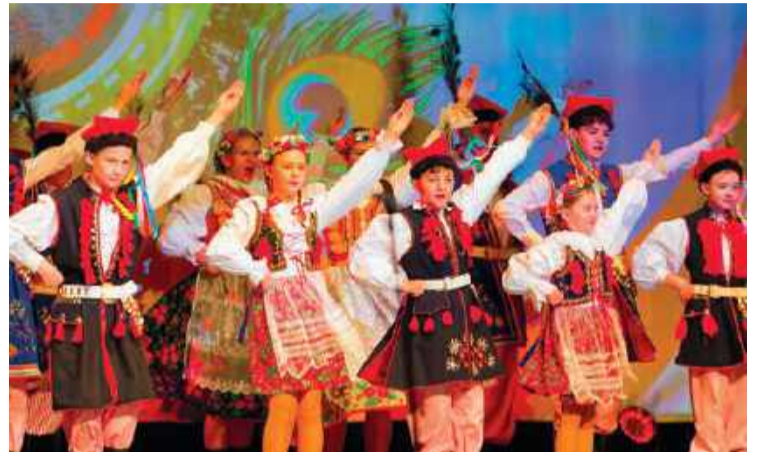
Było też bardzo kolorowo

Do Ciechanowa przyjechali dawni tancerze – z różnych stron Polski, a nawet z zagranicy. Dlaczego?