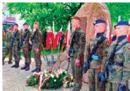
Obchody 3 Maja odbyły się na Placu Kościuszki

przypominał, jak ważną datą w historii Polski jest uchwalenie - przed 234 laty - Konstytucji 3 Maja.