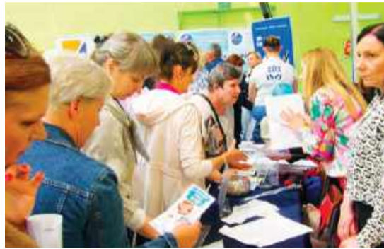
Targi były okazją do zapoznania się z ofertami pracy i skorzystania z konsultacji

W marcu br. stopa bezrobocia w powiecie mławskim wynosiła 5,4 proc. i od kilku lat utrzymuje się na podobnym poziomie, czyli niskim. Potrzebni są ludzie do pracy zwłaszcza na stanowiskach budowlanych, produkcyjnych, usługowych.