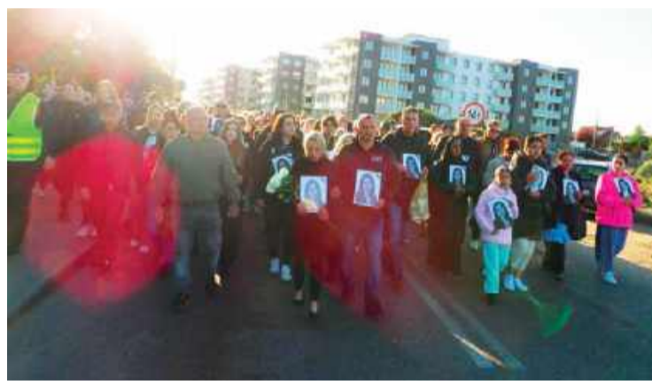
„Marsz pokojowy” w Mławie

córki widział „liczne przypalenia”, co sugeruje, że była maltretowana. Ojciec miał też wyznać dziennikarce, że szukał córki w tych zaroślach przy torach kolejowych, był obok miejsca, w którym niebawem znaleziono ciało. Wtedy „coś go odepchnęło” od tego punktu. Ojciec ma się wypowiedzieć dla mediów po pogrzebie i zapoznaniu się z wynikami sekcji zwłok.