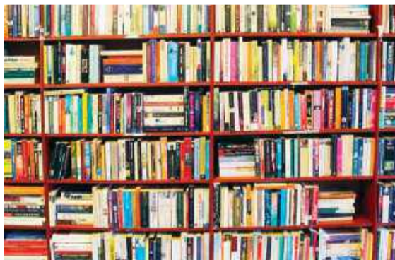
Im więcej książek - tym tylko lepiej

w korytarzach Cmentarza Zapomnianych Książek”.