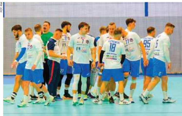
Jurand zagra we własnej hali 17 maja z Nielbą Wągrowiec

Ciechanowianie wrócą na boisko 17 maja. Zagrają wtedy u siebie z Nielbą Wągrowiec.