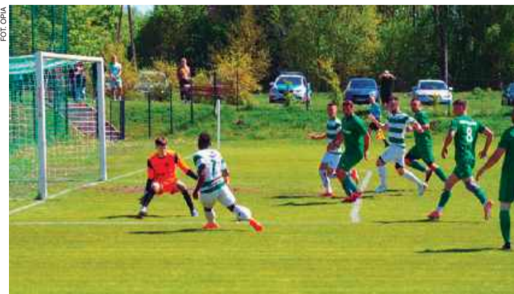
Opia Opinogóra, po wygranej z Wkrą Radzanów, wciąż ma szanse na awans

Dzień później, 1 maja, Opia Opinogóra podejmowała Wkrę Radzanów.