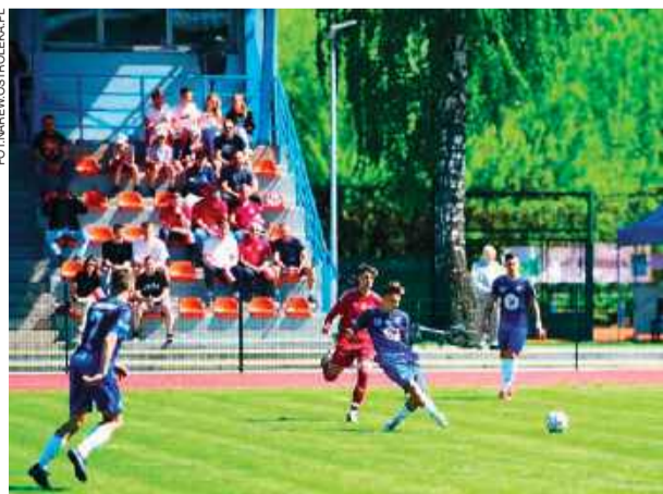
Pułtuszczenie efektywnie rozbili Narew na swoim boisku

20. kolejka (8-11 maja): Wymakracz - Wieczfnianka, Iskra - Gumino, Łyse - Orzeł, Ciekosyn - Bartnik, Pokrzywnica - Narew II, Pełta - Krasnosielc, Sochocin - Mławianka II