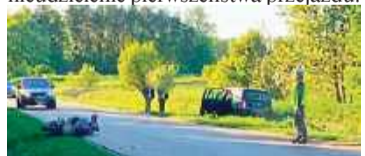
Przyczyną wypadku było nieustąpienie samochodowi na drodze z pierwszeństwem przejazdu

Tego dnia doszło do groźnego wypadku z udziałem motocyklisty. Najprawdopodobniej przyczyną zdarzenia było nieudzielenie pierwszeństwa przejazdu.