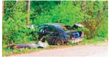
50-latek nie dostosował prędkości do warunków panujących na drodze i wpadł do lasu

Zdarzenie miało miejsce we wczesnych godzinach porannych, około 6.00, nieopodal miejscowości Podborze.