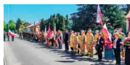
Przedstawiciele służb mundurowych i władz lokalnych, harcerze i mieszkańcy – wszyscy byli obecni.

dów uczestnicy spotkali się na wspólnym poczęstunku przy budynku przedszkola w Krasnosielcu. Uroczystościom towarzyszyły również Zawody Strzeleckie dla młodzieży szkolnej, które odbyły się na strzelnicy w Drażdzewie Nowym. Wydarzenie to zorganizowano przy współpracy Gminy Krasnosielec oraz Klubu Strzelectwa Sportowego „Obrońca” z Troszyna. PB