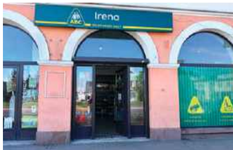
Całodobowy sklep Irena przy ulicy Pułtuskiej w Ciechanowie

To koniec pewnej epoki. Od lat mieszkańcy budynku wielorodzinnego przy ulicy Pułtuskiej 12 apelowali, że wieczorami i nocą pod całodobowym sklepem ma miejsce pijaństwo, dochodzi do awantur, zakłócana jest cisza nocna.