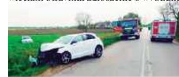
Kierująca renault straciła panowanie nad autem na łuku drogi

Niedługo przed długim weekendem, dyżurny komendy w Makowie Mazowieckim otrzymał zgłoszenie o wypadku