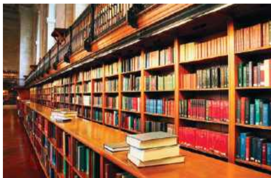
Biblioteka - ulubione miejsce książkomaniaków

„Niewiele rzeczy ma na człowieka tak wielki wpływ, jak pierwsza książka, która od razu trafia do jego serca (...) Dla mnie tymi zaczarowanymi stronami zawsze będą te, które znalazłem