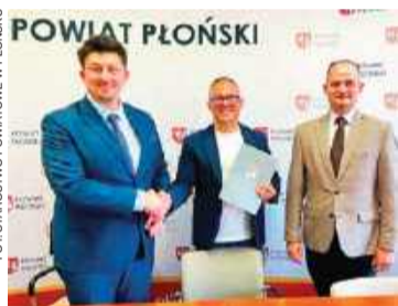
W najbliższych tygodniach ma powstać dokumentacja dwóch powiatowych inwestycji

Obydwa zadania mają być zrealizowane do połowy przyszłego roku. KO