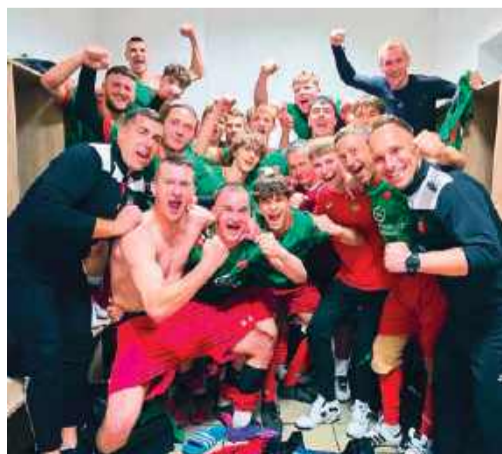
Radość w szatni piłkarzy Wkry Żuromin