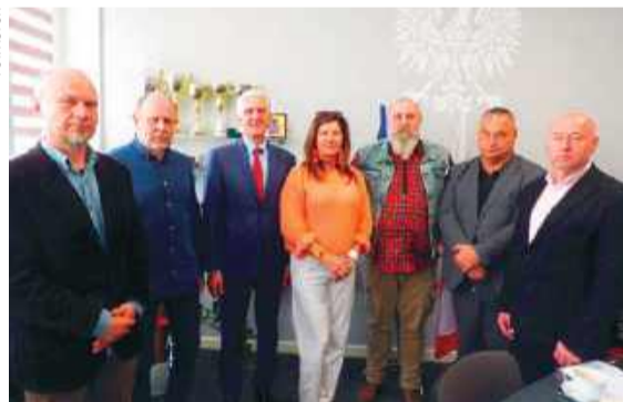
Członkowie Społecznego Komitetu

Dodajmy, że corocznie w Mławie odbywa się Bieg im. Ojca Bernarda Kryszkiewicza, w którym startuje każdorazowo kilkaset dzieci i młodzieży. (kj)