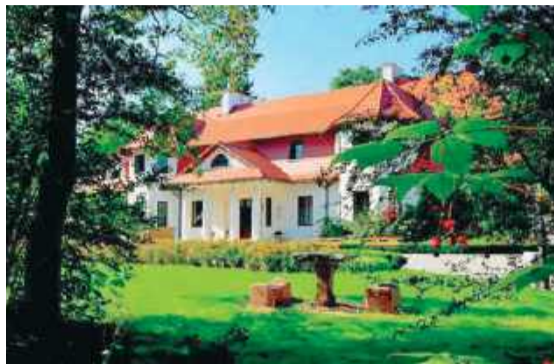
Wybudowany między XVII i XVIII wiekiem dworek, służył rodzinie Krasieńskich do końca XIX w.