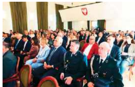
Beneficjenci programu „Mazowsze dla równomiernego rozwoju”

Władze regionu pomogą także w realizacji inicjatyw młodzieżowych rad. Do regionu ciechanowskiego trafi 220 tys. zł na zadania związane z powoływaniem nowych i wzmacnianiem dzia-