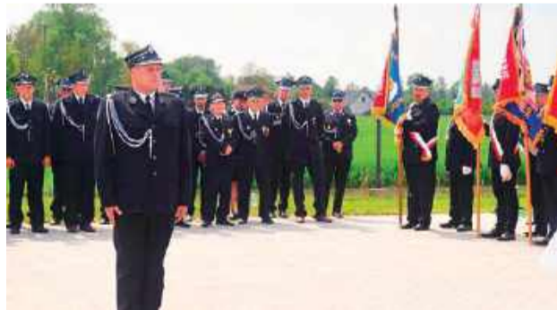
W sobotę, 3 maja jednostka OSP Sosenkowo świętowała 35-lecie istnienia a także oddanie do użytku nowego budynku swojej siedziby

Sobotnie obchody w Sosenkowej (3 maja) poprzedziła msza święta w kościele pw. św. Zygmunta w Zukowie, po której nastąpił przemarsz pododdziałów i gości na plac przy nowo wybudowanej świetlicy - strażnicy.