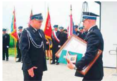
Jednostka OSP Sosenkowo została odznaczona pamiątkowym medalem Pro Masovia

W Sosenkowej powstała świetlica - strażnica o powierzchni około 174 mkw., ogrzewana pompą ciepła. Inwestycja kosztowała blisko 1,7 mln zł.