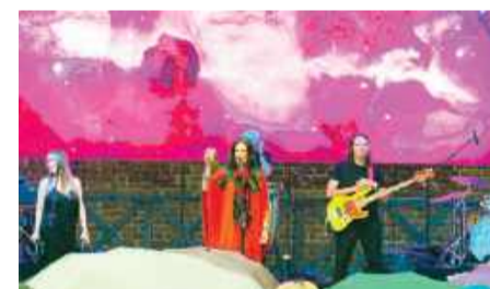
Kayah wystąpił z okazji Dnia Flagi RP Ciechanowianie bawili się mimo deszczu