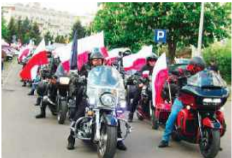
Mławscy motocykliści na czele orszaku