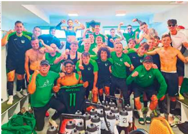
Piłkarze Makowianki po zwycięstwie nad Talentem Warszawa

28. kolejka (7 maja): Troszyn - Piaseczno, Wesoła - Ursus, Mazovia