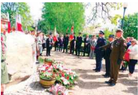
Wieniec składa delegacja służb mundurowych

poglądy polityczne, to jednak w sprawach zasadniczych powinniśmy zachowywać jedność i zgodę. Innymi słowy, zawsze mamy mieć na względzie dobro ojczyzny, i tej „wielkiej”, czyli wspólnoty narodowej, i tej „małej”, czyli wspólnoty terytorialnej (samorządowej). Na zakończenie delegacje złożyły kwiaty pod głazem z tablicą pamiątkową. (kj)