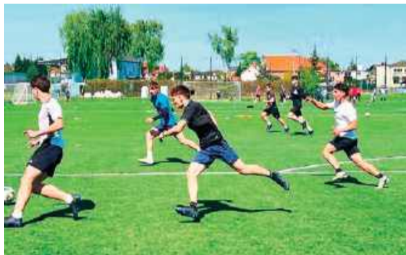
Turniej Dzikich Drużyn

- Wszystkie turnieje zgromadziły licznych miłośników poszczególnych dyscyplin, którym towarzyszyły ogromne