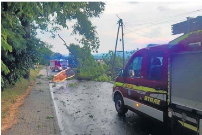
Zerwane dachy, powalone drzewa, nieprzejezdne drogi. To efekt nocnej nawałnicy

Z czasem ruszyła ich lawina. Strażaków wzywano do usuwania skutków nawałnicy, która przeszła przez okolice. Burze i towarzyszące im ulewy w wielu miejscach pozostawiły trwałe ślady.