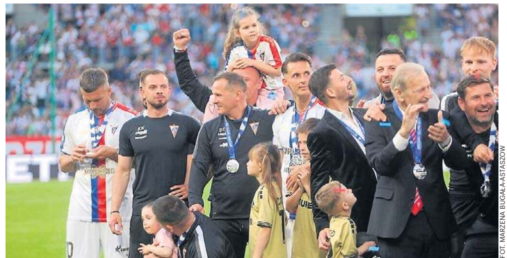
Górnik Zabrze rozbił bank - z ligi dostanie blisko 30 mln, za Puchar Polski kolejne pięć

Model podziału środków jest standardowy. 50 procent to kwota stała, dzielona równo między wszystkie 18 klubów. 33,5 procent to premia za wynik sportowy. Składają się na to 14,5 procent za miejsce w tabeli, 14 przeznaczonych dla pucharowiczów oraz 1 procent solidarnościowy dla spadkowiczów. 14 procent to ranking historyczny uwzględniający 5 ostatnich sezonów, a 2,5 procent znajduje się w Pro Junior Systemie (Młodzieżowiec 2.0).