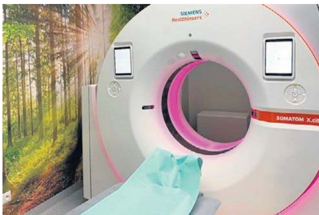
Oficjalna inauguracja nowego tomografu

Jednym z elementów realizowanego projektu jest zakup tomografu komputerowego SOMATOM X.cite firmy Siemens Healthineers o wartości ponad 6