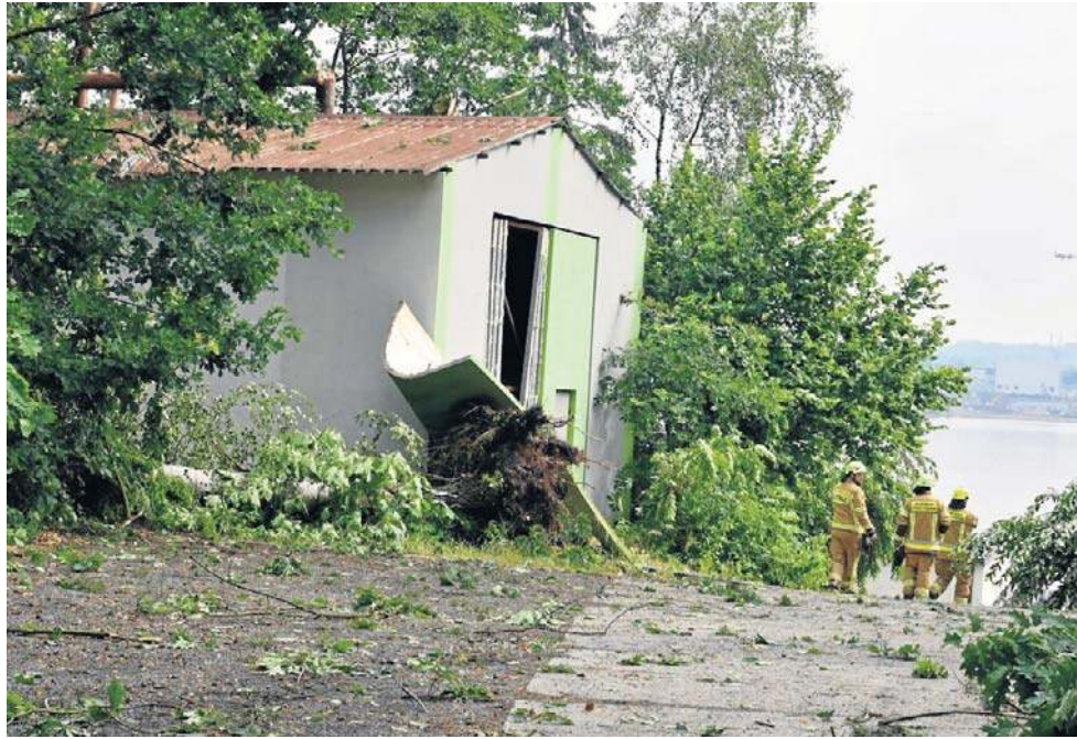
Spore szkody kataklizm wyrządził na terenie Stacji Wodnej 6HDŻ w Rybniku

Pierwsza rzecz, to niedziałająca sygnalizacja świetlna. Napotkani po drodze o godz. 8:30 pracownicy Tauronu mówili, że nie działa jeszcze... 250 stacji zasilania. Część mieszkańców regionu wciąż nie miała prądu. Służby szukały zerwanych przewodów energetycznych. Penetrowały za-