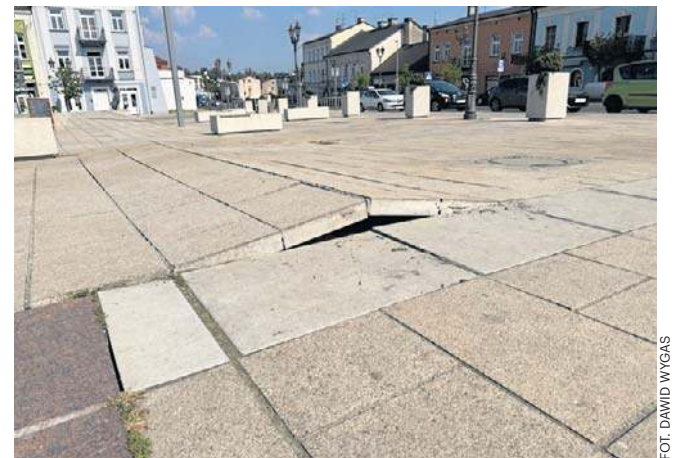
Uszkodzenia prawdopodobnie powstały na skutek fali upałów panujących w całym kraju

Stary Rynek został oddany do użytku 31 marca 2021 roku po trwającej dwa lata przebudowie. Cała inwestycja kosztowała 27,3 mln zł. Miasto pozyskało na ten cel ponad 16 mln zł dofinansowania z Regionalnego Programu Operacyjnego Województwa Śląskiego na lata 2014-2020 oraz blisko 1,9 mln zł z budżetu państwa. Wkład własny samorządu wyniósł około 9,4 mln zł.