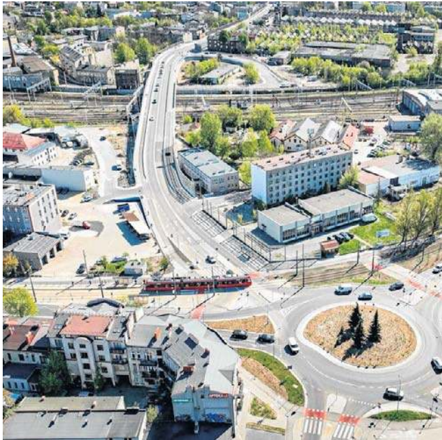
Z miejskiego krajobrazu Częstochowy na trzy tygodnie znikają tramwaje linii 1, 2 i 3

Zawieszenie ruchu tramwajowego ma umożliwić wykonanie prac serwisowych na odcinku, który nie był objęty modernizacją w ramach inwestycji z lat 2019-2021. Chodzi o fragment infrastruktury zaczynający się w pobliżu zakończonej niedawno inwestycji przedłużenia ulicy 1 Maja do Krakowskiej z nowym wiaduktem nad torami kolejowymi, aż do estakady na Rakowie. - Odcinek ten został wyremontowany 16 lat temu i obec-