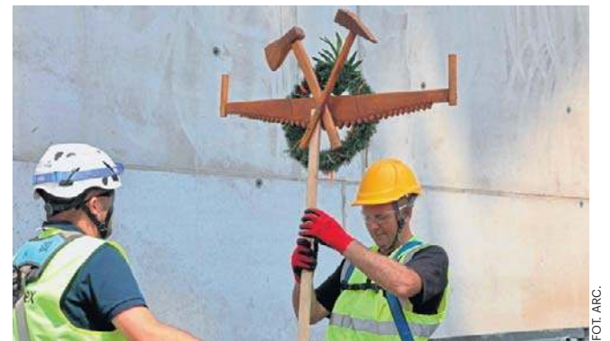
Wykonawca zapowiada, iż wszystkie prace zakończy się zgodnie z harmonogramem, czyli na początku 2027 r.

Koszt budowy Centrum Himalaizmu szacowany jest na 47 mln zł. Miasto Katowice pozyskało na ten cel 27,2 mln zł dofinansowania z programu Fundusze Europejskie dla Śląskiego 2021-2027.