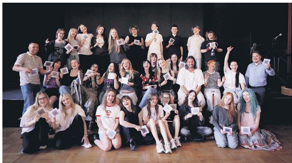
JIMEK z młodzieżą ze Stowarzyszenia Inicjatyw Społecznych „Sztama” na próbie artystycznej w Kętrzynie

Strategia ORLEN 2035 zakłada rozwój niskoemisyjnych w rozumieniu Taksonomii UE źródeł energii. Kluczowe projekty z tego obszaru obejmują m.in. zwiększenie krajowego wydobycia gazu, budowę czterech morskich farm wiatrowych na Bałtyku, rozwój wielkoskalowych magazynów energii oraz uruchomienie co najmniej dwóch małych elektrowni jądrowych. Do 2035 roku koncern planuje przeznaczyć na realizację celów strategicznych 350–380 mld zł. Więcej o strategii ORLEN do 2035 roku dowiesz się na stronie orlen.pl.