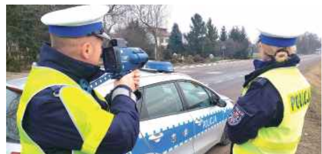
Policja apeluje o rozwagę i przestrzeganie ograniczeń prędkości, przypominając, że nadmierna prędkość nadal należy do głównych przyczyn wypadków drogowych

Od 3 marca obowiązują nowe przepisy, które pozwalają policjantom zatrzymywać prawo jazdy na trzy miesiące za przekroczenie dopuszczalnej prędkości o ponad 50 km/h nie tylko w obszarze zabudowanym, lecz także poza nim, na drogach jednojezdniowych dwukierunkowych. W ciągu ostatnich dwóch tygodni funkcjonariusze białskiej drogowki zatrzymali uprawnienia dziesięciu kierowcom, z czego trzech straciło je już na podstawie nowych regulacji.