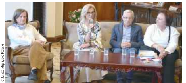
Jednym z najważniejszych punktów uroczystości był panel wspomnienny poświęcony historii międzyrzeckiego sportu

Wydarzenie zgromadziło pasjonatów, byłych i obecnych sportowców oraz wszystkich tych, dla których rozwój fizyczny i rywalizacja fair play na zawsze wpisały się w historię miasta. Jak podkreślali uczestnicy, sport to nie tylko medale i puchary, ale przede wszystkim