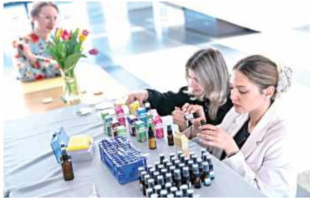
Produkt ma stać się bezpieczną alternatywą dla syntetycznych środków chemicznych, chroniąc dzieci przed potencjalnie chorobotwórczymi drobnoustrojami na placach zabaw

LUBLIN: Oregano, kolendra, tymianek czy goździki - łączy je nie tylko ładny zapach, ale też właściwości antybakteryjne. Studenci KUL pracują nad preparatem przeciw szkodliwym bakteriom, który może poprawić bezpieczeństwo dzieci.