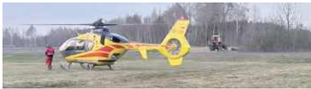
Do zdarzenia doszło na terenie prywatnej działki rolnej. Policjanci ustalili, że 45-latek z gminy Stanin został przygnoił konarem wycinanego przez niego drzewa

- 19 marca po godzinie 16 otrzymaliśmy informację o wypadku podczas wycinki drzewa w Zagoździu. Do zdarzenia doszło na terenie prywatnej działki