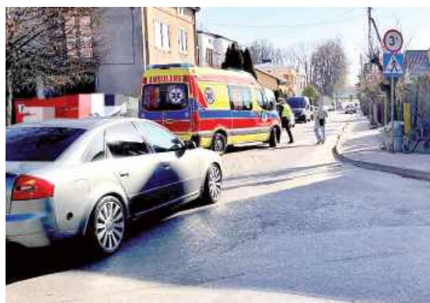
Z ustaleń funkcjonariuszy wynika, że 48-letni kierowca Audi nie ustąpił pierwszeństwa przejazdu rowerzystce, doprowadzając do zderzenia

Zgłoszenie o zdarzeniu wpłynęło do dyżurnego opolskiej komendy po godzinie 8. Na miejsce, na skrzyżowanie przy ul. Partyzanckiej, natychmiast skierowano patrol policji.