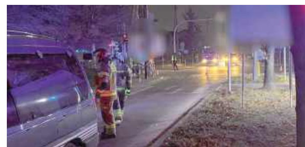
Do tragicznego wypadku doszło 18 grudnia około godz. 15 na skrzyżowaniu Al. Tysiąclecia i ul. Szaniawskiego

Do tragicznego wypadku doszło 18 grudnia około godz. 15 na skrzyżowaniu Al. Tysiąclecia i ul. Szaniawskiego.