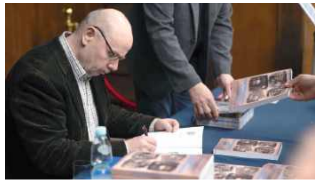
Po spotkaniu można było kupić publikacje z autografem