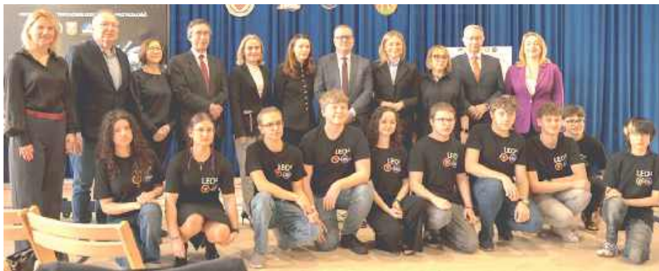
Dane satelitarne wykorzystywane są coraz częściej w projektach badawczych prowadzonych przez szkoły i uczelnie, a rozwój europejskich programów obserwacji Ziemi umożliwia dostęp do dużych zbiorów informacji środowiskowych