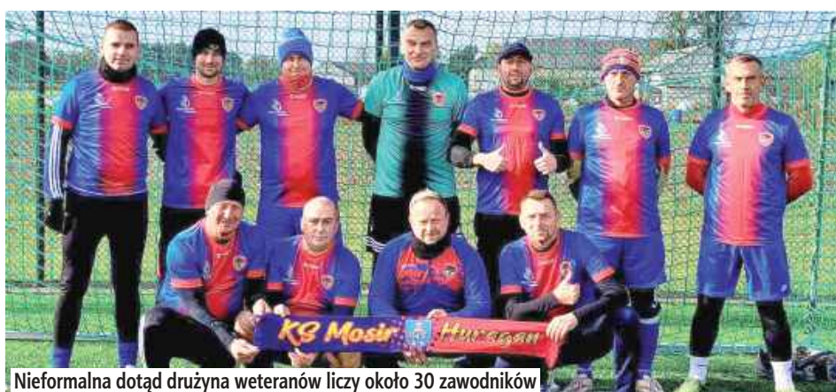
Nieformalna dotąd drużyna weteranów liczy około 30 zawodników

Weterani lokalnych boisk, którzy dotychczas grali nieformalnie, oficjalnie dołączają do rodziny KS MOSiR Huragan. Decyzja zapadła podczas ostatniego walnego zebrania klubu.