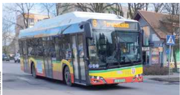
W Białej Podlaskiej dobrze sprawdzają się autobusy elektryczne marki Solaris Urbino 12. Są bardziej punktualne i wygodniejsze dla pasażerów niż pojazdy spalinowe

- Autobusy elektryczne dobrze się sprawdzają teraz, kiedy skończyły ceny paliw. Po olbrzymich podwyżkach diesla dbamy o to,