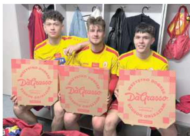
Wielka radość w Łukowie. Pierwsze zwycięstwo Orłąt w tym roku, a piąte w sezonie