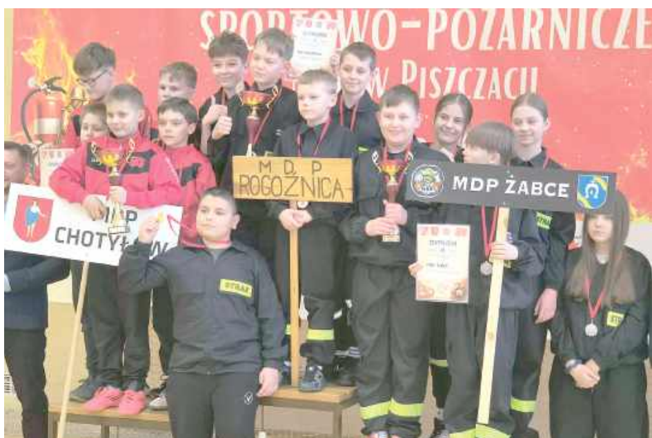
Zawody był zdecydowanie udane dla reprezentantów naszego regionu