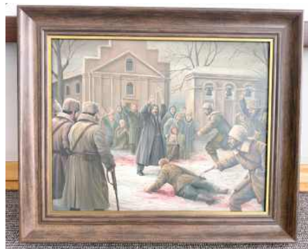
Obraz „Męczeństwo Unitów w Drelowie” wręczony w minionym tygodniu papieżowi Leonowi XIV

- Podczas audiencji w Watykanie uczestnicy pielgrzymki modlili się w intencji mieszkańców powiatu białskiego oraz wszystkich osób zaangażowa-