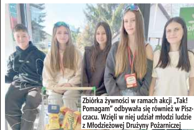
Zbiórka żywności w ramach akcji „Tak! Pomagam” odbywała się również w Piszczacu. Wzięli w niej udział młodzi ludzie z Młodzieżowej Drużyny Pożarniczej