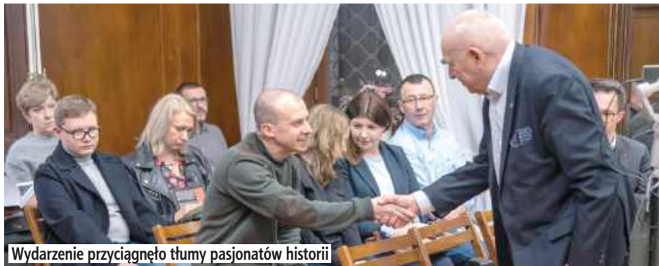
Wydarzenie przyciągnęło tłumy pasjonatów historii

Premiera książek połączona była z prelekcjami autorów, którzy przybliżyli uczestnikom kulisy powstawania swoich publika-