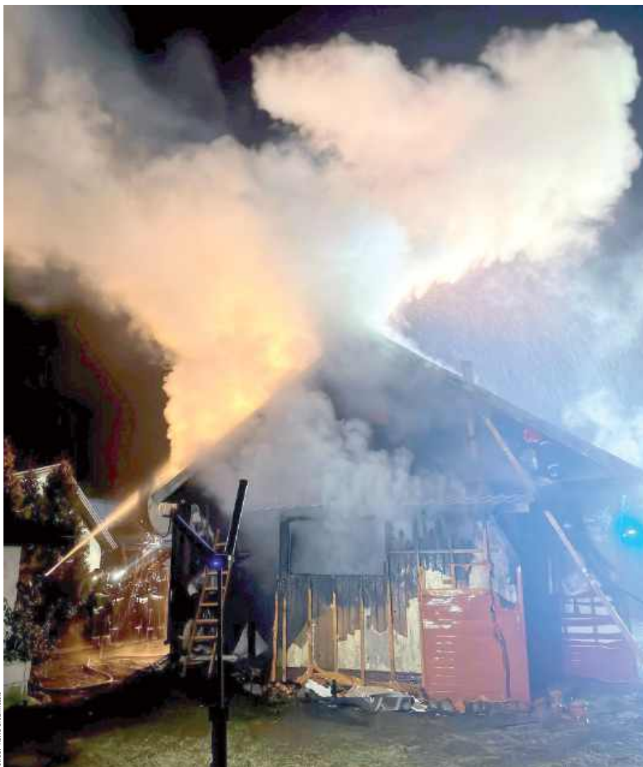
Ogień objął drewniany budynek mieszkalny, powodując bardzo poważne zniszczenia

Ogień objął drewniany budynek mieszkalny, powodując bardzo poważne zniszczenia. Pomimo skali zdarzenia, nie odnotowano osób poszkodowanych. Mieszkanca domu zdołała opuścić budynek jeszcze przed przybyciem służb ratunkowych.