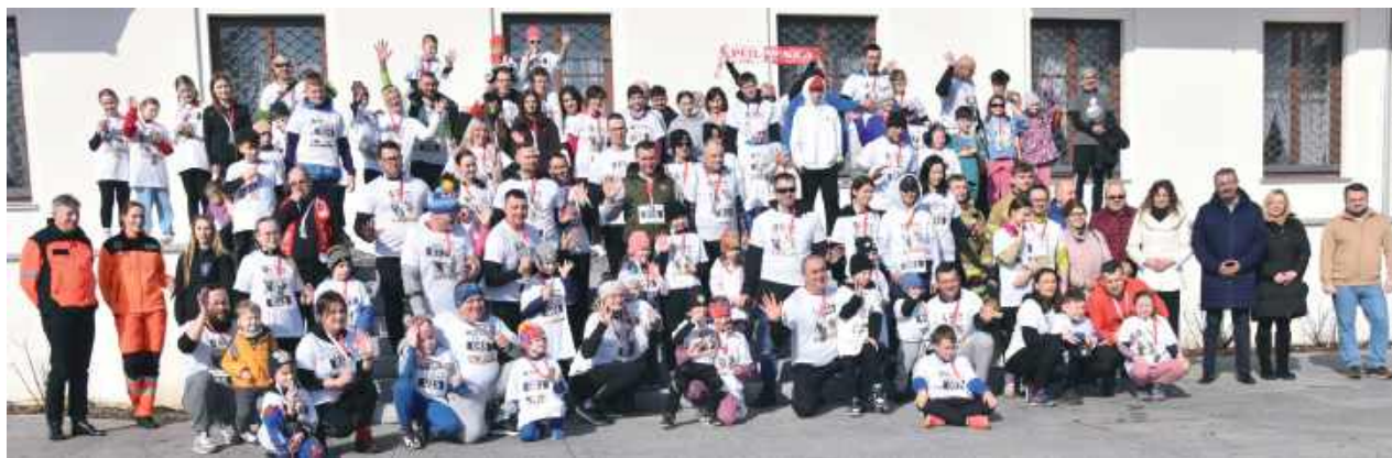
Pobiegło stu uczestników!

Kolejną edycję ogólnopolskiego biegu „Tropem Wilczym. Bieg Pamięci Żołnierzy Wyklętych” zorganizowano 1 marca w Międzyrzeczu Podlaskim. Wydarzenie przyciągnęło mieszkańców miasta i okolic, chcących w aktywny sposób uczcić pamięć bohaterów podziemia niepodległościowego.