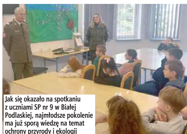
Jak się okazało na spotkaniu z uczniami SP nr 9 w Białej Podlaskiej, najmłodsze pokolenie ma już sporą wiedzę na temat ochrony przyrody i ekologii

Spotkania zorganizowano u progu wiosny, aby uczulić młodych ludzi na sprawy związane z ochroną przy-