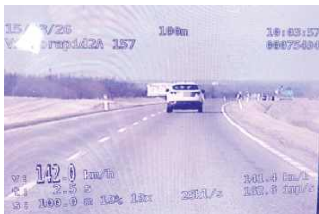
W miejscu, gdzie obowiązuje ograniczenie do 90 km/h, licznik policyjnego miernika wskazał 142 km/h

Kierowca przekroczył dozwoloną prędkość o 52 km/h. Za swoją brawurę zapłacił 1500 zł mandatu, otrzymał punkty karne i stracił prawo jazdy na trzy miesiące.