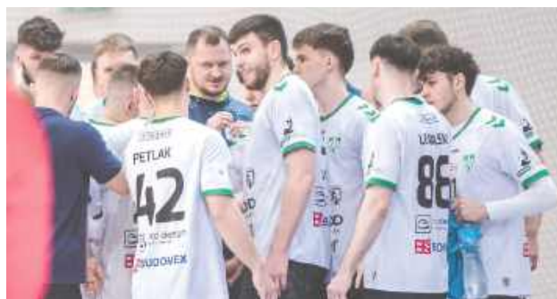
Szczypiorniści AZS-u chcą pójść za ciosem. W piątek podejmą Nielbę Wągrowiec

Podopieczni Łukasza Kandory będą chcieli kontynuować dobrą passę z rewanżów. W ostatnim spotkaniu wygrali 32:30 z wyżej notowanym AZS-em AGH Kraków. Już w piątek przeciwnikiem biało-zielonych będzie Nielba. Zespół z Wągrowca w meczu 20. kolejki przegrał 29:40 ze Śląskiem Wrocław.