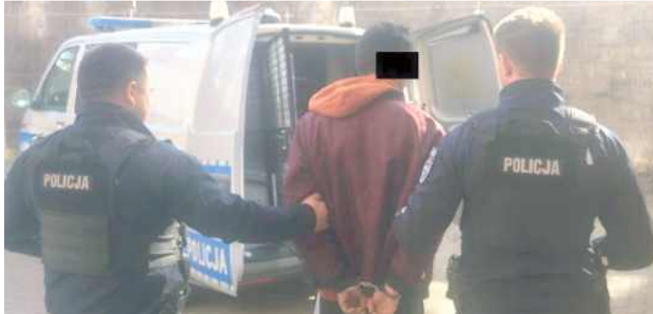
42-latek nie był w stanie wyjaśnić pochodzenia kawy i kapsułek do prania, które miał ze sobą w momencie zatrzymania

Wszystko działo się w ubiegłym tygodniu na terenie Puław. Policjanci z patrolówki zauważyli mężczyznę niosącego kilka paczek kawy i kapsułki do prania, który na ich widok nagle odwrócił wzrok i zaczął iść w przeciwnym kierunku. Funkcjonariusze postanowili go wylegitymować. I mieli przeczucie. Wkrótce okazało się, że zatrzymany przez nich mężczyzna to mieszkaniec gminy Janowiec.