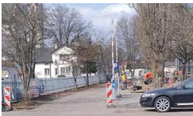
Robota na budowanym parkingu w re-

Niektórzy Bialczanie i przyjezdni zaskoczeni zostali nagłym zamknięciem niewielkiego, prowizorycznego parkingu przy budynku sali widowisko-