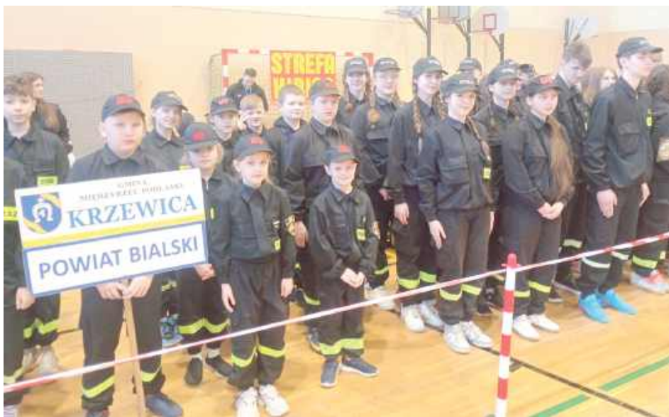
W zawodach wzięły udział drużyny reprezentujące 15 jednostek OSP