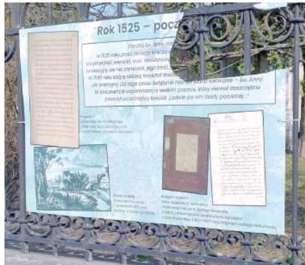
„Złota rączka” sprawdziła swoją skalę głupoty i wyżyła się na tablicy. Zostawiła po sobie pomniczek

Wyjątkowo głupi wandal pozostawił po sobie ślad przy skrzyżowaniu białskich ulic Zamkowej i Warszawskiej. Rozbił część tablicy informującej o początkach miasta.