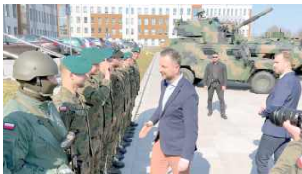
Władysław Kosiniak-Kamysz, wicepremier i minister obrony narodowej, przywitał się i rozmawiał z żołnierzami służącymi w białskim garnizonie

Imponujące, nowe obiekty garnizonu w Białej Podlaskiej podziwiał nie tylko przybyły tam w środę wicepremier Władysław Kosiniak-Kamysz, ale także mogli obejrzeć je widzowie i internauci. Minister obrony narodowej mówił m.in. o budzącym kontrowersje programie SAFE.