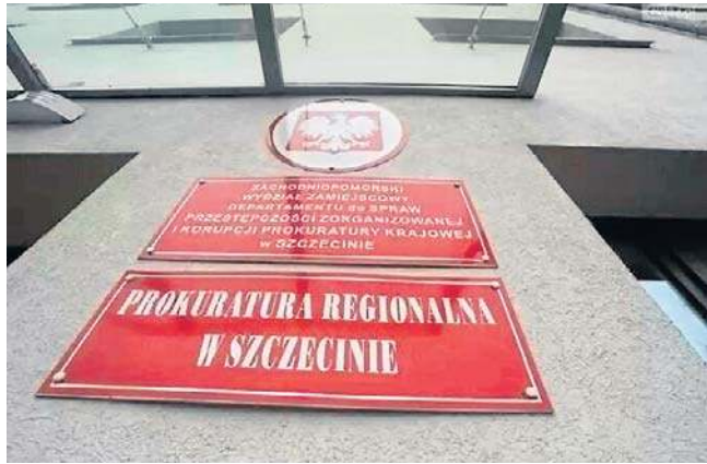
Śledztwo zakończyła Prokuratura Regionalna w Szczecinie. Wszczęto je w oparciu o wyniki ustaleń CBA

Pierwszy program dotyczył budowy parku etnograficznego w Niechorzu, a drugi Papińskiego Szlaku Kajakowego Drawy i Korytnicy. Zarzuty do-