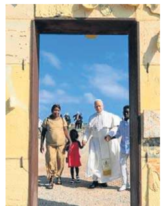
Papież z rodziną migrantów przy Bramie Europy

- Jestem wdzięczny Panu, że mogę was odwiedzić, idąc śladami papieża Franciszka, który 8 lipca 2013 roku zechciał przybyć na Lampedusę podczas swojej pierwszej podróży jako następcy Piotra - podkreślił Leon