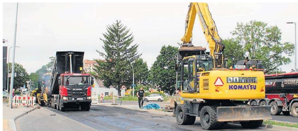
FOT. KEWIN HENDZEL

Inwestycja jest finansowana w 95 proc. z Rządowego Funduszu Polski Łąd, natomiast wkład własny miasta wynosi około 5 proc. ©