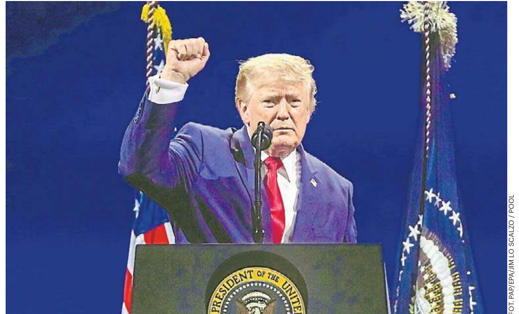
Podczas trwającego 35 minut przemówienia Donald Trump mówił m.in. o amerykańskich osiągnięciach i wzbudzającym kontrowersje projekcie ustawy SAVE America Act

Podobnie jak w piątek podczas przemówienia pod górą Ru-