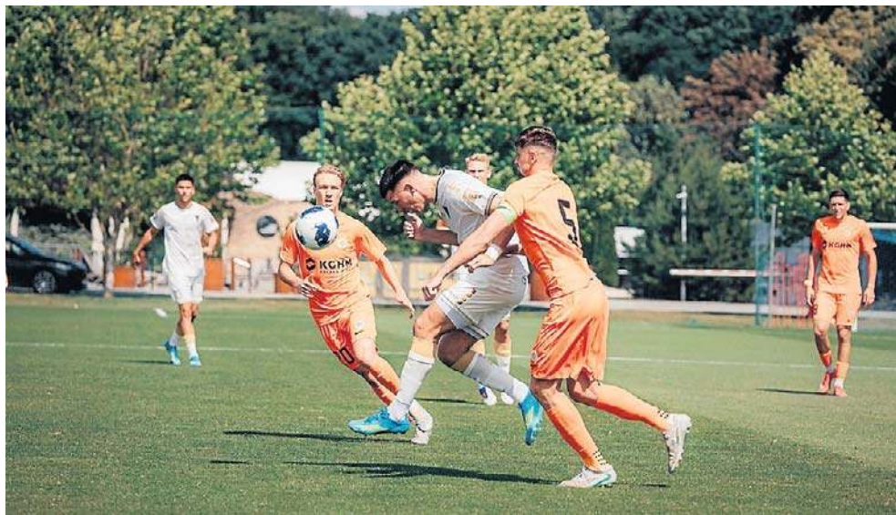
Teraz przed Portowcami kilka dni treningów w Szczecinie i obóz w Austrii

Sam mecz - Pogoń klepała, a Zagłębie było konkretniejsze. Skorzystało z błędów w obronie, dopisało mu trochę szczęścia. Nie ma co robić dramatu z porażki, bo np. w Opalenicy sztab Pogoni zaproponował kilka nowych rozwiązań. Nie