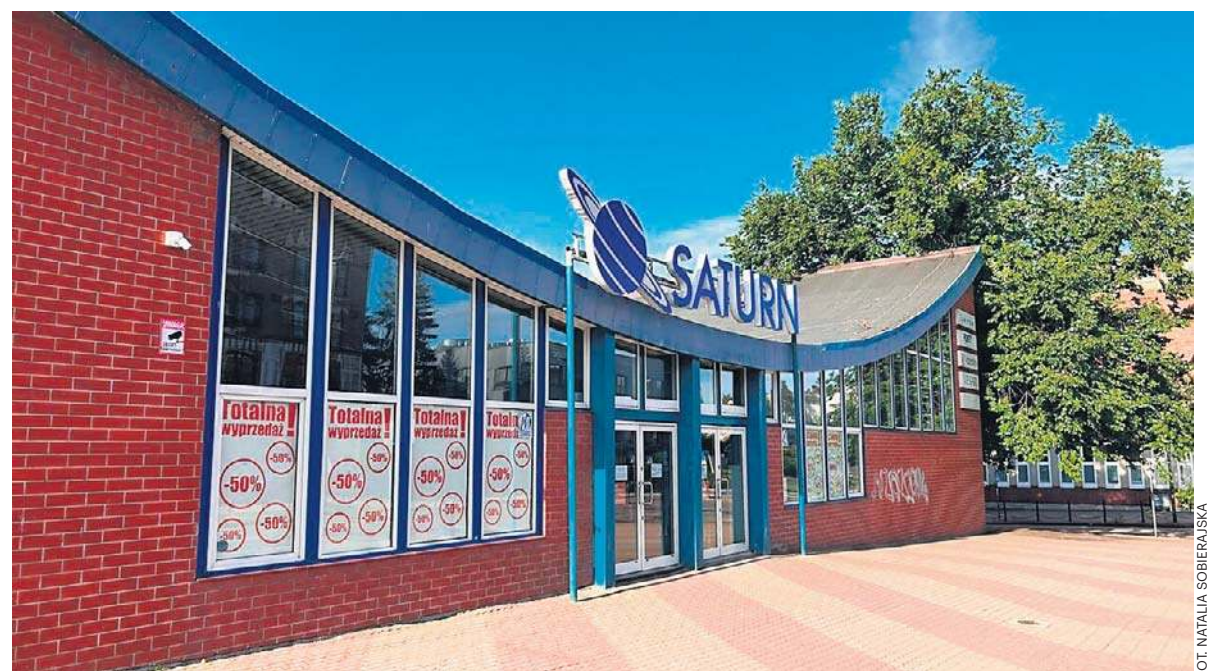
Spółdzielczy Dom Handlowy Saturn został otwarty 28 września 1965 roku

Dom Handlowy Saturn do użytku został oddany 28 września 1965 roku. Nietypowa, nowoczesna bryła budynku według projektu warszawskich architektów zdominowała na lata centrum Koszalina. W asortymencie spółdzielczego domu handlowego były ubrania, bielizna, obuwie oraz tzw. dział 1001 drobiazgow. Można się tam było zaopatrzyć we wszystkie najpotrzebniejsze rzeczy. Koszalinianie ustawiali się w długich kolejkach po towary powszechnego użytku oraz dobra luksusowe. ©