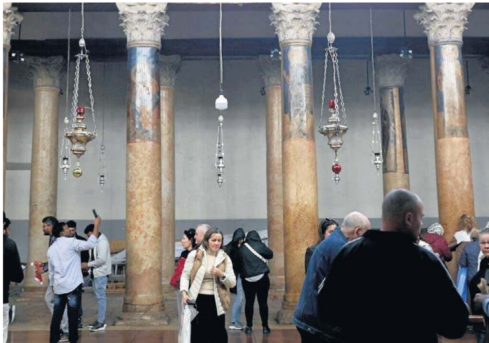
Bazylika Narodzenia Pańskiego w Betlejem znów przyciąga wiernych

W samym centrum i sercu miasta, otoczona klasztorami grecko-ortodoksyjnym i ormiańskim oraz klasztorami franciszkańskim, znajduje się bazylika Narodzenia Pańskiego. Chrześcijański charakter miasta jest uznany również na płaszczyźnie politycznej - do tego stopnia, że na mocy dekretu prezydenta palestyńskiego burmistrz Betlejem musi być chrześcijaninem. Podobnie jak w całej Ziemi Świętej, lokalna wspólnota chrześcijań-