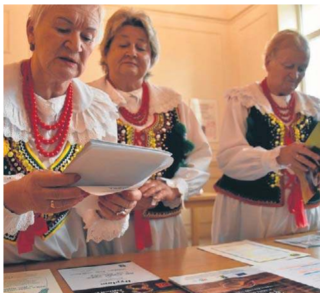
Potrawa przyrządzana jest według przepisu z XIX wieku