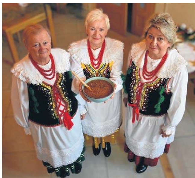
Dzięki paniom z Koła Gospodyń Wiejskich o rzędzińskim siuśpaju usłyszała cała Polska