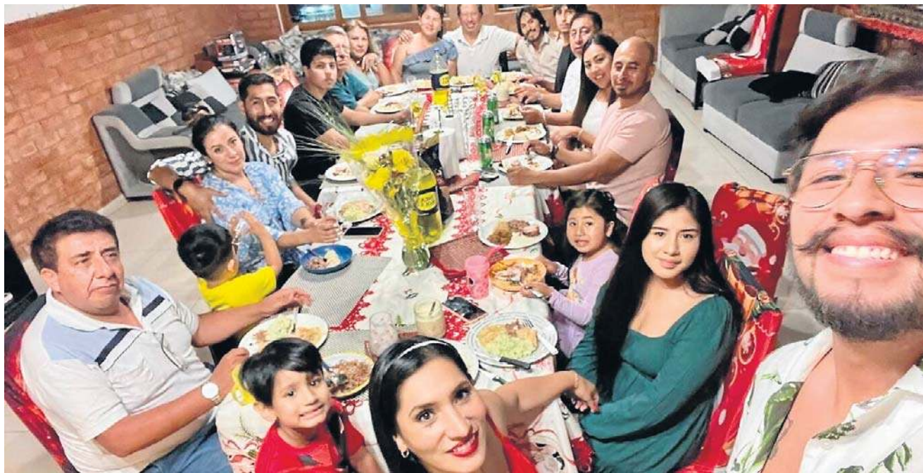
Dorośli Peruwiańczycy mówią: „Boże Narodzenie jest dla dzieci”, i to prawda. Święta są dla nich

Dorośli Peruwiańczycy mówią: „Boże Narodzenie jest dla dzieci”, i to prawda. Święta są dla nich, ale trudno utrzymać wiarę w Mikołaja czy świa-