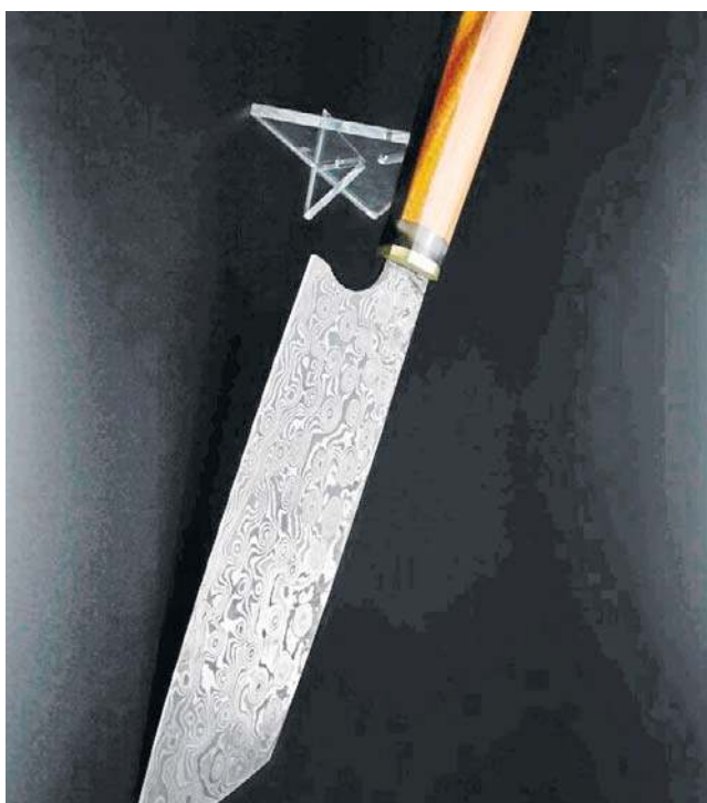
Ręcznie wykończone detale – każdy nóż powstaje jako unikat, dopracowany od klingi po rękojeść

jej pracy wykorzystuję różne gatunki drewna. Może to być orzech turecki, mogą to być drewna sprowadzane z Indonezji, quava czy tamarynd, ale mogą to być też nasze rodzime gatunki, czeczot klonu, brzoza karelska, która jest stabilizowana i barwiona. Z takich materiałów wykorzystuję to, co jest dostępne na rękojści, odpowiednio oczywiście przygotowując i komponując całość mojej pracy.