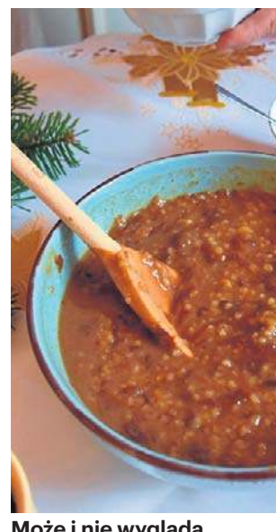
Może i nie wygląda zachęcająco, ale smakuje doskonale

S iuśpaj idealnie pasuje do wigilijnego menu. Jest to danie postne, do jego przygotowania nie potrzeba mięsa, jedynie kilka powszechnie dostępnych składników. Połączone razem, w odpowiednich proporcjach, tworzą uniwersalną potrawę, która zimą podawana jest zazwyczaj na ciepło, a latem na zimno.