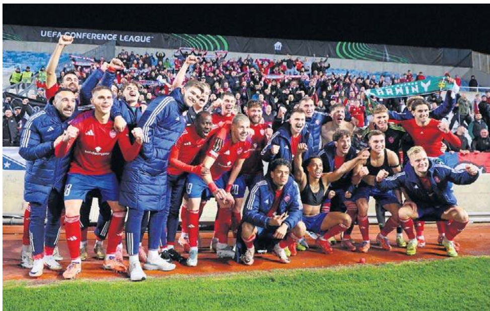
Raków Częstochowa zajął drugie miejsce w fazie zasadniczej Ligi Konferencji

Ten sezon Legii można określić słowem „blamaż”?