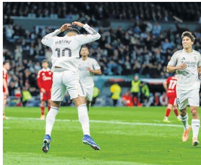
Kylian Mbappe świętuje gola strzelonego Sevilli w stylu „Siuuu” swojego idola, legendarnego Cristiano Ronaldo

- Cristiano jest moim przyjacielem i idolem. Uroczystość była poświęcona jemu. Cri-