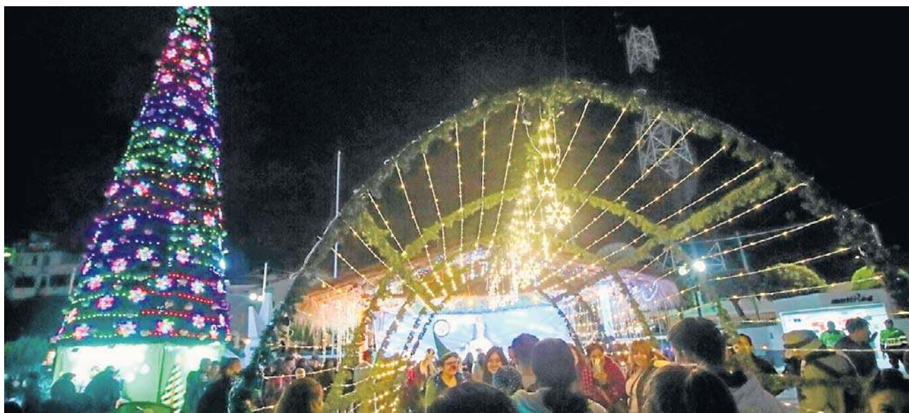
Peruwiańska szopka jest wyjątkowa: są w niej gipsowe figurki z Jezusem, często z lamami, alpakami, Andkami

teczną magię, gdy wiele dzieciaków pracuje od najmłodszych lat. Ameryka Łacińska ma wiele problemów: ogromne nierówności, bogaci obok tych, co nie mają nic.