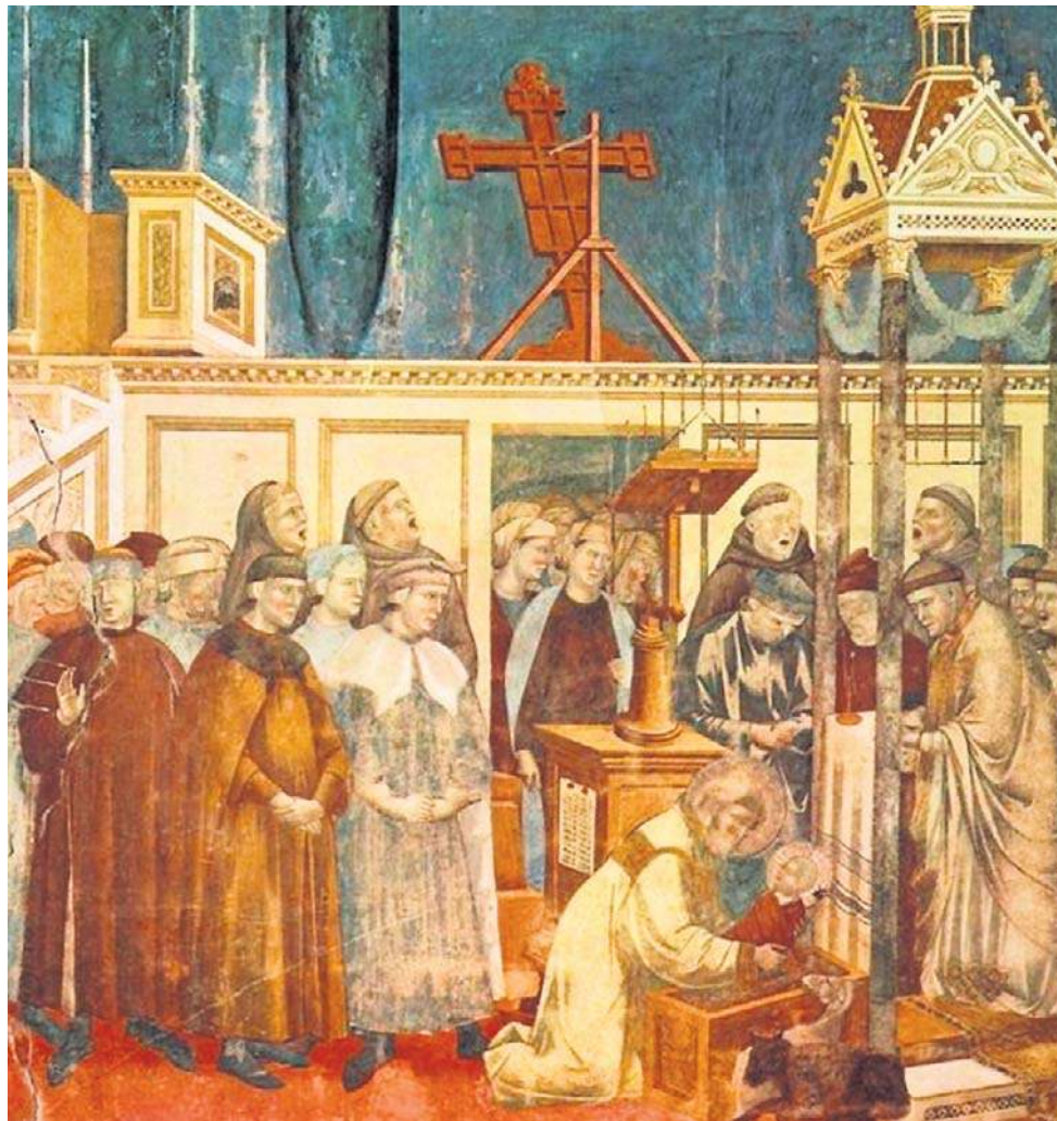
Fresk przedstawiający pierwszą szopkę przygotowaną przez św. Franciszka w Greccio

W powyższym doszukać się można religijnych sporów epoki średniowiecza. W czasach św. Franciszka katarzy i im