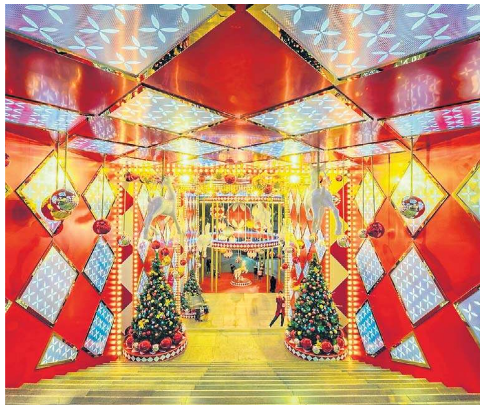
Świąteczne dekoracje w centrum handlowym w Szanghaju. W Chinach Wigilia nazywana jest Píng'ān yè (nocą pokoju) i ciągle zyskuje na popularności

A gdy prosimy go, by opowiedział nam więcej o tym szczególnym momencie, młody mężczyzna wspomina, że na przedstawienia z pie-