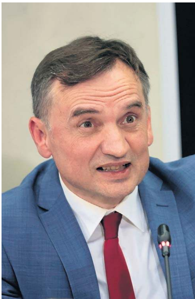
Zbigniew Ziobro krąży między Budapesztem a Brukselą, ale w Polsce zajmuje się nim sąd, który w poniedziałek rozpatrzy wniosek o areszt dla niego

- Zbigniew Ziobro to jest polityk, który nie cieszy się specjalną sympatią w Polsce. Co więcej, nienajlepsza opinia czy nienajlepszy stosunek, czy