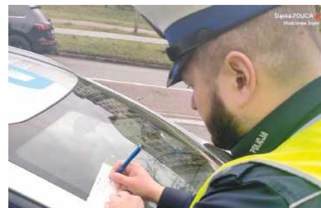
■ Mieszkaniec powiatu wodzisławskiego próbował przetransportować telewizor w dość nietypowy sposób. FOTO: KPP WODZISŁAW ŚLĄSKI, ILLUSTRACYJNE

Zgodnie z obowiązującymi przepisami, poruszanie się motorowerem bez prawa jazdy to wykroczenie, za które sąd może nałożyć grzywnę w wysokości od 1500 do nawet 30 000 złotych. Dodatkowo grozi za-