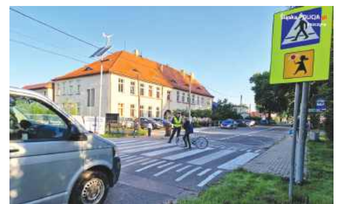
■ 50 kierowców złapanych za zbyt szybką jazdę przy pasach.

Szczególny nadzór nad rejonami przejść dla pieszych