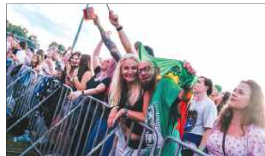
■ Dobra energia, tłumy uczestników i letnia pogoda sprawiły, że tegoroczna edycja po raz kolejny potwierdziła wyjątkowy klimat tego wydarzenia.