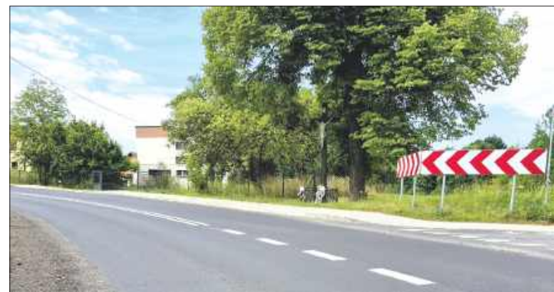
■ Wyremontowany chodnik przy ul. 1 Maja w Gołkowicach

większy remont ul. 1 Maja między ul. Strażacką a ul. Piotrowicką. Zakres tej inwestycji obejmował przebudowę jezdni, chodników, kanalizacji deszczowej oraz montaż sygnalizacji świetlnej przy szkole. Prace kosztowały niemal 5,6 mln zł, z czego 3,3 mln zł pokrył ten sam fundusz rządowy. (z)