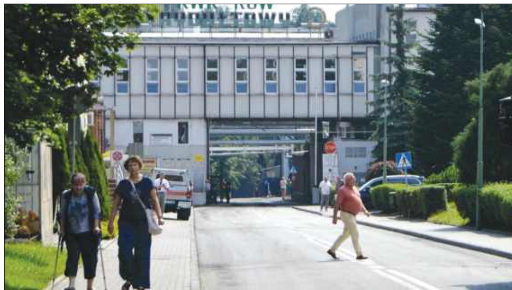
■ KWK ROW Ruch Rydułtowy, zdjęcie ilustracyjne