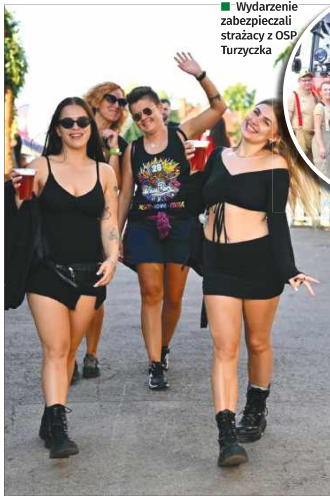
■ Na festiwal przyjechało wielu miłośników pozytywnych rytmów z całego regionu.

■ Wydarzenie zabezpieczali strażacy z OSP Turzyczka