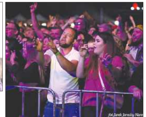
■ Publiczność podczas koncertu Jamala