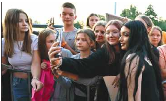
■ W piątkowe popołudnie na stadion przybyło wiele fanek i fanów Viki Gabor.

ne popołudnie atrakcje z okazji Dni Wodzisławia przygotowano również na wodzisławskiej starówce. Odbywały się tam animacje i konkursy dla dzieci,