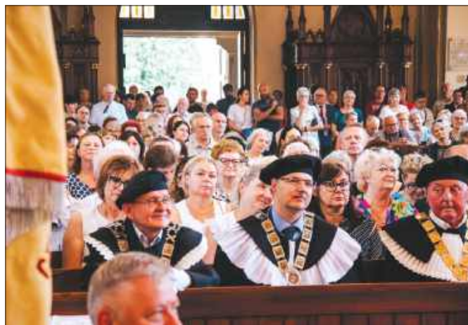
■ Wierni i delegacje podczas mszy św. w podziękowaniu za 27 lat posługi.