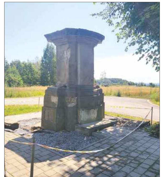
■ Pozostał postument, który również zostanie zabezpieczony. Prace mają być wykonane do końca września.

zakresie prawidłowych właściwości technicznych i walorów estetycznych, jak również wykonanie zabezpieczeń, ograniczających niekorzystne oddziaływanie zewnętrzne na zabytek. Przewiduje się przeprowadzenie pełnej konserwacji technicznej i estetycznej, z uwzględnieniem rekonstrukcji w obszarach, gdzie eksponowany materiał nie ma walorów oryginału, a jednocześnie jego forma i cechy techniczne negatywnie wpływają na stan zachowania całości pomnika. Zakłada się, że dla prawidłowego przeprowadzenia konserwacji konieczny jest demontaż obiektu i wykonanie prac w warunkach warsztatowych, co umożliwi zachowanie wymagań warunków technologicznych. Jednocześnie demontaż umożliwi wydzwignięcie elementów zagrożonych w gruncie, konieczne naprawy fundamentu oraz wykonanie izolacji przeciwwilgocio-