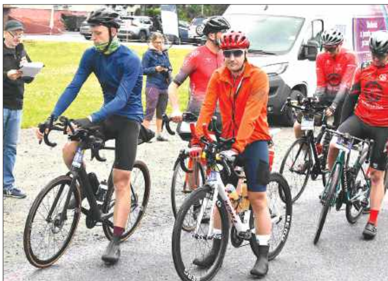
■ Tour de Silesia 2025 w Godowie

- Trasa 500 km jest oczywiście wymagająca, ale nie jakoś szczególnie, bo w tym roku suma przewyżeń nie przekracza 5000 m i