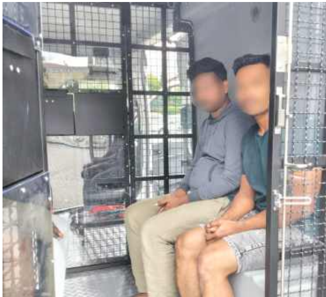
■ Tylko w ostatnich dniach Straż Graniczna zatrzymała kolejnych 14 cudzoziemców przebywających nielegalnie w Polsce.

Chociaż jego pobyt w Polsce był formalnie legalny, ze względu na przeszłość kryminalną i potencjalne zagrożenie dla bezpieczeństwa publicznego, Komendant Placówki Straży Granicznej w Rudzie Śląskiej (pod którą podlega rybnicka jednostka) wydał decyzję o zobowiązaniu do powrotu. Obywatel Ukrainy został przewieziony pod konwojem do granicy i