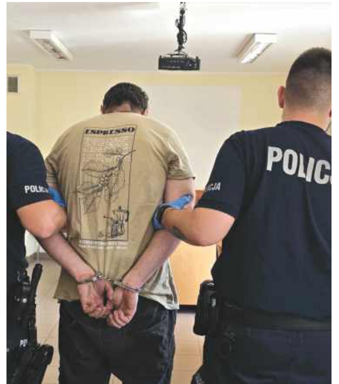
■ Sklepowy złodziej z Wodziszawia Śląskiego zaatakował ochronę i groził pracownikom śmiercią. Policja szybko wkroczyła do akcji.

Do zdarzenia doszło w poniedziałkowy poranek (14.07.). Funkcjonariusze patrolowo-interwencyjni otrzymali zgłoszenie o agresywnym mężczyźnie, który po dokonaniu kradzieży w sklepie miał zaatakować personel. Mundurowi obezwładnili napastnika i przewieźli go do policyjnego aresztu.