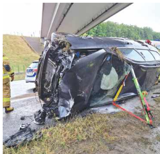
■ Zbyt szybka jazda i nagła zmiana pogody – to wystarczyło, by 28-latek stracił panowanie nad autem. Doszło do zderzenia ze skodą i dachowania pojazdu.

zał się 28-letni mieszkaniec powiatu raciborskiego. Za nieostrożną jazdę został