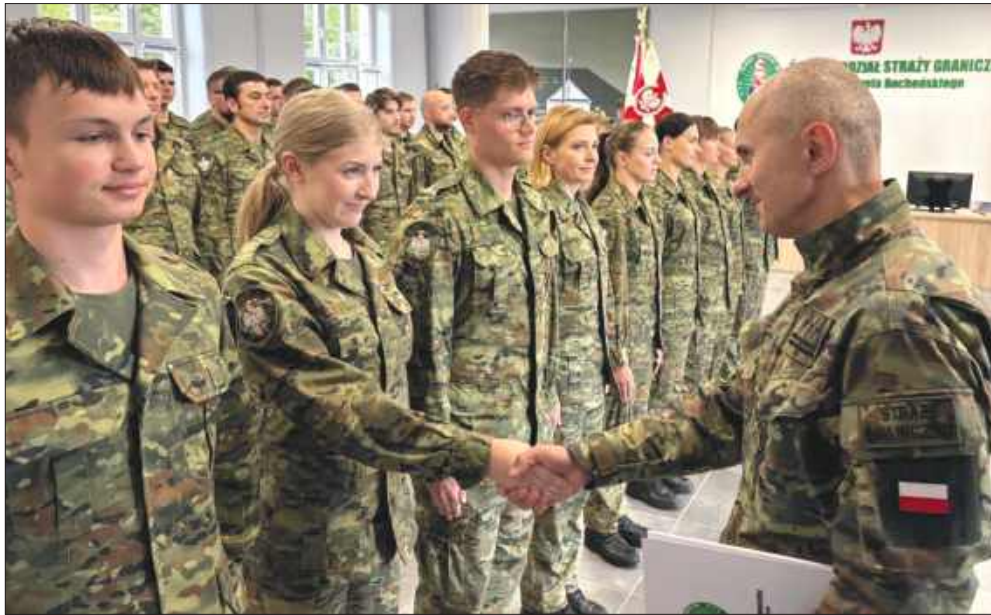
■ Funkcjonariusze odebrali akty mianowania w Raciborzu. Część z nich trafi m.in. do Rybniku, Częstochowy i Pyrzowic.

REGION W Raciborzu 40 funkcjonariuszy Straży Granicznej odebrało akty mianowania na stopień kaprała. Nowi podoficerowie zasilą placówki Śląskiego Oddziału SG, w tym nowopowstałą Grupę Zamiejscową w Rybniku.