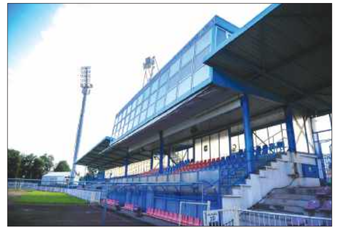
■ Odra Wodzisław wycofuje się z rozgrywek 5.ligi

Tekst pochodzi z publikacji „Prosta historia rodzinnej przedsiębiorczości”, wydanej z okazji 60-lecia Cechu Rzemieślników i Innych Przedsiębiorców w Wodzisławiu Śląskim (2017)