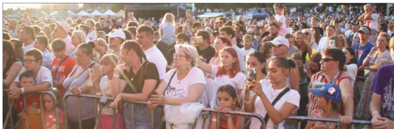
■ Publiczność podczas koncertu Sławomira