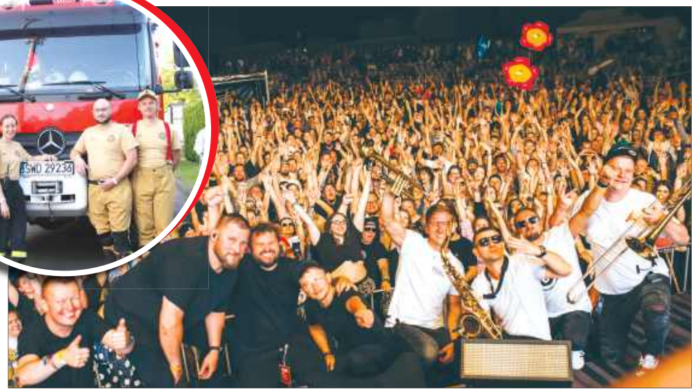
■ Zespół Tabu na wspólnym zdjęciu z publicznością.