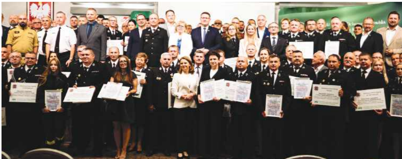
■ Wspólne zdjęcie beneficjentów programu, władz WFOŚiGW, parlamentarzystów i samorządowców

– Bezpieczeństwo strażaków to inwestycja w bezpieczeństwo nas wszystkich. To ludzie, którzy często jako pierwsi pojawiają się na miejscu wypadków, pożarów czy klęsk żywiołowych. Dlatego naszym