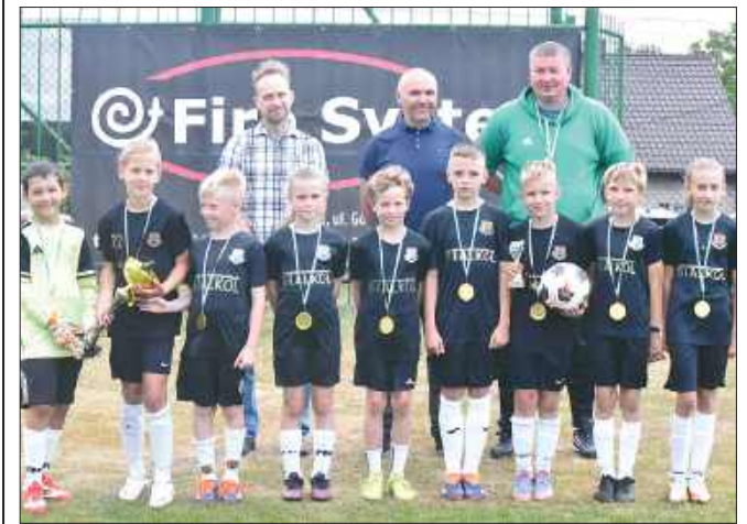
■ Drużyna orlików Naprzodu Zawada zwyciężyła w IV Turnieju im. Łucjana Wnuka w Skrzyszowie