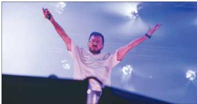
■ C-BOOL pokazał wielkie show, jak zwykle. Jego koncerty to połączenie muzyki, światła i pokazów pirotechnicznych