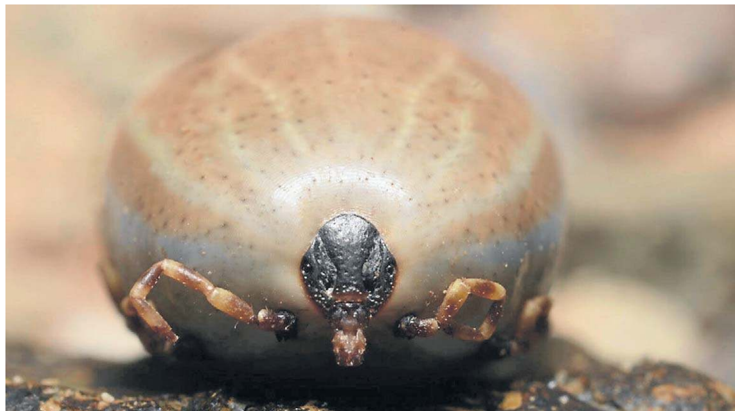
Hyalomma są wyraźnie większe od naszych rodzimych gatunków. Nienapite osiągną około centymetra długości, a napite samice mają nawet dwa centymetry. Najbardziej charakterystyczne są ich długie, prążkowane odnóża z jasnymi pierścieniami. Sam korpus jest raczej jednolicie brązowy i mniej kontrastowy niż u naszych kleszczy