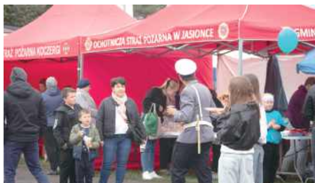
Wydarzenie wsparło wiele instytucji, a lista podziękowań jest bardzo długa. Jak zawsze - i tym razem można było liczyć na druhow strażaków, a panie z zaprzyjaźnionych kół gospodyń oraz rodzice i terapeuci z fundacji przygotowali pyszny poczęstunek

Obecnie pod opieką Fundacji VICTOR jest prawie 60 osób, z czego większość to dzieci. Faktem jest, iż z roku na rok w naszym powiecie przybywa dzieci z orzeczoną niepełnosprawnością, co okazuje się dla fundacji nie lada wyzwaniem. W naszym społeczeństwie niestety nadal istnieje zjawisko ukrywania niepełnosprawności, czyli niemówienia o swojej czy też dziecka niepełnosprawności,