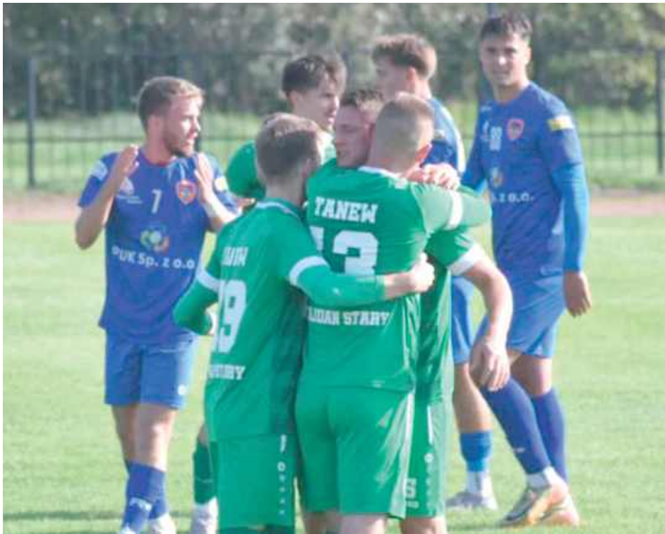
Tanew wyjechał z Międzyrzecza z trzema punktami, a Huragan jest obecnie jedyną drużyną z zerem na koncie