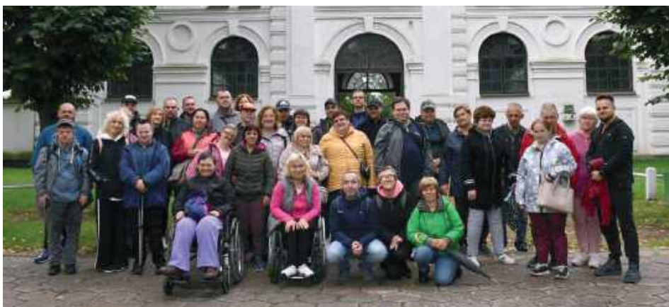
W programie było zwiedzanie stadniny koni