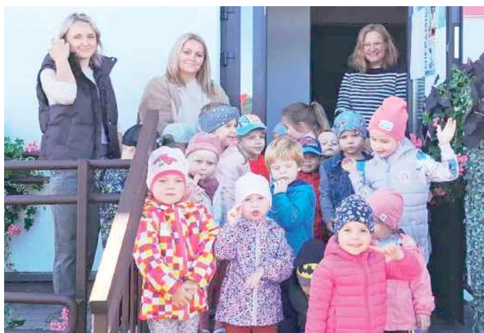
Przedszkolaki ze swoimi wychowawczyniami odwiedziły w okazji Dnia Jabłka Gminną Bibliotekę Publiczną w Sosnowicy.

- Odwiedziła nas fantastyczna grupa z 3-latkami na początku. Niebawem spotkamy się na pasowaniu na czytelnika. Już nie możemy się doczekać. Dziękujemy za smaczną niespodziankę i do zobaczenia - mówią przedstawiciele biblioteki.