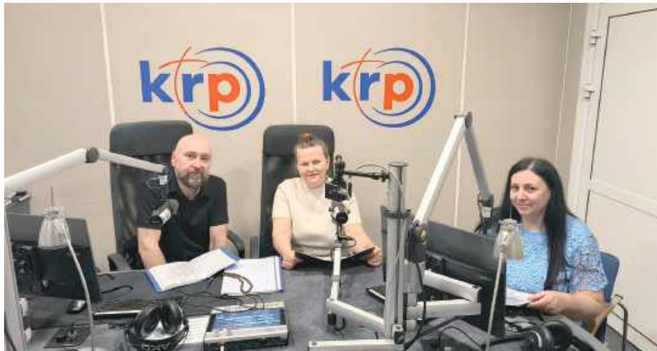
Pracownicy gościli w Katolickim Radiu Podlasie