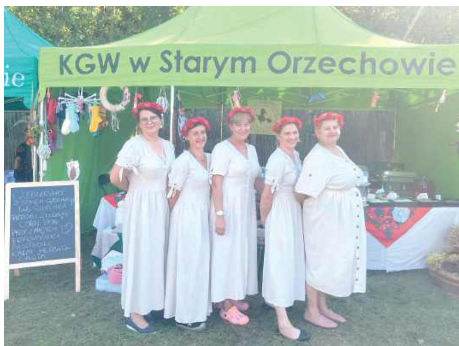
GR Swoją reprezentację miało Koło Gospodyń Wiejskich w Starym Orzechowie

Dziękujemy za trud włożony w przygotowanie tak pięknych i smakowitych prezentacji, które wzbogaciły imprezę i przyciągnęły wielu gości. Państwa działalność jest nieoceniona w promowaniu lokalnej tożsamości i wspieraniu rozwoju naszej społeczności - relacjonuje GOK Sosnowica.