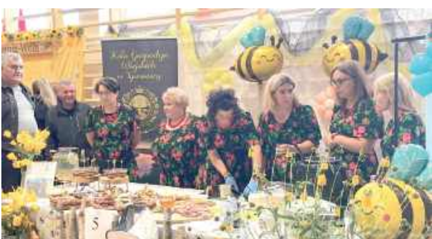
...oraz koło z Tyśmienicy

W programie były też: występy artystyczne dzieci z dwóch parczewskich przedszkoli (Publiczne Przedszkole nr 1 oraz Przedszkole Artystyczno - Językowe „Skowronek”), występ Ze-