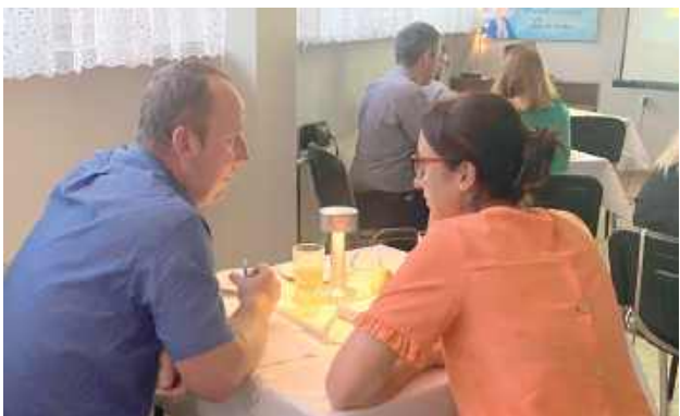
Organizatorzy zadbali o romantyczną atmosferę

- Rozpoczęliśmy wspólną modlitwą do Matki Bożej Królowej