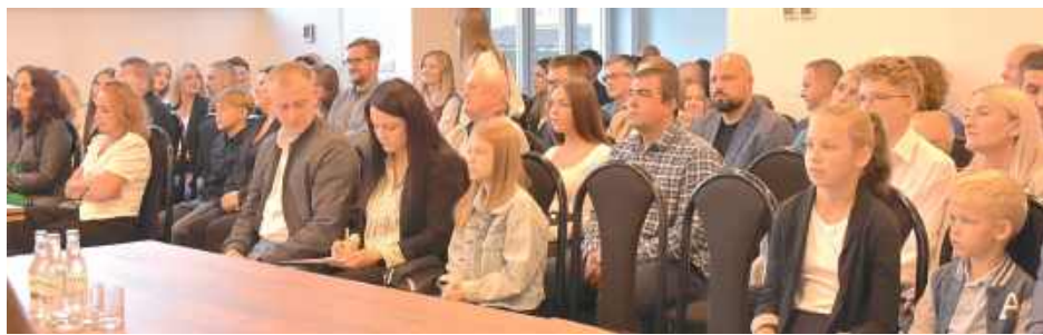
Nagrodzonym towarzyszyli rodzice

Były brawa, wzruszenie i dumna – bo to właśnie ci młodzi ludzie budują wizerunek Radzyna i pokazują, że nasi mieszkańcy mają ogromny potencjał.