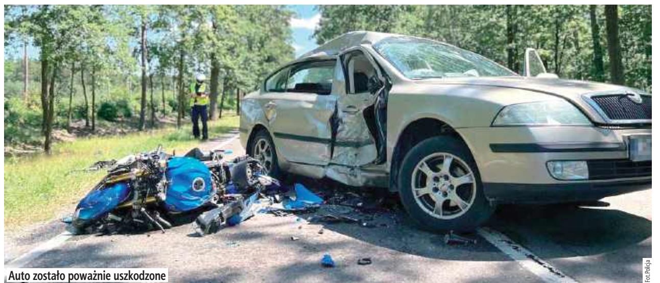
Auto zostało poważnie uszkodzone

Przedłużone zostało śledztwo ws. poważnego wypadku w Stasinowie na drodze krajowej numer 63.