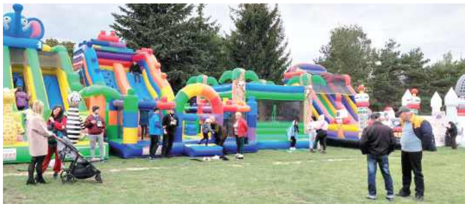
Organizatorzy przygotowali dla najmłodszych wiele atrakcji, wśród nich dmuchańce, bez których nikt już sobie nie wyobraża imprez plenerowych z udziałem dzieci