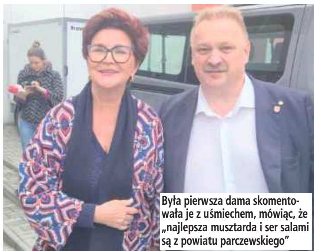
Była pierwsza dama skomentowała je z uśmiechem, mówiąc, że „najlepsza musztarda i ser salami są z powiatu parczewskiego”

- Podczas wizyty przewodniczący miał okazję przekazać