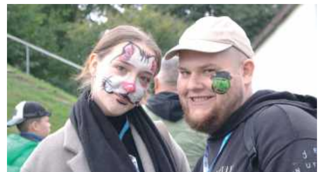
Malowanie twarzy już nie jest zarezerwowane tylko dla dzieci

O G Ł O S Z E N I E AZ-VII.6740.120.2025.MD Parczew, 03.10.2025 r.