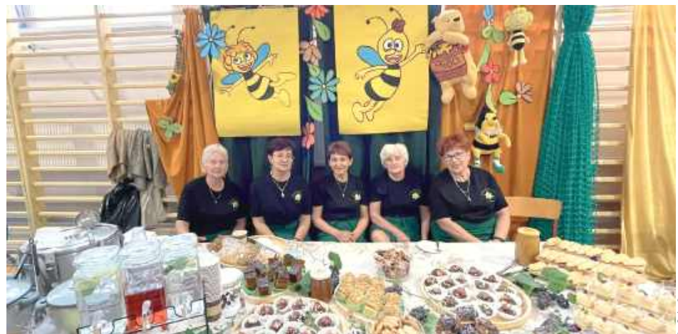
Swoje stoisko miało m.in. Koło Gospodyń Wiejskich w Podedwórze

Degustacja czy występy artystyczne - Jarmark Pszczelarski został zorganizowany w Parczewie.