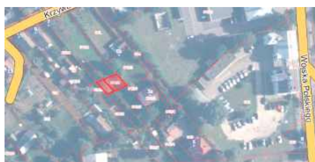
Działki położone są między ulicami Krzywą i Wojska Polskiego

Działki stanowią własność gminy, mają powierzchnię 0,0145 ha i położone są przy ul. Krzywej. Własność gminy uregulowana jest w księdze wieczystej. - Zbycie nieruchomości pozwoli na pozyskanie pieniędzy w celu realizacji założeń budżetu na 2025 r. - czytamy w uchwale.