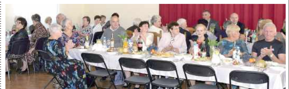
Seniorzy pokazali, że jesień życia, podobnie jak jesień w przyrodzie, może być pełna barw, energii i radości