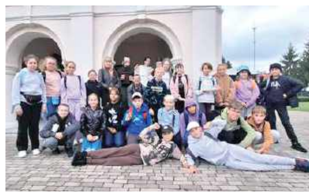
GR Festiwal po raz kolejny dostarczył wielu wrażeń

- Festiwal po raz kolejny dostarczył wielu wrażeń i ciekawych spotkań. Dzieci mogły przybliżyć swoje doświadczenie z tradycją religii i kultury żydowskiej. To także czas jedności wielokulturowej i życzliwego spojrzenia na drugiego człowieka - informuje SP 3.