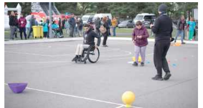
Dla uczestników przygotowano konkurencje sportowe