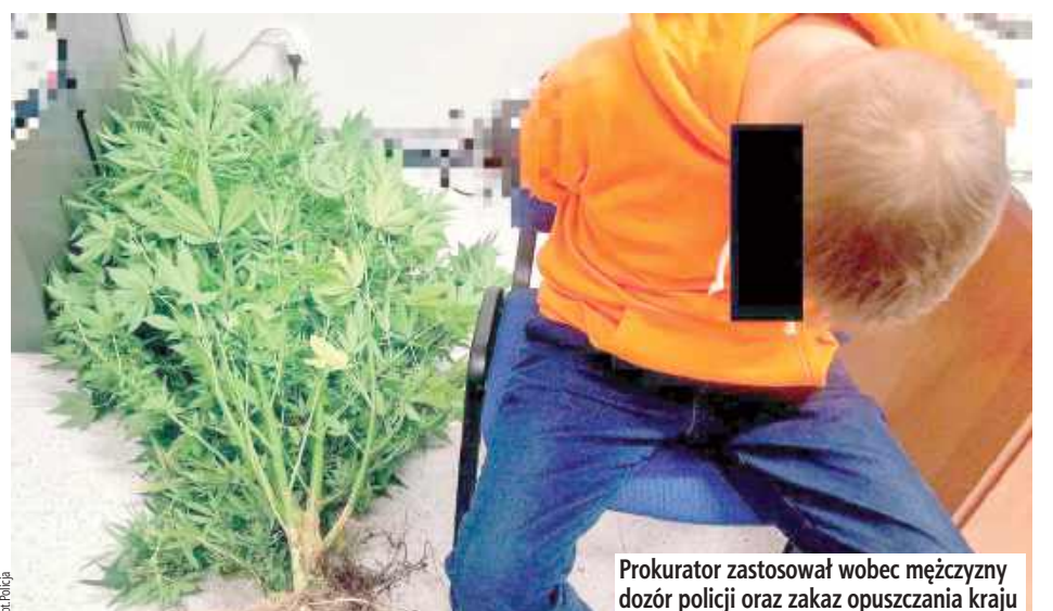
Prokurator zastosował wobec mężczyzny dozór policji oraz zakaz opuszczenia kraju