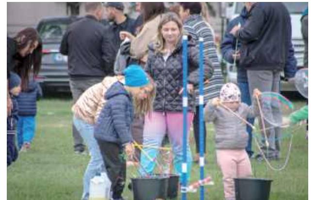
Prosta i pełna magii aktywność - bańki mydlane to rewelacyjna zabawa dla dzieci

News, który rozkręcił zabawę mimo niesprzyjającej pogody. Ogromnym powodzeniem cieszyły się również stoiska z pysznościami, które przygotowali rodzice oraz terapeuci z fundacji. Piknik był okazją do wymiany doświadczeń w kwestii potrzeb osób z niepełnosprawnościami.