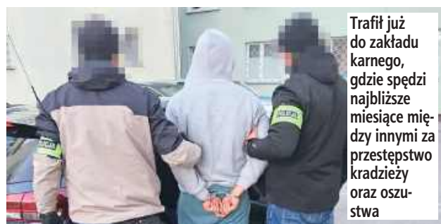
Trafił już do zakładu karnego, gdzie spędzi najbliższe miesiące między innymi za przestępstwo kradzieży oraz oszustwa

- Próbował jednak uniknąć odpowiedzialności, zrywając kon-