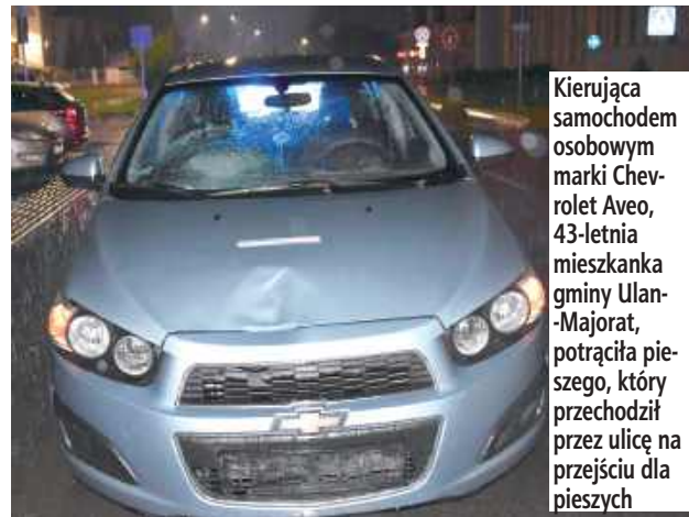
Kierująca samochodem osobowym marki Chevrolet Aveo, 43-letnia mieszkanka gminy Ulan-Majorat, potrafiła pieszego, który przechodził przez ulicę na przejściu dla pieszych

- Ze wstępnych ustaleń policjantów radzyńskiej drogówki wynika, że kierująca samocho-