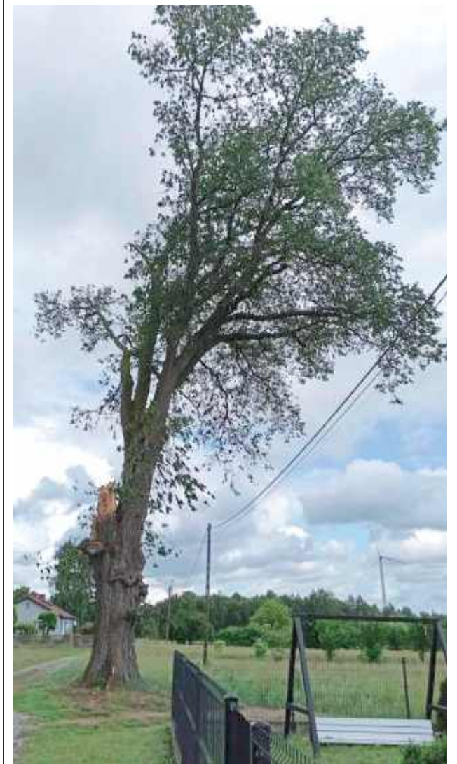
Drzewo rośnie w Wierzbówce