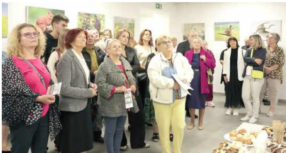
Wydarzenie cieszyło się sporym zainteresowaniem