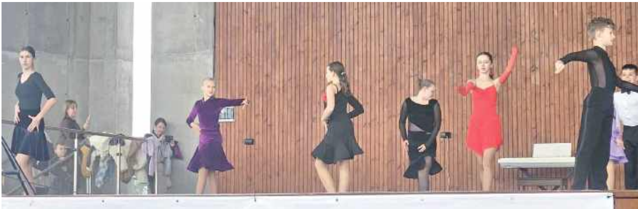
Podczas pikniku zaprezentowały się dzieci, które dopiero zaczęły swoją przygodę z tańcem oraz pary i solistki, które mają ogólnopolskie klasy taneczne. Pokaz Latino Solo zaprezentowali dorośli

Parczew: Pod takim hasłem w niedzielę, 28 września odbył się pierwszy Charytatywny piknik integracyjny. Jak nazwa tego wydarzenia mówi, członkowie fundacji zaprosili mieszkańców do wspólnej zabawy, ale też i do zmieniania rzeczywistości dzieci z niepełnosprawnościami z naszego regionu. Dzięki hojności uczestników pikniku zebrali 10 646,77 złotych.