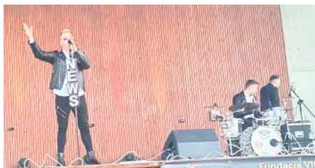
Charytatywny Piknik integracyjny zakończył występ zespołu News

„bo to wstyd”, „bo będą wytykać palcami” albo od nas się odwrócą. Z drugiej strony jest też brak zainteresowania ich potrzebami lub udawania, że ich nie ma. Piknik był okazją do wspólnej zabawy dla całych rodzin, w tym przede wszystkim dla dzieci, były też atrakcje dla młodzieży i dorosłych. Wspaniałe występy na scenie zakończył zespół