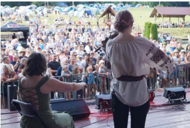
«Лемківська ватра» у Ждині

У переліку проектів організації, що не отримали фінансування від грантодавця на цей рік, опинився 53-й Загальнопольський конкурс писанок імені Михайла Ковальського. Об'єднання лемків теж хотіло у 2026-му отримати грант на оновлення санітарної інфраструктури на території «Ватри» в Ждині. Проте грошей від МВСiA на це у них теж не буде, як і минулого року.