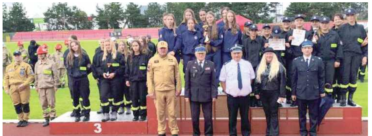
Wśród pań wygrała drużyna z Koczergi