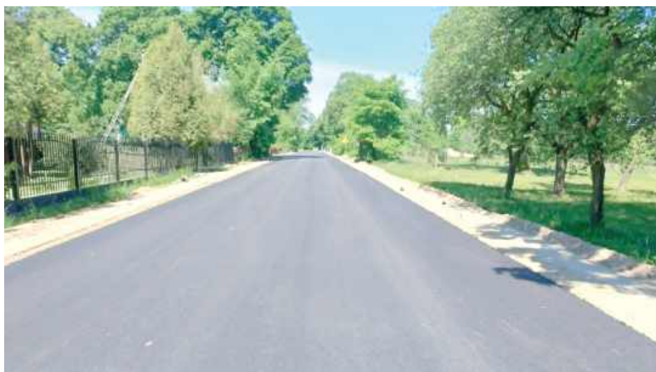
Ułożony został już nowy asfalt

Zakres inwestycji przewiduje m.in. zaprojektowanie i przebudowę będącej do tej pory w kiepskim stanie drogi powiatowej nr 1622L relacji Uhnin-Mościska-Hola-Wołoskowola na odcinku o długości ok. 3,9 km. Prace są prowadzone między miejscowościami Kropiwki i Mościska. Ułożony został już nowy asfalt, choć roboty jeszcze trwają.