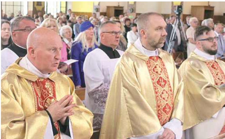
W wydarzeniu wzięli udział liczni przedstawiciele duchowieństwa

- To chwila, która zapisze się złotymi zgłoskami w historii naszej wspólnoty i pozostanie na zawsze w ludzkich sercach. Konsekracja kościoła to nie tylko uroczysty obrzęd. To spełnienie marzeń wielu poko-