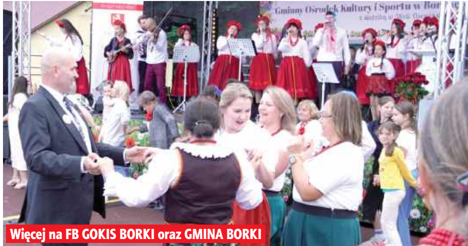
Więcej na FB GOKiS BORKI oraz GMINA BORKI

Prawdziwą gwiazdą wieczoru i muzycznym prezentem dla wszystkich uczestników jubileuszu był koncert zespołu Guzowianki. Żywiłowy występ artystek porwał publiczność do wspólnej zabawy, śpiewu i tańca