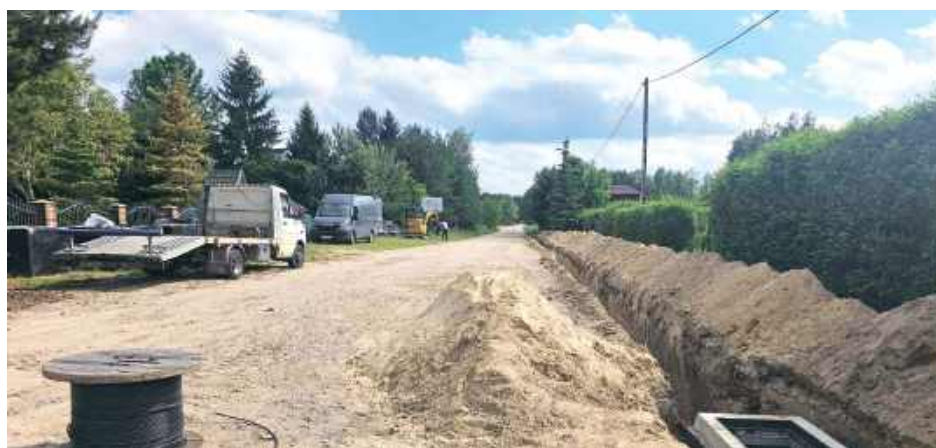
950 m powstaje dzięki dofinansowaniu z Rządowego Funduszu Rozwoju Dróg Kolejny

To kolejna inwestycja drogowa w Lejnie. W ubiegłym