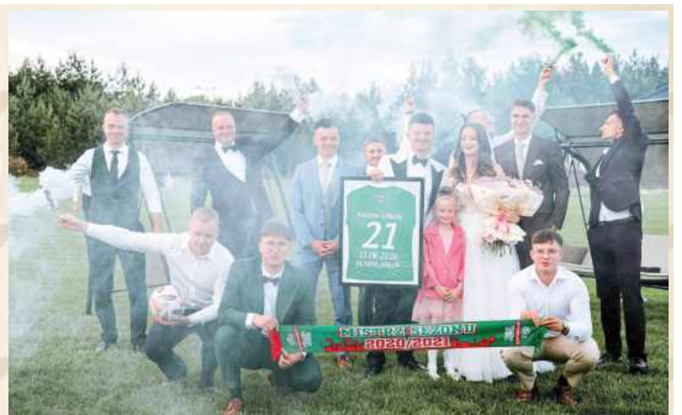
Młodzi wraz ze społecznością piłkarską Olimpij