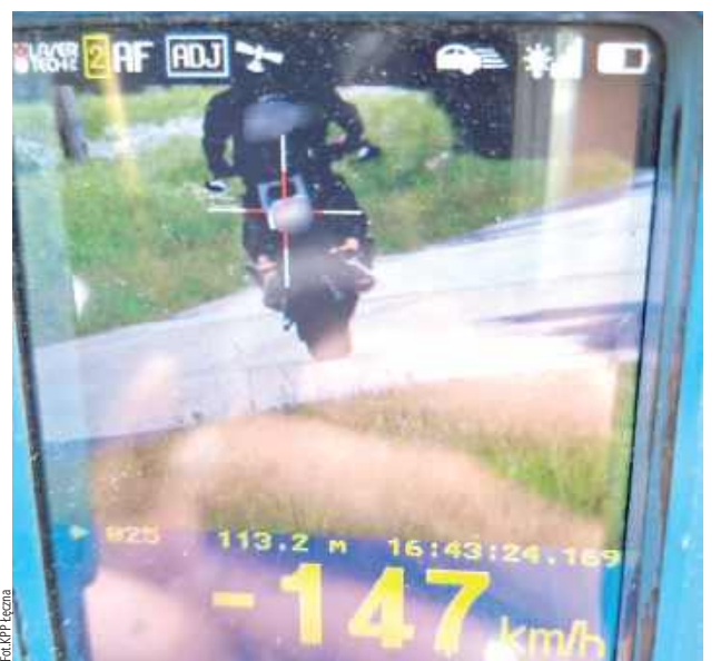
Teraz mężczyźnie grozi kara do 5 lat pozbawienia wolności