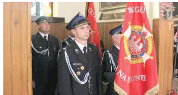
Nie mogło zabraknąć strażaków