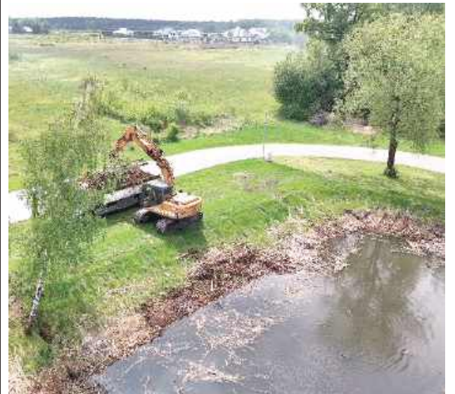
Brzegi zbiornika porośnięte są gęstą roślinnością