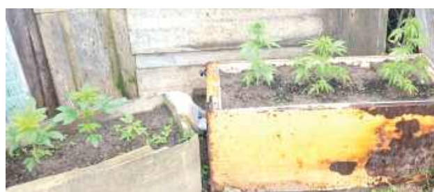
Funkcjonariusze zatrzymali 25-letniego mieszkańca powiatu zwoleńskiego. Trafił on do policyjnego aresztu, a następnie usłyszał zarzut popełnienia przestępstwa uprawy konopi indyjskich

Konopie były w różnych fazach rozwojowych, a najwyższe osiągały wysokość blisko 50 centymetrów.