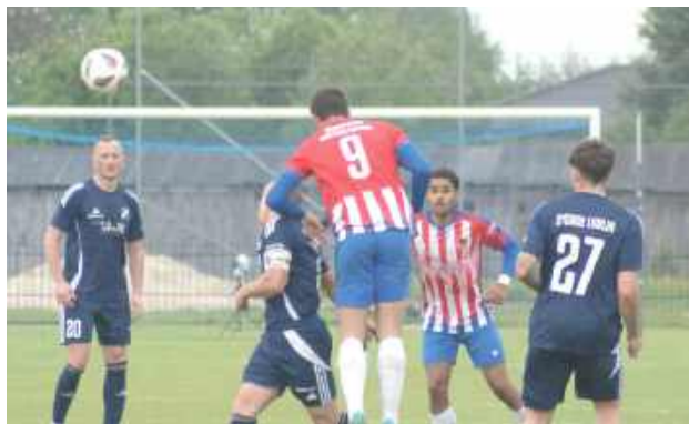
Już 1 czerwca Huragan zmierzy się z Ładą Biłgoraj