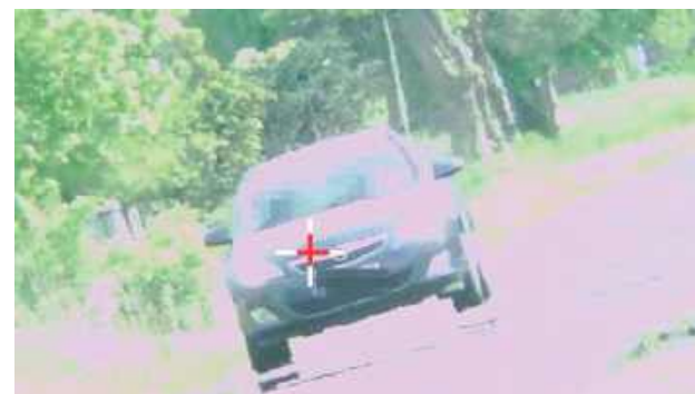
Kierowcy stracili uprawnienia. Zostali też ukarani wysokimi mandatami

W niedzielę (18 maja) w miejscowości Żakowola Radzyńska w pow. radzyńskim policjanci bialskiej drogówki zauważyli kierowcę BMW, który przekroczył dozwoloną w terenie zabudowanym prędkość. Jechał 111 km/h, przekraczając tę dozwoloną o 61 km. Za kie-