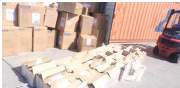
Po wyładowaniu pudeł z kontenera okazało się, że są wzbogacone o białoruskie papierosy...

Warte 280 tys. zł nielegalne papierosy wykryła Służba Celno-Skarbowa z Małaszewicz w transporcie jadącym z Chin do Niemiec.