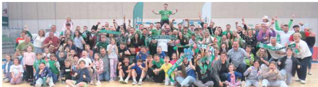
Wielka rodzina AZS-u. Białczanie utrzymali się w Lidze Centralnej