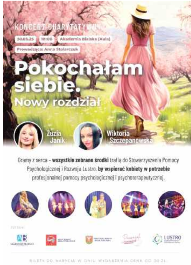
Plakat koncertu charytatywnego

- Zebrane pieniądze zostaną przeznaczone na terapię, warsztaty oraz działania