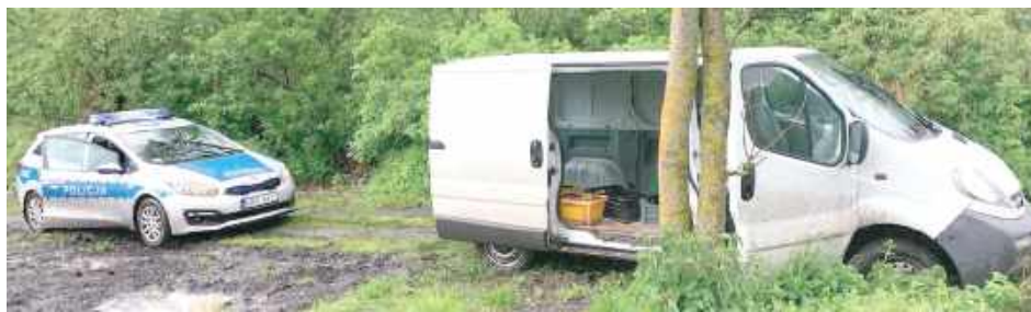
Uciekinier zatrzymany został dopiero po trwającym kilkanaście minut pościgu w Niedźwiadzie Dużej (gmina Łaziska), gdzie pozostawił swój pojazd na jednej z polnych dróg i kontynuował ucieczkę pieszo