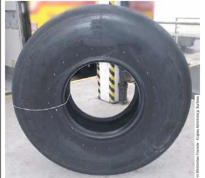
Próbowano przewieźć objęte sankcjami opony do samolotów

Celnicy zatrzymali w Koroszczynie (gm. Terespol) transport pięć ton opon do cywilnych samolotów marki Boeing. Tranzyt tego typu towaru przez terytorium Białorusi i Rosji podlega sankcjom.