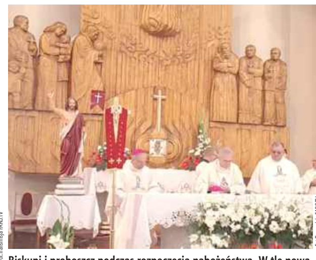
Biskupi i proboszcz podczas rozpoczęcia nabożeństwa. W tle nowa nastawa ołtarza

godziny dłużej pracować, aby zarobione pieniądze przeznaczyć na przyspieszenie budowy świątyni.