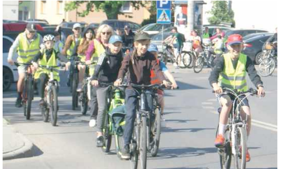
Wydarzenie zgromadziło około 130 uczestników