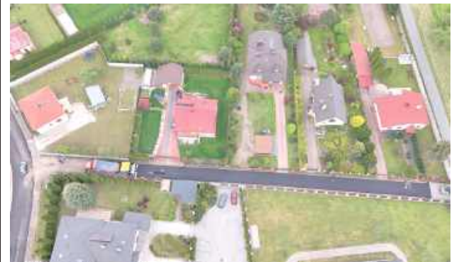
Pierwsza była ul. Cerkiewna