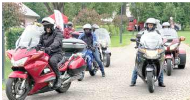
Parada motocyklistów przejechała ulicami miasta

W ramach wydarzenia, 24 maja w międzyrzeckim parku Potockich odbył się także festyn. Na mieszkańców czekały konkursy z nagrodami, pokazy ratownictwa medycznego i straży pożarnej, koncerty rockowe i darmowa grochówka.