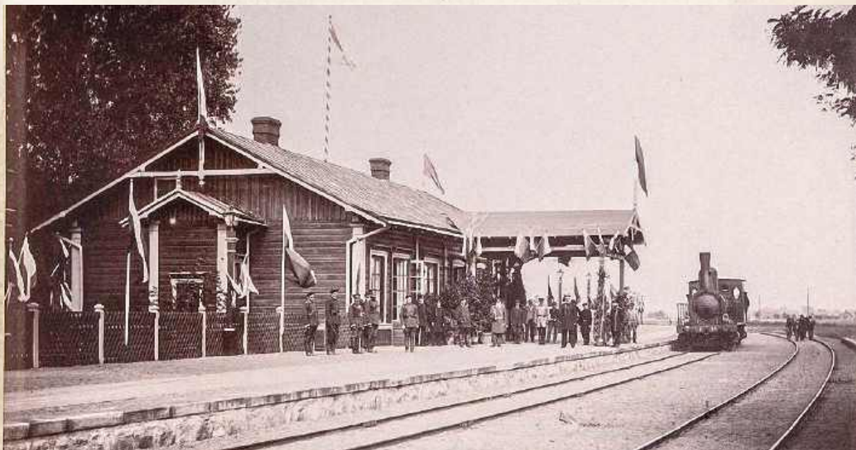
Należąca do wojska część dworca w Dęblinie. Zdjęcie wykonano 3 września 1892 roku. Tego dnia do twierdzy przybył Aleksander III, chcąc obserwować walne manewry, jakie miały być przeprowadzone w twierdzy - tak wówczas nazywało się miasto - lwangorodzkiej. Tory do Dębina doprowadzono w 1876 roku. Początkowo to była stacja końcowa linii z Łukowa, rok później przyłączono ją do szlaku prowadzącego przez Warszawę na wschód do Lublina i Kowla. W 1885 z kolei otworzono odnogę w kierunku Zagłębia. Fotografia znaleziona na str. bazakolejowa.pl pochodzi z rosyjskiego albumu dokumentującego wizytę.