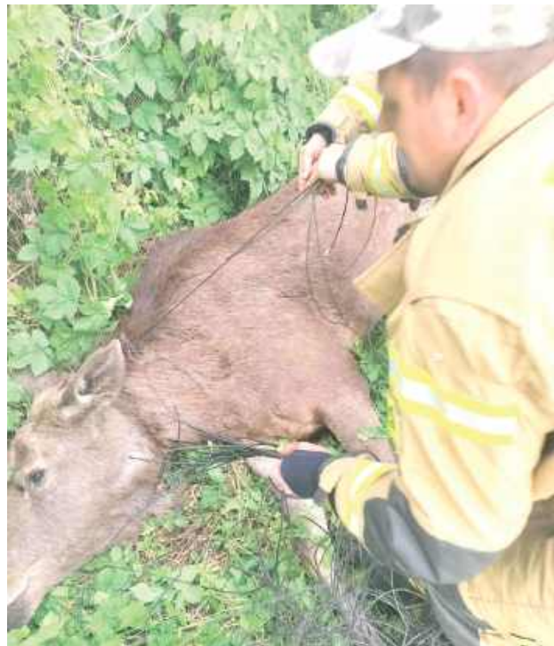
Po długim oczekiwaniu strażacy wreszcie mogli uwolnić łośa z pułapki, jaką stworzyły kable światłowodu

- To było przy drodze biegnącej przez Mościce Dolne. łoś znajdował się w jamie, w której było błoto. musiał być zwinięty i wyrzucony ten kabel Najpierw czekaliśmy na weterynarza kilka godzin, a jak przyjechał, to stwierdził, że bez strzelby nie da leku. Trzeba było przywieźć strzel-