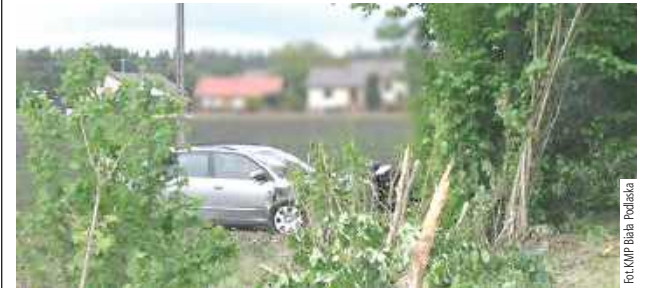
Kierująca Audi 32-latką nie dostosowała prędkości do panujących warunków, wpadła w poślizg, po czym zjechała na lewe pobocze

Biała Podlaska: Niemal 2 promile alkoholu miała w organizmie 32-latką, która wpadła w poślizg i wjechała w pole. Podróżowała z dwójką dzieci.