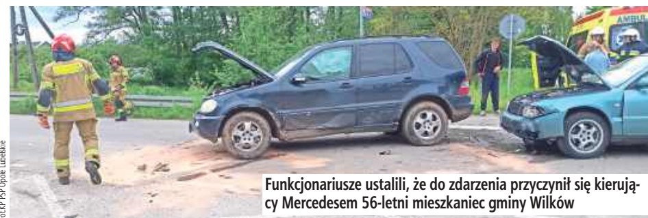
Funkcjonariusze ustalili, że do zdarzenia przyczynił się kierujący Mercedesem 56-letni mieszkaniec gminy Wilków

Funkcjonariusze ustalili, że do zdarzenia przyczynił się kierujący Mercedesem 56-letni mieszkaniec gminy Wilków. Mężczyzna, skręcając w lewo na skrzyżowaniu oznaczonym znakami określającymi pierwszeństwo przejazdu, nie ustąpił pierwszeństwa przejazdu i wjechał na skrzyżowanie