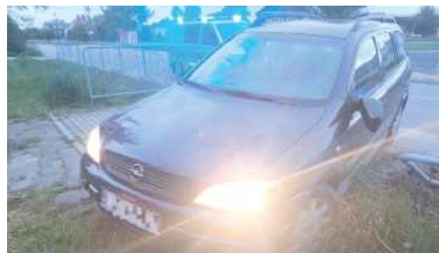
Mężczyzna na widok zatrzymującego go do kontroli policjanta spanikował i, by uniknąć kontroli, nagle skręcił we wjazd do posesji

W sobotę, 17 maja wieczorem policjanci z Wydziału Ruchu Drogowego Komendy Powiatowej w Opolu Lubelskim kontrolowali prędkość na drogach powiatu opolskiego. W Kowali Pierwszej (gmina Poniatowa) dali kierowcy Opla sygnał do zatrzymania.