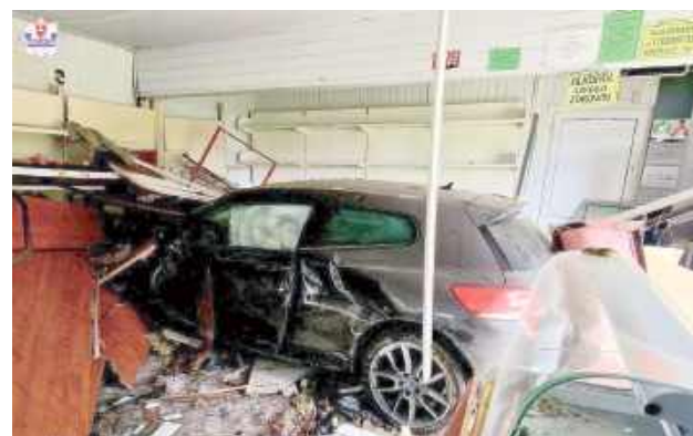
Auto wjechało do wnętrza opuszczonego sklepu

21-letni mieszkaniec województwa mazowieckiego, wracając Volkswagenem z Chełma