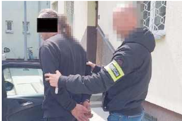
Kryminalni odzyskali większość skradzionego sprzętu, który jeden z „amatorów cudzego mienia” przechowywał w wynajętym garażu

Biała Podlaska: Za szeregiem kradzieży z włamaniami do domków na terenie ogródków działkowych odpowie dwóch mężczyzn. Jeden z nich odpowie również za kierowanie pojazdem wbrew zakazowi.