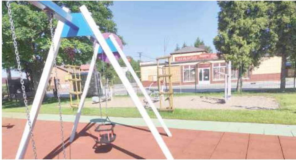
Plac zabaw przy ul. Długiej w Opolu Lubelskim. Z widokiem na budynek, w którym powstać miałyby nowa sala pożegnań zmarłych

- To miejsce relaksu dla całych rodzin, bez troskiej zabawy dla dzieci i spokojna dzielnica, w której mieszkamy od lat, a nie miejsce na kolejny dom pogrzebowy - mówią zdenerwowani mieszkańcy jednego z osiedli na terenie Opola Lubelskiego. W ich bliskim sąsiedztwie ma powstać sala pożegnań zmarłych.