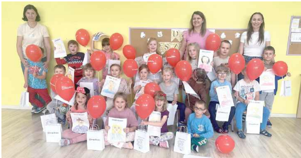
Dzieci z dumą prezentowały przygotowane portrety