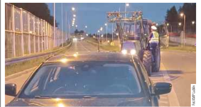
Ciągniki rolnicze, pojazdy wolnobieżne oraz inne tego typu maszyny nie mogą poruszać się po drogach ekspresowych ani autostradach

Lublin: W rejonie al. Solidarności policjanci zauważyli kierującego ciągnikiem rolniczym, który jechał na drogę ekspresową S12.