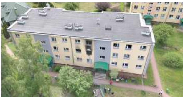
Na szczęście wybuch nie naruszył konstrukcji budynku

- Przyrost ciśnienia zniszczył stolarkę w klatce schodowej, głównie drzwi i okna do lokali