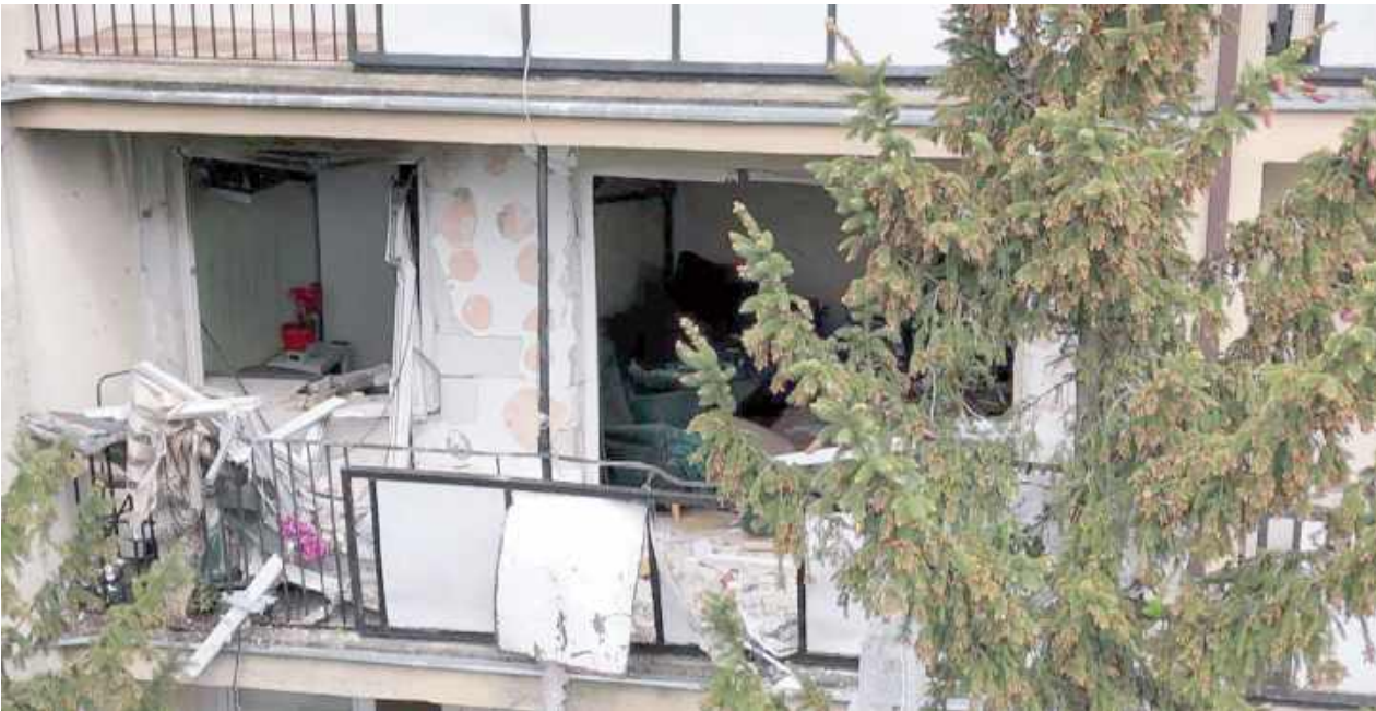
Wybuch gazu poważnie zniszczył mieszkanie na pierwszym piętrze

W budynku wielorodzinnym w Piszczacu wskutek wybuchu gazu ciężko poparzony został 66-letni właściciel mieszkania. Ludzie, którzy widzieli spalony i wyburzony lokal i zrujnowaną klatkę schodową są przerażeni potężną siłą powstałą przy eksplozji.