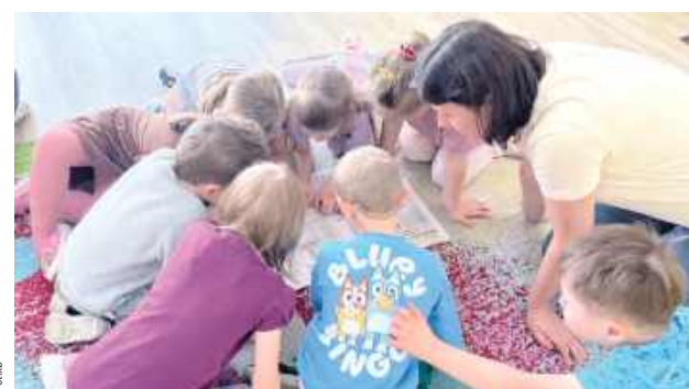
Maluchy z zainteresowaniem przeglądały tamy Wspólnoty