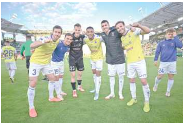
Motor zanotował w zakończonym sezonie 14 zwycięstw, 7 remisów i 13 porażek

Motor Lublin pod wodzą Mateusza Stolarskiego dokonał niemożliwego. Meczem z Radomiakiem Radom żółto-biało-niebiescy zakończyli sezon 2024/25, a zwycięstwo dało im najlepsze w historii siódme miejsce w najwyższej klasie rozgrywkowej w Polsce.