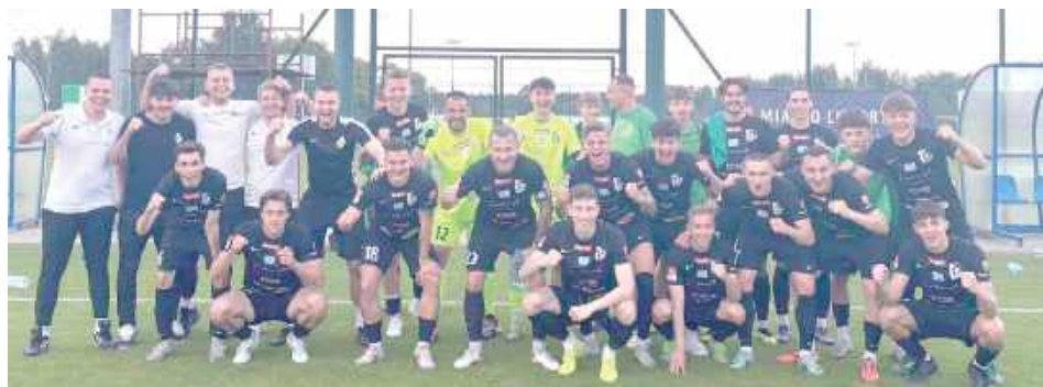
Radość piłkarzy Podlasia po zwycięstwie 3:0 w Lubartowie