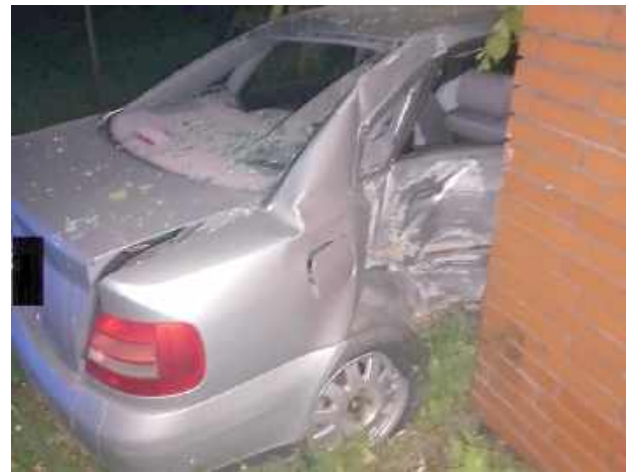
Jazdę zakończył, uderzając w ogrodzenie posesji. Następnie próbował uciec z miejsca zdarzenia

Z informacji przekazanej dyżurnemu międzyrzeckiego komisariatu wynikało, że funkcjonariusze Straży Granicznej ujęli nietrzeźwego kierowcę, który uderzył w ich auto. Po tym