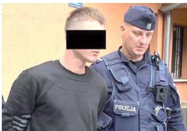
27-latek usłyszał już zarzuty, ale może być ich więcej, bo sprawa jest rozwojowa

Tuż przed świętami Wielkanocnymi mieszkańcy powiatu puławskiego zaczęli odbierać dziwne telefony, z których wynikało, że ktoś z ich bliskich spowodował poważny wypadek i konieczne jest wpłacenie kaucji. Do komendy policji w Puławach zaczęły napływać sygnały o próbach oszustwa. Tego dnia przestępcy zadzwonili również do mieszkanki Puław.