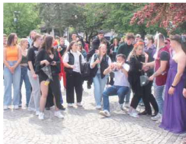
Reakcja studentów była też godna uwagi...

Bialski prezydent świętowanie się bawił podczas studenckich juwenaliów w obu bialskich uczelniach.