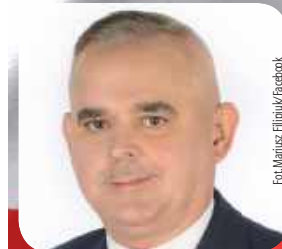
Mariusz Filipiuk (PSL)