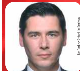
Dariusz Stefaniuk (PiS)