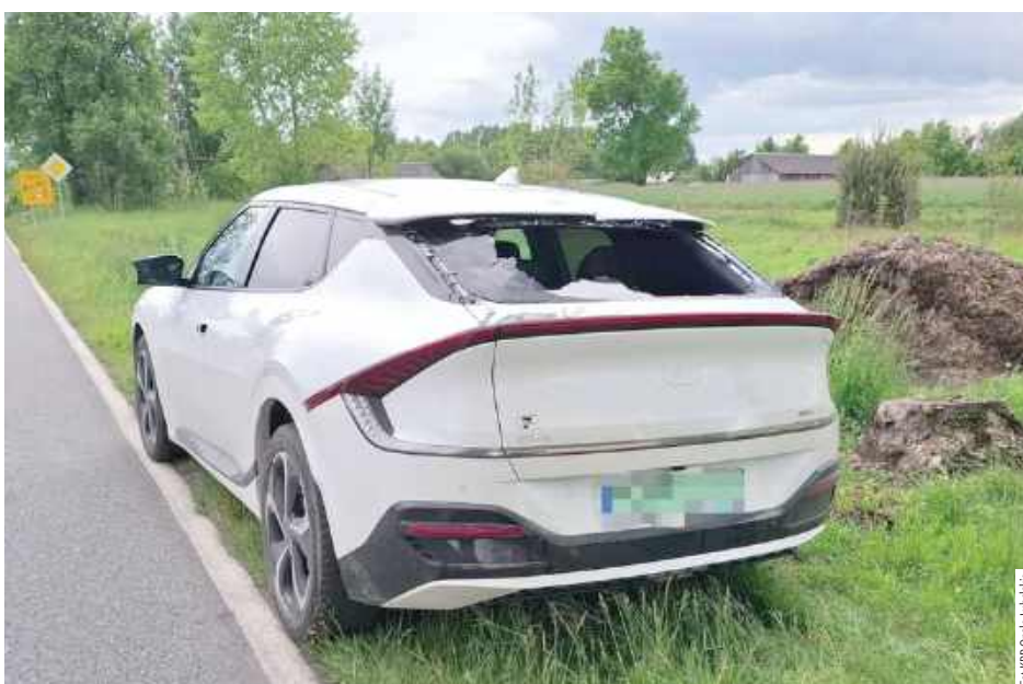
Cyklista nie zachował bezpiecznej odległości i najechał na tył osobówki, uderzając głową w tylną szybę i ją rozbijając