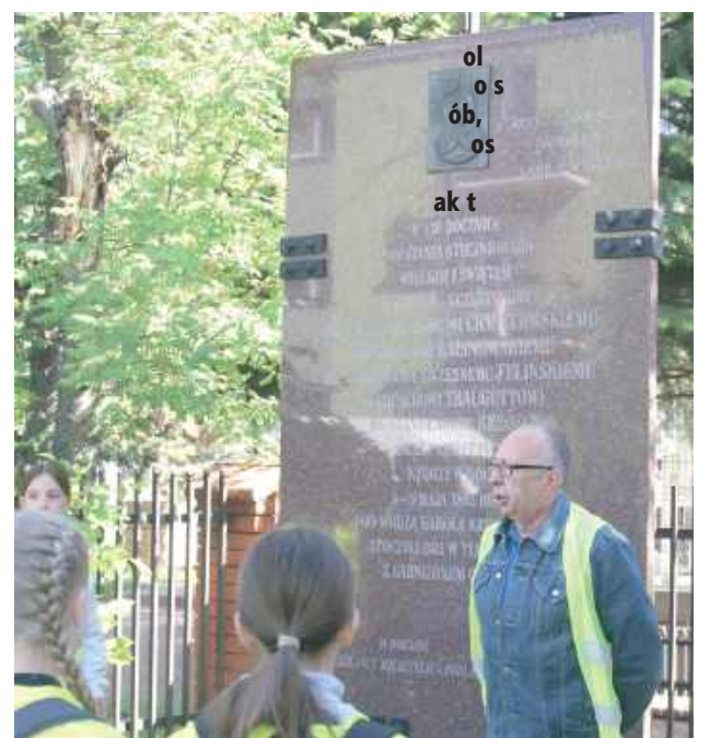
Swoją przygodę rozpoczęli pod pomnikiem upamiętniającym atak powstańców na koszary