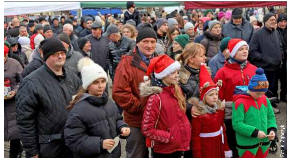
Miejska Wigilia w 2024 roku cieszyła się ogromnym zainteresowaniem.

Władze zapraszają wszystkich do wzięcia udziału w tych wyjątkowych wydarzeniach, które z pewnością na długo pozostaną w pamięci. To doskonała okazja, by wspólnie spędzić czas, dzielić się radością i cieszyć się świąteczną atmosferą w Kolbuszowej. kz