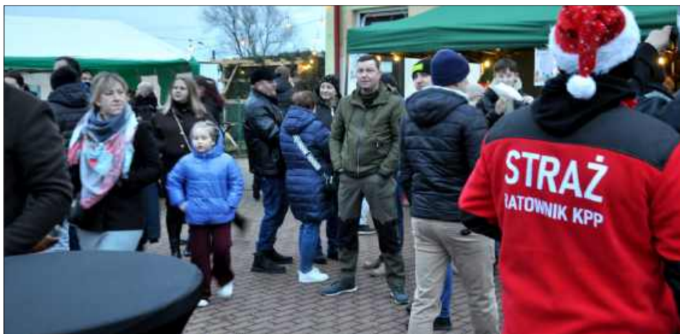
Mieszkańcy i przyjeźdźni chętnie wzięli udział w tegorocznej edycji Farmy Choinkowej w Domatkowie.