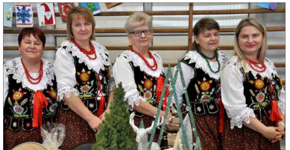
Pyszne przekąski serwowały także gospodynie z Ostrów Tuszowskich.