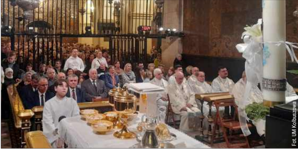
Zebrani modlili się podczas mszy świętej w czasie tzw. „Godziny Łaski”.