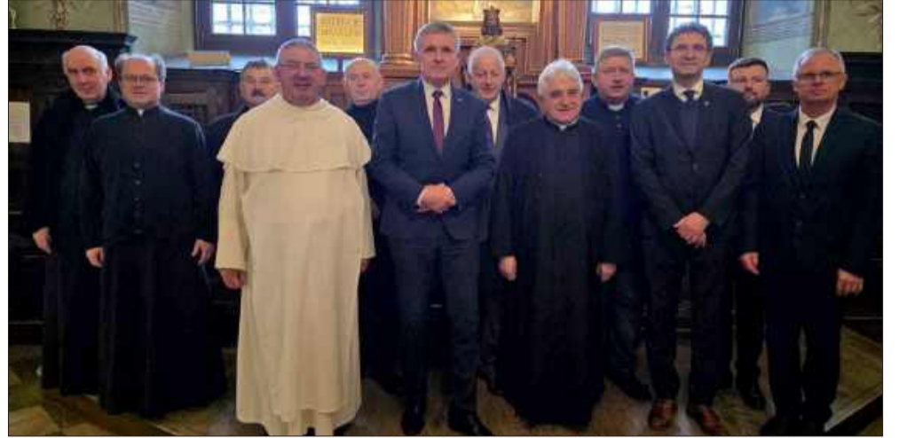
W pielgrzymce wzięli udział nie tylko władze i mieszkańcy, ale również kapłani.

W poniedziałek, 8 grudnia, w uroczystość Niepokalanego Poczęcia Najświętszej Maryi Panny, miała miejsce pielgrzymka mieszkańców gminy Kolbuszowa na Jasną Górę. Była to okazja do odnowienia zawierzenia wspólnoty Matce Bożej Jasnogórskiej.