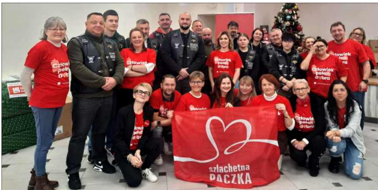
Wolontariuszom w rozwożeniu i dostarczeniu paczek pomogła m.in. Grupa Motocyklowa Moto-Bracia. Polska.

To wyjątkowy czas, który pokazuje, jak ważne jest, aby w momentach trudnych nie zostawić nikogo samego. Dzięki tak wspaniałym ludziom, jak wolontariusze Szlachetnej Paczki, święta w Kolbuszowej będą pełne miłości, radości i nadziei, a dla wielu rodzin będą one niezapomnianym, pełnym dobroci doświadczeniem. bp