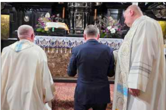
Burmistrz odnowił akt zawierzenia.