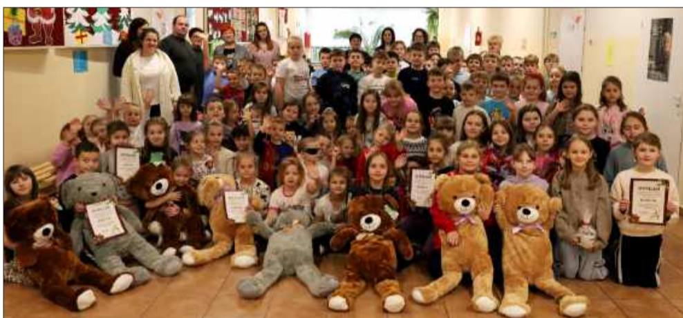
Uczniowie ze Szkoły Podstawowej w Cmolasie otrzymali dyplomy i upominki za udział w tej wyjątkowej świątecznej akcji.

Tytuł Bałwanka o Najdłuższych Włosach oraz tytuł Najbardziej Złotego Bałwanka dla Przedszkola Niepublicznego Ochronka Św. Józefa w Cmolasie.