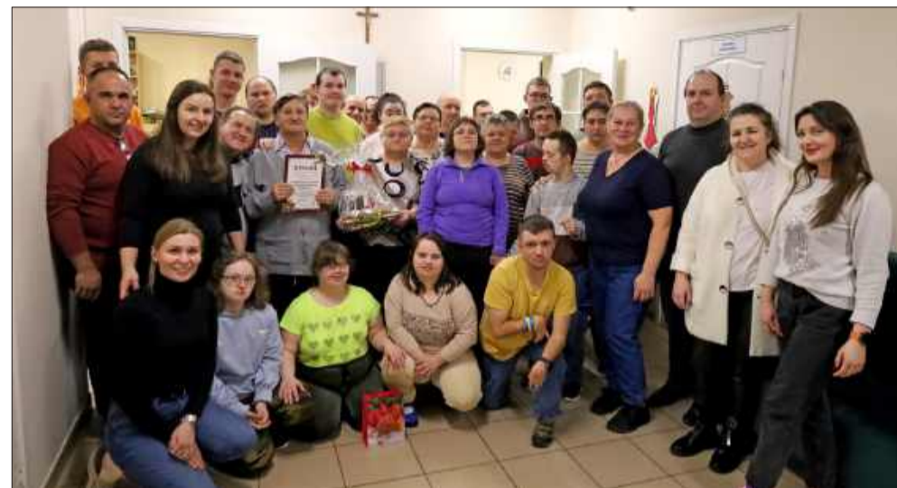
Warsztaty Terapii Zajęciowej w Cmolasie również otrzymały nagrody.