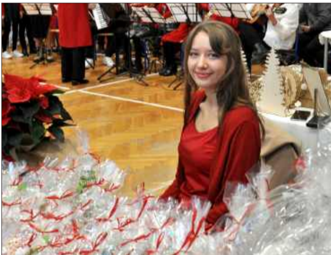
Podczas spotkania panowała świąteczna atmosfera.