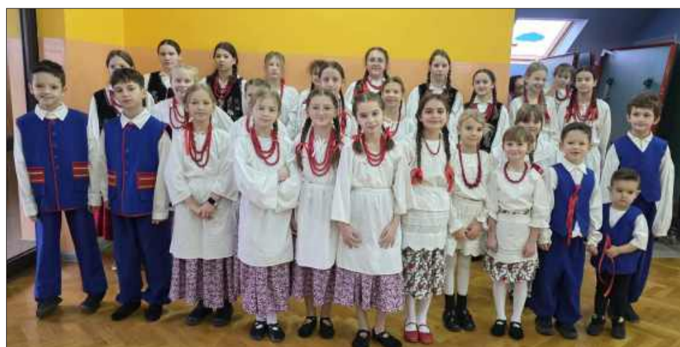
Młodzi „Lesianie” pokazali się na scenie.