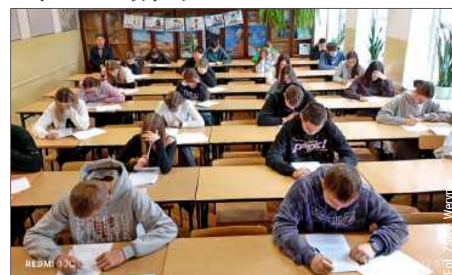
ZSA-E w Weryni bierze udział w konkursie.

Pierwszym etapem konkursu był test składający się z 25