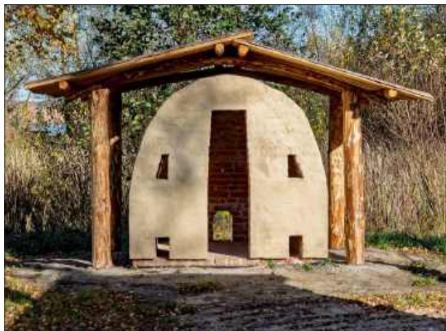
Jednym z elementów jest piec garncarski.

Zagroda garncarska stanowi istotną część oferty edukacyjnej skansenu. Jak informuje skansen, w chałupie będą odbywać