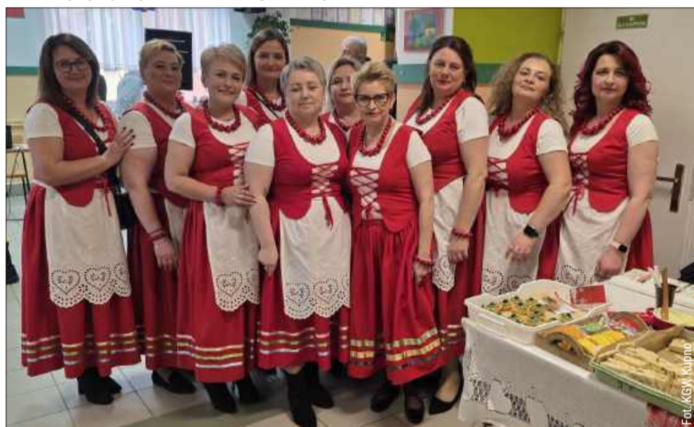
Na kiermaszu gościnnie pojawiły się gospodynie z KGW Łączki Kucharskie.