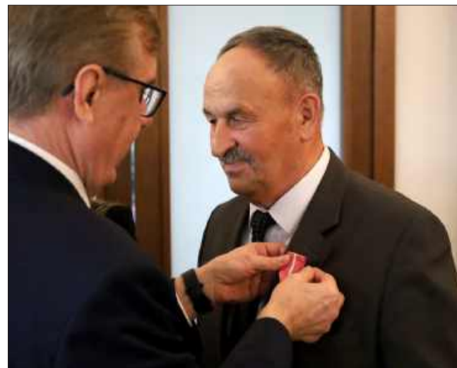
Wydarzenie w gminie Dzikowiec było szczęśliwym momentem dla wszystkich.

Choć z przyczyn niezależnych nie wszyscy małżonkowie mogli być obecni, każdy z nich zasługuje na słowa uznania i gratulacje za wspaniałą, pełną miłości podróż przez życie. To wydarzenie to nie tylko uroczystość, ale także hołd dla wartości, które trwają przez wiele lat — miłości, szacunku, wzajemnego wsparcia i oddania.