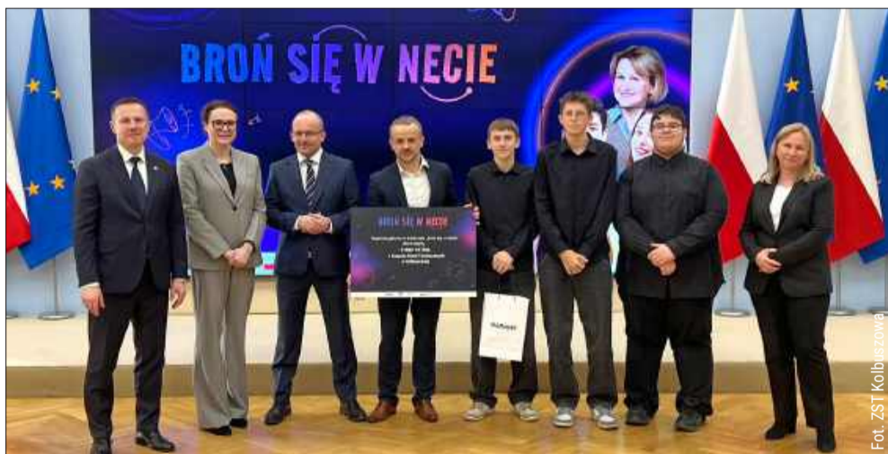
Uczniowie zdobyli główną nagrodę.