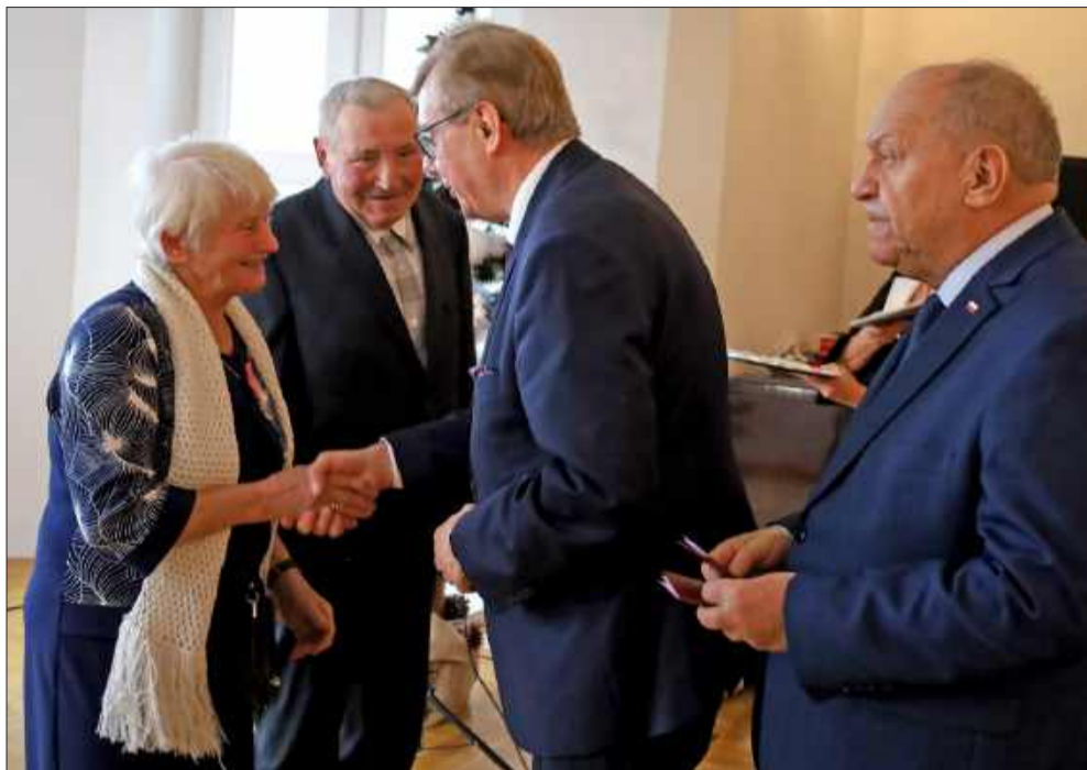
Małżonkowie zostali docenieni, a ich jubileusz był wyjątkową okazją do świętowania.

W środę, 10 grudnia malowniczy Dworek Blotnickich w Dzikowcu stał się miejscem wyjątkowej uroczystości. To tutaj, w podniosłej atmosferze, odbyła się ceremonia wręczenia medali małżonkom, którzy w 2024 roku obchodzili jubileusz 50-lecia pożycia małżeńskiego. Był to moment pełen wzruszeń, radości oraz wspomnień o wspólnych latach przeżytych u boku drugiej osoby.