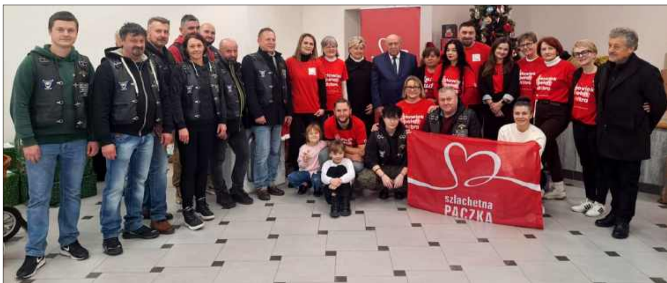
Weekend Cudów to wyjątkowy moment dla wszystkich. To właśnie wtedy wielotygodniowy wysiłek wolontariuszy zostaje doceniony poprzez wdzięczność potrzebujących rodzin.