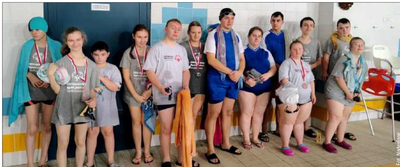
Zawody zgromadziły blisko 100 uczestników.

tegoriach: dziewcząt i chłopców. Zawodnicy mieli do pokonania dystanse 15, 25 i 50 metrów różnymi stylami pływackimi, a także wystartowali w sztafecie mieszanej 4x25 metrów w stylu dowolnym. Wszyscy uczestnicy,