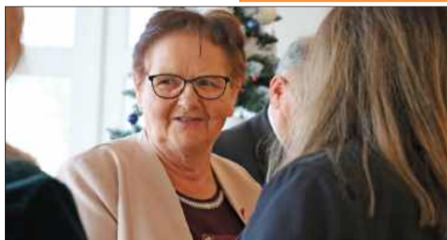
Jubileusz to ważny moment dla małżonków i ich rodzin.