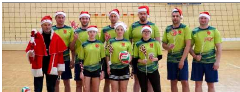
Drugie miejsce przypadło Hucinie.