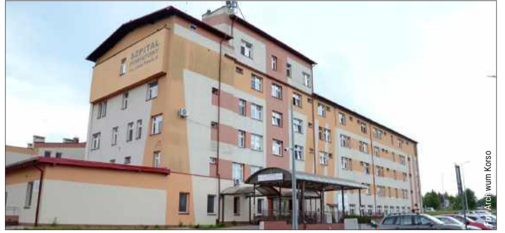
Sytuacja w polskich szpitalach powiatowych jest coraz bardziej dramatyczna. Co będzie z placówką w Kolbuszowej?

– Kto odpowiada za ochronę zdrowia w Polsce? Nie odpowia-