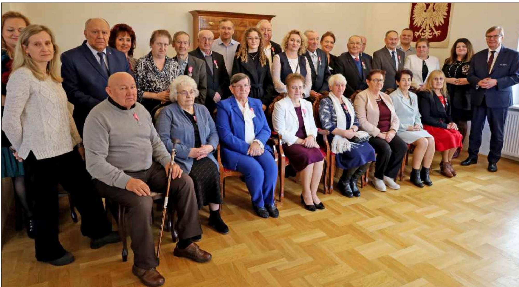
50 lat to 18250 dni przeżytych razem. To imponująca liczba.