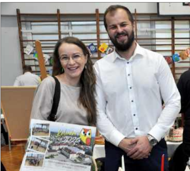
Swoje stoisko miała także Rada Rodziców z SP w Cmolasie.