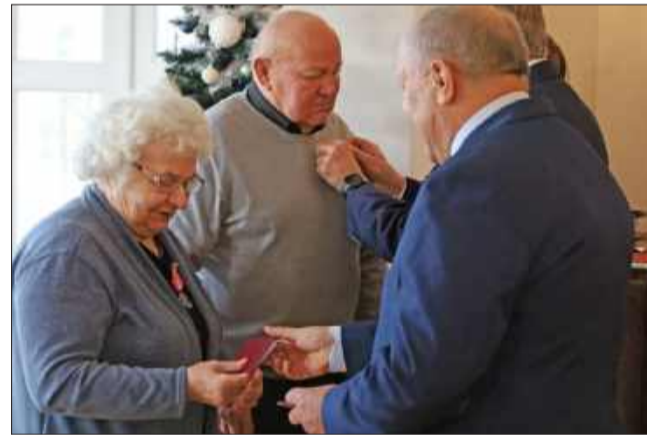
Medale są uznaniem za długie lata spędzone w małżeństwie.