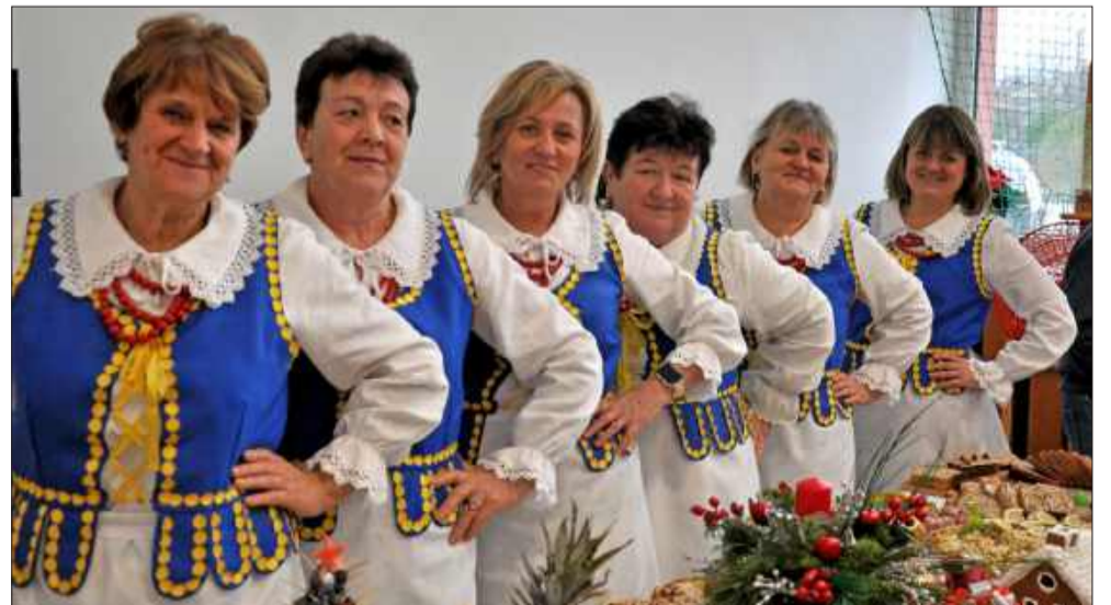
Nie zabrakło także Prymul z Mechowca.