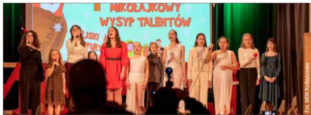
Mikołajkowy Wysyp Talentów cieszył się ogromnym zainteresowaniem.

Dopełnieniem atmosfery mikołajkowej zabawy były liczne atrakcje. „Chory Animator” zadbał o małych uczestników, którzy radośnie bawili się z miko-