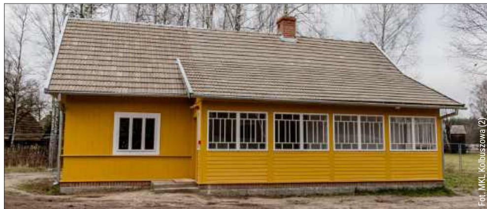
Tak prezentuje się nowopowstała chałupa.

interaktywnych zajęć edukacyjnych oraz ochronę lokalnego dziedzictwa kulturowego. Zainstalowany w ramach projektu monitoring wizyjny zapewnia większe bezpieczeństwo w skansenie, integrując się z systemem ochrony parku etnograficznego.