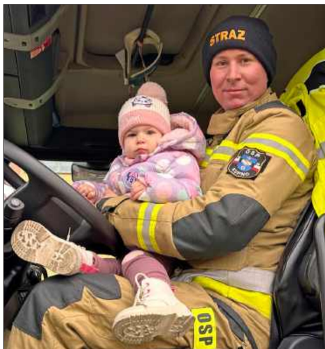
Druhowie z Kupna dali dzieciom sporo radości.