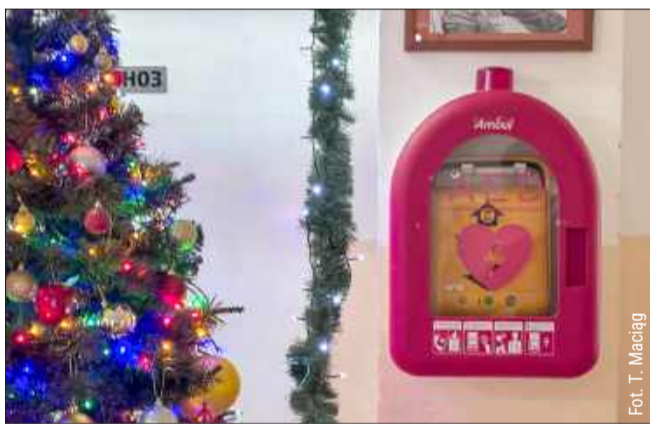
Zamontowano AED w kolbuszowskim liceum.

Defibrylator w kolbuszowskim liceum to krok w stronę zwiększenia bezpieczeństwa uczniów i pracowników szkoły, ale także wszystkich osób, które znajdują się w tym budynku w razie potrzeby. Dzięki temu urządzeniu pomoc może być udzielona natychmiastowo,