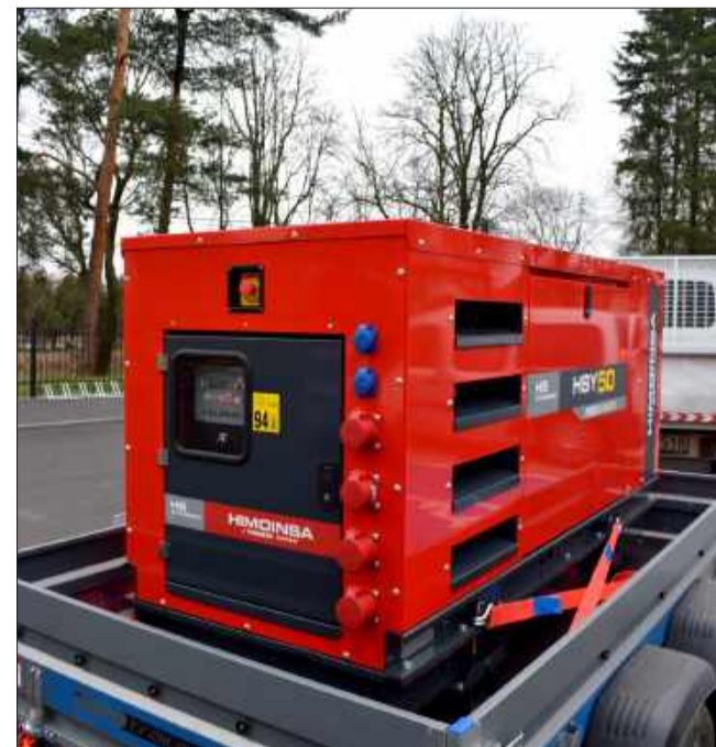
Gmina zakupiła też agregat prądowładczy.

Program Ochrony Ludności i Obrony Cywilnej na lata 2025–2026 to jeden z kluczowych elementów wspierających samorządy w przygotowaniu do ewentualnych kryzysów, w tym klęsk żywiołowych czy awarii infrastruktury. Dzięki takim inwestycjom gminy stają się coraz bardziej odporne na nieprzewidziane zdarzenia.