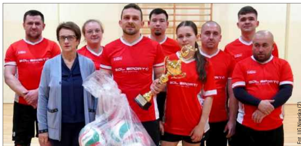
Zwycięzcami zawodów okazały się Kosowy.