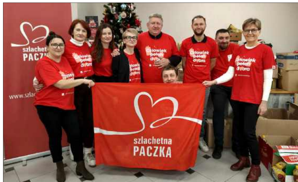
Radość z tego, że można pomóc potrzebującym jest wielka.