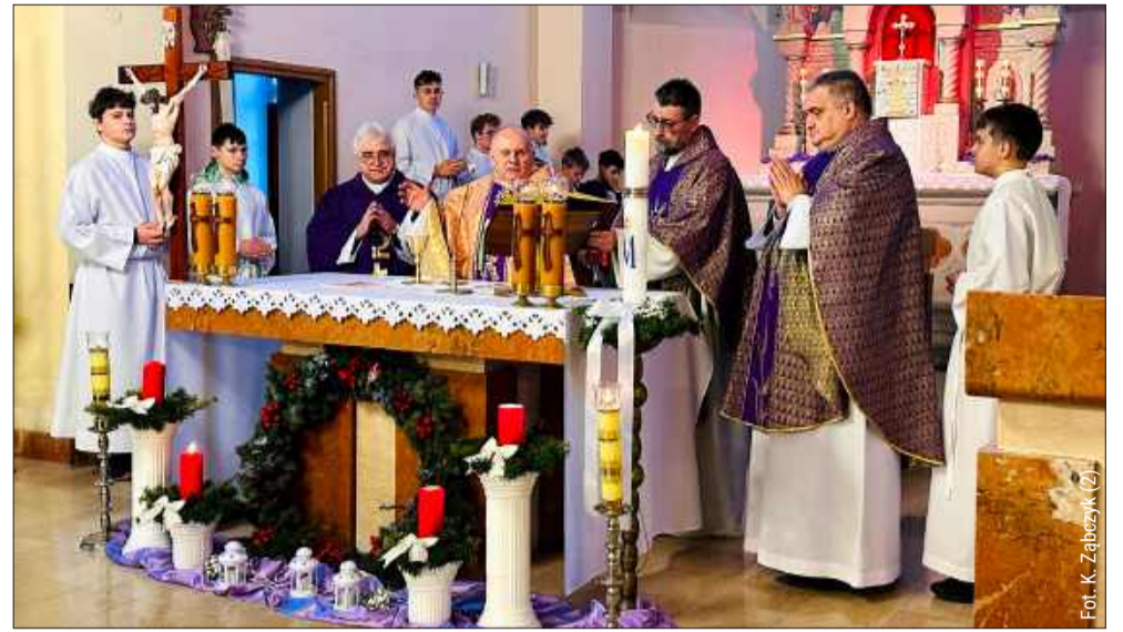
Uroczysta msza święta odbyła się w kościele w Kupnie.

– Rozmawialiśmy dużo, a tematy to Kupno, ziemia kolbuszowska, mówił o was, o mieszkańcach Kolbuszowej,