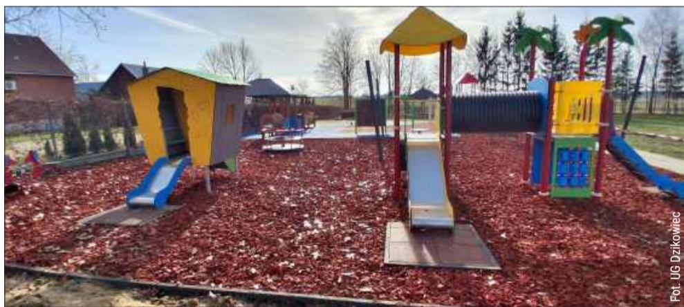
W listopadzie 2025 roku zakończono realizację projektu. Oto efekt.