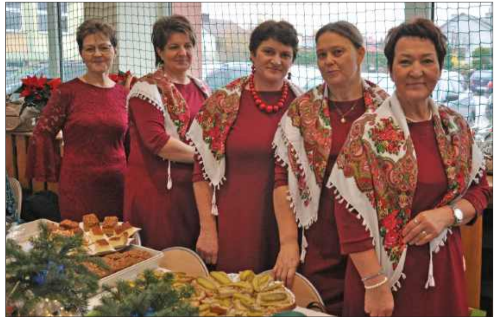
Panie z KGW stanęły na wysokości zadania, sprawiając, że spotkanie było wyjątkową okazją to skosztowania pyszności oraz milego spędzenia wspólnie przedświątecznego czasu.