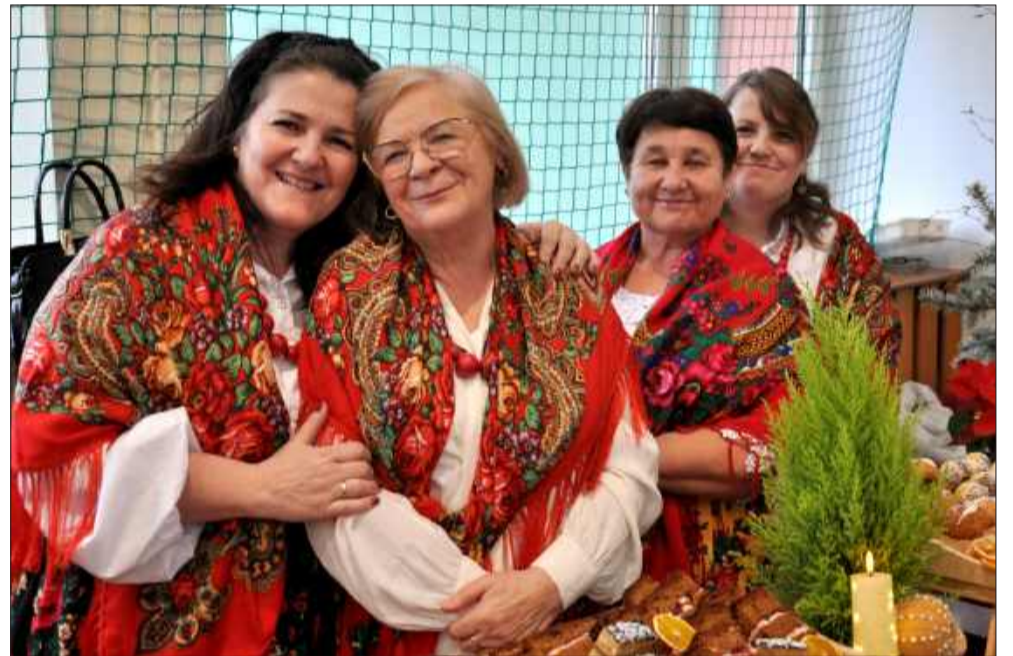
Nie mogło zabraknąć także pań z KGW w Cmolasie.