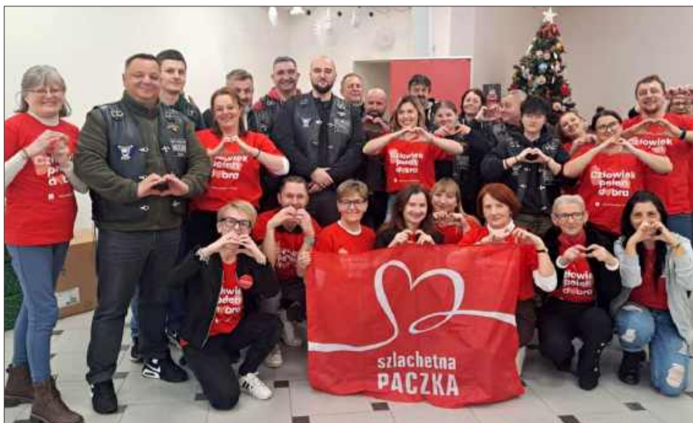
Wolontariusze mają wielkie serca do pomagania.