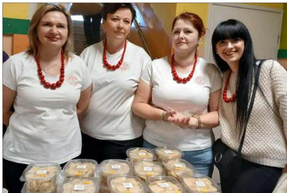
KGW Kupno przygotowało pyszne przekąski.