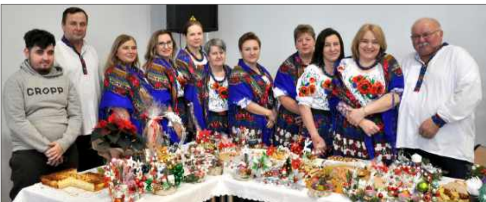
Swoje bogate stoisko miało także KGW z Porąb Dymarskich.