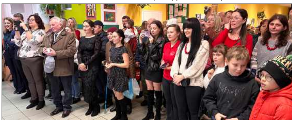
Widownia nie zawiodła.