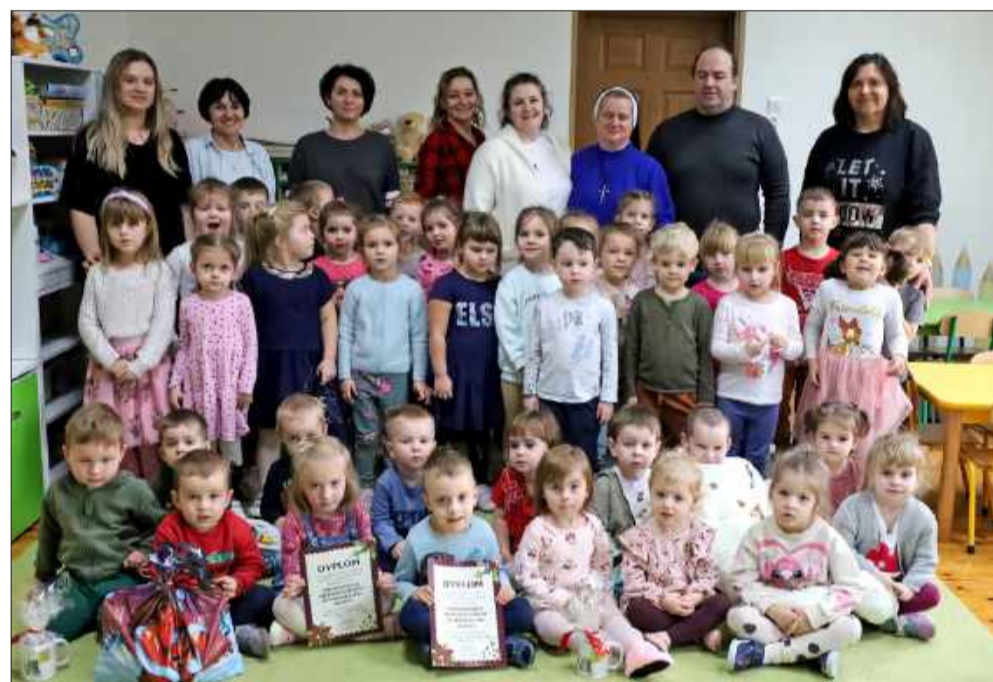
Przedszkolaki z Ochronki Św. Józefa w Cmolasie także dekorowały swoje bałwanki.