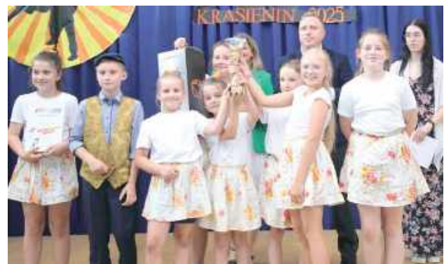
Młodzież prezentowała się wspaniale