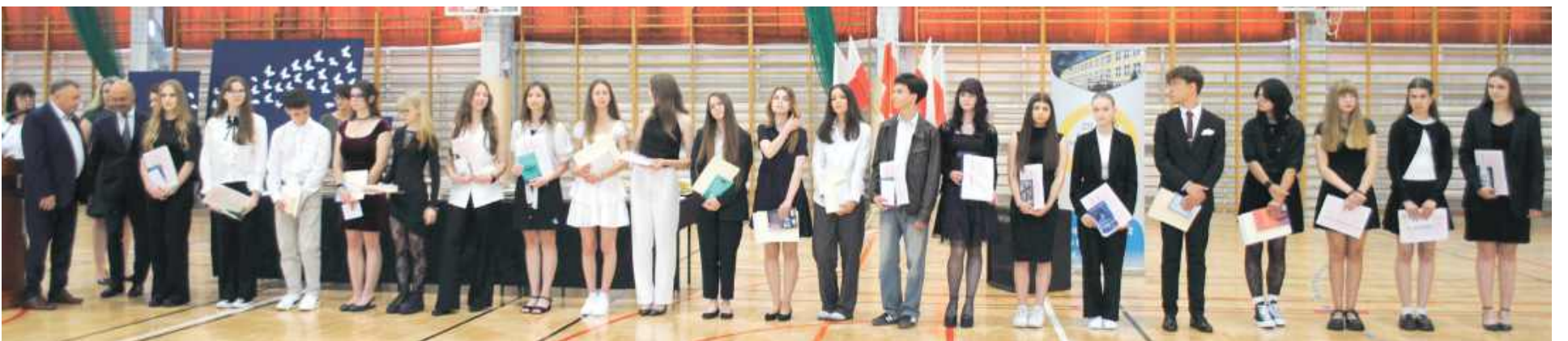
Uczniowie ze średnią 5,0 i wyższą

Ponad 100 osób otrzymało nagrody książkowe i dyplomy. Zostali nagrodzeni za wyniki w nauce, w olimpiadach przedmiotowych i zawodach sportowych, reprezentowanie szkoły i frekwencję.