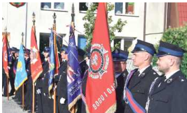
Poczty sztandarowe jednostek OSP z gminy Niemce

Sprawdzian w prawdziwym boju. Spłonął dom w Nasutowie