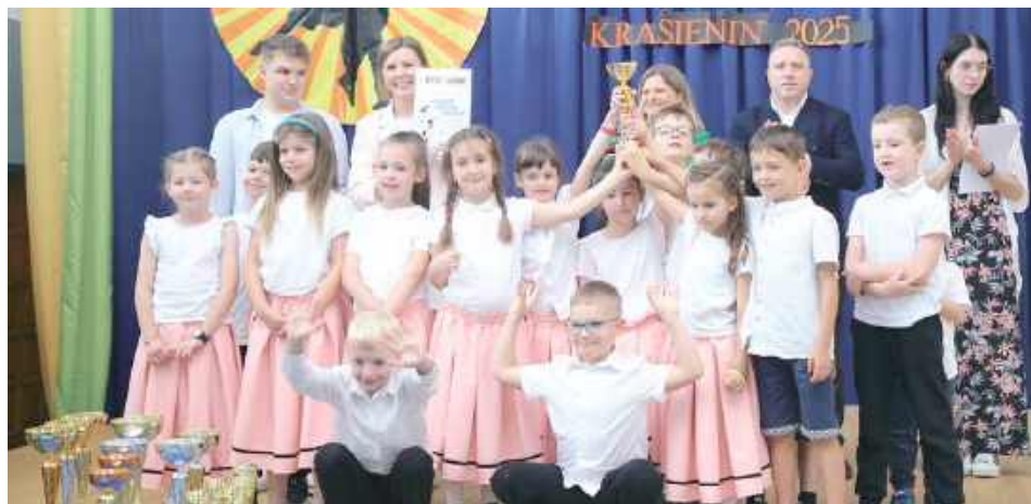
Jest radość i siła