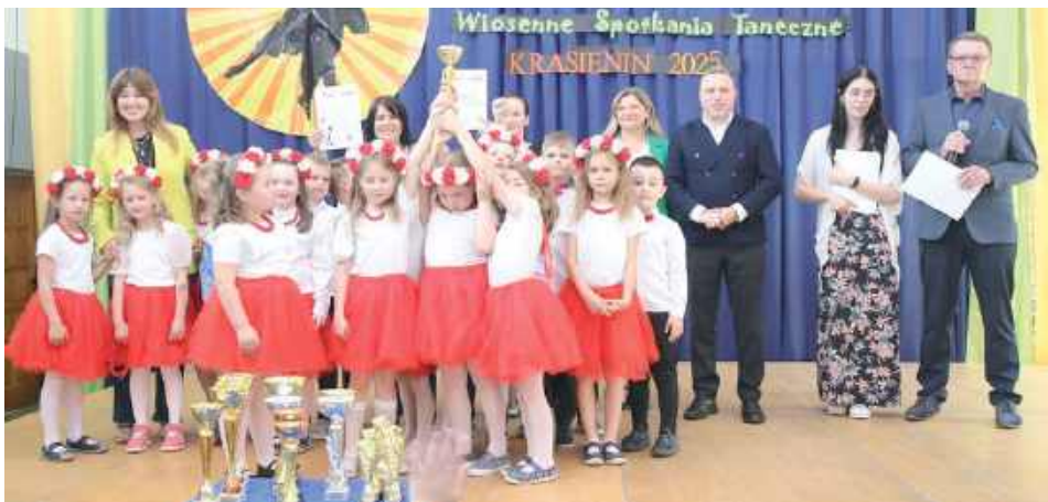
Czas na pierwsze sukcesy