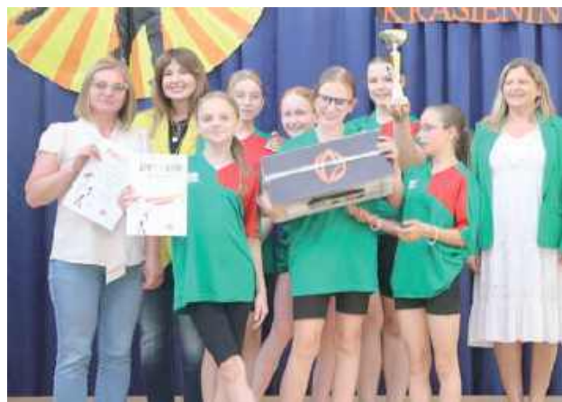
To początek drogi na wielkie sceny

Kotowskiej. 2 miejsce - „ZESPÓŁ ARTYSTYCZNY KLAS PIĄTEJ” z ZS w Ciecierzynie prowadzony przez Magdaleny Stawecką,