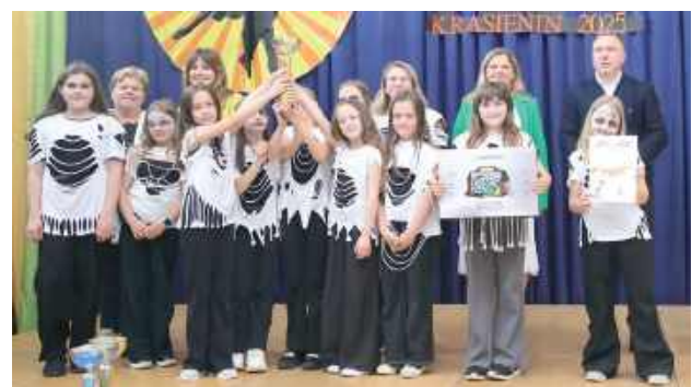
Efektownie i z gracją