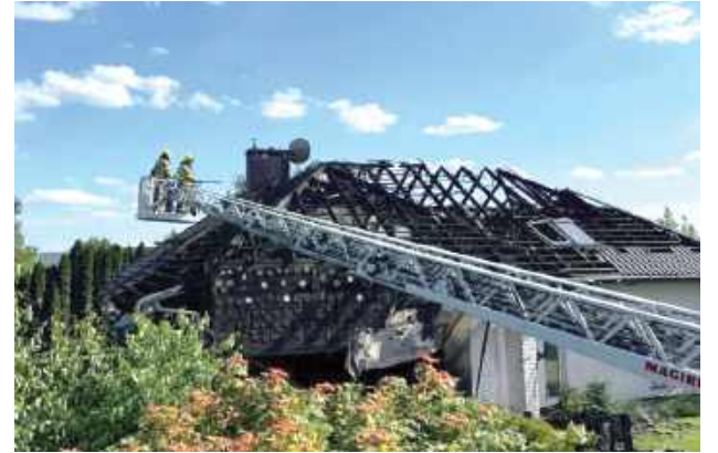
Dwie jednostki z OSP Nasutowa pojawiły się na miejscu tragedii już 5 min. od zgłoszenia. Mimo błyskawicznej akcji i pomocy dodatkowych jednostek dom niemal doszczętnie spłonął

Sprawdzian w prawdziwym boju. Spłonął dom w Nasutowie