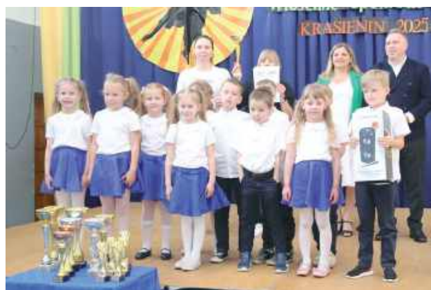
Kolejna piękna prezentacja nagrodzona