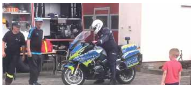
Oprócz zabaw na placu dzieci mogły zapoznać się z oprzyrządowaniem policji i straży pożarnej

przy remizie OSP i trwał kilka godzin. Oprócz części sportowej dostępne były stoiska z jedzeniem oraz przestrzeń dla dzieci.