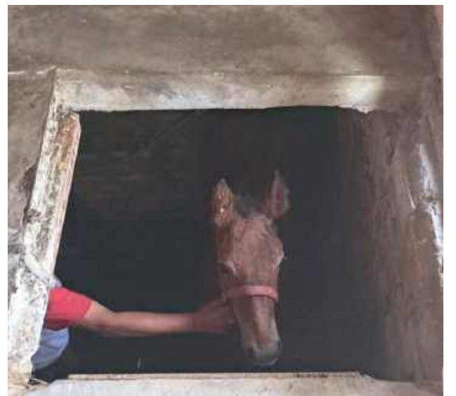
23 czerwca o godz. 19.21 strażacy z OSP Ostrówek zostali skierowani przez stanowisko dowodzenia KP PSP do Cegielni. Żrebak wpadł tam do piwnicy. Jak informuje OSP Ostrówek, zwierzę znajdowało się na głębokości 2 metrów. Strażacy zabezpieczyli miejsce zdarzenia i przy pomocy pasów transportowych wyciągnęli źrebaka na powierzchnię.