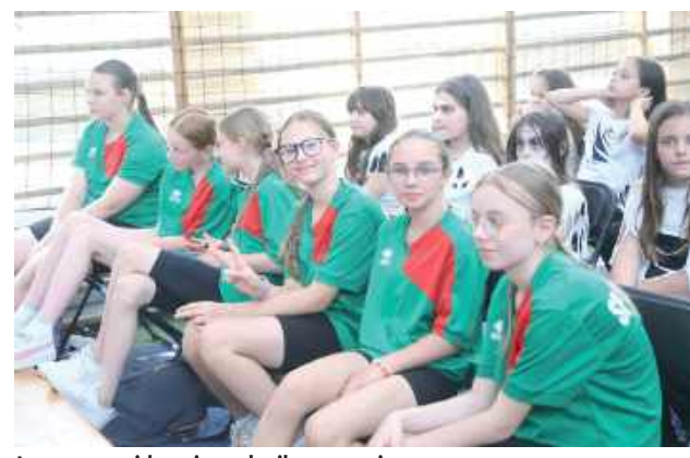
Jeszcze na widowni, za chwilę na scenie