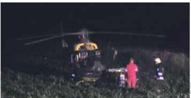
Śmigłowiec LPR, który przetransportował poszkodowaną kobietę do szpitala w Łęcznej

Jak informuje OSP KSRG Jeziorzany, 24 czerwca około godz. 23 w Węgielcach doszło do wybuchu gazu w budynku mieszkalnym. Według informacji dyżurnego KP PSP w Lubartowie, w wybuchu zostały poszkodowane dwie osoby. Według zgłoszenia były one przytomne. Na miejscu zdarzenia interweniowały zastępy JRG Lubartów, OSP KSRG Jeziorzany, OSP KSRG Michów. Działania straży pożarnej polegały na zabezpieczeniu miej-