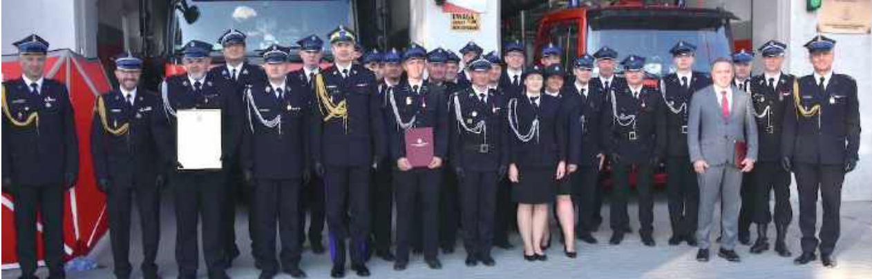
Strażacka brać przed remizą w Nasutowie

W Nasutowie uroczysto obchodzono Dzień Strażaka. Święto było też okazją, aby oficjalnie włączyć miejscową jednostkę Ochotniczej Straży Pożarnej do Krajowego Systemu Ratowniczo-Gaśniczego.