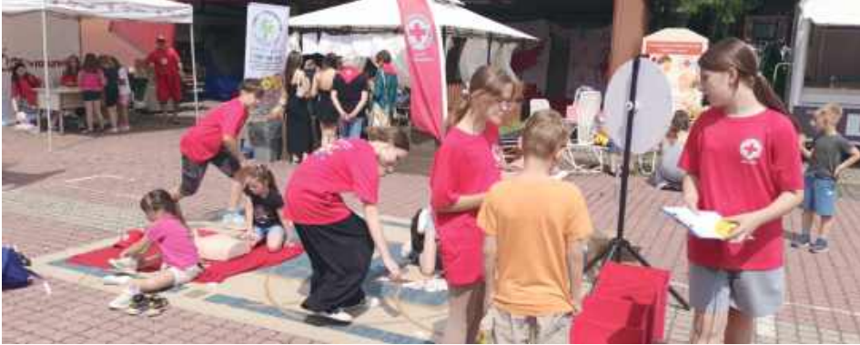
To tu wolontariusze uczyli dzieci zasad udzielania pierwszej pomocy - warto je sobie przypomnieć przed wyruszeniem na wakacje!

W piątek, 27 czerwca na placu przed siedzibą Polskiego Czerwonego Krzyża przy ul. Jana Pawła II w Lubartowie odbył się piknik pod nazwą „Bezpieczne Wakacje”, który przyciągnął ponad setkę dzieci z opiekunami.