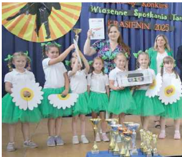
Ciesz się sukcesy młodych tancerek

Kategoria klasy 4-8 SP 1 miejsce - „ZESPÓŁ ARTYSTYCZNY” ze SP w Nasutowie pod kierunkiem Anety