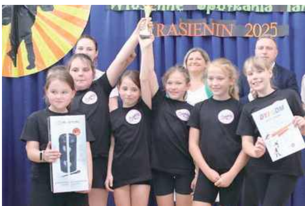
Kolejna kategoria i kolejny sukces