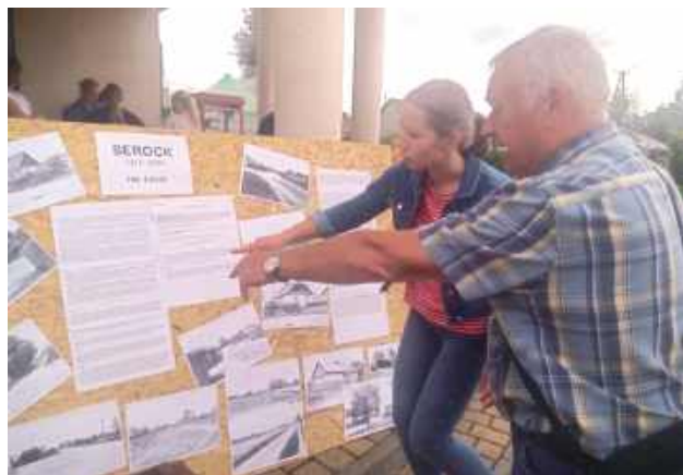
Na tablicy mogliśmy przeczytać dzieje Serocka. Dla wielu, niektóre informacje były nowością

W Serocku odbył się piknik zorganizowany z okazji obchodów 708-lecia istnienia miejscowości.