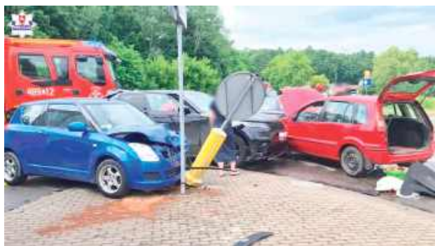
Do kolizji doszło w piątkowe popołudnie na skrzyżowaniu ulic Opolskiej i Fabrycznej

Do kolizji doszło w piątkowe popołudnie na skrzyżowaniu ulic Opolskiej i Fabrycznej. Jak ustalili policjanci skierowani na miejsce, 53-latkę jadącą od strony centrum miasta, nie zatrzymała się na znaku STOP i wjechała na skrzyżowanie, wymuszając pierwszeństwo. Jej pojazd uderzył w prawidłowo jadące Suzuki, za którego kierownicą znajdowała się 62-letnia mieszkanka gminy Poniatowa.