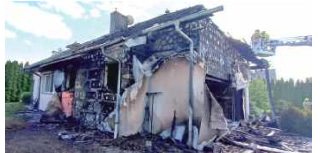
Mieszkańcy Nasutowa są poruszeni tragedią poszkodowanych, którzy zostali bez dachu nad głową. Na 6 lipca planowana jest zbiórka pieniędzy na odbudowę domu

Druhowie z OSP w Nasutowie nie mieli czasu na długie świętowanie. W niedzielę (22 czerwca) otrzymali zgłoszenie o groźnym pożarze budynku mieszkalnego w swojej miejscowości. Dwie jednostki bojowe były na miejscu już pięć minut po alarmie. Do strażaków z Nasutowa dołączyło jeszcze osiem zastępów z Niemiec, Dysa, Jakubowic Konińskich Kolonii oraz PSP z Lublina. Niestety, silny wiatr utrudniał akcję gaśniczą