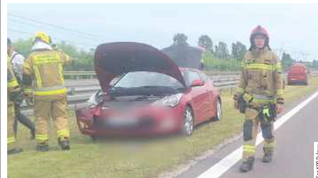
Kobieta kierująca hyundaiem chciała uniknąć zderzenia z renault, ale straciła panowanie nad autem, uderzyła w bariery energochłonne, a następnie w scanię, którą wyprzedzał kierowca renault

Do zdarzenia doszło w poniedziałek, 23 czerwca, po południu na drodze ekspresowej S17 na wysokości Markuszowa. W kierunku Lublina jechała ciężarówka, za nią osobowe renault, którego kierowca - 30-latek z powiatu białobrzskiego (woj. mazowieckie), postanowił wyprzedzić ciężarówkę. Mężczyzna przestawił się na drugi pas ruchu. Jadąc nim swoim hyundaiem 24-latką z Warszawy, widząc manewry kierowcy renault i chcąc uniknąć zderzenia z pojazdem, który znalazł się na jej pasie, wykonała manewr, wskutek którego straciła panowanie nad autem i uderzyła w bariery energochłonne. Hyundai odbił się od nich i uderzył w scanię.