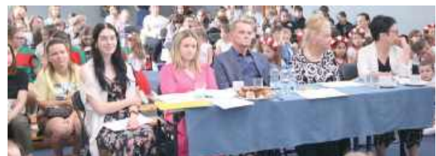
Publiczność i jury obserwują taneczne popisy w Krasieninie