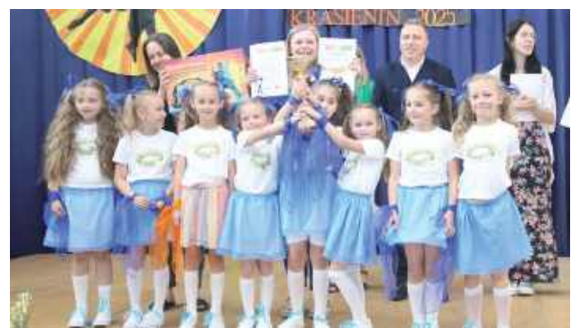
Pierwsze kroki i już uznanie