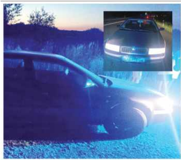
Kierowca Skody odpowie za jazdę w stanie nietrzeźwości

Po podejściu do kierującego natychmiast zauważył, że kierujący autem mężczyzna znajduje się najprawdopodobniej pod działaniem alkoholu – mówił bełkotliwie, miał problemy z zachowaniem równowagi, a jego oddech wyraźnie wskazywał na spożycie alkoholu. Świadek, widząc zaistniałą sytuację, wezwał policjantów, którzy niezwłocznie zjawili się