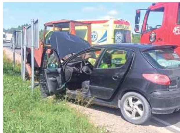
Do zderzenia doszło 26 czerwca około godz. 9.40. Według podkomisarza Jagody Maj z KPP w Lubartowie kierujący ciągnikiem rolniczym mieszkaniec gminy Ostrów Lubelski, wyjeżdżając z drogi podporządkowanej, nie ustąpił pierwszeństwa kierującej Peugeotem mieszkance tej samej gminy i doprowadził do zderzenia. Obydwoje kierujący byli trzeźwi, nikt nie ucierpiał. Sprawca został ukarany mandatem.

Jak informuje OSP Ostrów Lubelski, w akcji brały udział zastępy OSP w Ostrowie Lubelskim i JRG Lubartów, pogotowie ratunkowe i policja.