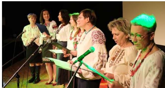
Вчительський гурт «Мелодія»