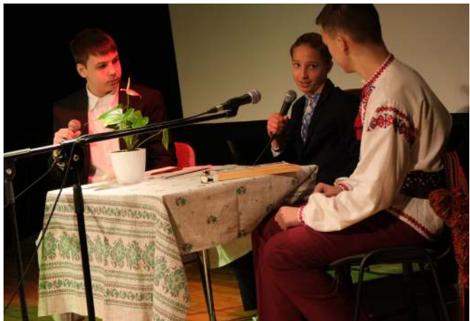
Учні згадують постать Маркіяна Шашкевича