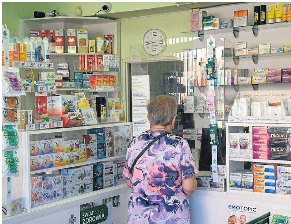
Apteki nie można sobie otworzyć - ot tak, jak zwykłego sklepu z warzywami czy kwiatami

- W przypadku, gdy przedsiębiorca zaprzestał spełniać warunki do prowadzenia działalności reglamentowanej, to obowiązkowo organ jest wszczęcie postępowania w przedmiocie cofnięcia zezwolenia na prowadzenie apteki ogólnodostępnej. Odnosząc się do apteki ogólnodostępnej prowadzonej w Wojcieszowie, to wskazać należy, że decyzja w tym przedmiocie została wydana przez Dolnośląskiego Wojewódzkiego Inspektora Farmaceutycznego w dniu 4 maja 2022r. a jej powodem było naruszenie przez przedsiębiorcę prowadzącego aptekę obowiązujących przepisów. Przedsiębiorca od wskazanej decyzji wniosł odwołanie, które zostało rozpoznane przez Głównego In-