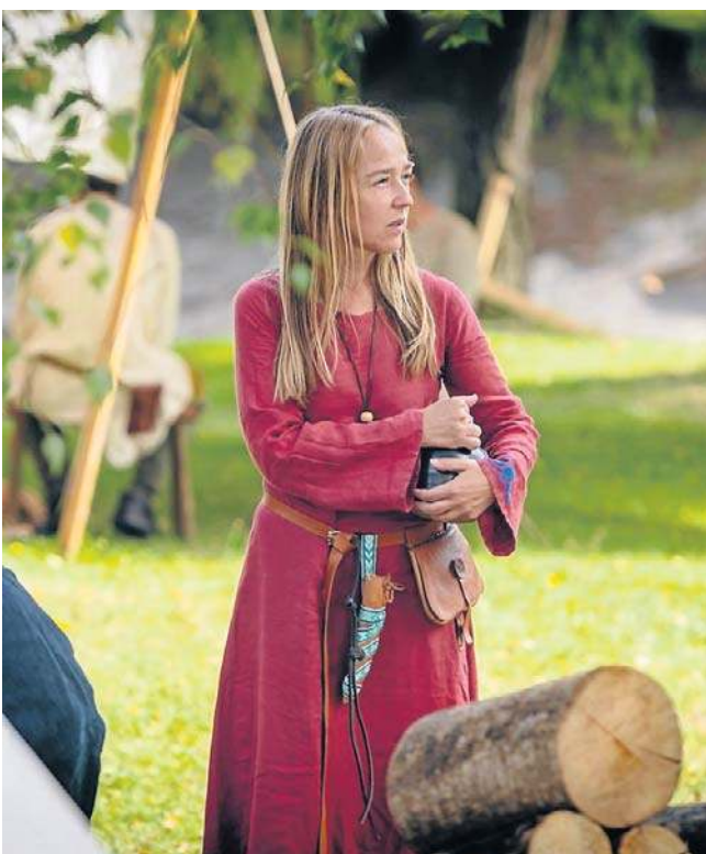
Wstęp na wydarzenie i wszystkie atrakcje był bezpłatny dla wszystkich