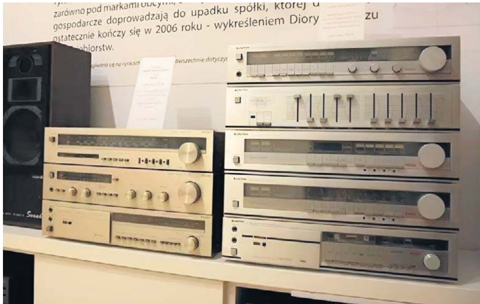
W Świdnicy powstawały obudowy do telewizorów, odbiorników radiowych oraz kolumn głośnikowych

Prezes zarządu Unitry poinformował, że firma podpisała z syndykiem Diory