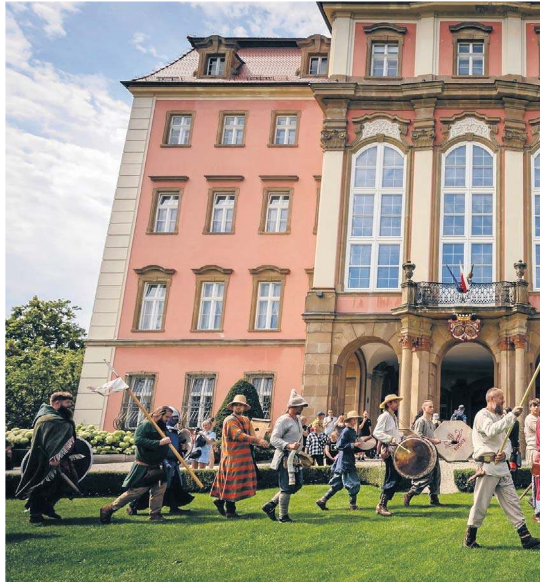
Monumentalne mury Książa ożyły dzięki obecności rycerzy, rzemieślników i artystów z dawnych