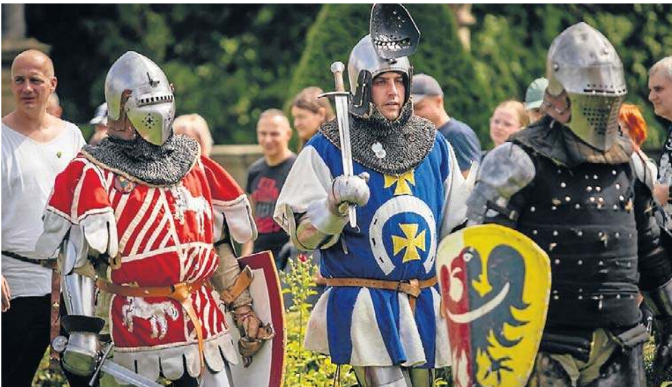
Nie zabrakło barwnych postaci, rycerzy w zbrojach i wojów