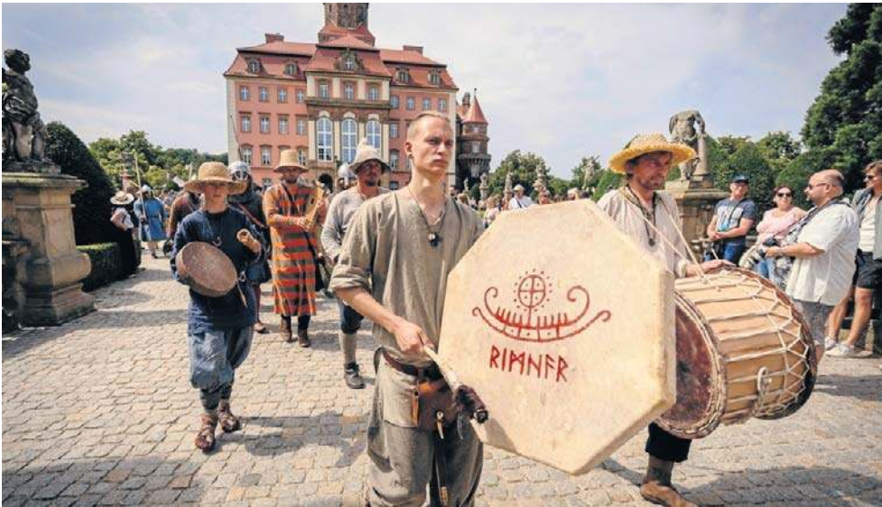
Na dwa dni zamek przeniósł się do średniowiecza