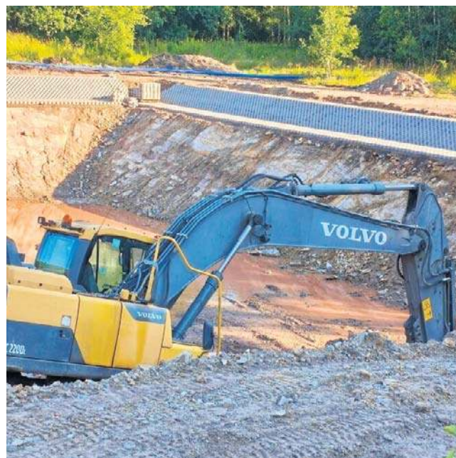
Zbiornik retencyjny będzie mieć około 900 metrów sześciennych pojemności

- Trwa przebudowa ul. Beethovena. Jest to bardzo duże zadanie. Cały czas wykonawca natrafia na kolejne trudności związane przede wszystkim z infrastrukturą podziemną.