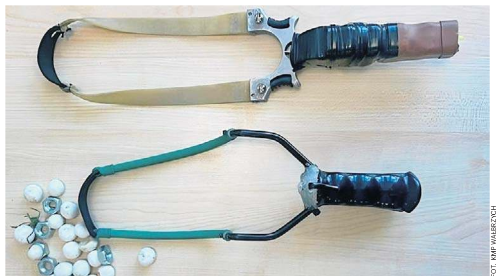
Podczas przeszukania mieszkania 47-latka kryminalni znaleźli dwie proce, metalowe kulki oraz nakrętki

- Jeden z mieszkańców zauważył, że mężczyzna ze swojego balkonu strzela z procy do gołębi. Postanowił więc wykręcić numer alarmowy. Mundurowi znaleźli na miejscu martwe gołębie. W mieszkaniu nikogo już nie było - mówi Marcin Świeży z Komendy Miejskiej Policji w Wałbrzychu.