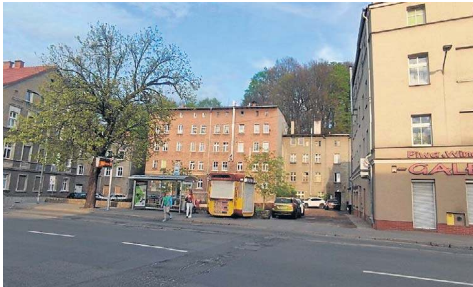
Kiosk stał do niedawna przy przystanku autobusowym przy ul. Mickiewicza

Kioski Ruchu stały kiedyś w miastach niemal co krok. Kupowanie w kioskach, czyli małych pawilonach z przeszkloną wystawą było doświadczeniem pokoleniowym, które łączy generacje wspólnymi wspomnieniami. Ci, którzy wychowali się