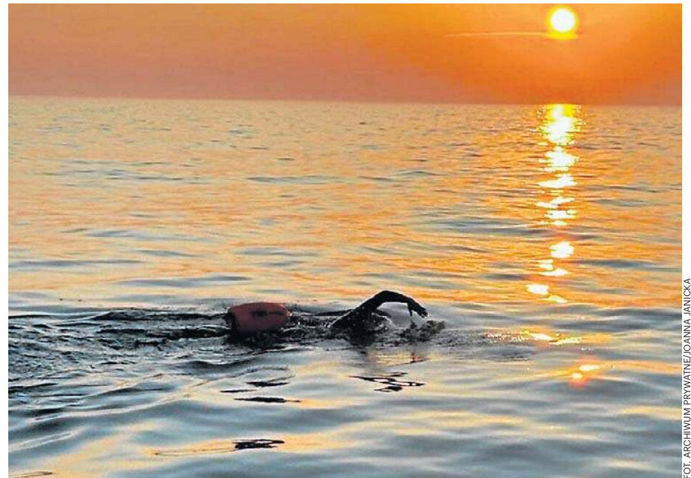
Zmiana trwała trzy godziny. W tym czasie każdy pływak przepłynął 10 km