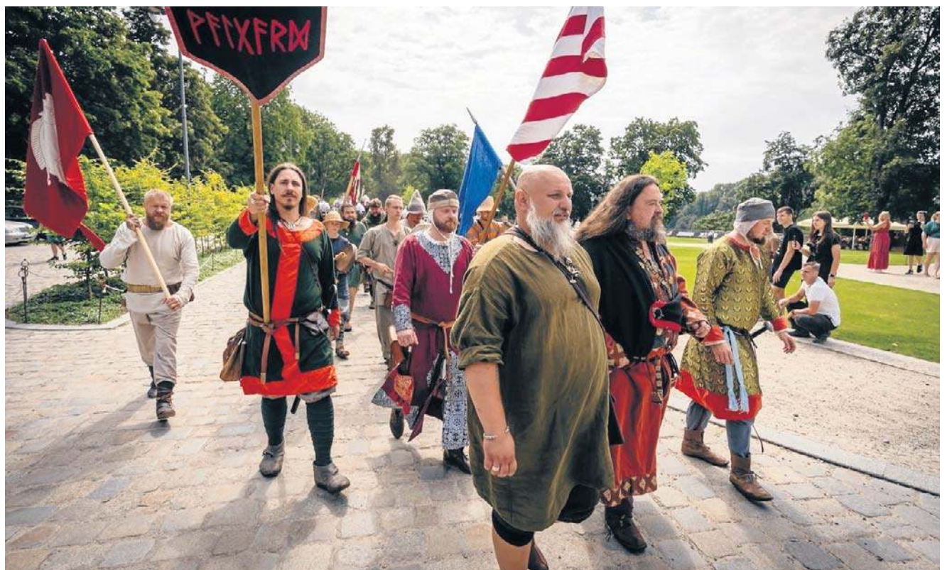
Weekend Rycerski to nie tylko widowisko – to żywa lekcja historii, zabawa i edukacja w jednym