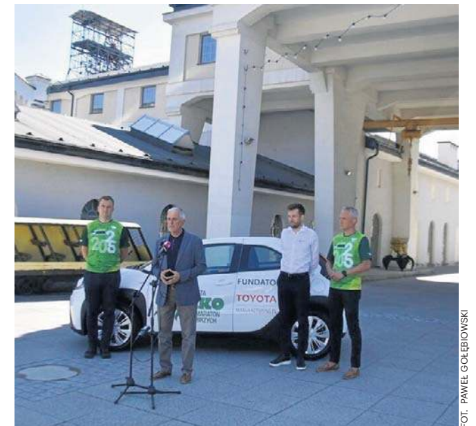
Organizatorzy półmaratonu zaprezentowali główną nagrodę

- Wystartujemy w Starej Kopalni i pobiegniemy w stronę Placu Grunwaldzkiego. Następnie skręcimy w prawo w ulicę Sikorskiego, odbijemy w lewo na Plac Teatralny i skierujemy się na Plac Magistracki i Rynek. Wbiegniemy w ulicę Moniuszki gdzie nastąpiła mała zmiana, bo na skrzyżowaniu Sikorskiego nadal trwa remont. Skrę-