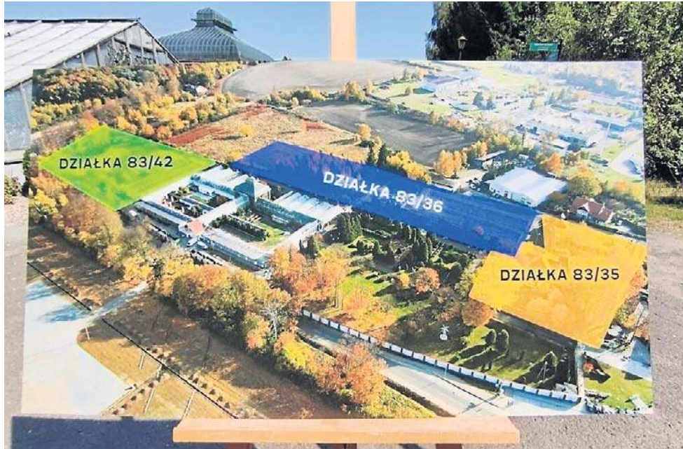
Koncepcja zagospodarowania terenów wokół Palmiarni już istnieje

Mowa oczywiście o właścicielach miasta oraz jego okolic przed II wojną światową, czyli rodzinie Hochbergów, a także o czasie powojennym, gdy Palmiarnia nadal działała z pozytywnym dla lokalnej społeczności