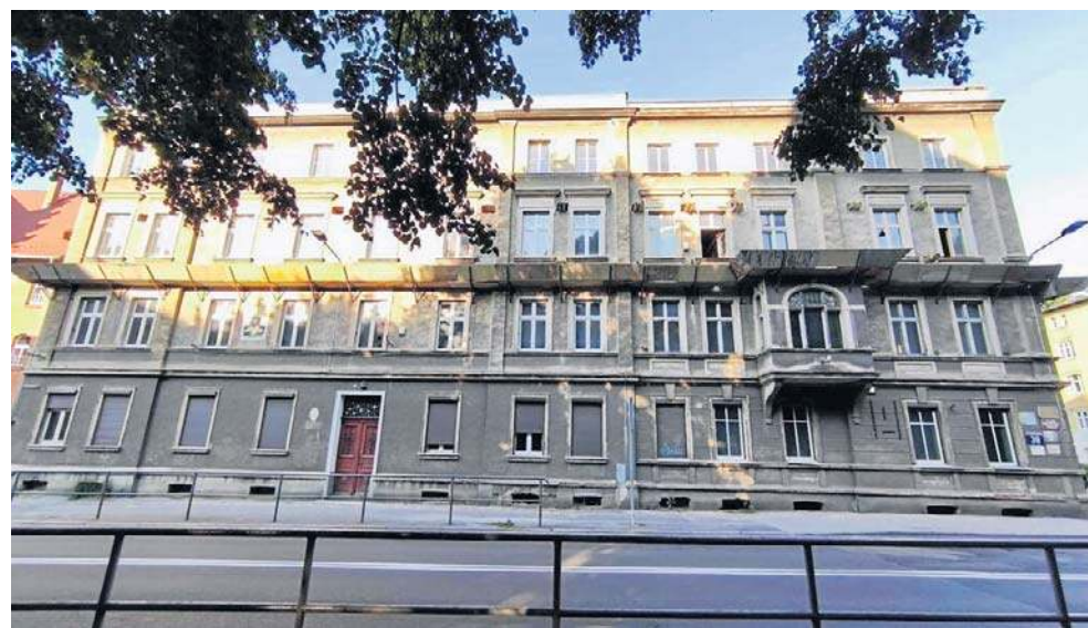
Czterokondygnacyjny i podpiwniczony gmach powstał na przełomie XIX i XX w.