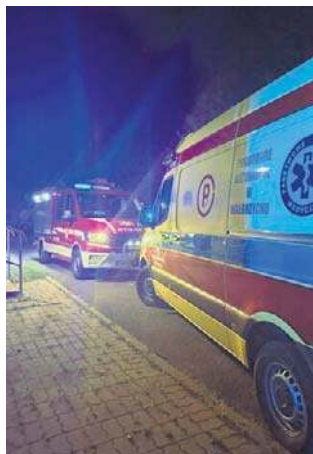
Na szczęście nikomu nic się nie stało

Na szczęście udało się ratownikom dotrzeć do mężczyzny nim doszło do rozprzestrzenienia się pożaru oraz zatrucia uszkodzonego dymem. Strażacy z Boguszowa uczestniczyli w akcji wspólnie z zastępami JRG-1 Wałbrzych oraz ZRM Wałbrzych.