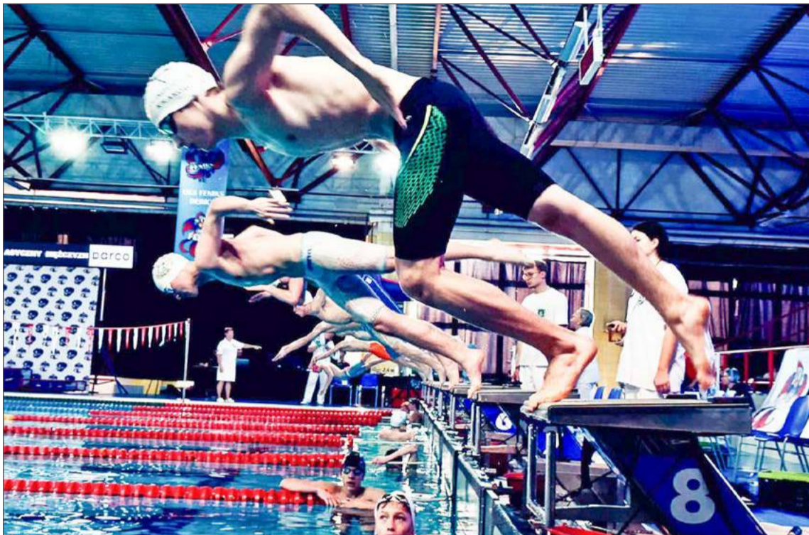
Emocje podczas Feniks Pool Party towarzyszyły każdemu wyścigowi na dębickim basenie.