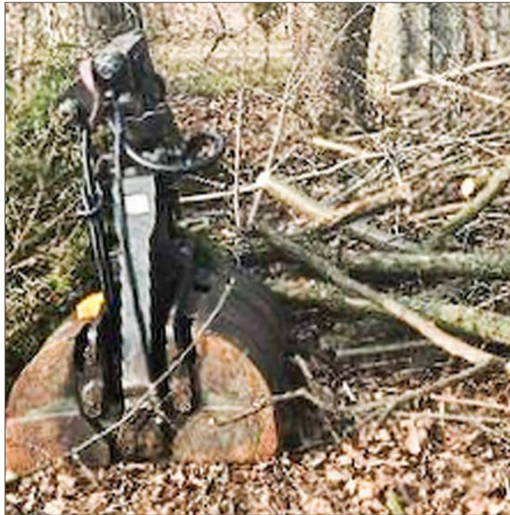
Zginął chwytak przedstawiony na zdjęciu.

Jak informuje mieszkaniec Jażwin, skradzione przedmioty znajdowały się około 5 metrów od