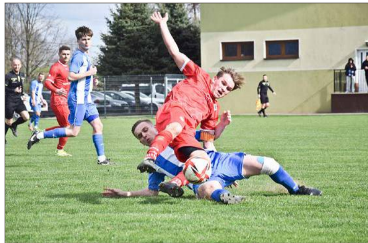
LKS Stara Jastrzębka/Róża (na biało-niebiesko) pokonał Inter Gnojnic.