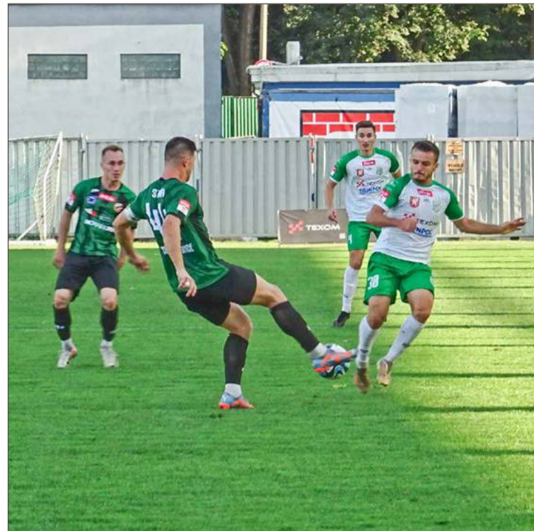
Wisłoka (biało-zielone stroje) zremisowała bezbramkowo ze Starem.