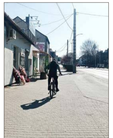
Nowe kosze i ławki staną przy drogach powiatowych.

- Zamówili już ponad czterdzieści koszy, ale dziesięć wymienimy za te najbardziej zniszczone, a trzydzieści zostanie ustawionych