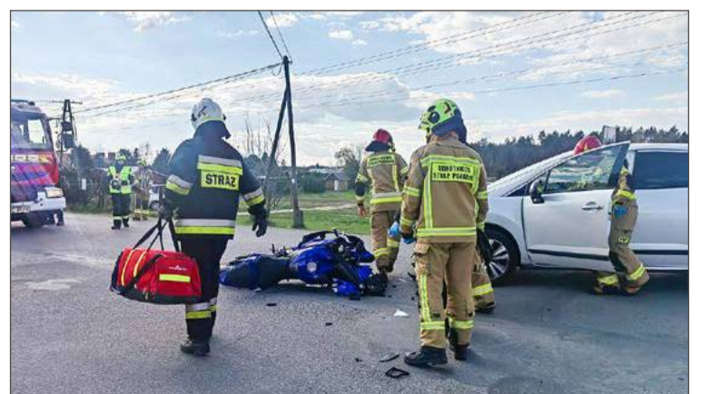
Pierwsi na miejscu zdarzenia byli strażacy OSP i zawodowi.