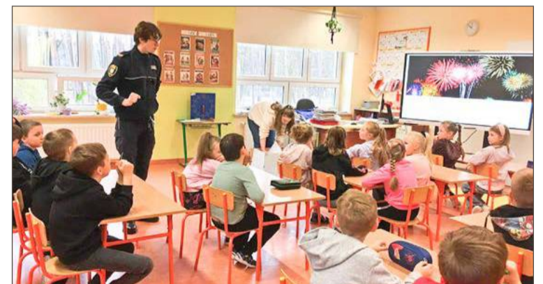
Spotkanie zorganizowane zostało w szkole w Pustkowie-Osiedlu.