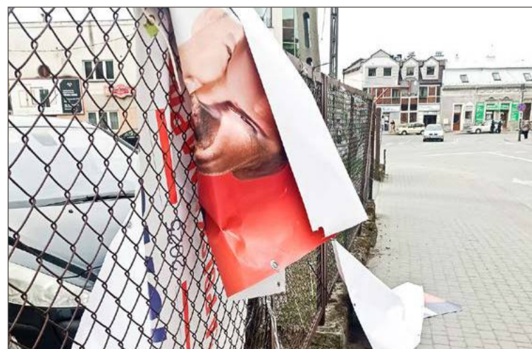
Zniszczone banery Rafała Trzaskowskiego przy ul. Kolejowej w Dębicy.