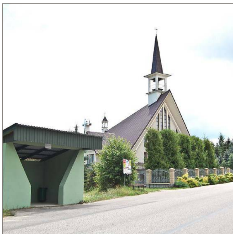
Zagórze jest jedną z najbardziej wykluczonych komunikacyjnie wsi.

Połączenia z Dębicą praktycznie nie istnieją, a te które są, nie ułatwiają dostania się do szkół czy do pracy. Biorący udział w projekcie przygotowali grafiki, w których przedstawili w ich ocenie najbardziej wykluczone komunikacyjnie miejscowości w powiecie dębickim. Obok Gębiczyny i Połomii w gminie Pilzno najbardziej wykluczone są Głobikówka, Siedliska-Bogusz, część Smarżowej w gminie Brzostek, a także Zagórze, Dzwonowa i Dęborzyn, które znajdują się na terenie gminy Jodłowa. Na gra-