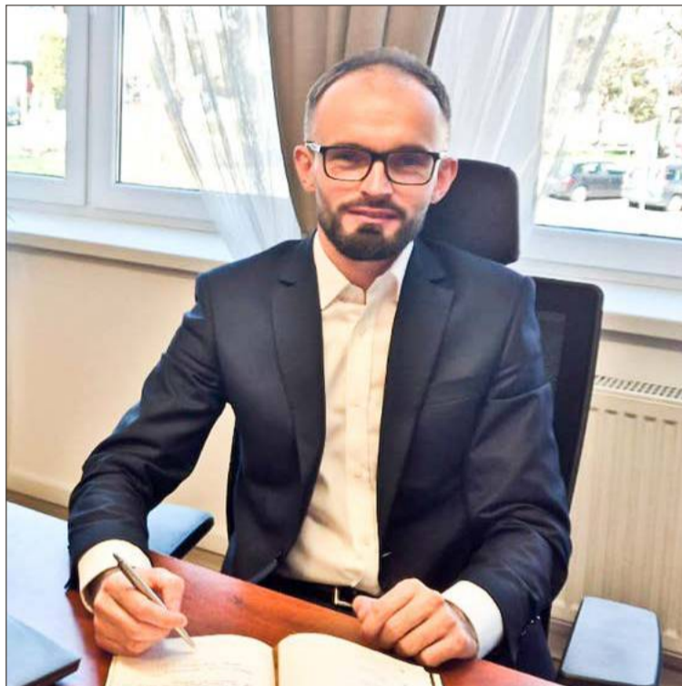
Świeżo upieczony sekretarz przyzwyczajają się już do nowych obowiązków.

Z dębickim samorządem związany jest ponad 11 lat. Pracę w UM w Dębicy rozpoczął w 2014 roku jako stażysta w Wydziale Infrastruktury Miejskiej. Po zakończeniu stażu awansował kolejno na