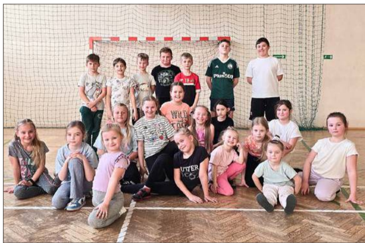
Chętnych do udziału w zajęciach w Głowaczowej nie brakuje.

ki siatkarskie, ale także na treningi zumbi.