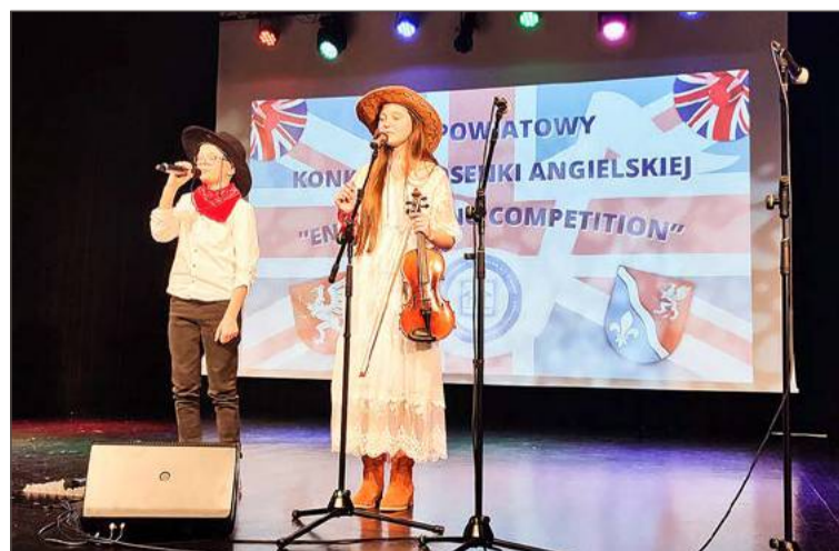
Na scenie zaprezentowało się 47 solistów, 4 duety i 4 zespoły.