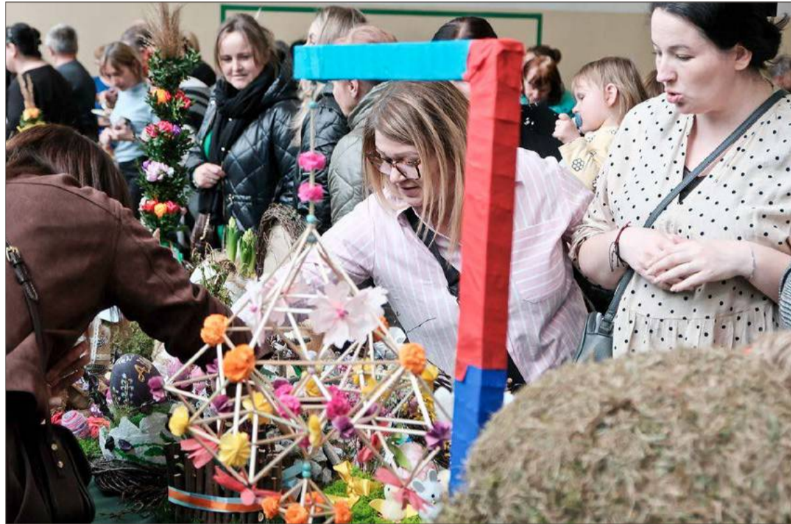
Na stołach było kolorowo i tak, jak nakazuje tradycja.

- Czy ja coś kupiłam? Szczerze mówiąc, nie miałam czasu, doglądając wszystkiego, ale na pewno było warto - mówi dyrektorka.