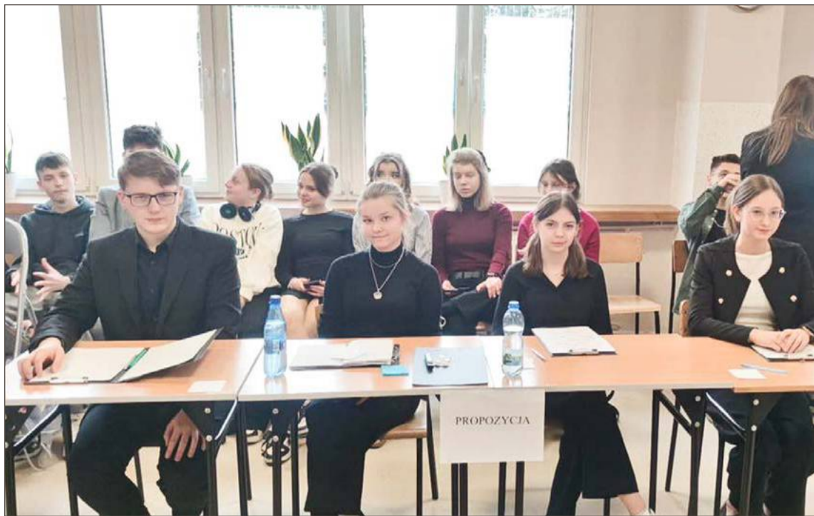
Drużyna LO w Jodłowej podczas debaty z uczniami I LO z Dębicy.

Przed nimi kolejne starcia z uczniami innych szkół prowadzonych przez Starostwo Powiatowe w Dębicy. Będą musieli zmierzyć się z trzema tezami. Pierwsza: Młodzież dwóch ostatnich klas szkół ponadpodstawowych powinna jeden dzień w tygodniu mieć prze-