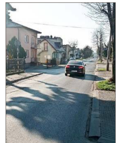
Na tym odcinku pasów nie ma.

Naczelnik zwraca za to uwagę, że obecnie tak mieszkańcy bloków, jak i działkowcy, którzy mają ogródki przy Słonecznej, mogą przechodzić gdzie chcą, oczywiście z zachowaniem ostrożności. Gdyby tam jednak zostały namalowane pasy, to za przechodzenie przez ulicę w odległości mniejszej niż 100 m od zebry groziłby mandat. Nie wie więc czy to właściwe rozwiązanie.