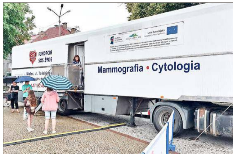
Badania mammograficzne najczęściej wykonują mieszkanki gminy Czarna.

W zakresie cytologii najlepiej wypadają gminy Pruchnik (22,2) i Roźwienica (20,6) w powiecie ja-