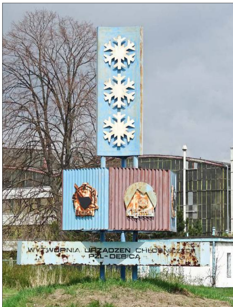
Prawie jak Prypeć na Ukrainie.