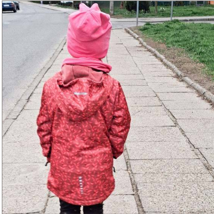
Rodzice nie chcą, by dzieci zmieniały miejsce nauki.

Z danych przekazanych przez Miejski Zarząd Oświaty wynika, że w tym roku do oddziału zerowego przy SP 8 zapisanych zostało 7 dzieci, z czego tylko jeden sześciolatek, który za rok pójdzie do