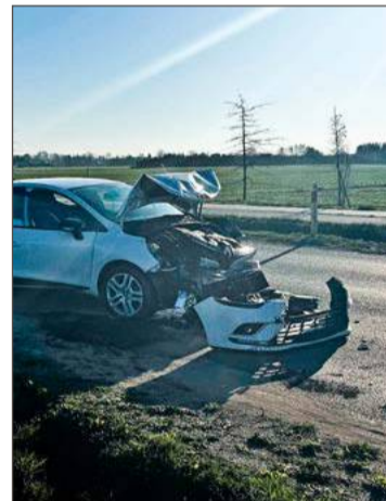
Przód renaulta został zniszczony.