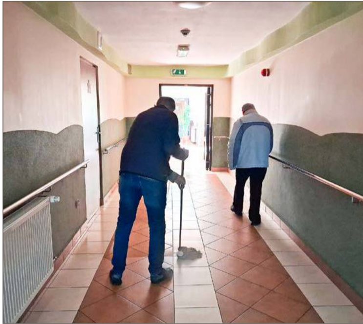
W obu budynkach Towarzystwa Pomocy Brata Alberta mieszka łącznie 177 bezdomnych. Tylko z powiatu dębickiego są tam 52 osoby.

- Pewnego dnia, zostawiając wszystko wyszedłem i trzasnąłem