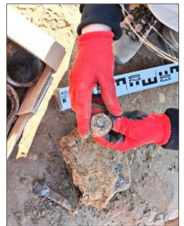
Ziemia co rusz odsłania kolejne przedmioty.