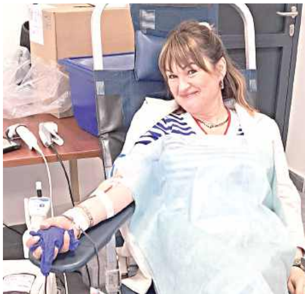
Największe podziękowania drухowie kierują jednak do wszystkich osób, które zdecydowały się oddać krew