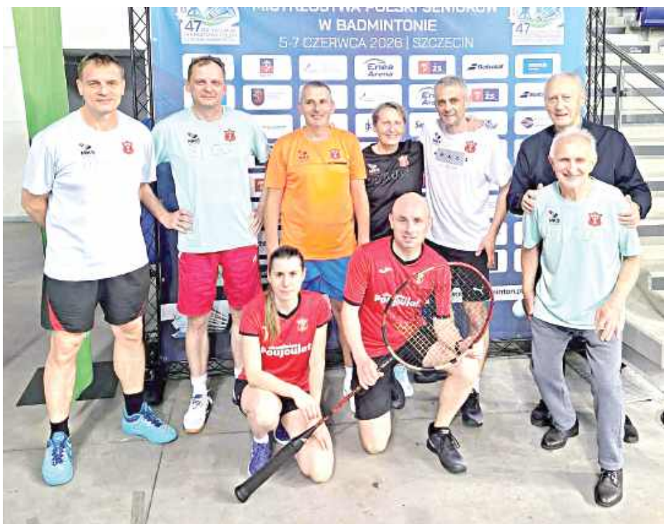
Łącznie reprezentanci MKS-u Garwolin wywalczyli 12 medali, potwierdzając swoją wysoką pozycję w krajowym badmintonie seniorskim. Dorobek pięciu złotych, czterech srebrnych i trzech brązowych medali sprawił, że garwoliński klub znalazł się w gronie najbardziej utytułowanych ekip tegorocznych mistrzostw