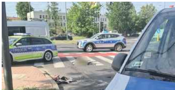
Na Mazowszu doszło do dwóch poważnych wypadków drogowych z udziałem dzieci, w wyniku których jedna osoba nie żyje, a druga została ranna

Drugie zdarzenie odnotowano dzień wcześniej w Mławie, na ulicy Spółdzielczej, w strefie zamieszkania. 39-letni kierowca