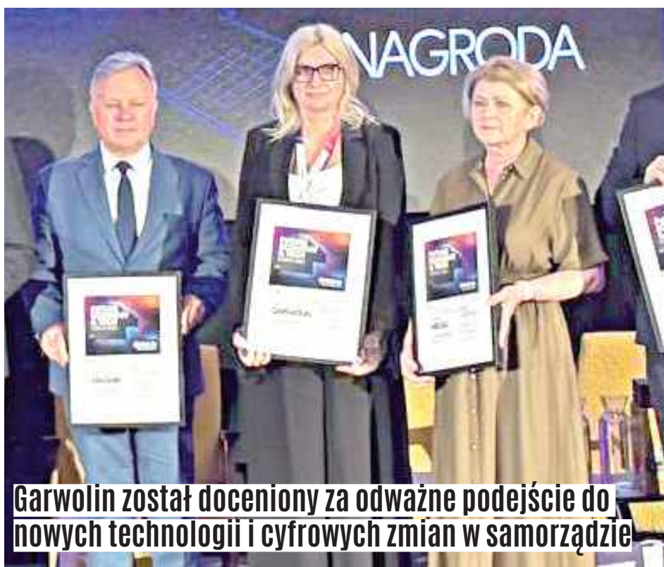
Garwolin został doceniony za odważne podejście do nowych technologii i cyfrowych zmian w samorządzie

Forum odbyło się 25 maja w Nałęczowie i zgromadziło przedstawicieli administracji publicznej, biznesu, świata nauki oraz sektora nowych technologii.