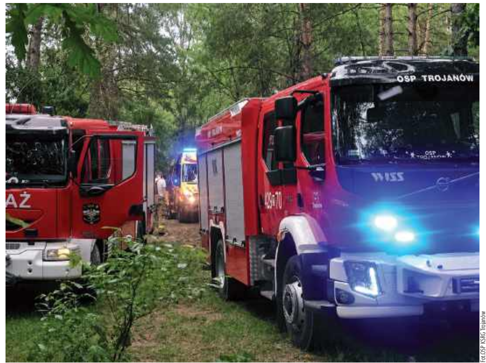
Poszedł się wykapać. Chwilę później zniknął pod wodą. Tragiczny finał akcji ratunkowej

Mężczyzna wszedł do własnego stawu o wymiarach około 25 na 25 metrów i głębokości sięgającej około 3 metrów. Gdy nie wypłynął na powierzchnię, zaalarmowano służby ratunkowe.