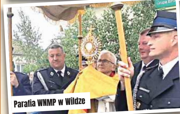
Parafia WNMP w Wildze