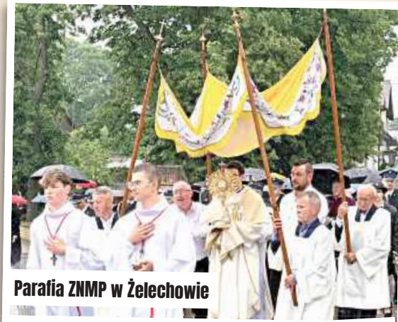
Parafia ZNMP w Żelechowie