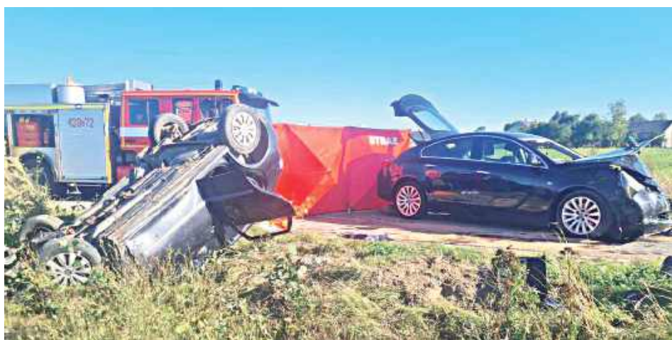
Po zderzeniu samochód dachował, a kierująca została zakleszczona wewnątrz pojazdu

Minęło ponad osiem miesięcy od tragicznego wypadku w Kaleniu Drugim w gminie Sobolew, w którym zginęła 50-letnia mieszkanka gminy.