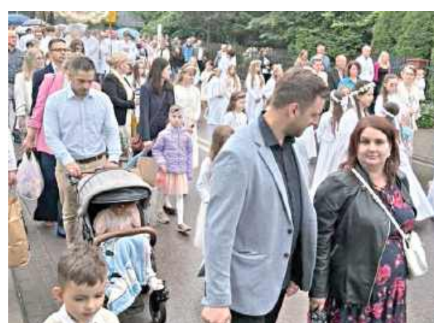
Wysłuchując się w słowo Boże, wierni śpiewali pieśni eucharystyczne oraz zanosili wspólne modlitwy, przy kolejnych ołtarzach, otrzymując błogosławieństwo Najświętszym Sakramentem (Parafia MB Kodeńskiej w Pilawie)