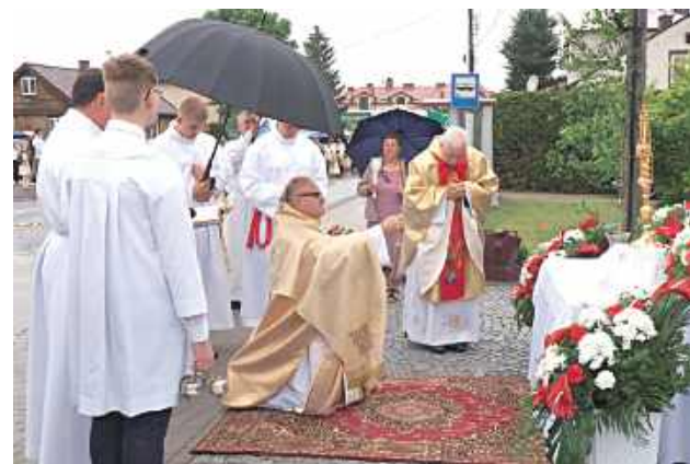
Po uroczystej mszy świętej wierni wyruszyli drogami naszych miejscowości w procesjach do czterech ołtarzy, aby publicznie wyznać wiarę w obecność Jezusa Chrystusa w Najświętszym Sakramencie (Parafia Świętego Jana Chrzciciela w Górznie)