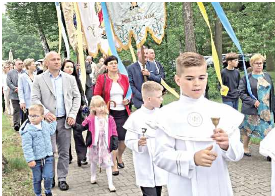
W uroczystości uczestniczyły całe społeczności lokalne, przygotowując ołtarze, niosąc feretrony i baldachim