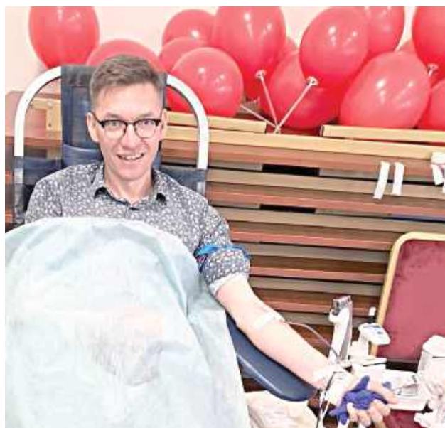
To był dzień, który na długo pozostanie w pamięci drухów z OSP Korytnica. W poniedziałek, 1 czerwca, remiza stała się miejscem wyjątkowej akcji pomocy