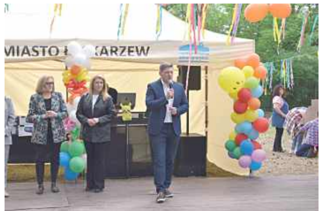
Na uczestników czekało wiele atrakcji przygotowanych z myślą o dzieciach i ich rodzinach

Nie zabrakło także sportowych emocji podczas meczu piłki siatkowej oraz atrakcji o charakterze