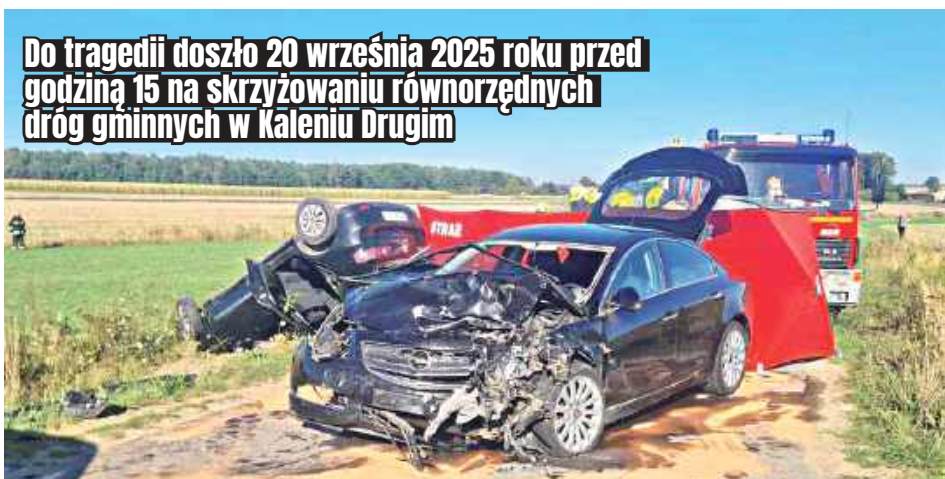
Do tragedii doszło 20 września 2025 roku przed godziną 15 na skrzyżowaniu równorzędnych dróg gminnych w Kaleniu Drugim

Strażacy wykonali dostęp do poszkodowanej kobiety, którą przekazano ratownikom medycznym. Mimo podjętej reanimacji życia 50-latki nie udało się uratować. Kobieta zmarła na miejscu zdarzenia. Kierowca opla był trzeźwy i trafił do szpitala.