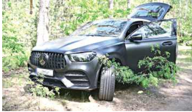
Dodatkowo ustalono, że mężczyzna posiadał cofnięte uprawnienia do kierowania pojazdami oraz wcześniejsze wyroki za przestępstwa, w tym kradzież z włamaniem

Po otrzymaniu zgłoszenia policjanci natychmiast rozpoczęli działania operacyjne. Dzięki wykorzystaniu danych z systemu GPS zamontowanego w pojeździe oraz dobrej znajomości