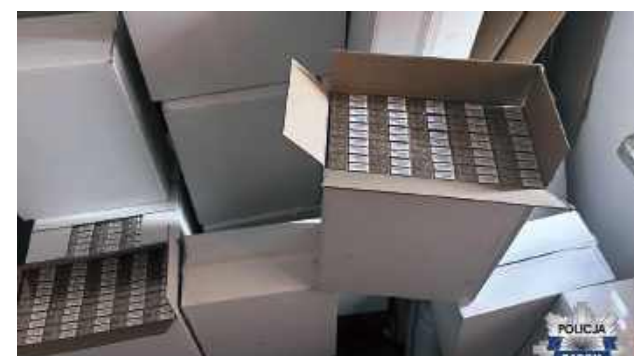
Policjanci z Radomia zatrzymali mężczyznę podejrzanego o przestępstwo karno-skarbowe związane z wyrobami tytoniowymi. Sprawą zajmują się funkcjonariusze

Do zatrzymania doszło po wcześniejszych ustaleniach operacyjnych, które wskazywały, że 38-letni mieszkaniec Radomia może przechowywać nielegalne papierosy w jednym z garaży na terenie miasta. Policjanci przeprowadzili przeszukanie wskazanych pomieszczeń, podczas którego ujawnili kartony zawierające łącznie 10 tysięcy paczek