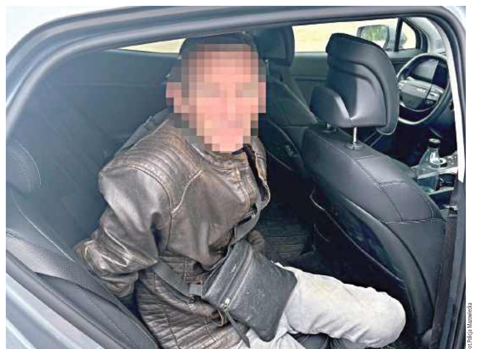
46-letni mężczyzna został zatrzymany po próbie włamania do domu jednorodzinnego na terenie Ostrołęki

Zatrzymany został obezwładniony i przewieziony do jednostki policji, gdzie umieszczono go w policyjnej celi. Następnego dnia usłyszał zarzuty usiłowania kradzieży