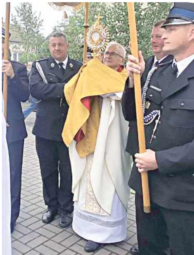
Śpiew procesyjnych pieśni niósł się daleko po okolicy, dając świadectwo wiary lokalnych społeczności (Parafia WNMP w Wildzie)

czystości Bożego Ciała są ołtarze przygotowywane na procesję. Mieszkańcy poszczególnych miejscowości wykazują się przy tym zaangażowaniem, poświęcając swój czas oraz wkładając trud w ich wykonanie. Te piękne dzieła są świadectwem ich wiary, jedności i troski o parafialną tradycję.