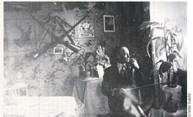
Fotografia Wnętrze domu – dubeltówki na ścianie [Stefan Siudalski]