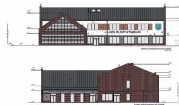
Plan nowego budynku

Jak podkreślają władze gminy, działka nie była własnością sa-