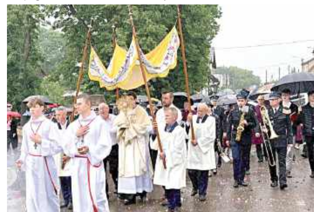
Wspólnota parafialna zgromadziła się na Eucharystii, a następnie wyruszyła w procesji, dając świadectwo wiary w obecność Chrystusa w Najświętszym Sakramencie (Parafia ZNMP w Żelechowie)