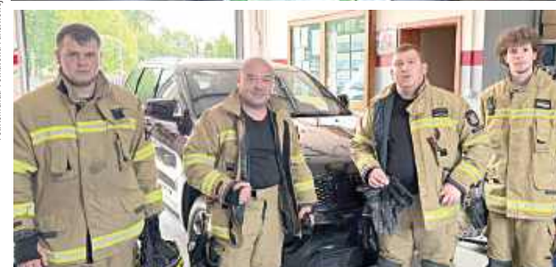
Na fotografiach opublikowanych przez OSP Borowie widać strażaków odpoczywających pomiędzy kolejnymi zadaniami, jedzących posiłki w lesie czy próbujących zapać kilka minut snu