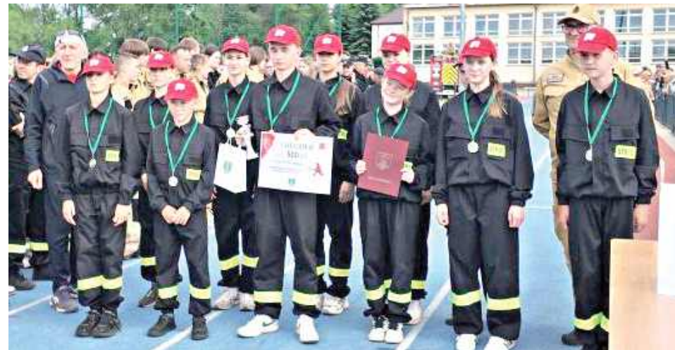
Sportowa rywalizacja, strażacka precyzja i mnóstwo emocji – tak wyglądały IX Gminne Zawody Sportowo-Pożarnicze, które odbyły się na boisku lekkoatletycznym w Rudzie Talubskiej