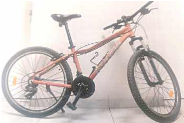
Policja zatrzymała mężczyznę podejrzanego o kradzież roweru oraz jazdę w stanie nietrzeźwości

Jeszcze tego samego dnia policjanci z Ogniwa Patrolowo-Interwencyjnego zauwa-