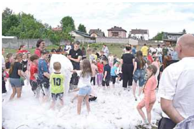
Prawdziwym hitem okazała się Piana Party, która była efektywnym zwieńczeniem świętowania

Radość, śmiech i mnóstwo atrakcji dla najmłodszych – tak wyglądały tegoroczne obchody Dnia Dziecka w Łaskarzewie. W sobotę, 31 maja, Park Alejki wypełnił się mieszkańcami, którzy wspólnie świętowali jedno z najbardziej wyczekiwanych wydarzeń w roku.