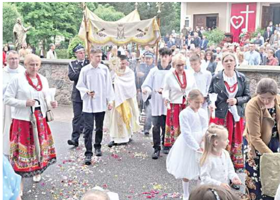
Szczególnym elementem uroczystości Bożego Ciała są ołtarze przygotowywane na procesję. Mieszkańcy poszczególnych miejscowości wykazują się przy tym zaangażowaniem, poświęcając swój czas oraz wkładając trud w ich wykonanie (Parafia Świętego Izydora Oracza w Marianowie)

Jak co roku w Uroczystość Ciała i Krwi Chrystusa ulicami miast i wsi przeszły procesje w obecności Jezusa Eucharystycznego, podczas których wierni prosili o błogosławieństwo. W naszych parafiach był to piękny dzień świadectwa wiary i wspólnoty.