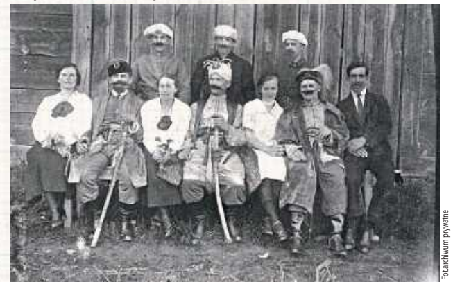
Czasami jedno zdjęcie zawiera kilkanaście historii...

aresztowany przez Gestapo jako zakładnik - wraz z pięcioma innymi więźniami wykupiony, ale aż do końca lutego 1944 roku musi się ukrywać. Ukryty w porę w kryjówce za szafą przy piecu nie zostaje wykryty przez Gestapo podczas rewizji domu. Lato 1944 roku – NKWD aresztuje i wywozi na przesłuchania na Przyczółek Magnuszewski, jak wielu w tamtym czasie akowców. Żydówka, która wraz z mężem i synem przeżyła okupację w ukryciu na wsi Feliksin – wstawia się w NKWD za aresztowanym na tyle skutecznie, że zostaje wypuszczony.