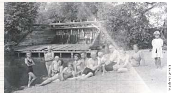
Sierpień 1939 roku - zaporę na Wildze