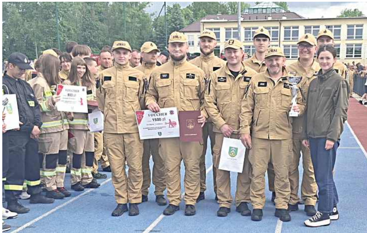
Uczestnicy rywalizowali w dwóch konkurencjach – sztafecie pożarniczej 7 x 50 metrów oraz ćwiczeniu bojowym

MDP Wola Władysławowska MDP Ruda Talubska MDP Wilkowyja MDP Wola Rębkowska