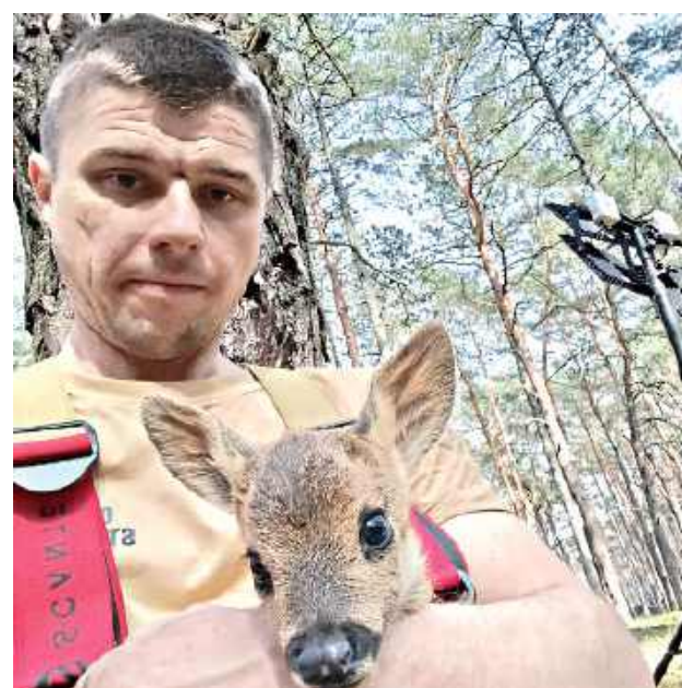
Mała sarenka uratowana przez strażaków OSP Żelechów

Po udzieleniu pomocy sarenka została przekazana leśnikom, którzy przejęli nad nią dalszą opiekę.