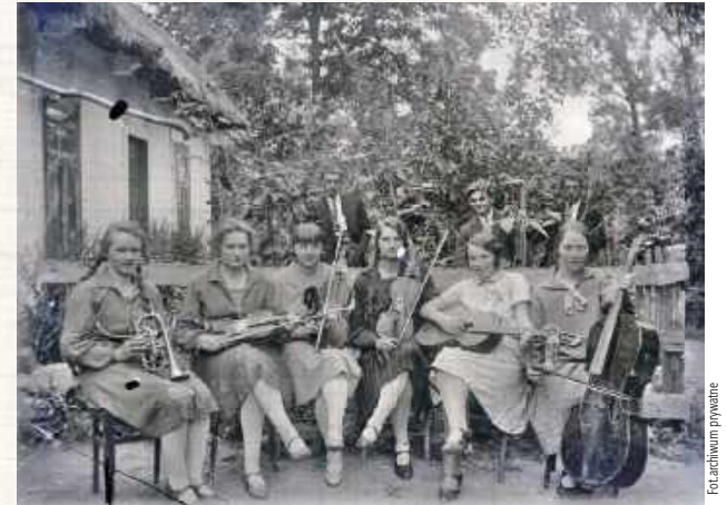
Wszystkie dziewięć osób z tego zdjęcia to mieszkańcy tej wsi

podporucznika w obronie Helu, chłopiec na rękach matki – wraz z rodzicami w 1945 roku znajdzie się w Londynie, gdy dorośnie, założy firmę zajmującą się badaniem ultradźwiękami odlewów łopat silników samolotów turbodrzutowych, a na bazie zdobytych doświadczeń stworzył aparaturę do USG – tak do ultrasonografii, na której podstawie dziś jest powszechnie leczenie, korzysta z USG, matka tego chłopca, nauczycielka na kresach za miesiąc zostanie postawiona przez czerwoarmistów pod ścianę do rozstrzelania, ale... miejscowa ludność białoruska stanęła w obronie nauczycieli, których chciano rozstrzelać, kolejna kobieta – ta leżąca na piasku – jej mąż to ten pan w okularach – w dniu 11 listopada 1940 roku zostanie zamordowany przez Schmidta – niemieckiego policjanta przed kawiarnią w Garwolinie, będzie miała kilku mężów, ale własnych dzieci się nie doczeka, kobieta z białym kołnierzykiem – nic o niej nie wiadomo, mężczyzna obok niej – ojciec tego małego chłopca po lewej, a więc mąż nauczycielki, po wojnie będzie w Londynie prowadził restaurację polskich lotników „Pod skrzydłami”, którzy pozostali w Wielkiej Brytanii, pan w czarnych spodniach z dziewczynką – bohater tego artykułu – przeżyje wojnę i wyzwolenie dzięki szczęściu, zaradności i opiece Boskiej, bo inaczej tego nie można określić. Około 1943 roku ktoś doniósł, że posiada radio – rewizja w zabudowaniach. Rudy Gestapowiec radio znalazł, ale swojemu przełożonemu powiedział, że radia na oborze nie ma. W 1943 roku, jesienią zostaje