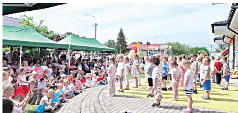
Mali artyści z ogromnym zaangażowaniem zaprezentowali swoje umiejętności przed licznie zgromadzoną publicznością

Wydarzenie, które odbyło się 30 maja, po raz kolejny pokazało, jak silną i zgraną społeczność tworzą dzieci, rodzice oraz pracownicy placówki