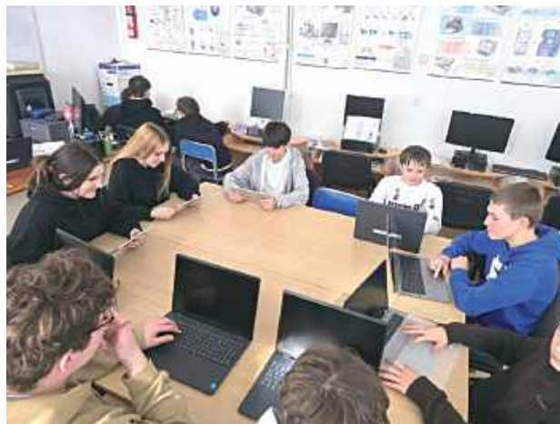
Nowe urządzenia wykorzystywane w codziennej pracy dydaktycznej, wspierają proces nauczania oraz rozwój umiejętności niezbędnych we współczesnym świecie

Nowoczesny sprzęt będzie wykorzystywany podczas codziennych zajęć, wspierając proces nauczania i rozwijanie kompetencji cyfrowych dzieci oraz młodzieży.