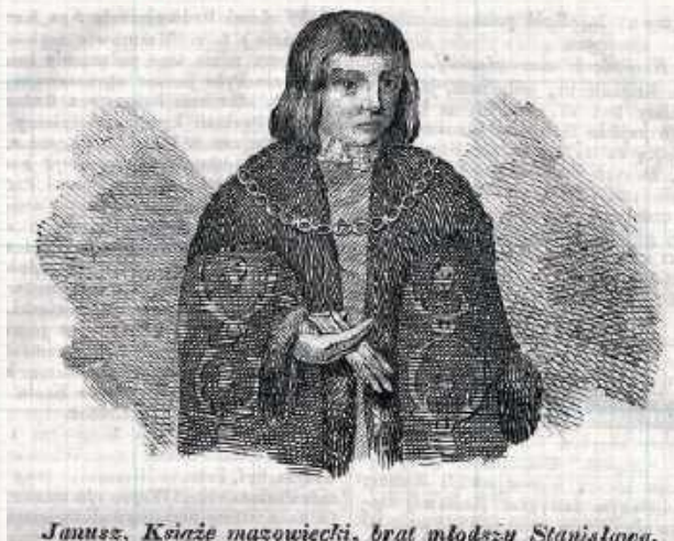
Janusz, Książę mazowiecki, brat młodszy Stanisława.

Fragment tekstu: „Podobnie w temże polu czwartą część włóki jednej która leży między drogą prowadzącą do Osiecka a polem Grzegorzowej wdowy na dłuż poczynając od rzeki jak się rozciąga pole wsi Woli Rębkowskiej. Podobnie w trzecim polu czwarta część jednej włóki która leży między polem Folwarku Xiążęcęgo z jednej a rolą chłopa rzeczonęgo Wojciecha na dłuż poczynając od rzeki aż do lasu jak się rozciąga pole wspomniane Folwarku Xiążęcęgo podobnie na temże polu na końcu rol Folwarcznych to jest odgraniczając Folwarczne na szerz jednej włóki przy drózkach które leżą przy polu Grzegorzowej wdowy, na