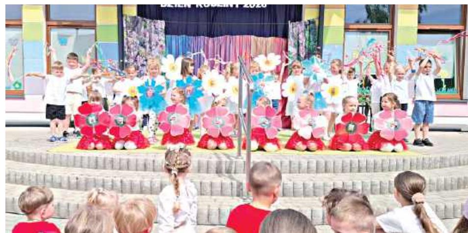
Dzień Rodziny w Publicznym Przedszkolu im. Jasia i Małgosi w Sobolewie

Mnóstwo uśmiechów, wzruszające występy najmłodszych, niespodzianka przygotowana przez rodziców oraz wiele atrakcji dla całych rodzin – tak wyglądał tegoroczny Dzień Rodziny w Publicznym Przedszkolu im. Jasia i Małgosi w Sobolewie.