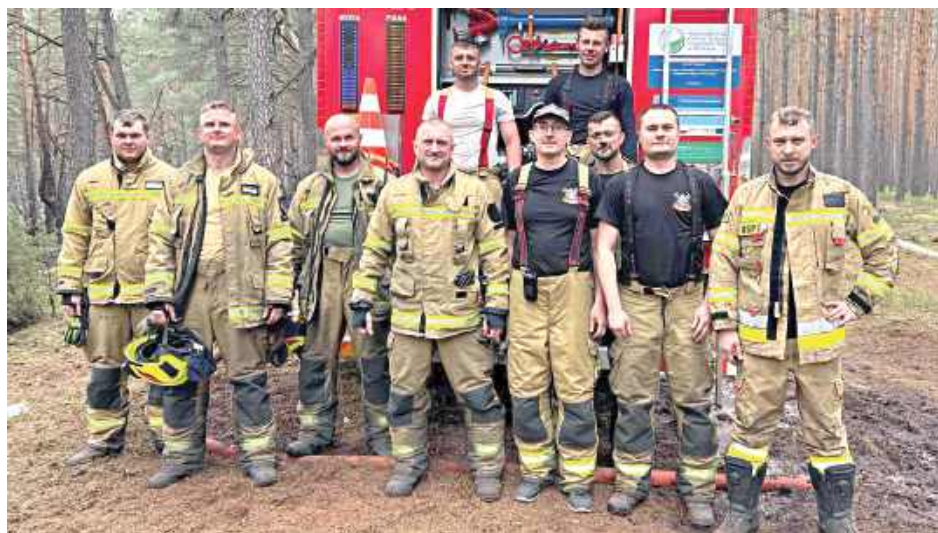
Po zakończeniu działań strażacy z OSP Borowie podziękowali wszystkim służbom za współpracę, wytrwałość i profesjonalizm podczas tej wyjątkowo trudnej akcji

– Po 76 godzinach ciągłych działań zakończyliśmy udział w gaszeniu jednego z największych pożarów lasów ostatnich lat na Ma-