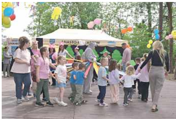
Przez cały czas trwania imprezy najmłodszy mogli korzystać z dmuchanych zamków, stoisk gastronomicznych oraz symulatorów jazdy SIMRACING

Jednym z ważniejszych punktów programu było wręczenie wyróż-