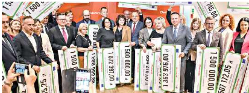
Dobre wiadomości dla mieszkańców wsi. Cztery gminy z dużym dofinansowaniem