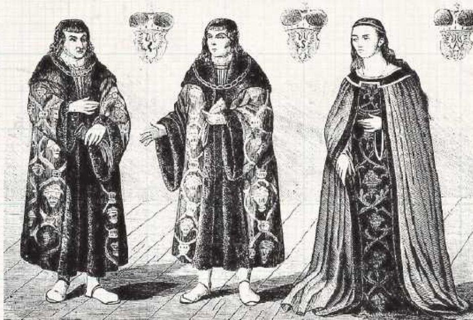
Ostatni księżęta mazowieccy – Janusz, Stanisław i Anna. Po śmierci księżnej mazowieckiej Anny Radziwiłłówny (1476-1522) i po zakończeniu żywota przez jej synów, Stanisława mazowieckiego (1500-1524) i Janusza III (1502-1526), ziemie wokół Woli Rębkowskiej włączono do Korony Królestwa Polskiego. Sukcesorem tychże ziem zastał król Polski, Zygmunt Stary („Tygodnik Ilustrowany”, 1862; Wikipedia)