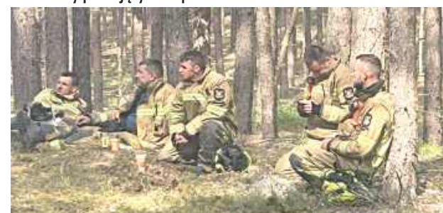
Zdjęcia pokazują nie tylko skalę pożaru, ale przede wszystkim ludzi, którzy bez względu na zmęczenie wykonali swoją służbę do końca

byli częścią ogromnej operacji ratowniczej, pomagając chronić lasy, zmęczenie i bezpieczeństwo mieszkańców Mazowsza.