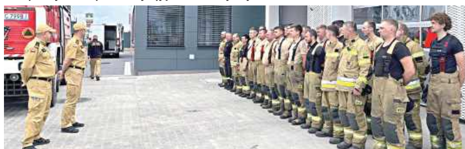
W poniedziałek, 1 czerwca, działania zakończył pluton „LAS” z powiatu garwolińskiego, który od 28 maja uczestniczył w akcji gaśniczej na terenie powiatów wołomińskiego i mińskiego

zowszu – poinformowali druhowie po powrocie do swojej jednostki.