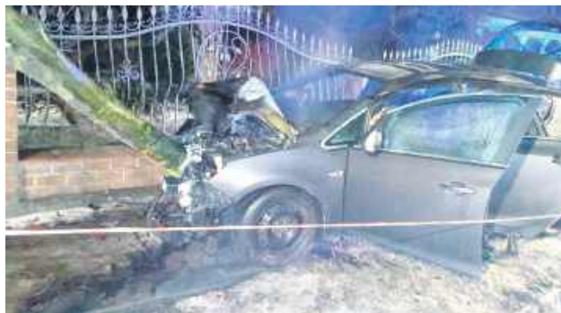
Pijany 20-latek z Tomaszowa Lubelskiego na szczęście jechał sam i nie odniósł żadnych obrażeń.

– Tomaszowscy policjanci wstępnie ustalili, że 20-letni mężczyzna, kierując oplem astrą, jechał za szybko, zjechał na pobocze, uderzył w znak drogowy, po czym uderzył w drzewo. Pojazd w wyniku zderzenia