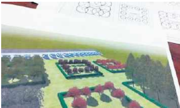
Powstaje już koncepcja sadu.

– Pomysł zrodził się podczas rozmów z mieszkańcami Księżpola. Starsze osoby wspominały, że kiedyś wokół budynku Urzędu Gminy rosło mnóstwo owocowych drzew,