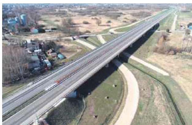
W przygotowaniu jest miejscowy plan zagospodarowania przestrzennego dla rejonu ulic Majdańskiej i Wiejskiej.

Urzednicy zachęcają mieszkańców do zapoznania się z do-