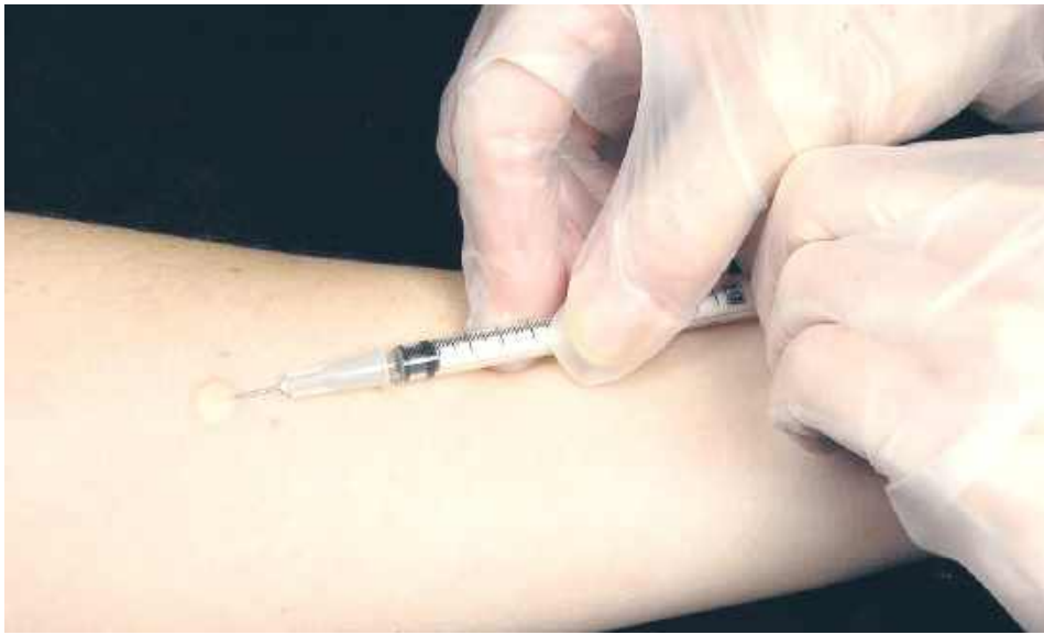
Najlepszą metodą zapobiegania zarażeniu wirusem grypy oraz uniknięcia powikłań są szczepienia profilaktyczne.

Grypa jest bardzo groźną chorobą wirusową. Jej następstwami mogą być powikłania ze strony układu oddechowego, zaburzenia pracy serca albo powikłania neurologiczne. Wirus nie omija województwa lubelskiego, ale na szczęście w ostatnim czasie notuje się mniej zachorowań. W aptekach pojawiły się w końcu leki przeciwwirusowe, a lekarze cały czas zachęcają do szczepień.