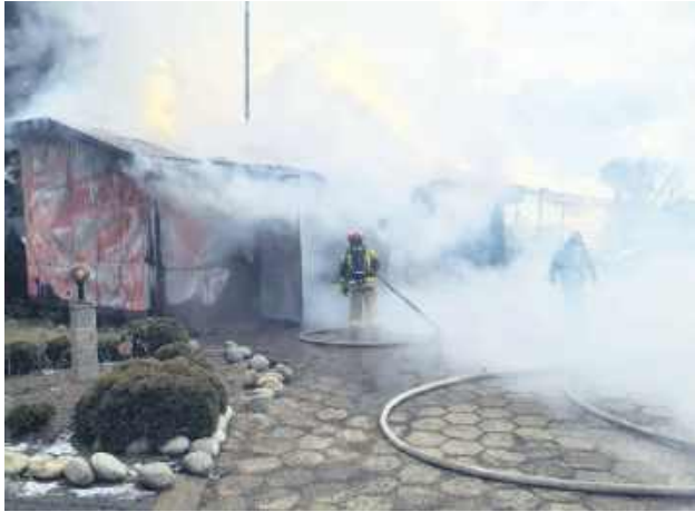
Przyczyną pożaru mógł być nieszczęsny przewód dymowy.

Na dodatek w odległości ok. 5 m od objętego ogniem budynku znajdowały się dwa budynki mieszkalne. Po odłączeniu instalacji elektrycznej podjęto działania gaśnicze. Gdy w trakcie prowadzonych działań doszło do kilku wybuchów, strażaków natychmiast wycofano na bezpieczną odległość, a działania kontynuowano przy użyciu działka znajdującego