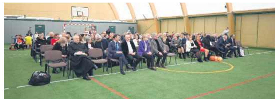
To pierwsza w powiecie tomaszowskim hala o takiej konstrukcji.