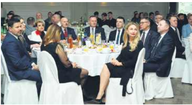
Piłkarska Gala Zamojszczyzny jak zawsze była uroczysta i okazała.