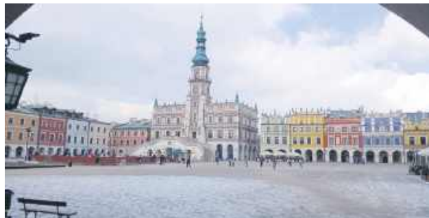
Po 6 latach przerwy Zamość znowu jest w Związku Miast Polskich.

Stosowna uchwała została podjęta w styczniu: 22 radnych było za, od głosu wstrzymał się jedynie Krzysztof Sowa z ko-