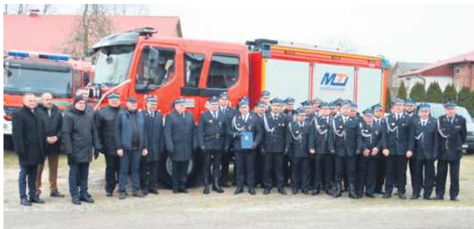
To pierwszy nowy samochód w jednostce.

Fabrycznie nowy średni samochód ratowniczo-gaśniczy na podwoziu renault i zabudowie pożarniczej wykonanej przez firmę MOTO TRUCK, zastąpił wysłużonego Stara 266.