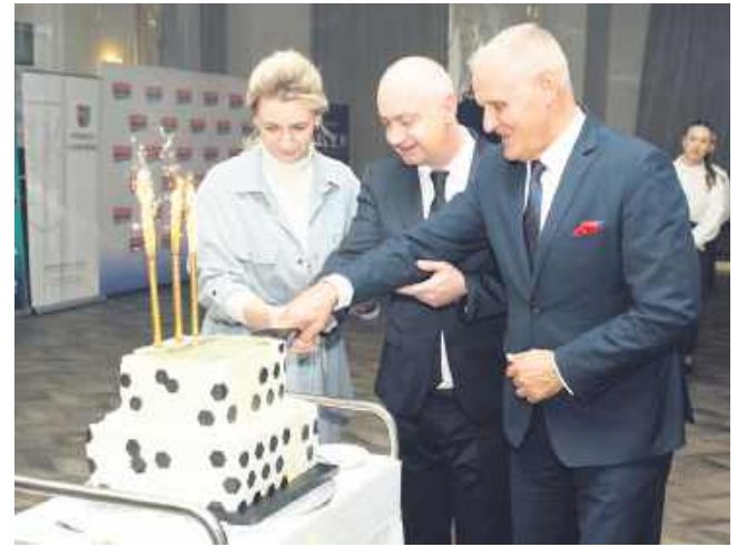
Skoro był jubileusz 25-lecia plebiscytu, to nie mogło się obyć bez tortu.