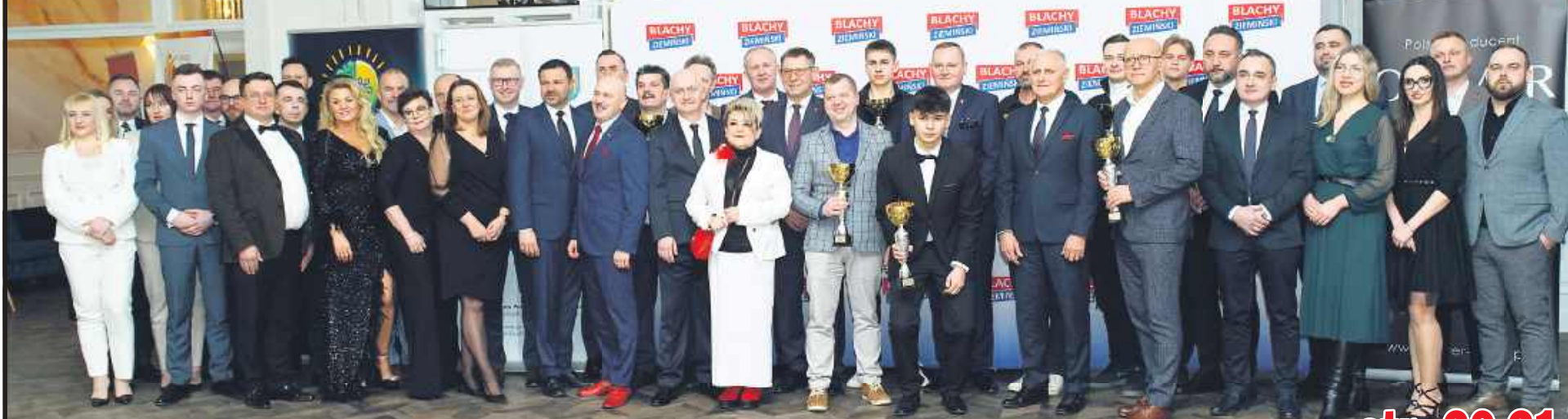
Tacy goście, to dla nas wielki zaszczyt! Dziękujemy, że zawsze dopisujecie swoją obecnością!