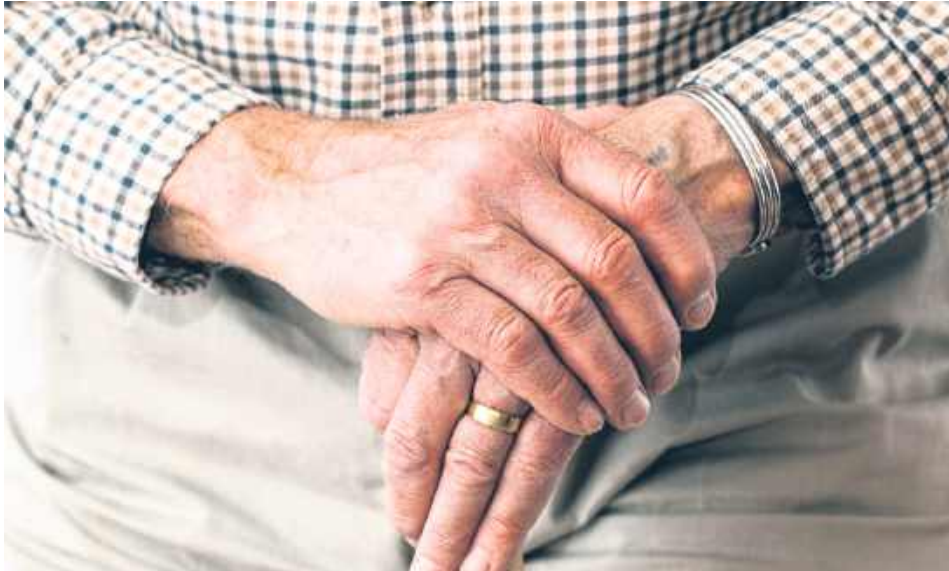
Emerytury i renty od 1 marca będą wyższe o 5,5 proc.

W sprawie waloryzacji nie trzeba składać wniosków, odbywa się ona z automatu. W ZUS waloryzacji podlegają wszelkie świadczenia długoterminowe: emerytury, renty z tytułu niezdolności do pracy,