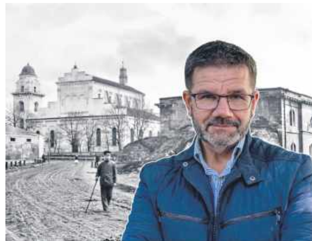
Autorem animacji jest Piotr Piotrowski.

Animacja z marszu stała się hitem internetu. – Tak jak poprzednio (pierwsza animacja przedstawiała Zamość przed wybuchem II wojny światowej – przyp. red.), film stworzony został z miłości do