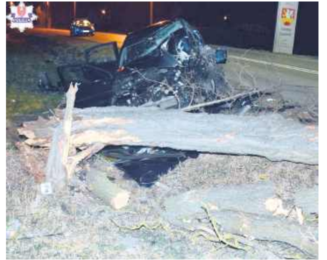
Mężczyzna był zakleszczony w pojeździe, z wraku wydostali go strażacy.

Uderzeniem w drzewo zakończyła się pijacka szarża kierowcy citroena z gminy Zamość. Mężczyzna prowadził samochód, mając ponad 1,5 promila alkoholu w organizmie. 19 lutego jechał drogą Białowola – Zalesie w kierunku Pniówka. Zbyt mocno naciskał pedał gazu i na zakręcie stracił panowanie nad autem.