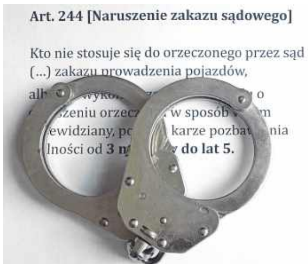
42-letni hrubieszowianin został zatrzymany 19 lutego wczesnym wieczorem.

42-letni hrubieszowianin został zatrzymany 19 lutego wczesnym wieczorem. Jechał fordem ulicą Na-