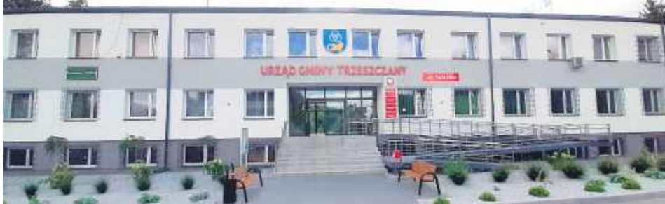
Placówka Poczty Polskiej w Trzuszczanach mieści się w siedzibie tamtejszego urzędu gminy.

„Takie rozwiązanie – wbrew oczekiwaniom – nie przyniesie zamierzonych oszczędności, natomiast spowoduje spadek jakości usług pocztowych” – czytamy w petycji przesłanej przez