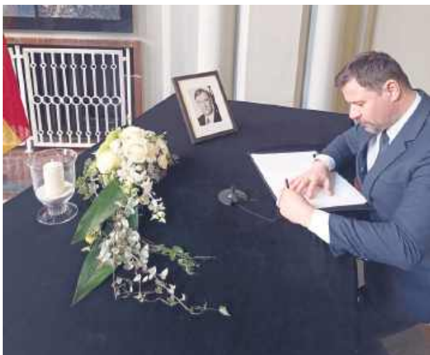
Prezydent Zamościa wpisuje się do księgi kondolencyjnej.