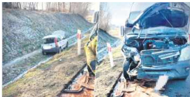
Gdy kierująca fiatem pandą skręcała w kierunku Cukrowni Werbkowice, w tył jej samochodu uderzył bus.

– Bus uderzył w tył samochodu osobowego, gdy fiat skręcał