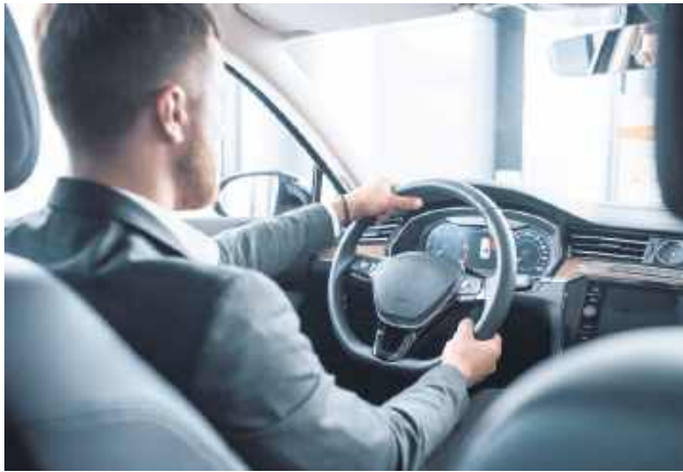
Nowy samochód będzie napędzany hybrydowo.

Radny Paweł Jednacz zaproponował, że zamiast kupować nowy samochód za 200 tys. zł, warto się zastanowić nad tym, aby kupić samochód na wymia-