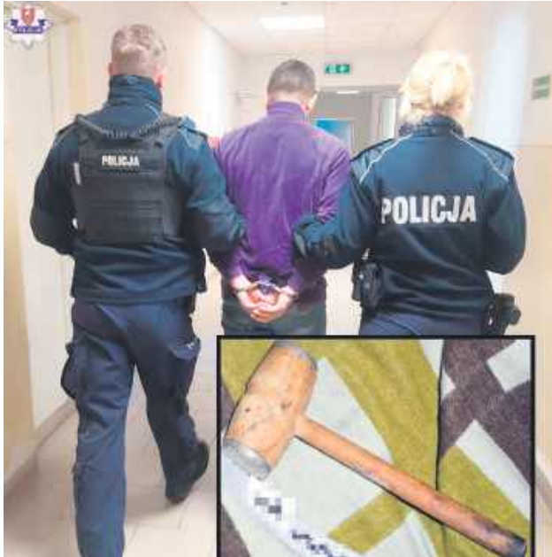
Jeden z biesiadników oberwał tłuczkiem w głowę. Poszkodowany trafił do szpitala, a agresor do aresztu.

Pokrzywdzony 42-latek wezwał służby ratunkowe, a karetka