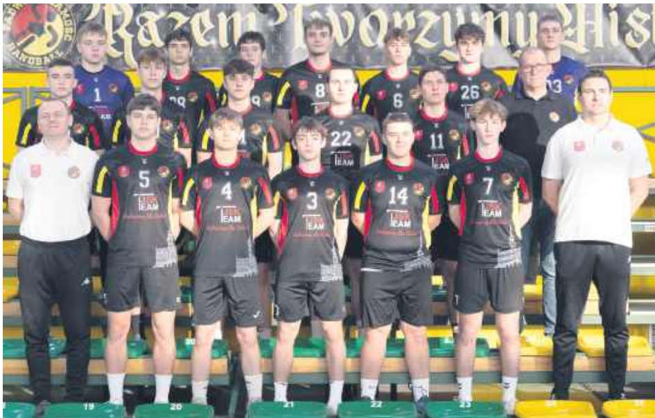
Juniorzy Padwy Zamość zagrają we własnej hali w turnieju 1/8 finału mistrzostw Polski.