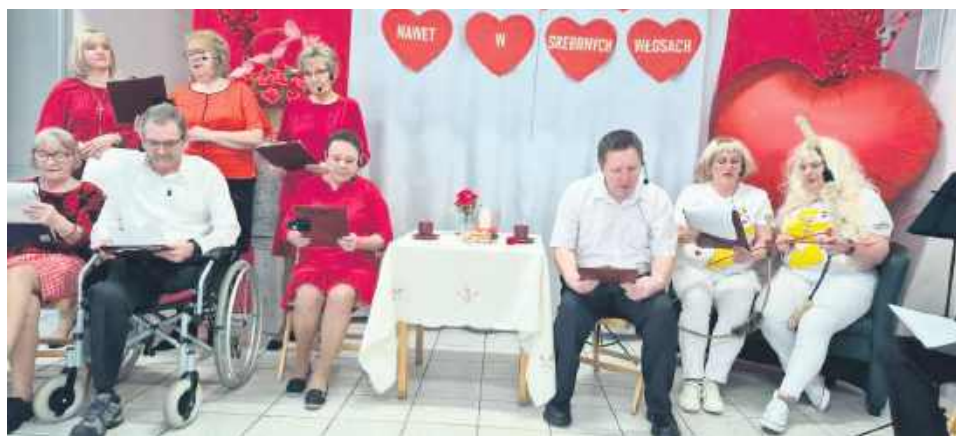
Tegoroczne święto miłości na długo pozostanie w pamięci mieszkańców DPS w Tyszowcach.