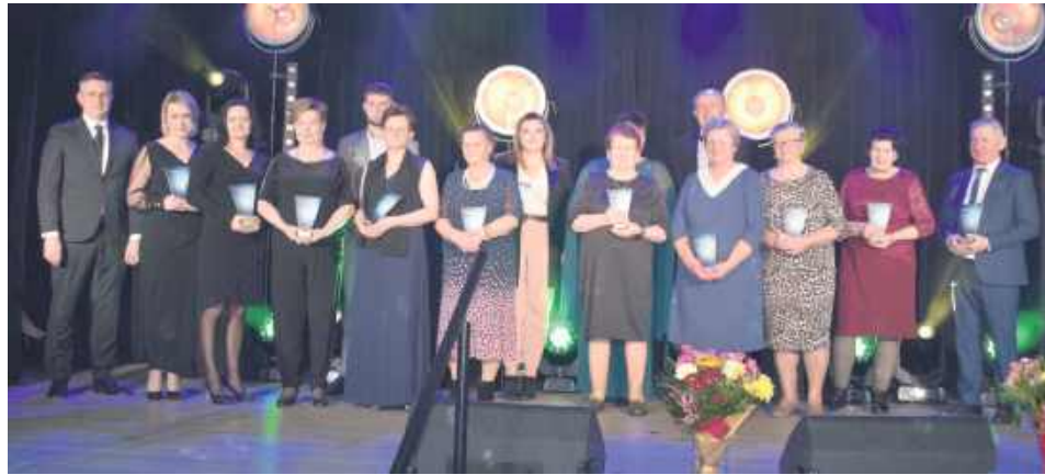
Nagrodzeni w kategorii działacz społeczny.

dyrektor Gminnego Ośrodka Kultury w Księżpolu.