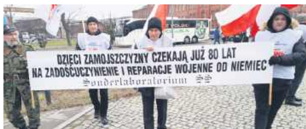
Nasza delegacja miała ze sobą transparent.

Podczas przemówienia wtórowało mu głośnie trąbienie w wuzeli, które przynieśli ze sobą uczestnicy demonstracji. Duża