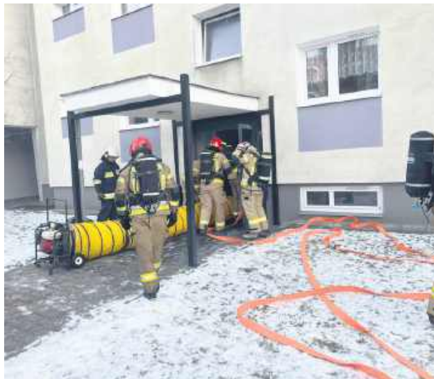
W trwających 4 godziny działaniach udział wzięło 22 strażaków i 7 pojazdów pożarniczych, w tym 6 z JRG Zamość oraz OSP Mokre.

Policja i straż pożarna wyjaśniają okoliczności oraz przyczyny pożaru, do którego doszło w piwnicy bloku przy ul. Wyszyńskiego w Zamościu. Część mieszkańców ewakuowała się samodzielnie, pozostałym osobom pomogli strażacy i policjanci. Na szczęście nikt z mieszkańców nie odniósł obrażeń. Prawdopodobną przyczyną zdarzenia było zaproszenie ognia przez osoby nieletnie.