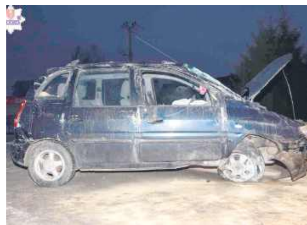
Rozbitny hyundai na miejscu wypadku w Barchaczowie.