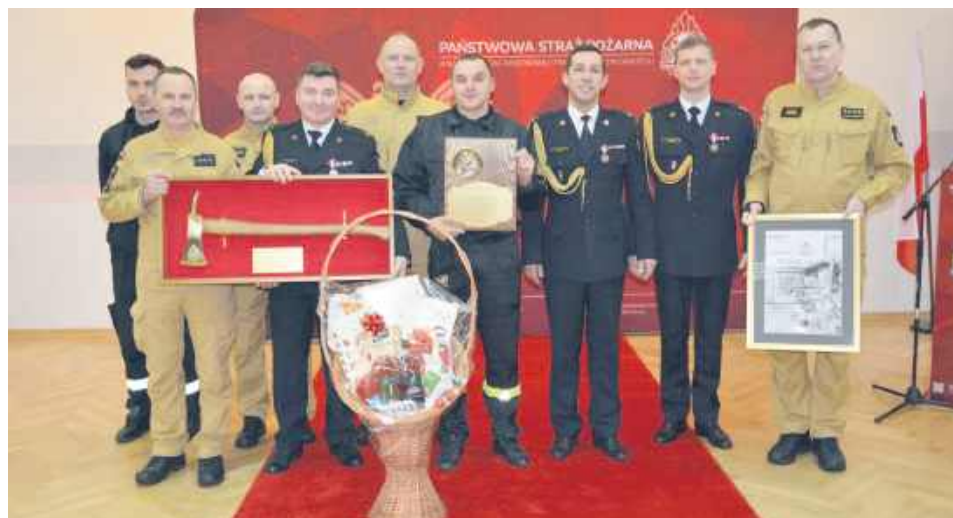
Trzech strażaków przeszło na zaopatrzenie emerytalne.