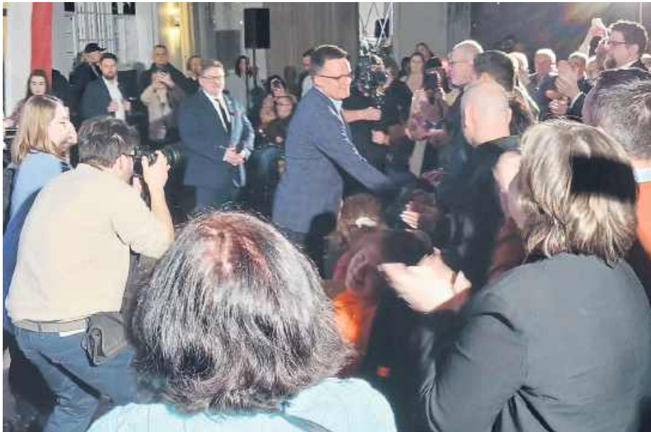
Szymon Hołownia zakończył trwające prawie 2 godziny spotkanie, apelując do mieszkańców, by w nadchodzących wyborach postawili na kandydatów, którzy będą działać na rzecz ludzi, a nie interesów partyjnych.

Gożą przywitany przez zamościan i przyjezdnych marszałek Sejmu wyraził przekonanie, że przyszłość miast takich jak Zamość powinna być związana z równomiernym rozwojem kraju, a jednym z najważniejszych czynników jest poprawa infrastruktury, w tym połączeń komunikacyjnych. – W Polsce powinniśmy rozwijać się po polsku. Co to znaczy? Że nie tylko wielkie metropolie mają się rozwijać, a mniejsze miasta po-