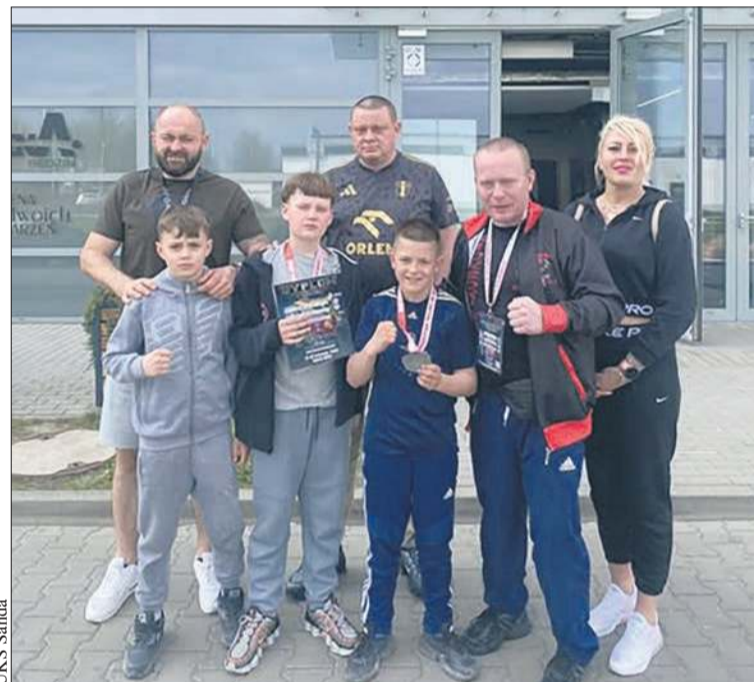
Płocka ekipa na mistrzostwach

12. Bieg Europejski już 8 maja przy ORLEN Stadionie