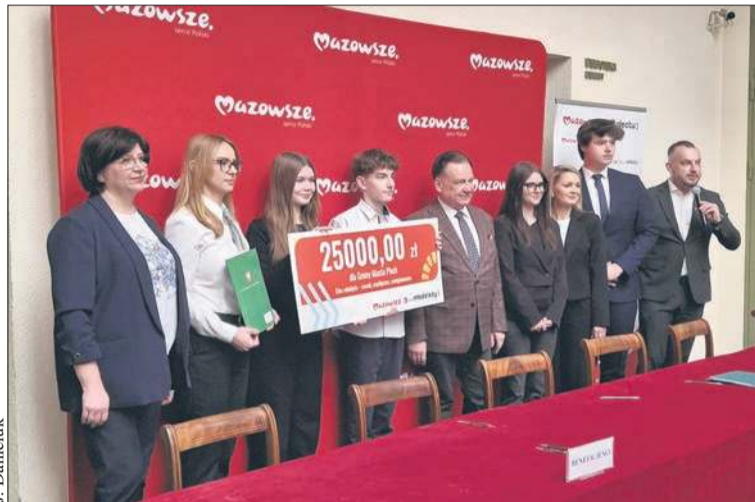
Wsparcie finansowe od samorządu Mazowsza otrzymały między innymi młodzieżowe rady miast, gmin i powiatów