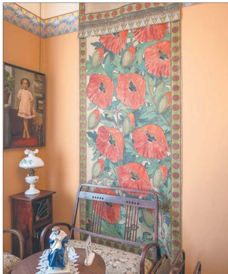
Tkaniny malowane przez Jana Bulasa w pokoju dziecięcym na wystawie „Secesja” Muzeum Mazowieckiego w Płocku