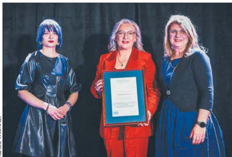
Nominacja Specjalna - Modular System