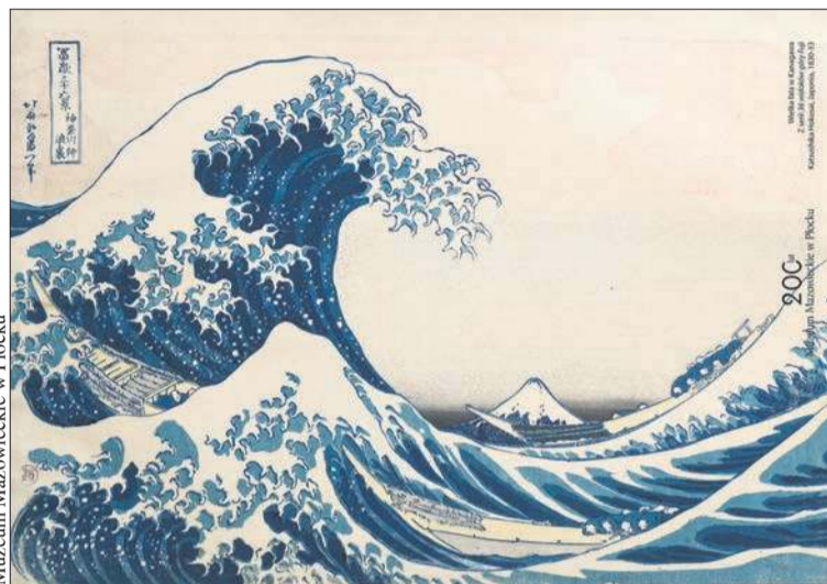
Muzeum Mazowieckie w Płocku

Dlaczego? Bo japońskie drzeworyty ukiyo-e pełniły kiedyś trochę taką rolę dzisiejszych gazet, plakatów albo Instagrama. Były tanie i masowo produkowane, odbijano je z matryc w dużych nakładach, więc mógł je kupić zwykły mieszkaniec miasta. Pokazy-