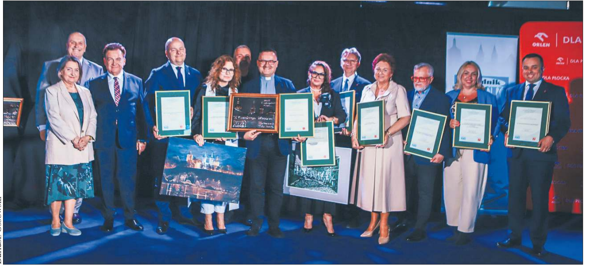
Nominowani i laureaci Plebiscytu „Wrosli w krajobraz miasta. Służą nam od lat...”