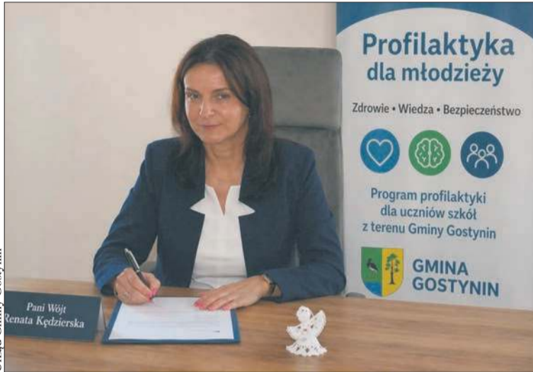
Urząd Gminy Gostynin