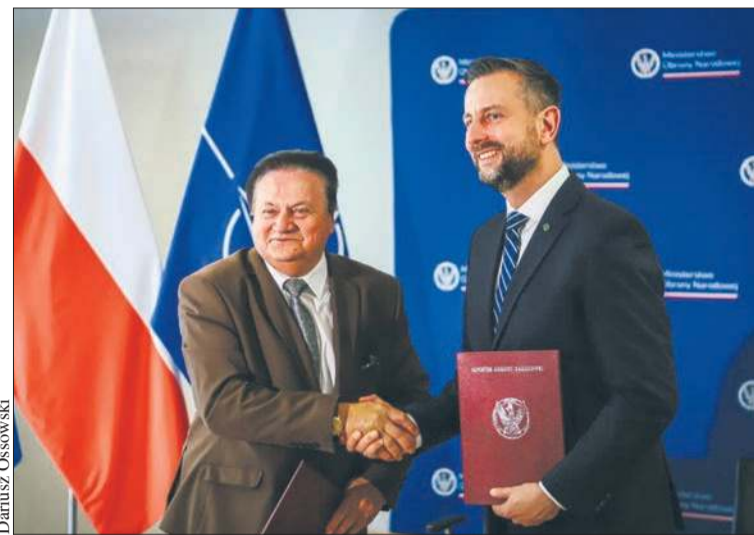
Szpital na Winiarach przystąpił do programu MON „szpitale przyjazne wojsku”

Płocka Galeria Sztuki zaprasza na niecodzienne spotkanie ze sztuką