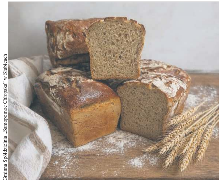
Chleb żytni 100% z piekarni GS w Słubicach