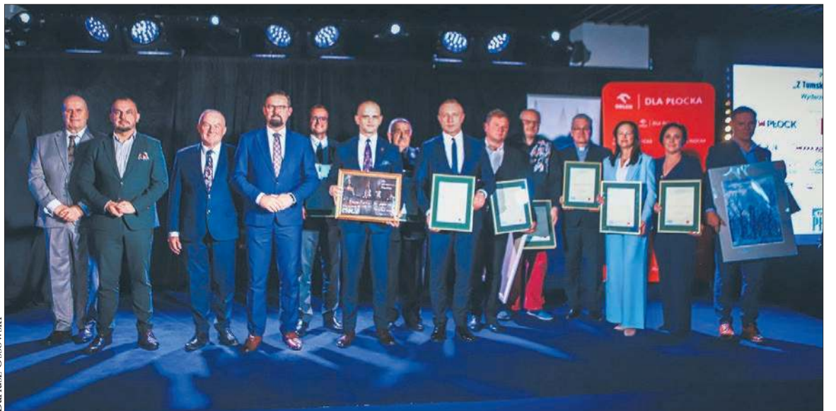
Nominowani i laureaci Plebiscytu „Na Mazowszu Plockim”