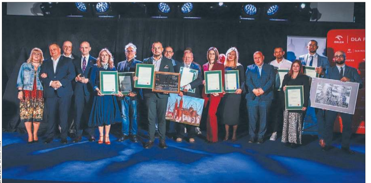
Nominowani i laureaci Plebiscytu „Sport, rekreacja, turystyka”