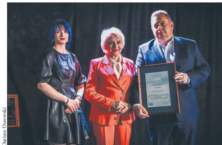
Nominacja Specjalna - ORLEN

W tej kategorii czytelnicy postawili na świetnie działający od dekady żłobek w Słupnie, co przełożyło się na 3. miej-