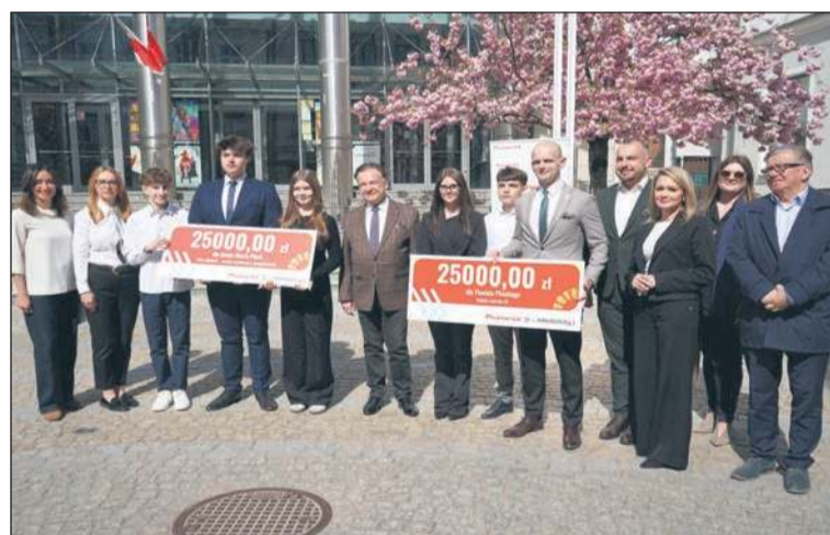
Są pieniądze na wsparcie działań Młodzieżowej Rady Powiatu Płockiego. Pozyskano je dzięki programowi „Mazowsze 2026”

Materiał przygotowany we współpracy ze Starostwem Powiatowym w Płocku