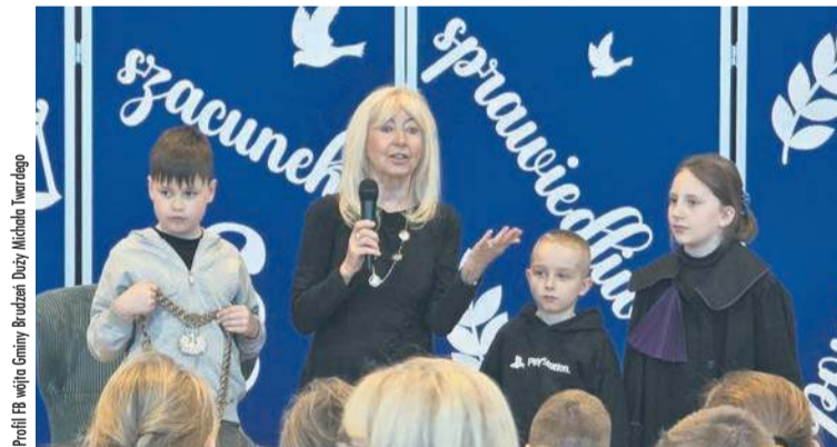
Sędzia Anna Maria Wesółowska spotkała się z uczniami szkół podstawowych z Gminy Brudzeń Duży

Znana z programów telewizyjnych sędzia Anna Maria Wesółowska odwiedziła Gminę Brudzeń Duży.