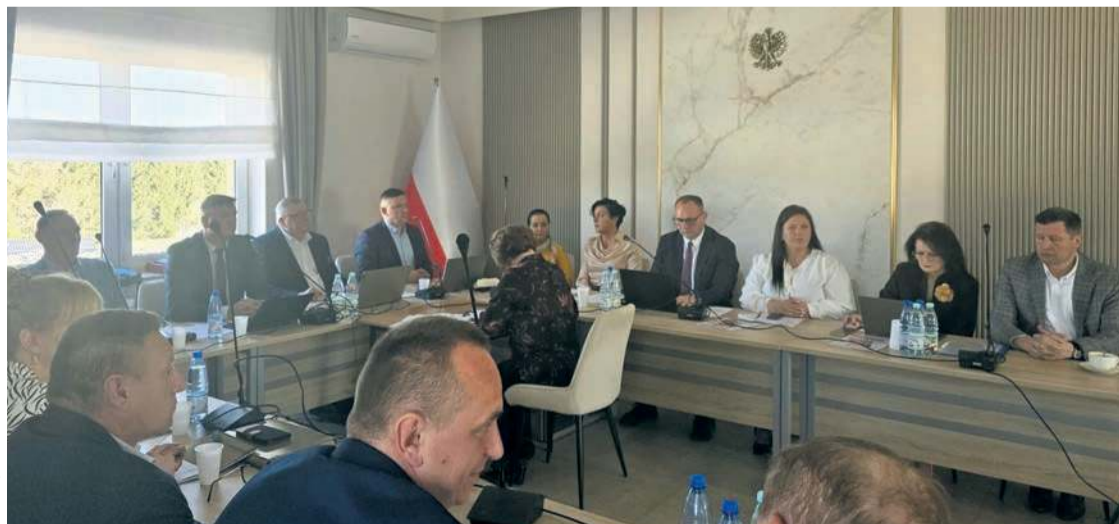
XXII Sesja Rady Gminy Brudzeń Duży