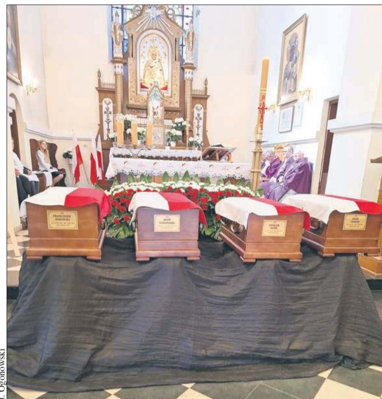
Trumny ze szczątkami ofiar