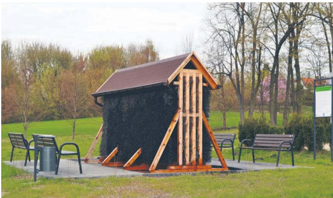
Material przygotowany we współpracy z Gminą Bodzanów