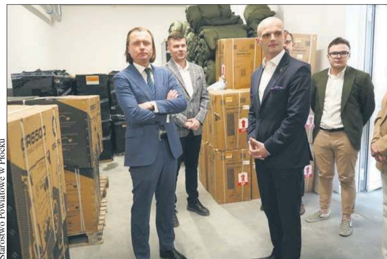
Na zdjęciu m.in. wojewoda Mariusz Frankowski, starosta Sylwester Ziemkiewicz

- Właśnie złożyliśmy wniosek m.in. o dofinansowanie przebudowy budynku w Gąbinie, gdzie powstanie kolejne tego typu miejsce. Staramy się także o środki na zakup kolejnego niezbęd-