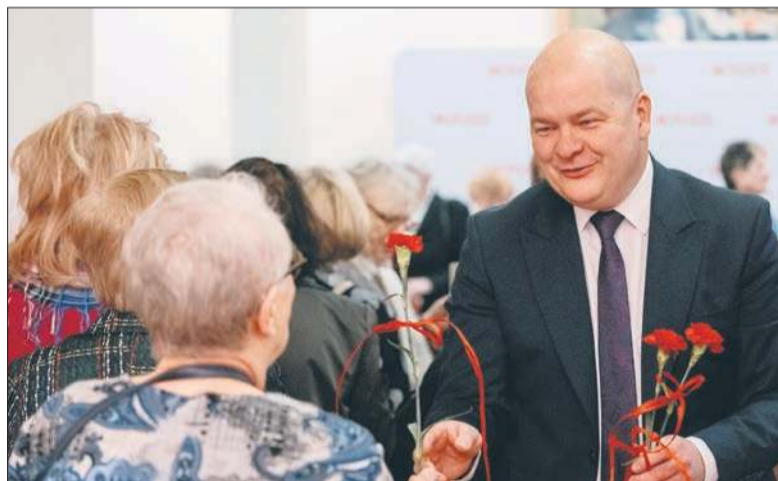
Prezydent Płocka Andrzej Nowakowski podczas Dnia Kobiet w szkole muzycznej

Klub jest czynny codziennie, od poniedziałku do piątku. W planach są m.in. gimnastyka usprawniająca, warsztaty muzyczne, teatralne, plastyczne, fotograficzne, spotkania okolicznościowe, wykłady, wspólne zwiedzanie Płocka czy potańcówki. Rekrutacja potrwa do końca kwiet-