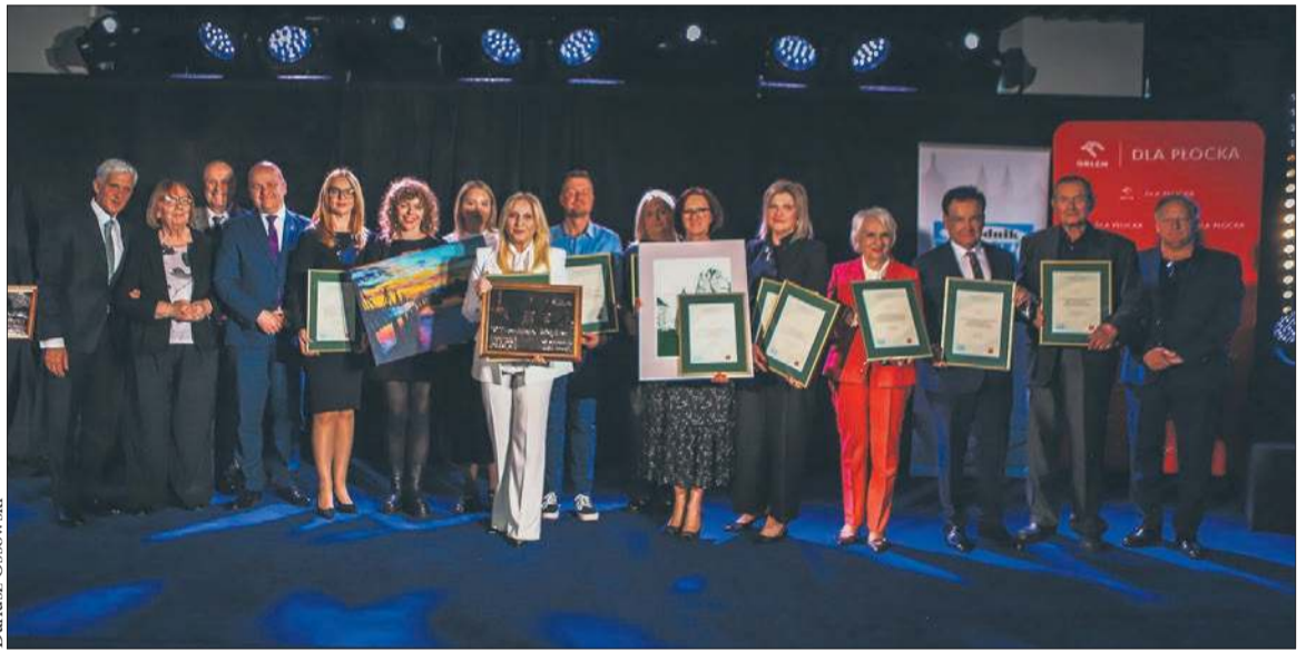
Nominowani i laureaci Plebiscytu „Kultura”