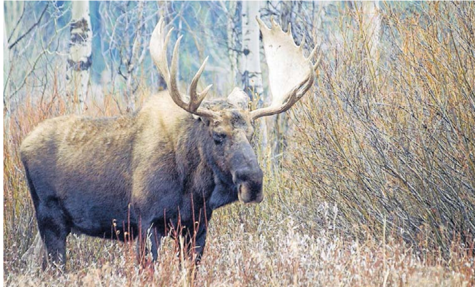
Kolizje z łosiami to nie tylko efekt wzrostu ich liczebności, ale też rozbudowy dróg. Znak „Uwaga dzikie zwierzęta” nie jest dekoracją

Populacja łosia rzeczywiście się odbudowała po nadmiernych odstrzałach w latach 90. W 2001 r. wprowadzono moratorium i od tego czasu liczebność tych zwierząt rośnie. Pojawiają się liczby od 30 do nawet 45 tysięcy osobników. Trzeba jednak podchodzić do nich ostrożnie. Liczenie dzikich zwierząt w skali kraju jest niezwykle trudne, kosztowne, czasochłonne i obciążone błędem. W badaniach mojego zespołu stosujemy kilka metod równoległe: tropienia, liczenia odchodów jako wskaźnika zagęszczenia i fotonapki. Każda metoda daje nieco inne wyniki. Dlatego bardziej wiarygodne jest mówienie o zagęszczeniu na jednostkę powierzchni.