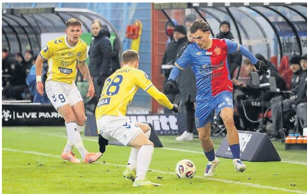
Ważne punkty w kontekście utrzymania Motor Lublin wywalczył w delegacji w Gliwicach

Legia zyskała punkty, ale może stracić czołowego