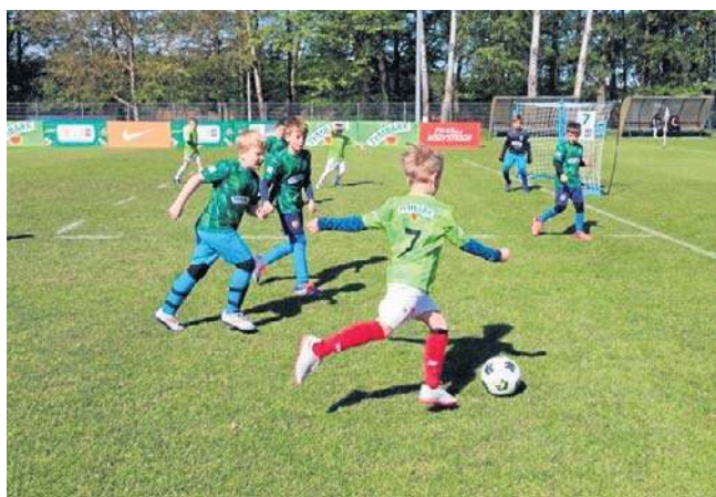
W Szczecinku wszystkie drużyny z Pomorza Zach. mają bardzo dobrze przygotowane boiska do gry

Organizatorzy zachęcają wszystkie szkoły podstawowe z terenu powiatu i wojewódz-