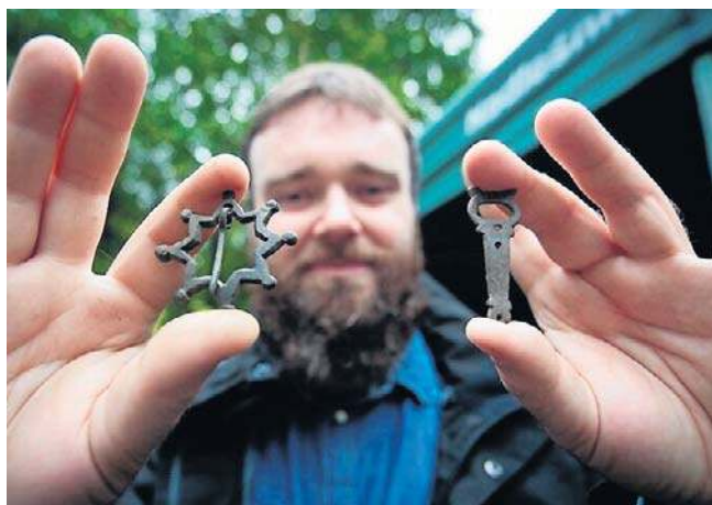
Średniowieczne miasto istniało najpewniej od pierwszej połowy XIV wieku. Na zdjęciu znalezione przedmioty

Pierwszych dowodów na użytkowanie tego miejsca w średniowieczu dostarczyły już wstępne badania z zastoso-