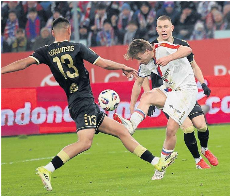
Obrona Pogoni zanotowała drugi mecz na zero z tyłu. Dawno tego nie było w Pogoni

Wzmocnienia są konieczne, choć drużyna zaczęła punktować. - Mówiłem, że trudna sytuacja w lidze musi zmienić funkcjonowanie zespołu. My-