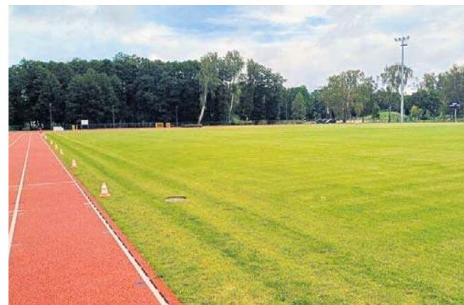
Może być tak, że piłkarze Sławy Sławno z boiska będą mogli skorzystać dopiero w nowym sezonie

A do startu piłkarskiej wiosny coraz bliżej. ZZPN nie planuje zbiorczego odwołania inauguracyjnych meczów w związku z pogodą. IV liga wraca do gry 7 marca, okręgowki 7 marca (zaległe mecze z jesieni) i 14 marca (wiosenna seria). Podobnie jest w przypadku rozgrywek A-Klasy. ©@