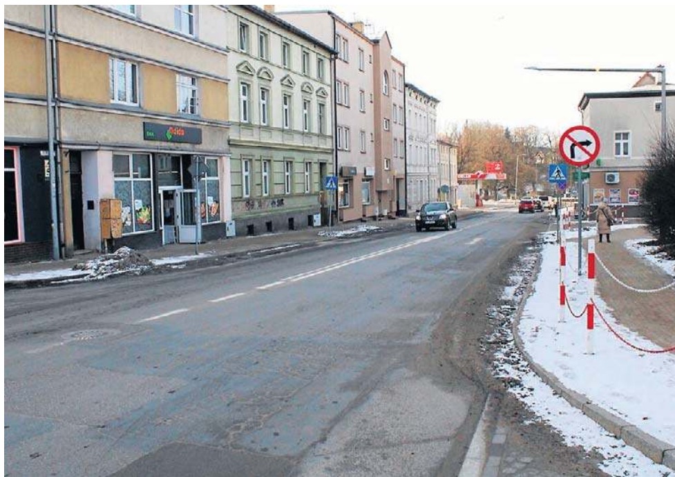
Remontem ma być objęty odcinek od ronda przy stacji paliw Orlen aż do skrzyżowania z ul. Monte Cassino. Przebudowana ma być jezdnia oraz chodniki