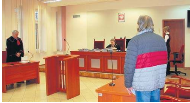
Sąd Rejonowy w Jasle w ustnym uzasadnieniu wyroku zaznaczył, że na lekarzu ciąży szczególny obowiązek opieki lekarskiej nad pacjentami

Według prokuratury, wypisanie ze szpitala uniemożliwiło wdrożenie adekwatnego do stanu pacjentki leczenia, przez co naraził ją nieumyślnie na bezpośrednie niebezpieczeństwo utraty życia, to jest o popełnienie przestępstwa z art. 160 par. 2 i 3 Kodeksu kar-