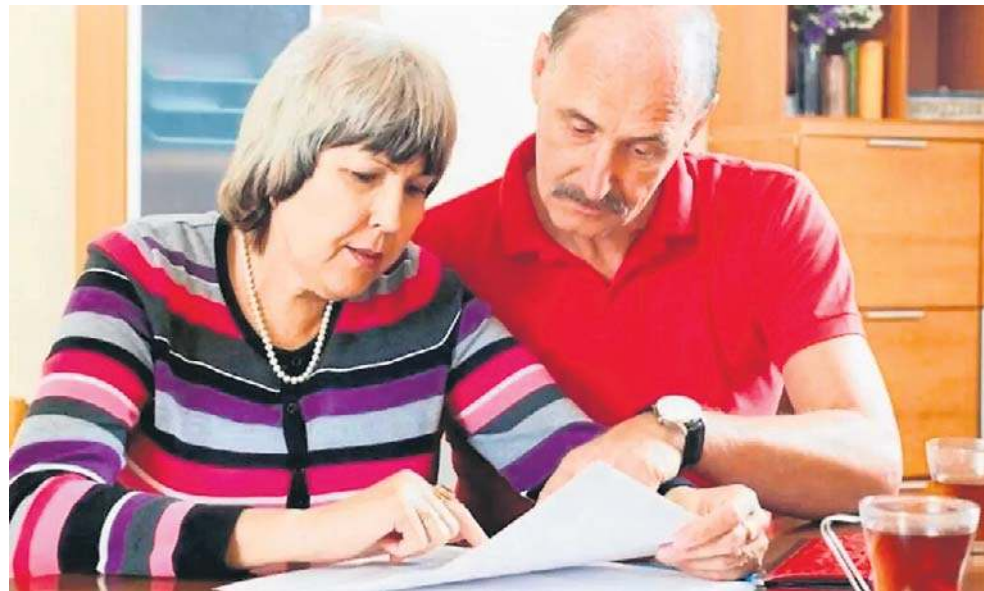
Wniosek o niepobieranie zaliczek na podatek dochodowy, ZUS wysłał do ponad 460 tys. emerytów i rencistów razem z PIT-em za 2024 rok. Nie zawsze jednak warto go składać

Tak będzie do momentu, gdy łączna kwota tych świadczeń w roku nie przekroczy 30 tysięcy złotych.