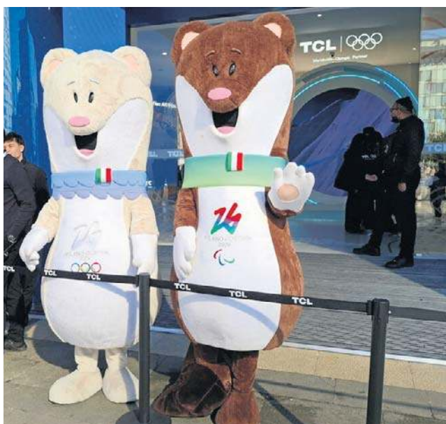
Maskotki XXV Zimowych Igrzysk Olimpijskich i XIV Zimowych Igrzysk Paralimpijskich - gronostaje Tina i Milo

- Skialpinizm miał fenomenalny start, wprawdzie niesamowitej atmosferze - wyjaśnił