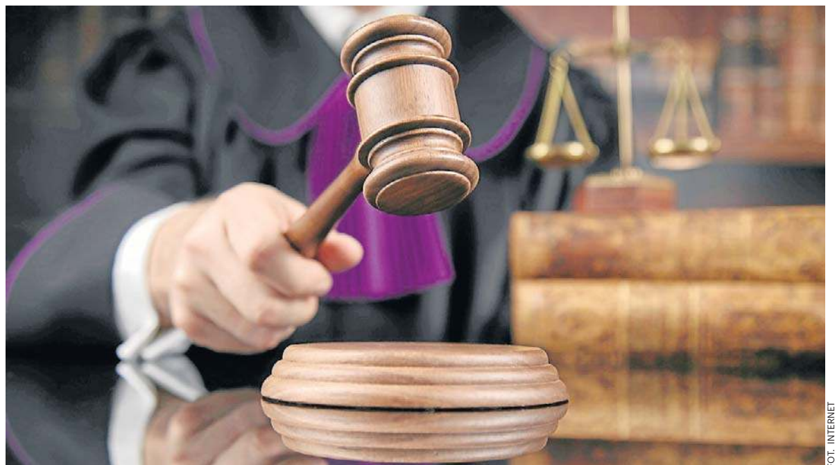
Sprawa miała swój finał na sali sądowej

Obaj mężczyźni zaraz po tym, jak cała sprawa wyszła na jaw, także stracili pracę - jeden z nich pracował w tym czasie na okresie próbnym.