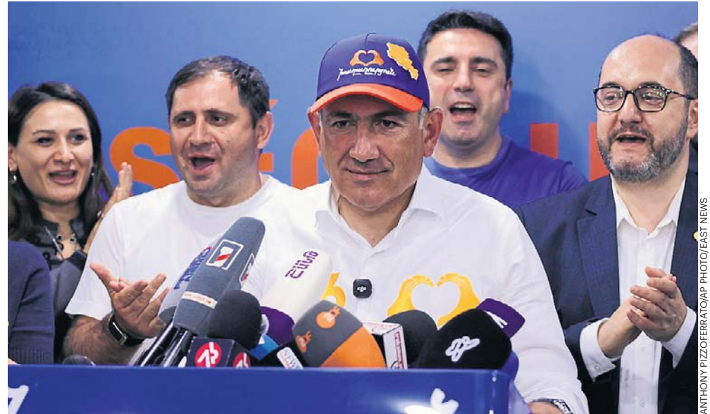
Premier Armenii Nikol Paszynian przemówił w siedzibie swojej partii Umowa Społeczna po wygranych wyborach parlamentarnych w Erywanii

Paszynian oświadczył, że „trójgłowa partia wojny została zmiażdżona”. Paszynian od lat przedstawia opozycję jako siłę, która dąży do ponownego rozpoczęcia wojny z Azerbejdżanem.