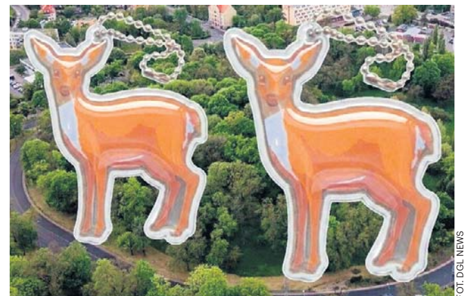
FOT. DGL NEWS

– Imię sarenki będzie widniało na odblaskach, które jako praktyczny gadżet łączący promocję miasta z bezpieczeństwem, będzie rozdawany najmłodszym mieszkańcom Głogowa – informuje UM. ©