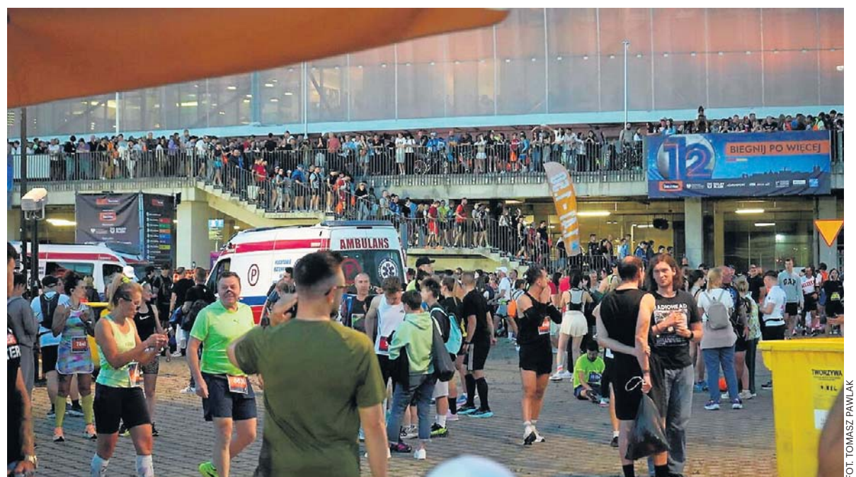
Strzałem w dziesiątkę okazała się lokalizacja startu i mety na Tarczyński Arenie

Leon XIV: Godność człowieka nie może być podporządkowana zmiennym opiniom str. 8