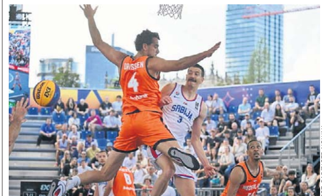
Mimo nienajlepszych wyników Polaków, kibice bawili się doskonale na imprezie na Placu Defilad w Warszawie