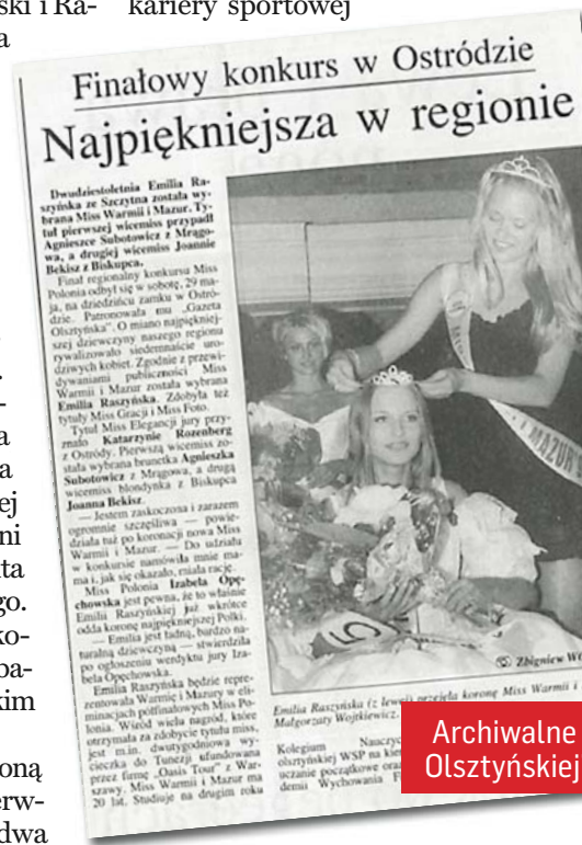
Archiwalne wydanie „Gazety Olsztyńskiej” z 31 maja 1999 r.