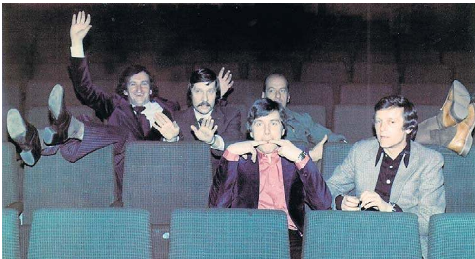
Audycja powstała w 1956 roku, na bazie tak zwanych przemian październikowych

Bez skromności fałszywej potwierdzę to, że tak rzeczywiście jest, ponieważ odbieramy takie sygnały od bardzo wielu