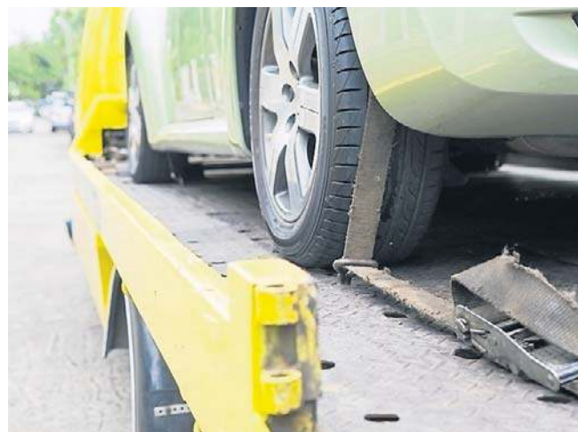
FOT. FREEPIK/IZDIEJE ILLUSTRACYJNE

kluczowym „narzędziem pracy” podejrzanego. To właśnie nią podjeżdżał, ładował samochód i tą samą drogą spokojnie odjeżdżał z łupem, nie wzbudzając żadnych podejrzeń. Okazało się, że ten sposób wykorzystał również na parkingu długoterminowym wrocławskiego lotniska, gdzie w styczniu doszło do całej serii kradzieży samochodów. Łączne straty oszacowano na ponad sto sześćdziesiąt tysięcy złotych, a sprawa odbiła się szerokim echem w dolnośląskich mediach. Magdalena Marszałek