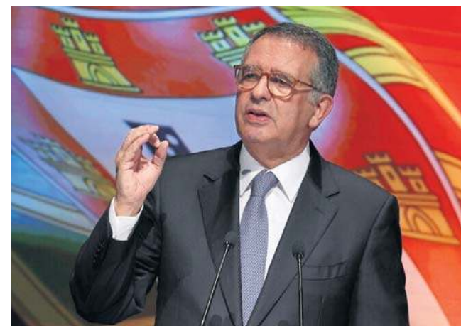
W II turze wyborów Seguro poparło 3,45 mln obywateli uczestniczących w głosowaniu. Frekwencja – 50,1 proc.

Dodał, że nie zamierza jednak podejmować działań służących osłabieniu rządu Montenegro lub przyczyniać się do przedterminowych wyborów parlamentarnych. PAP