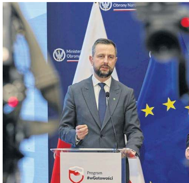
Kosiniak-Kamysz: Od 7 marca ruszy tegoroczna edycja szkoleń dla cywilów „wGotowości”

Kosiniak-Kamysz przedstawił m.in. koncepcję stworzenia tzw. rezerwy wysokiej gotowości - czyli przeszkolonych rezerwistów, regularnie biorących udział w ćwiczeniach. Łącznie z wojskiem zawodowym, WOT i pozostałymi formami służby wojskowej ma to dać 500 tys.