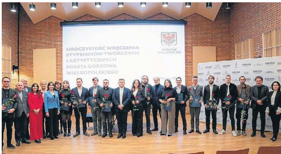
Wręczenie prezydenckich stypendiów odbyło się wczoraj w sali kameralnej Filharmonii Gorzowskiej

- Zamierzam zrobić pełną konserwację jednych z secesyjnych drzwi w mieście. Wymyślałam ten program, bo chcę zachęcić mieszkańców do pracy z konserwatorami. Chcę pokazać, że nie trzeba wymieniać starych drzwi na nowe, że