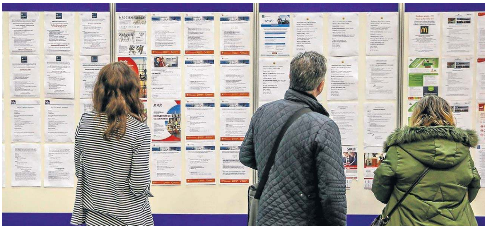
Portale z pracą w styczniu 2026 roku odnotowały znaczący wzrost liczby CV

- To nie jest jednorazowe wahnięcie, lecz wyraźny trend wzrostowy, choć nadal mówimy o relatywnie niskim bezrobociu w ujęciu historycznym. Rynek pracy schładza się przede wszystkim przez ograniczenie nowych rekrutacji, a nie masowe zwolnienia. Firmy zamrażają etaty, wydłużają procesy decyzyjne i ostrożniej podchodzą do roz-