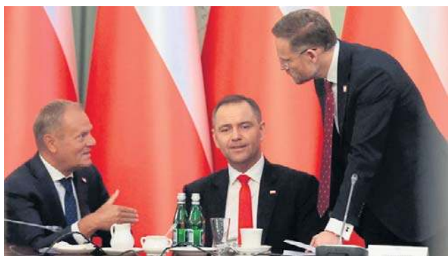
Posiedzenie Rady Gabinetowej, Donald Tusk, Karol Nawrocki, Zbigniew Bogucki

Na obecny krajobraz makroekonomiczny składa się kilka kluczowych czynników, które w różnym stopniu będą kształtować koniunkturę w bieżącym roku. Wśród nich szczególnie znaczenie będą miały: tempo inwestycji i popytu krajowego, sytuacja u głównych partnerów handlowych oraz warunki finansowania w gospodarce.