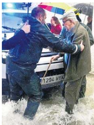
W wielu miejscach trwa ewakuacja

Władze Andaluzji i rząd centralny zmobilizowały wszelkie siły, aby zapobiec najgorszemu scenariuszowi. Kilkanaście tysięcy osób musiało opuścić domy w różnych prowincjach: Kadyksie, Kordobie, Jaén, Maladze, Granadzie i Sewilli.