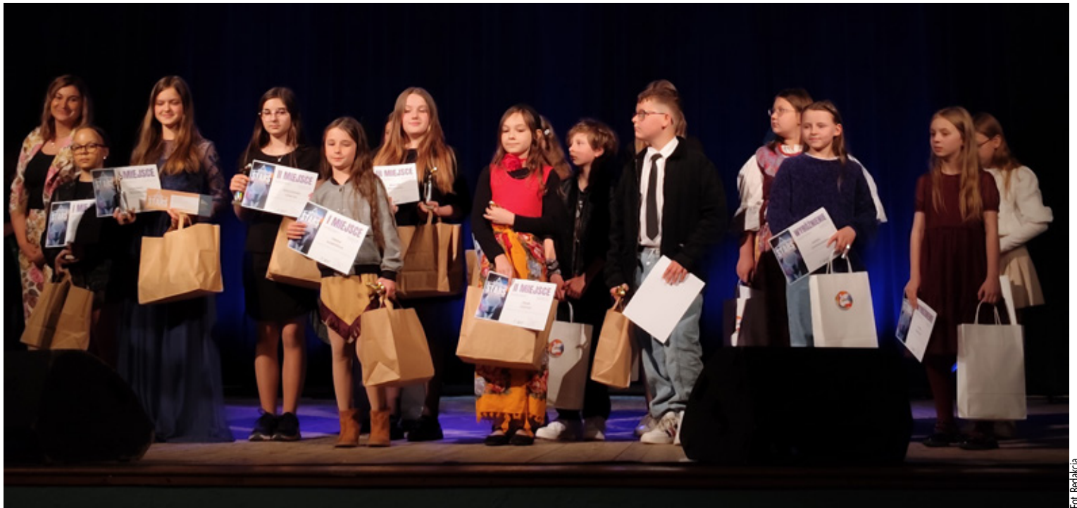
Wszyscy razem na scenie.

Organizatorzy podkreślają, że konkurs z roku na rok przyciąga coraz więcej utalentowanych młodych wokalistów, a poziom artystyczny uczestników stale rośnie. Dla wielu dzieci i nastolatków był to pierwszy występ na