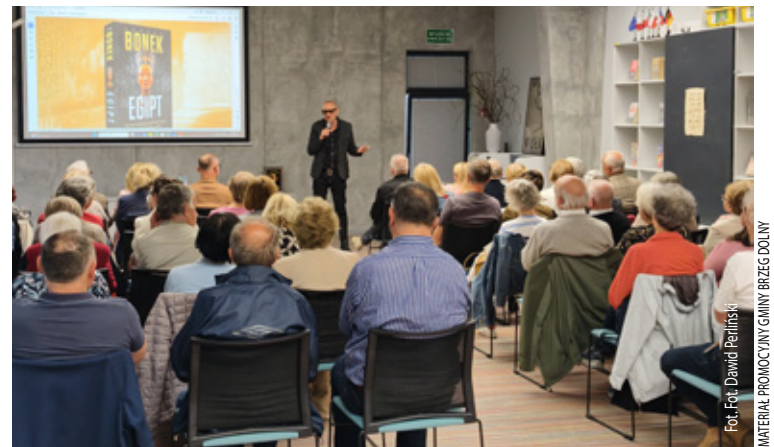
MATERIAŁ PROMOCYJNY GMINY BRZEG DOLNY