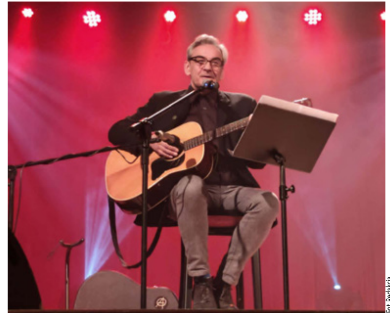
Zachwycający występ Gonery.