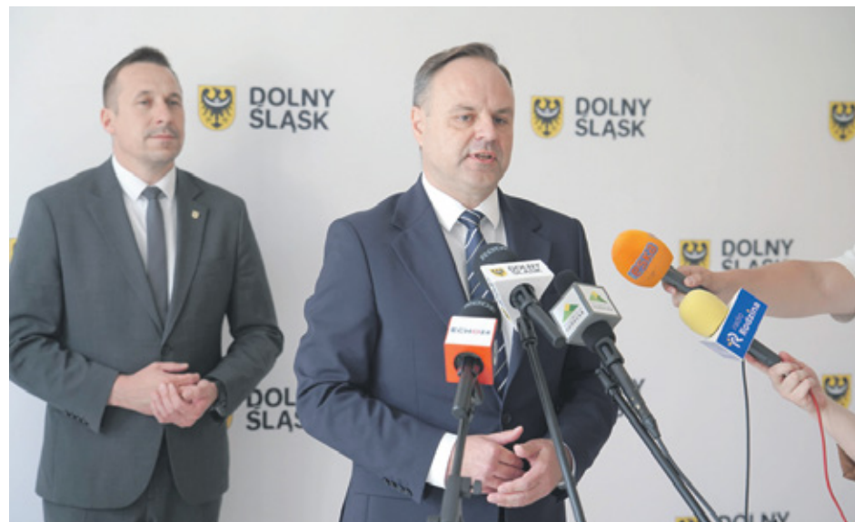
Operatorem programu jest Dolnośląski Fundusz Rozwoju