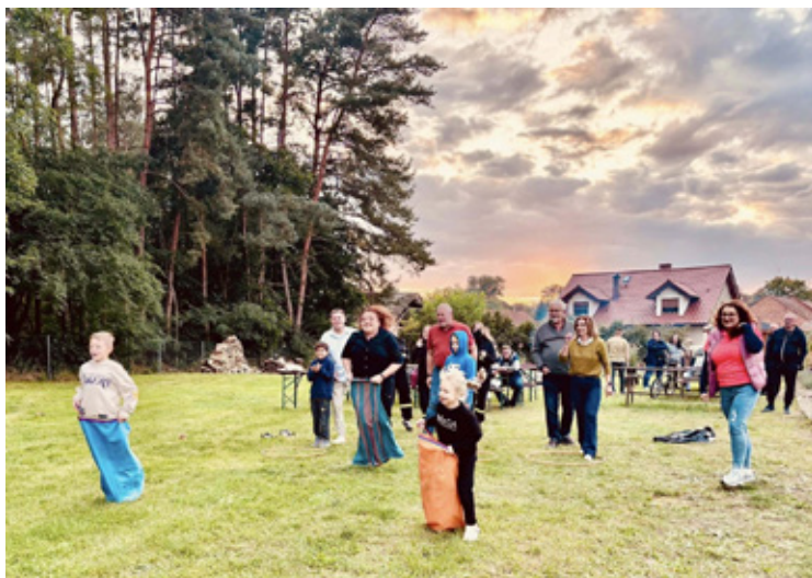
Zajęcia sportowe to znaczna część Święta Ziemiaka.

Zgodnie z regulaminem każdy projekt musiał zdobyć minimum