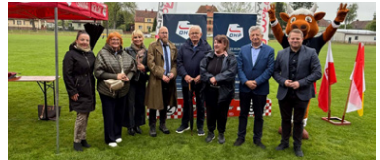
Mistrzostwa Dolnego Śląska Młodzieży w Lekkiej Atletyce OHP.

Równie dużo działa się na Stadionie Miejskim, gdzie odbyły się Mistrzostwa Dolnego Śląska Młodzieży w Lekkiej Atletyce OHP. Wołów już kolejny raz był