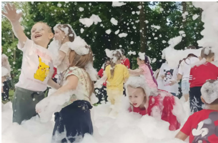
Piana party podbiła serca wszystkich.

Sukces ubiegłorocznej edycji wciąż żywy w pamięci. Kto miał okazję uczestniczyć w ubiegłorocznym pikniku organizowanym przez PCPR Wołów, ten doskonale wie, że poprzeczka została postawiona niezwykle wysoko. Zeszłoroczna impreza okazała się ogromnym sukcesem frekwencyjnym i organizacyjnym. Wyjątkowo ciepła, wręcz domowa atmosfera i wspaniale przygotowane strefy animacji pokazały, jak wielką siłę ma nasza lokalna społeczność. Tamto spotkanie na długo zapadło w pamięć jako wzór doskonałej, bezpiecznej i integrującej zabawy, która w piękny sposób przybliżyła ideę rodzicielstwa zastępczego.