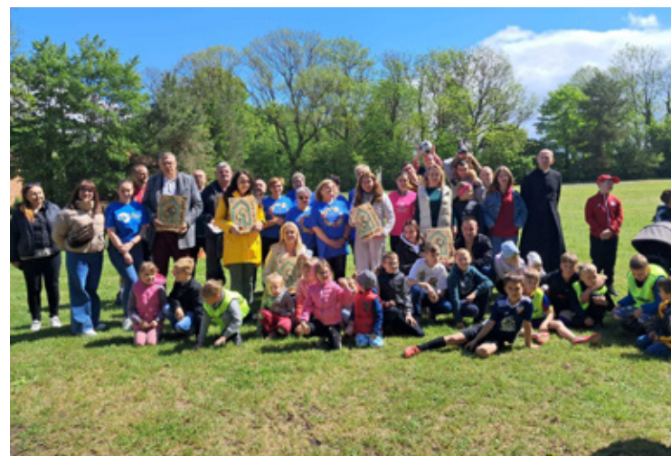
Mieszkańcy Krzydliny Małej dumni ze swojej wsi.