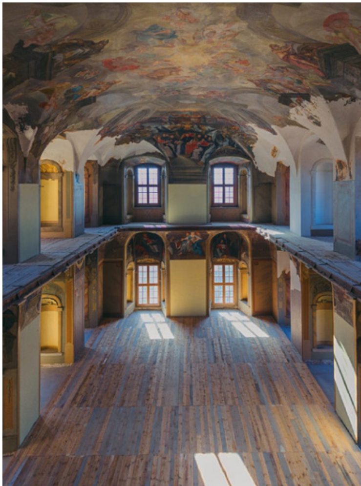
Biblioteka w pocysterskim klasztorze w Lubiążu ponownie zostanie udostępniona zwiedzającym.

Cystersi służyli z przywiązaniem do wiedzy, a klasztorne biblioteki były w tamtych czasach jednymi z najważniejszych centrów nauki i kopiowania ksiąg. Wielu historyków podkreśla, że biblioteka w Lubiążu należała kiedyś do najcenniejszych bibliotek klasztornych na Śląsku. Do dziś zachwyca nie tylko swoją historią, ale także niezwykłym klimatem. Cisza, światło wpadające przez wysokie okna i monumentalne polichromie sprawiają, że miejsce wygląda niemal jak scenografia filmu historycznego. Przez lata