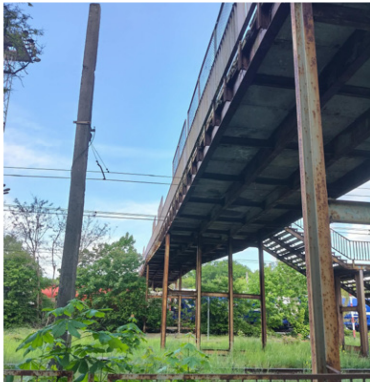
Rdza, dziury- kładka jest obecnie bardzo niebezpiecznym obiektem.

Batalia o bezpieczeństwo mieszkańców trwa latami. Ostatnia decyzja zapadła 27 stycznia. Wojewódzki Sąd Administracyjny w Warszawie utrzymał w mocy nakaz remontu kładki wydany przez Głównego Inspektora Nadzoru Budowlanego. PKP PLK jednak nadal próbowały „gry na zwłokę”, składając wniosek o wstrzymanie wykonalności decyzji, jednak 5 maja została ona ponownie oddalona przez NSA.