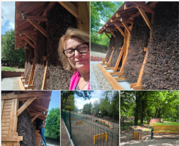
Wójt na Facebooku pokazała efekty inwestycji - tężni w Wińsku.