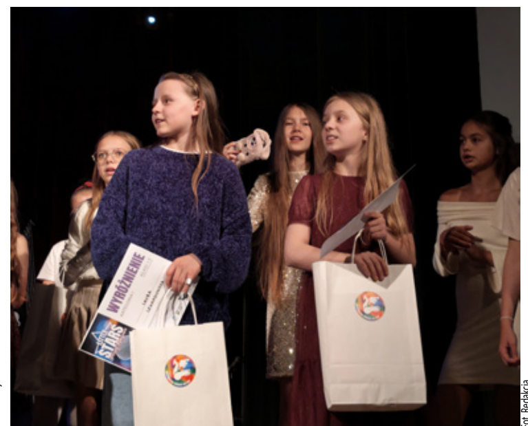
Wyróżnienia i nagrody.