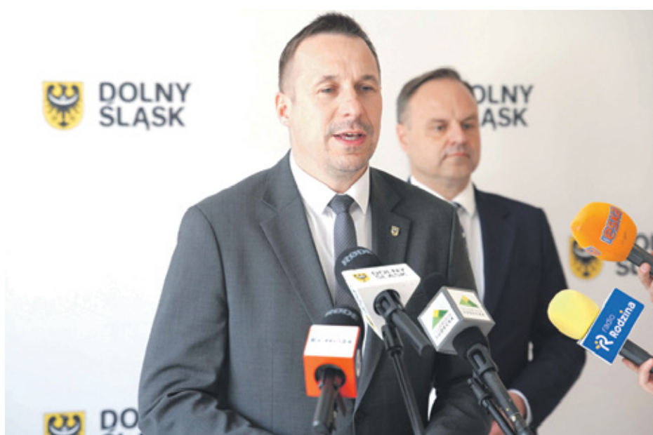
- Chcemy przygotować dolnośląskie firmy na wyzwania przyszłości i wzmacniać bezpieczeństwo regionalnej gospodarki - marszałek Paweł Gancarz

Chodzi m.in. o zakup nowoczesnych obrabiarek, maszyn CNC czy systemów zwiększających bezpieczeństwo cyfrowe przedsiębiorstw. W czasie pokoju będą wykorzystywane w standardowej działalności, a w razie potrzeby umożliwią