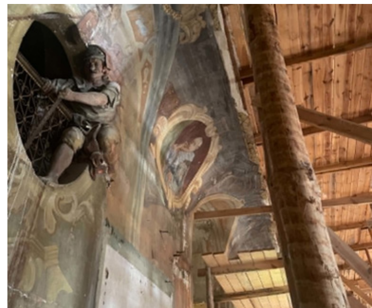
Remont biblioteki w Lubiążu trwał 30 lat.

Organizatorzy przypominają, że płatność za bilety możliwa jest wyłącznie gotówką. Klasztor w Lubiążu to jeden z największych zabytków barokowych w Europie i jedna z największych atrakcji turystycznych Dolnego Śląska. Otwarcie biblioteki to rzadka okazja, aby zobaczyć miejsce, które przez dziesięciolecia pozostawało niedostępne dla turystów.