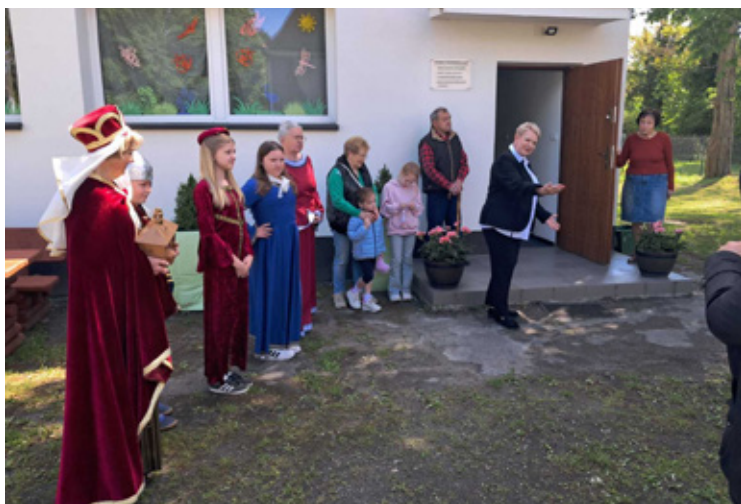
Wizyta w Łososiowicach.

Szczególną uwagę zwrócono na estetykę całej miejscowości. Kolorowe dekoracje, zadbane posesje oraz kreatywne elementy przygotowane wspólnie