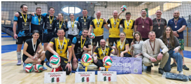
Wołowski Turniej Siatkówki Drużyn Mieszanych

Triumfatorami turnieju została drużyna The Generaci, która od początku zawodów prezentowała bardzo wysoką formę. W finałowym spotkaniu pokonała ekipę Nietykałnych 2:0, sięgając po