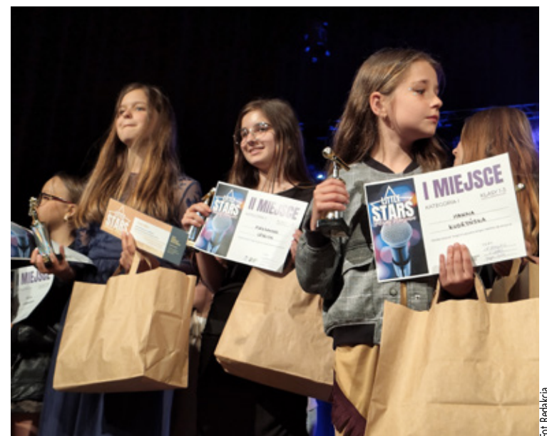
Duma i uśmiech.