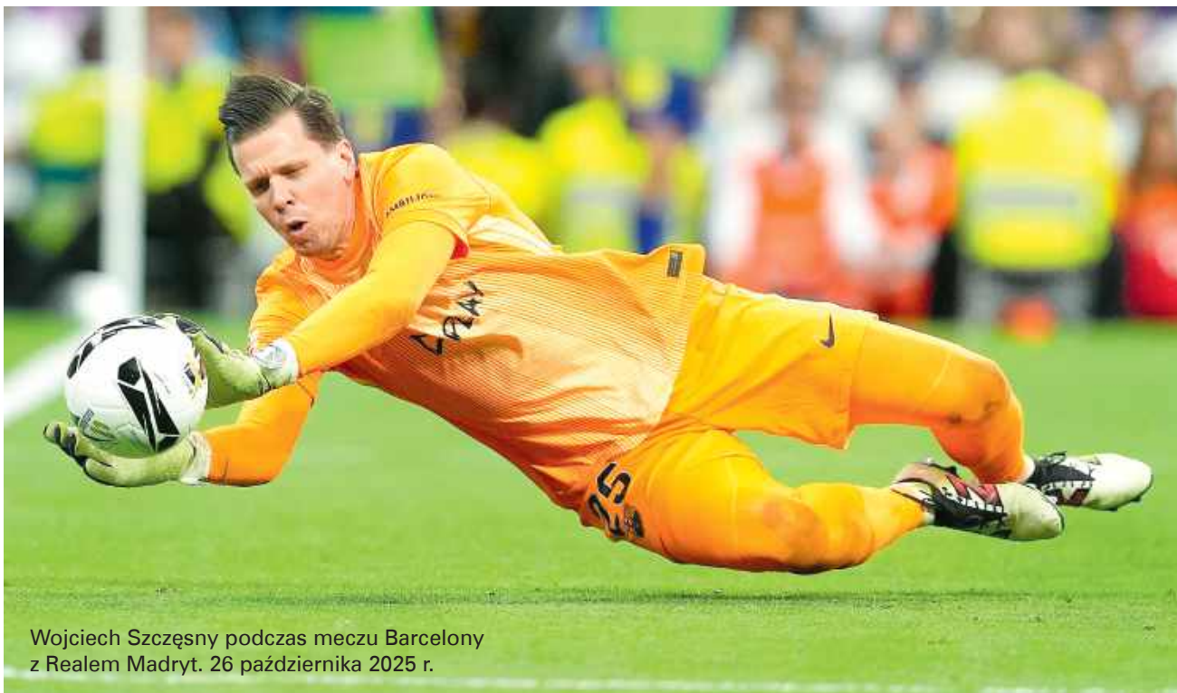
Wojciech Szczęsny podczas meczu Barcelony z Realem Madryt. 26 października 2025 r.

wielkim nieobecnym Barcelony okazał się Robert Lewandowski. Naderwał miesiąc na zgrupowaniu kadry, musimy się przyzwyczać, że dotąd niezniszczalny piłkarz, prowadzący wzorowy tryb życia sportowego, zapewne biologicznie znacznie młodszy, niżby wskazywała metryka, będzie coraz bardziej podatny na urazy. Coraz częściej się mówi o przenosinach Lewego do Serie A, która lubi przytulać gwiazdy w wieku przedemerytalnym i nieraz daje im tam drugą młodość.