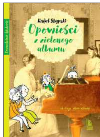
Rafał Skąpski, Opowieści z zielonego albumu, Wydawnictwo Literatura, Łódź 2025