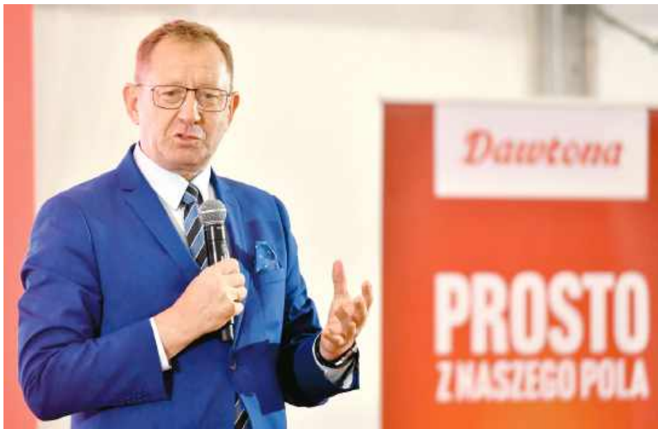
Minister Robert Telus na otwarciu linii produkcyjnej w zakładach Dawtona. Milejów-Osada, 19 września 2023 r.

Poseł PiS Marcin Horała, były pełnomocnik rządu ds. budowy CPK, najpierw utrzymywał, że nie miał o tym pojęcia, potem zmienił zdanie: stwierdził, że wiedział o wszystkim i usiłował transakcję zablokować.