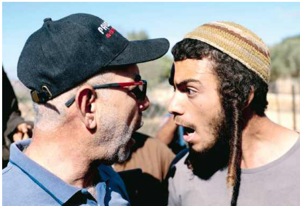
Kłótnia między izraelskim osadnikiem a palestyńskim rolnikiem podczas zbioru oliwek. Okolice Ramallah na okupowanym przez Izrael Zachodnim Brzegu, 29 października 2025 r.