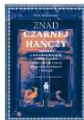
Fragmenty książki Piotra Malczewskiego Znane Czarnej Hańczy , Państwowy Instytut Wydawniczy, Suwałki 2025

Bania była i jest miejscem spotkań. Siedząc w parilce, gada się, opowiada, wspomina, czasem śpiewa. Dawniej zimową porą spotykano się w baniach, kobiety wyrabiały len (Iniane nici), śpiewano. W ostatnich latach, gdy kolędowaliśmy, to na wieczór spotykaliśmy się w mojej czarnej bani i śpiewaliśmy. Któregoś razu przybyli kolędnicy z różnych miejsc w Polsce. Śpiewali pięknie po polsku, ukraińsku, rosyjsku. Siedzieliśmy, śpiewając, w stygnącej bani pięć godzin.