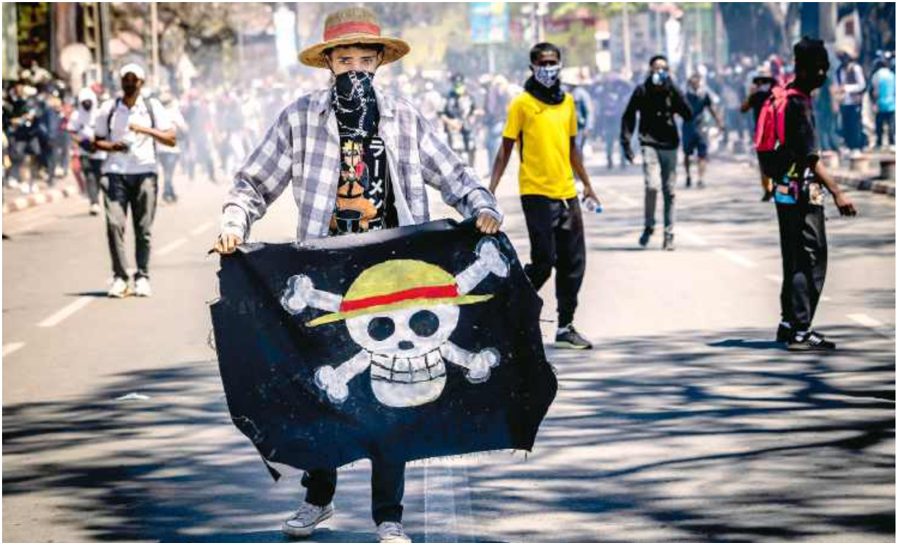
Protest studentów w stolicy Madagaskaru, 9 października 2025 r.

Młodzi wyborcy obalają rząd, ale nie mają pomysłu na ich zastąpienie