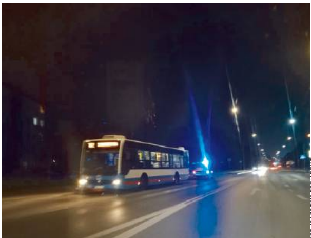
– Był spokojny, uprzejmy, pomocny.(...)

Zaraz po ujawnieniu sprawy wśród mieszkańców pojawiły się pytania, dlaczego, skoro istniało podejrzenie, że kierowca może być pod wpływem, dyspozytor nie nakazał mu zatrzymać się od razu i nie wezwał policji.