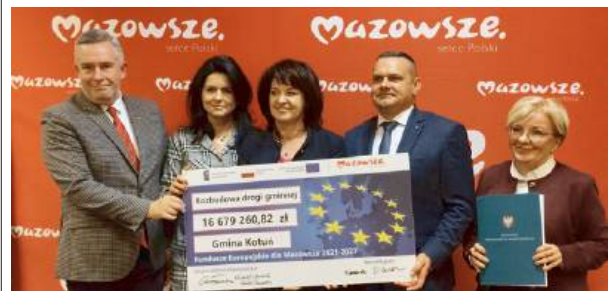
Gmina Kotuń otrzyma 16,7 mln zł na rozbudowę drogi wojewódzkiej.