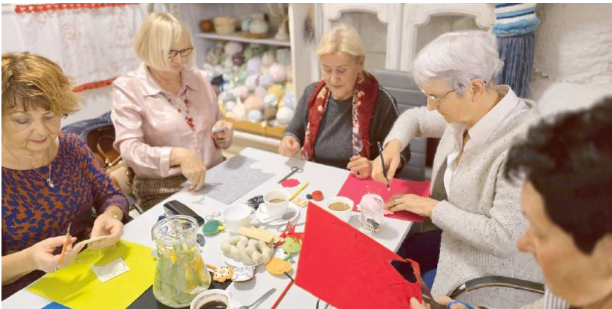
Uczestniczki podczas warsztatów rękodzielniczych.

Oficjalnie program ma zapewnić osobom w wieku 55+ z Siedlec i powiatu: atrakcyjne spędzanie czasu, dostęp do nowych mediów cyfrowych, budowanie i rozwijanie dialogu pokoleniowego oraz międzypokoleniowe-