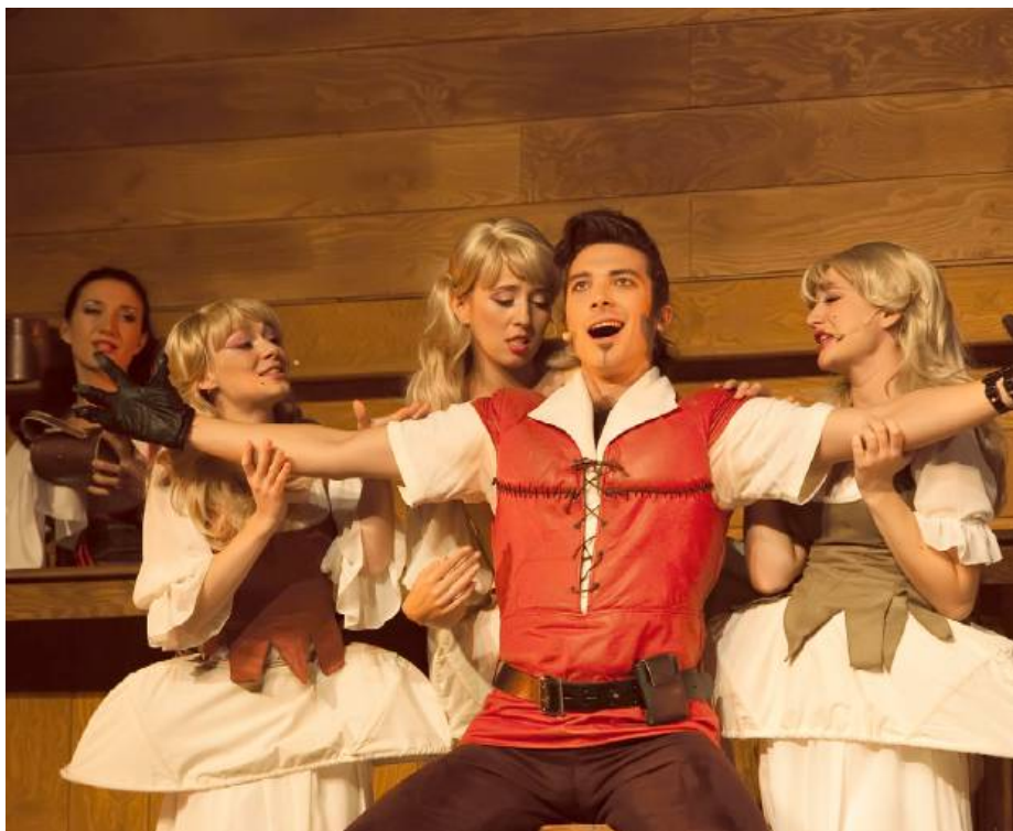
- Dziś prowadzę tu swoją niezależną grupę teatralną El Teatromotorr.