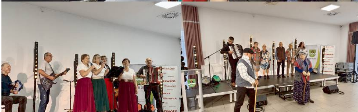
Spotkanie miało bardzo bogaty program.

ni, potrzebni i mamy motywację, by być aktywnymi na co dzień.