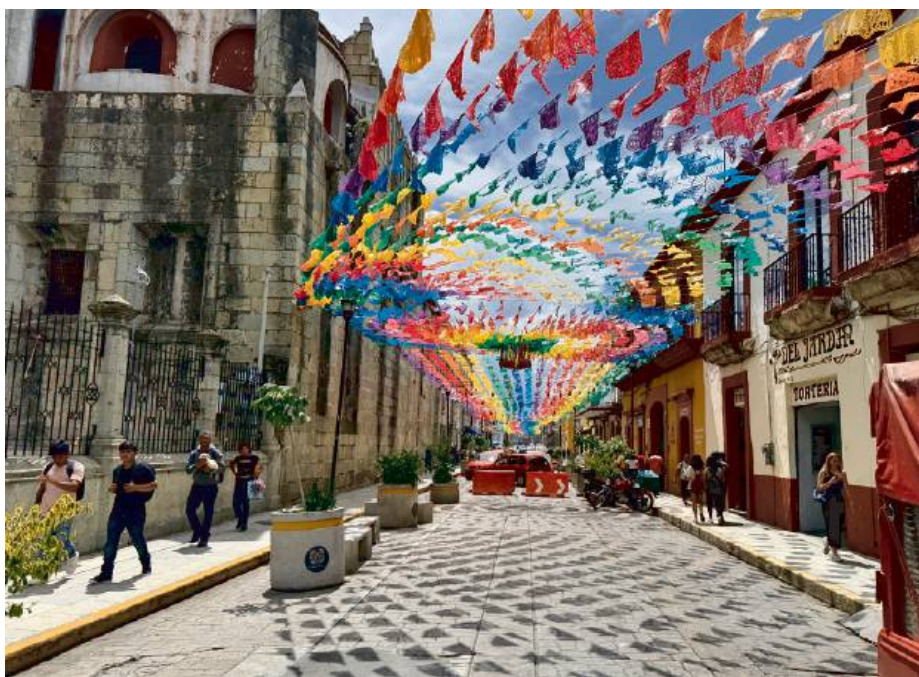
- W Oaxaca codzienność jest inna niż w Siedlcach, w Polsce.