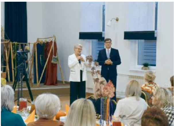
- Dzisiaj w Starej Kornicy wybrzmiewa rola kobiety – mówiła wójt.

Tegoroczne spotkanie poświęcono sztuce tkactwa – rzemiosłu, które przez pokolenia towarzyszyło życiu na wsi. Uczestniczki mogły nie tylko posłuchać opowieści o dawnych technikach przędzenia i tkania, ale też spróbować własnych sił przy warsztacie tkackim. O tajnikach tego pięknego zajęcia