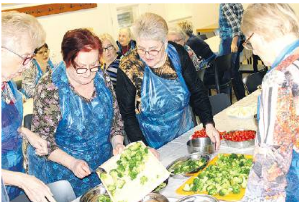
W tej edycji pomysłodawcy zaplanowali m.in.: warsztaty gastronomiczne