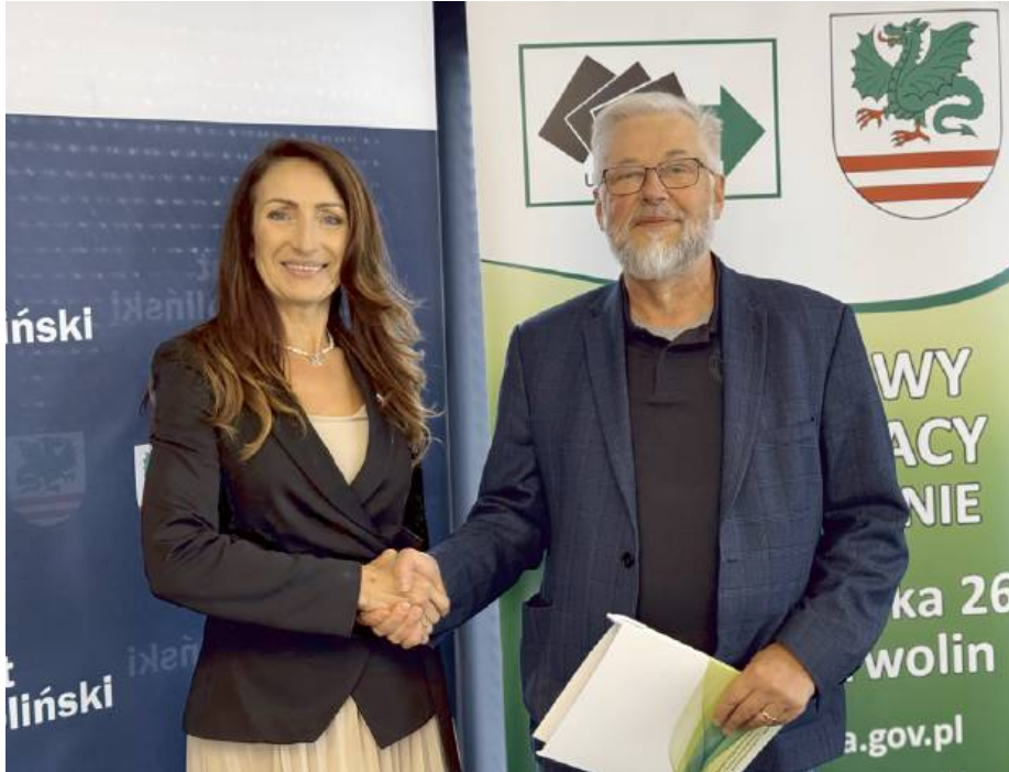
Iwona Kurowska, Starosta Powiatu Garwolińskiego, po podpisaniu umów

Na początku października 2025 roku w powiecie garwolińskim podpisano 42 umowy z lokalnymi pracodawcami w ramach wsparcia z Funduszu Pracy oraz programu Fundusze Europejskie dla Mazowsza 2021-2027. Dzięki tej inicjatywie aż 229 osób bezrobotnych otrzymało realną szansę na zdobycie doświadczenia zawodowego i rozpoczęcie nowego etapu kariery. Łączna wartość przyznanego wsparcia wyniosła ponad 3,1 mln zł, z czego ponad 220 tys. zł pochodziło ze środków Europejskiego Funduszu Społecznego.