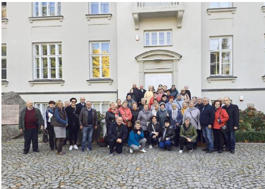
Seniorzy z gminy Sokołów Podlaski w podróży są aktywni i ciekawi.

Pierwszym punktem programu była przejażdżka czerwonym piętrowym autobusem w stylu retro. Pojazd, przypomi-