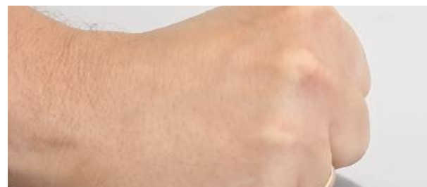
– Codziennie słyszałam, że jestem nikim. Że dzieci są nic niewarte.