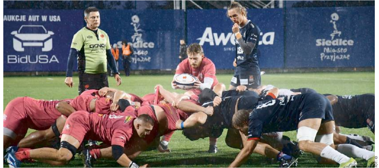
Mistrzowie Polski pokazali skuteczność zarówno w ofensywie, jak i w obronie.

Punkty: Nkululeko Ndlovu 7 (K, 2 pd), Bercho Botha 5 (P),