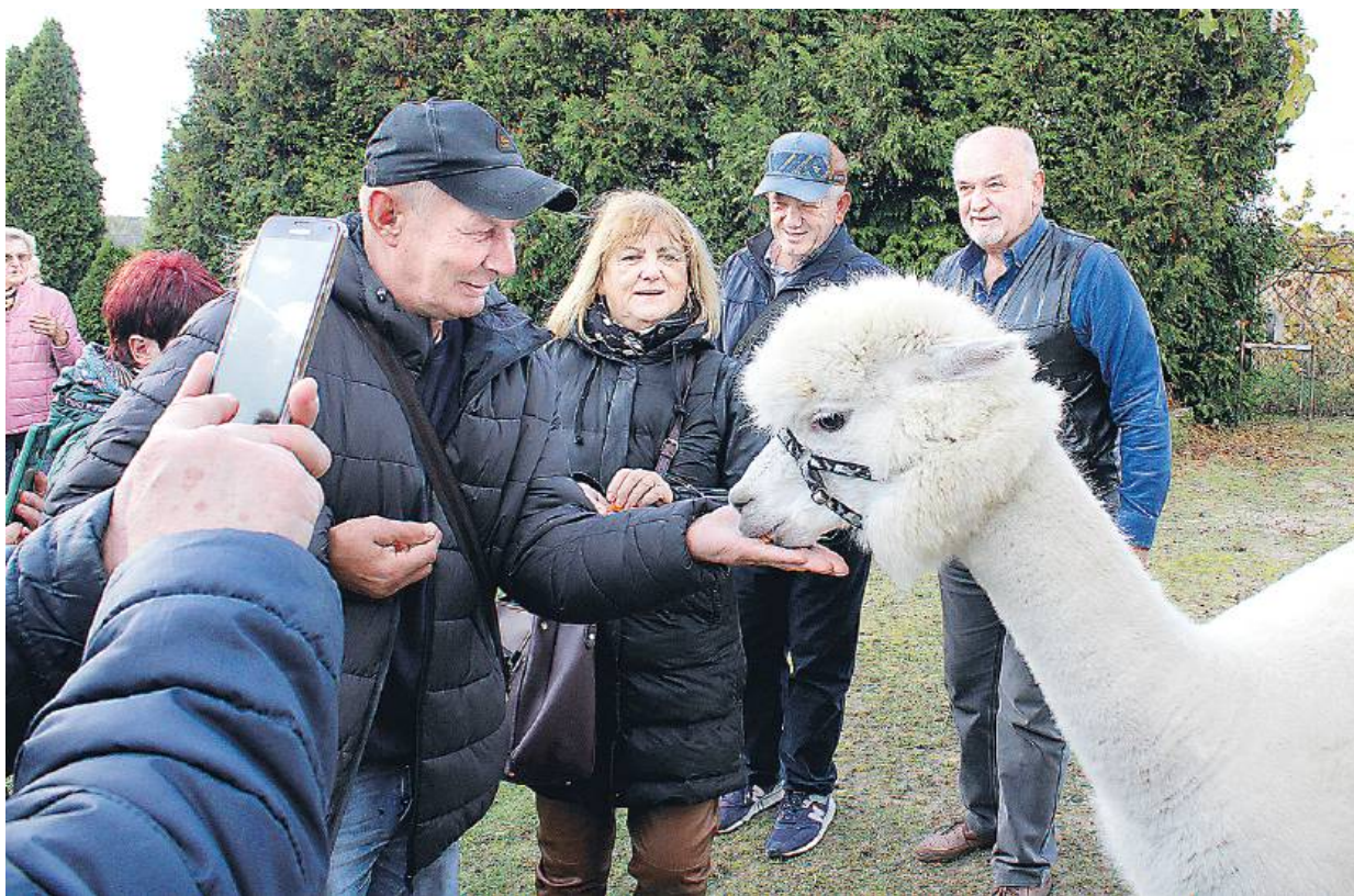
W programie tradycyjnie też znalazły się wycieczki.