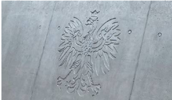
– Pomyślałem wtedy, że już nie ma sprawiedliwości. Zostałem oskarżony o coś, czego nie zrobiłem, straciłem czas i nerwy.

– Najpierw była myśl, że z tym sąsiadem nigdy nie byłem na wojennej ścieżce. Przypomniałem sobie tylko, że w przeszłości miał jakieś konflikty z innymi osobami z mojej rodziny. Potem, kiedy szok minął, zacząłem myśleć: „A co ja