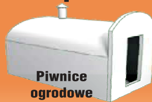
Piwnice ogrodowe typu „Loch”

• Sprzedaż • Transport • Montaż • Kompleksowe roboty ziemne