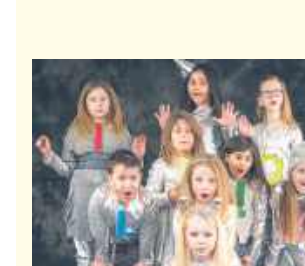
14. Grupa Sigma (od 7 do 14 lat), Wierzbica – grupa bardzo ciekawych świata dzieci obdarzonych talentem scenicznym i wielkim poczuciem humoru.

Moje restauracje Na osiedlowym moim podwórku grupa chłupaków kiełbą siedzieli, Dziś na ławeczce są wolne miejsca, bo swąje zimno zbiera gorzaka. Każdy z kolegów miał dobrą pracę, nieładną potem emeryturę. Za jej pomocą często i gęsto winem latami w budżecie dziury.