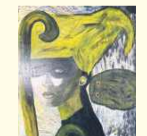
13. Renata Banasiak (60 lat), Chełm – malarstwo – olej i akryl.