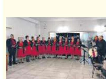
11. Zespół Koral , Kamień – głosy, które łączą pokolenia, powstał w 2008 roku.