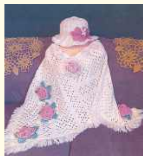
3. Jadwiga Żukowska , Bezek – Jest twórcą ludowym z dziedziny haft i koronka. Już od 20 lat wystawia swoje prace publicznie.