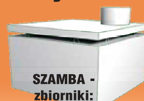
SZAMBA - zbiorniki: