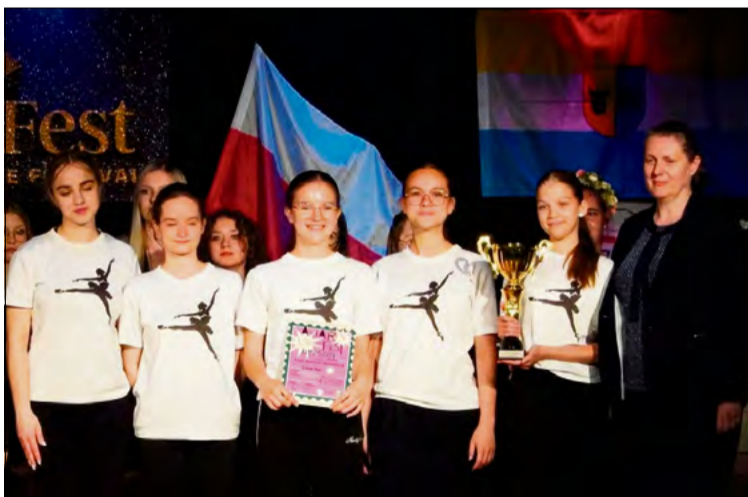
Grupa Baletowa Arabesque z Dobrzienia Wielkiego po odebraniu nagrody Grand Prix podczas VII Międzynarodowego Festiwalu Antares Fest.