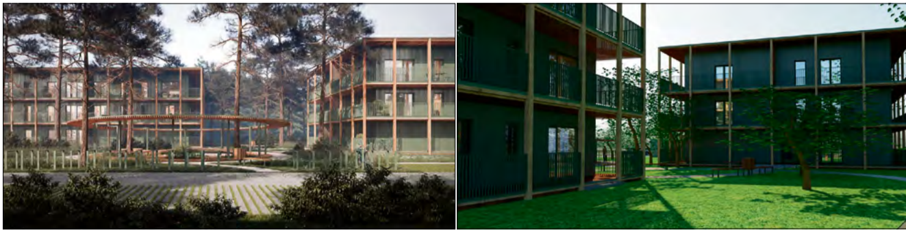
W każdym z dwóch bloków będzie się znajdować po dwadzieścia mieszkań.

W każdym z dwóch bloków będzie się znajdować po dwadzieścia mieszkań. W inwestycji mają zostać zastosowane ekologiczne rozwiązania - takie jak pompy ciepła oraz instalacje fotowoltaiczne - tak, aby w przyszłości budynki nie