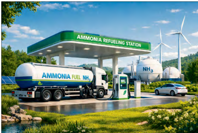
Stacja paliw amonowych w zielonym otoczeniu.

Amoniak to jeden z najbardziej fascynujących kandydatów do roli paliwa przyszłości, bo uderza dokładnie w słaby punkt współczesnej debaty o transporcie: pokazuje, że świat po paliwach kopalnych nie musi oznaczać tylko akumulatorów. Jednocześnie brutalnie przypomina, że w energetyce nie istnieją rozwiązania idealne. Możliwe więc, że amoniak odegra ważną rolę w transformacji transportu i przemysłu. Być może stanie się paliwem statków, ciężkich maszyn albo elementem gospodarki wodorowej. Ale droga od obiecującego prototypu do rodzinnego SUVa pod blokiem jest jeszcze bardzo daleka. I właśnie dlatego amoniak nie wydaje się dziś zabójcą samochodów elektrycznych. Raczej kolejnym poważnym graczem w wyścigu o przyszłość napędu — graczem ciekawym, obiecującym, ale obciążonym ryzykiem, którego nie da się zamieść pod dywan.