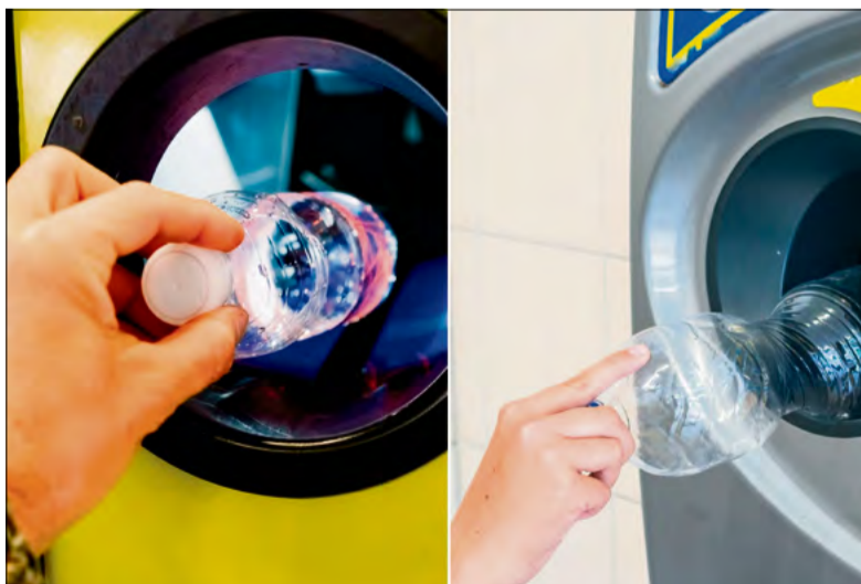
System kaucyjny zmienia polski rynek.

W całym kraju funkcjonuje 52 tysiące punktów przyjmowania pustych opakowań. Największym zainteresowaniem cieszą się kaucjomaty, czyli maszyny RVM, które działają w 9,5 tysiąca lokalizacji. Za ich pośrednictwem zwrócono 78 proc. wszystkich opakowań – czyli około 405 milionów sztuk. Ręczna zbiórka prowadzona jest w ponad 40 tysiącach sklepów. W przypadku awarii automatu lub jego zapełnienia sklep ma obowiązek przyjmując opakowanie ręcznie, a kaucja może zostać rozliczona przy kasie. Bon wydany przez kaucjo-