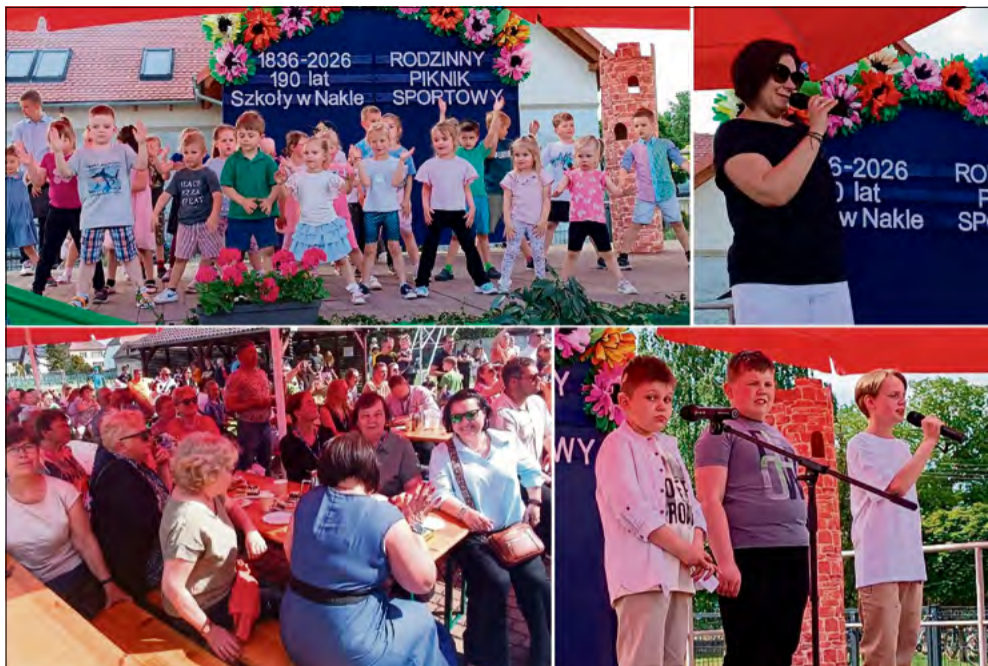
Społeczność Szkoły w Nakle połączyła jubileusz 190-lecia istnienia placówki z rodzinnym piknikiem sportowym.

23 maja społeczność Szkoły w Nakle połączyła jubileusz 190-lecia istnienia placówki z rodzinnym piknikiem sportowym. Uroczystość zgromadziła uczniów, rodziców, nauczycieli, absolwentów oraz lokalne władze, stając się okazją do integracji i wspomnień.