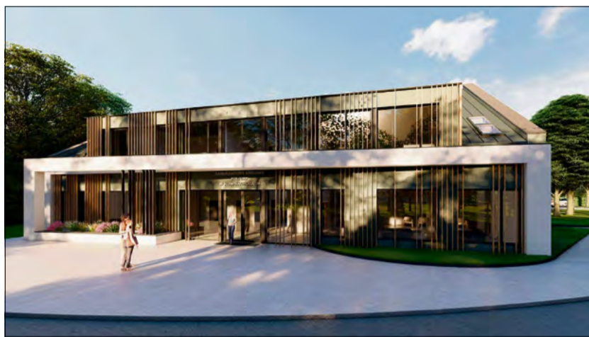
Modernizacja ośrodka kultury zakończy się pod koniec kwietnia 2027 roku.

- Po zakończeniu inwestycji ośrodek kultury będzie większy, bardziej funkcjonalny i lepiej dostosowany do potrzeb mieszkańców - podkreślają przedstawiciele gminy. - Co ważne, modernizacja poprawi także dostępność budynku dla osób z niepełnosprawnościami oraz zwiększy jego efektywność energetyczną.