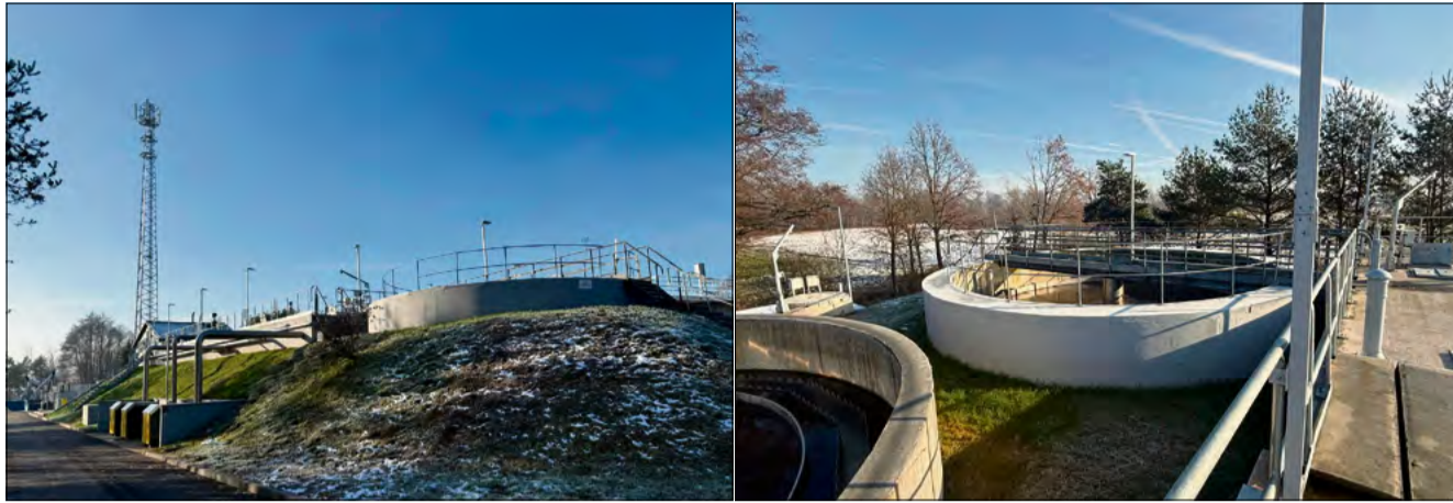
Rozwój infrastruktury wodno-ściekowej pozostaje jednym z priorytetów gminy Popielów.

Jedną z najnowszych inwestycji realizowanych na terenie gminy była budowa sieci kanalizacji sanitarnej dla miejscowości Popielowska Kolonia oraz Popielów-Wielopole. Gmina otrzymała na ten cel dofinansowanie w ramach Krajowego Planu Odbudowy. W ramach przedsięwzięcia wybudowano blisko osiem kilometrów sieci kanalizacyjnej, bez przyłączy. Dzięki realizacji zadania niemal 100 proc. mieszkańców gminy ma obecnie dostęp do kanalizacji sanitarnej.