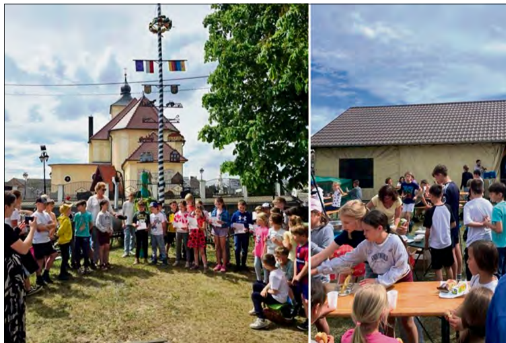
Wydarzenie stało się przykładem troski o rodzimą kulturę.

W Raszowej odbyło się tradycyjne Święto Drzewka Majowego zorganizowane przez DFK Raszowa oraz filię Gminnej Biblioteki Publicznej w Tarnowie Opolskim. Mieszkańcy, dzieci i goście wspólnie kultywowali lokalny zwyczaj, który od lat integruje społeczność wokół symbolu odradzającej się przyrody.