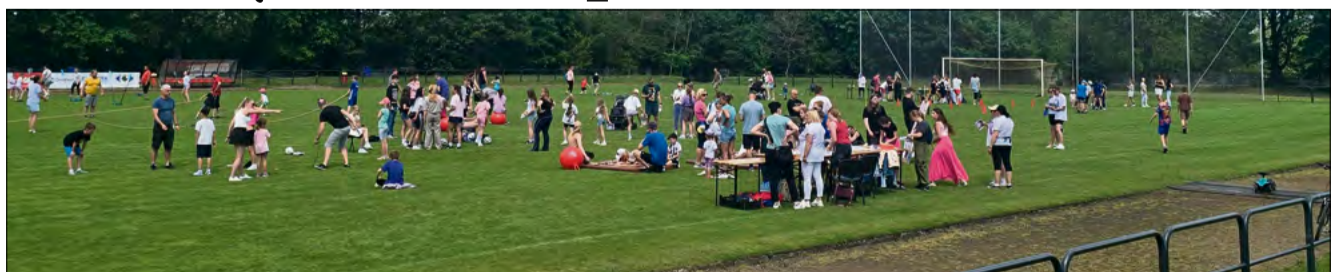
Wydarzenie cieszyło się dużym zainteresowaniem ze strony uczestników.

ściowych, za udział w których otrzymywały pieczątki. Uczestnicy między innymi układali kubki, pokonywali ślalom czy wykonywali różnego rodzaju skoki. Nie zabrakło także zadań logicznych oraz takich, które łączyły w sobie elementy sportu i działań artystycznych. Chętni uczestniczyli również w zajęciach zumbi. Osoby, którym udało się zdobyć komplet pieczętek, otrzymały drobne nagrody. Dodatkową atrakcją była możliwość gry w badminton oraz korzystania ze specjalnie przygotowanego toru ćwiczeń.