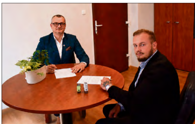
Remont przejdzie odcinek o długości ponad 200 metrów.

G mina Ozimek rozpoczyna kolejną inwestycję drogową. Podpisano umowę na przebudowę ul. Technicznej w sołectwie Schodnia. Zgodnie z kontraktem wykonawca ma sto dni na realizację zadania, a zakończenie prac planowane jest na koniec sierpnia tego roku.