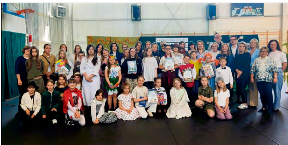
Uczestnicy prezentowali miniaturowe spektakle wzbogacone o scenografię, rekwizyty i elementy ruchu scenicznego.

Wśród prezentowanych tekstów znalazły się m.in. fragmenty „Małego Księcia” oraz „Ani z Zielonego Wzgórza”, które - jak się okazało - nadal cieszą się dużym zainteresowaniem wśród młodych czytelników.