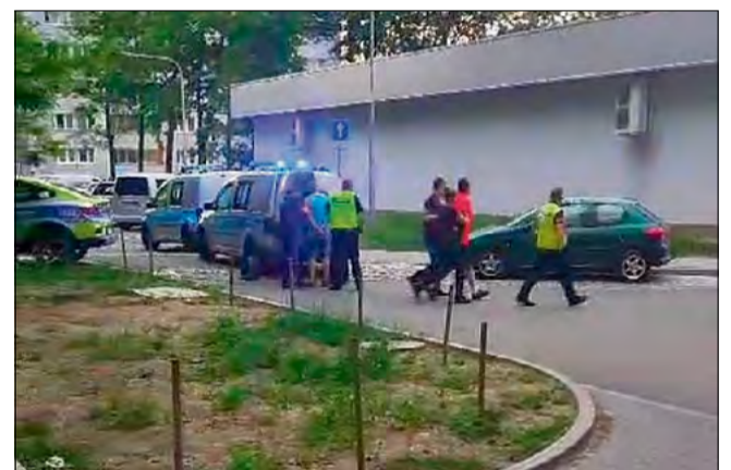
Za tego typu przestępstwo grozi kara do 3 lat pozbawienia wolności.

Do incydentu doszło podczas zakupów. 41-letni mieszkaniec Opola wszczął awanturę, w trakcie której miał publicznie znieważać kobietę ze względu na jej przynależność narodowościową, a następnie naruszyć jej nietykalność cielesną, po czym uciekł z miejsca zdarzenia. Sprawca jednak został szybko zatrzymany przez funkcjonariuszy. Niespełna pół godziny później przy ul. Łąkowej trafił w ręce