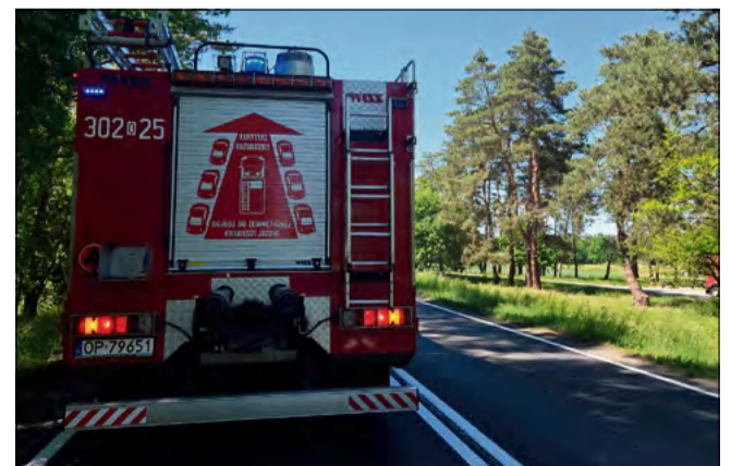
Trwa dokładne wyjaśnianie okoliczności zdarzenia.

Wstępne ustalenia wskazują, że w miejscowości Skarbiszów auto osobowe zderzyło się z pojazdem ciężarowym. Samochodami podróżowali sami kierowcy. W wyniku wypadku uszkodzona i przewieziona z obrażeniami ciała do szpitala została kierująca osobówką.