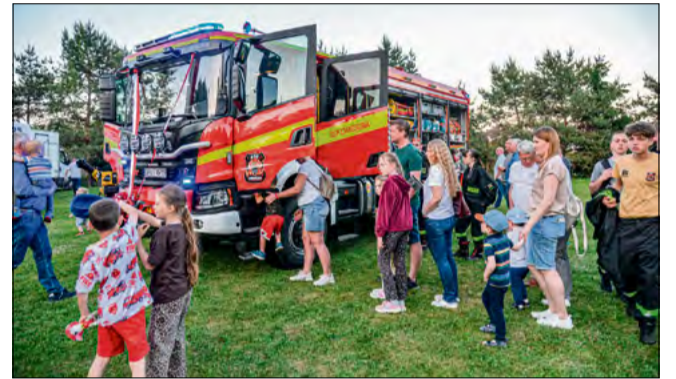
Mieszkańcy mieli okazję z bliska obejrzeć nowy wóz ratowniczo-gaśniczy.

- Potrzeby sprzętowe jednostek są na bieżąco analizowane - podkreśla wójt gminy