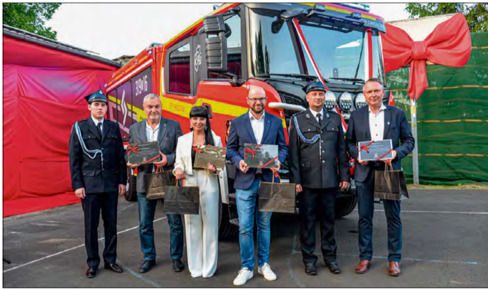
Przedstawiciele gminy podkreślają, że strażacy-ochotnicy mogą liczyć na wsparcie ze strony samorządu.

- Od początku wiedzieliśmy, że warto wspólnie zawalczyć o te środki i że działając w partnerstwie mamy dużą szansę na sukces. Wytypowaliśmy jednostki z terenu naszych gmin, przygotowaliśmy projekt i konsekwentnie dążyliśmy do celu - mówi Wójt