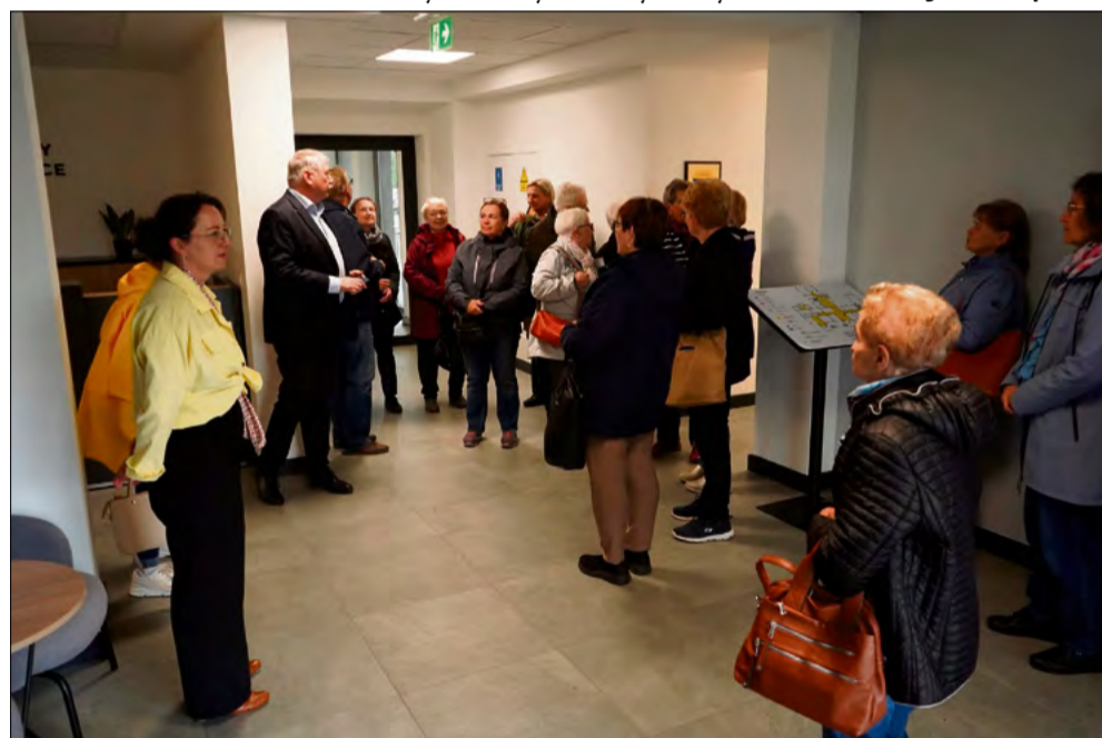
Urząd odwiedzili też seniorzy z gminy Chrzastowice.