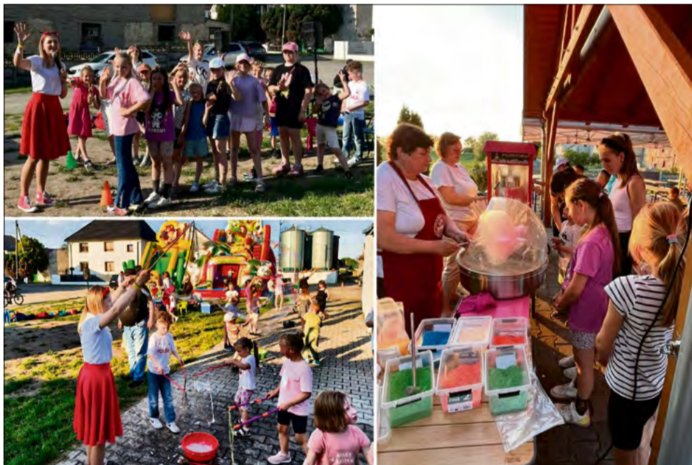
Podczas wydarzenia nie zabrakło atrakcji dla małych i dużych.

Plac obok wiaty sołeckiej w Kątach Opolskich w sobotę 23 maja stał się miejscem rodzinnego święta. Organizatorzy – Koło Gospodyń Wiejskich Kąty Opolskie wraz z Radą Sołectwa – przygotowali to radosne wydarzenie.