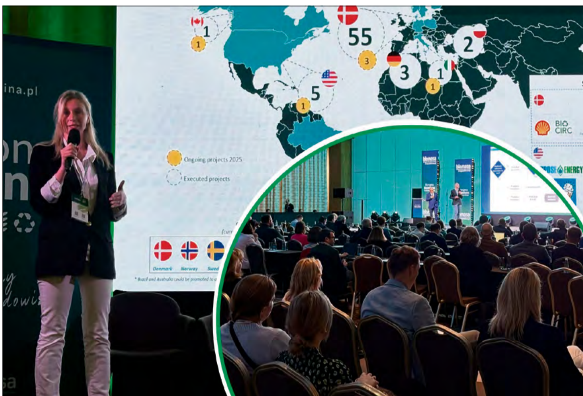
Firma Heidelberg Materials Polska była uczestnikiem dwóch kluczowych forów transformacji energetycznej.

Firma Heidelberg Materials Polska uczestniczyła w dwóch wydarzeniach branżowych. Podczas 9. Kongresu Biometanu dyskusje dotyczyły regulacji i ich wpływu na rynek biometanu, roli tego paliwa w bezpieczeństwie energetycznym oraz wyzwań związanych z przyłączaniem do sieci gazowej. Uczestnicy analizowali modele obrotu, równowagę popytu i podaży, a także rozwój bioLNG i