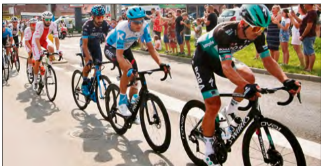
V etap tegorocznego wyścigu wystartuje 7 sierpnia z opolskiego Rynku i poprowadzi przez miejscowości powiatu opolskiego.

T our de Pologne ponownie zawita na Opolszczyźnie. Oficjalna prezentacja trasy 83. edycji wyścigu odbyła się we wtorkowy wieczór, 26 maja, a dla mieszkańców regionu oznacza to jedno – światowy peleton znów pojawi się na drogach województwa opolskiego, w tym również powiatu opolskiego.