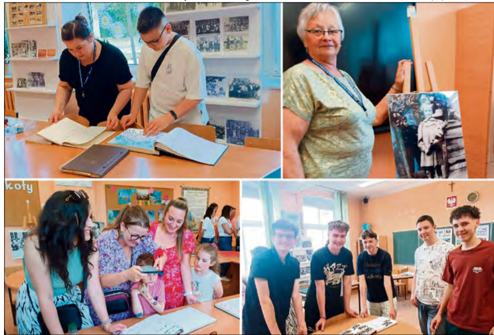
Absolwenci odszukiwali na fotografiach siebie oraz dawnych kolegów i nauczycieli.