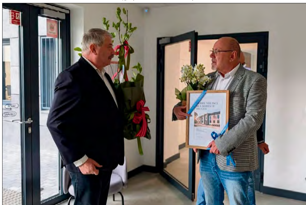
Jednym z gości był starosta opolski Henryk Lakwa.