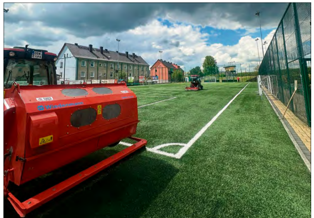
Prace pielęgnacyjne na ozimskim Orliku poprawiły stan nawierzchni oraz komfort korzystania z boiska.

W ramach inwestycji zamontowano również trzy nowe furtki wejściowe oraz bramę dwuskrzydłową. Pojawiła się także boczna barierka ochronna na murze oporowym trybun. Wykonano fundamenty betonowe i pełny montaż konstrukcji, a stare ogrodzenie zostało zdemontowane. Po zakończeniu prac odtworzono również kostkę brukową w miejscach prowadzonych robót.