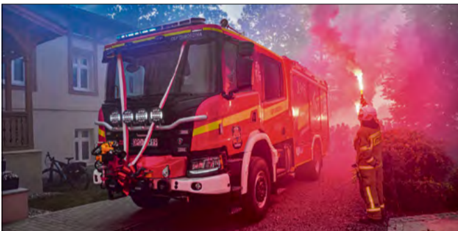
Uroczyste powitanie samochodu strażackiego połączono ze wspólnym świętowaniem.