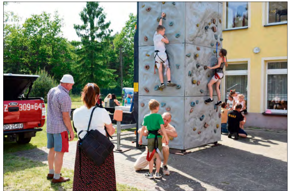
Dużym zainteresowaniem cieszyła się ścianka wspinaczkowa o wysokości 7 metrów.

Najmłodszy uczestnicy mogli korzystać z dmuchańców i ponad 7 metrowej ścianki wspinaczkowej, bawić się w