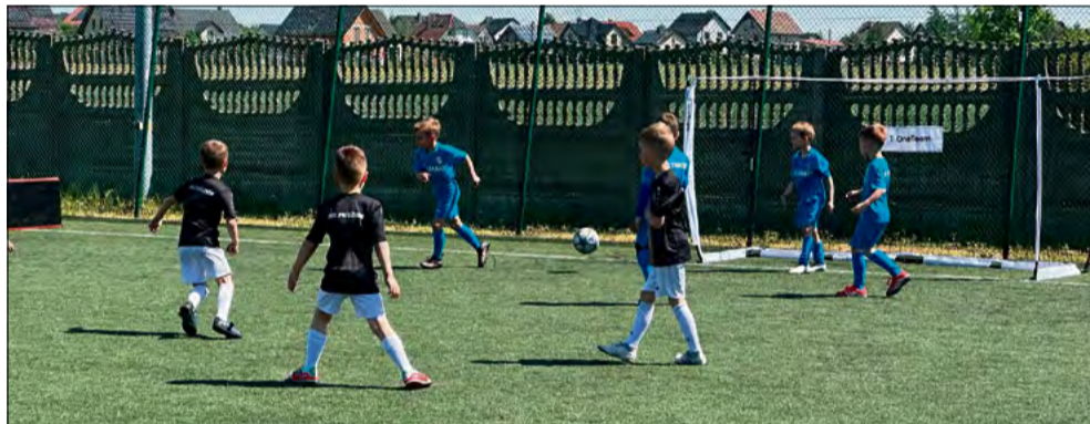
W ramach projektu odbył się turniej dla dzieci i młodzieży „Bawi nas piłka”.

W ramach projektu zaplanowano sześć wydarzeń w okresie od maja do października 2026 roku. Do tej pory w maju odbyły się dwa wydarzenia: turniej dla dzieci i młodzieży „Bawi nas piłka” oraz piknik rodzinny „Mamo, tato poćwicz ze mną”. W czerwcu zaplanowano turniej piłkarski połączony z piknikiem sportowym, a w lipcu wakacyjne rozgrywki piłkarskie. We wrześniu odbędzie się wielobój rodzinny dla dzieci, dorosłych i dziadków. Natomiast w październiku zaplanowano szkolenie z zakresu zdrowego odżywiania.