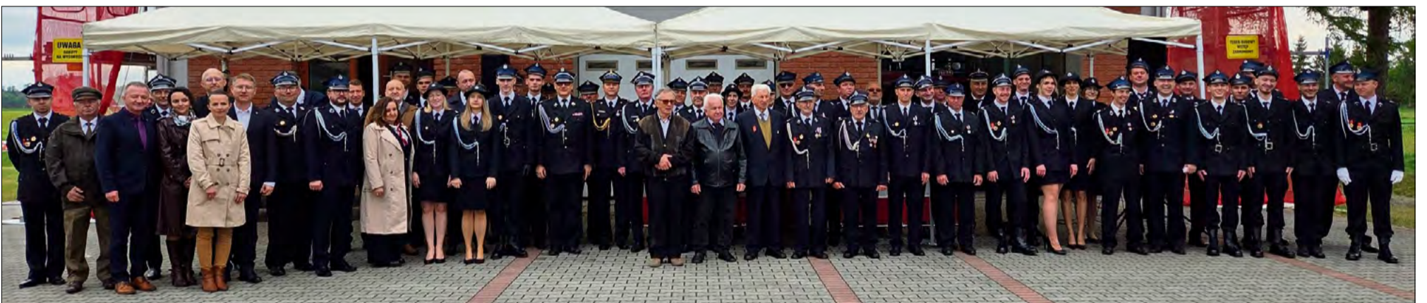
Za nami obchody 100-lecia OSP w Brynicy.

W sobotę 16 maja jednostka Ochotniczej Straży Pożarnej w Brynicy świętowała stulecie swojego istnienia. Podczas uroczystości wręczono odznaczenia państwowe i strażackie, a wójt gminy Lubniany podziękował wieloletniemu prezesowi oraz mieszkańcom zaangażowanym w remont strażnicy.