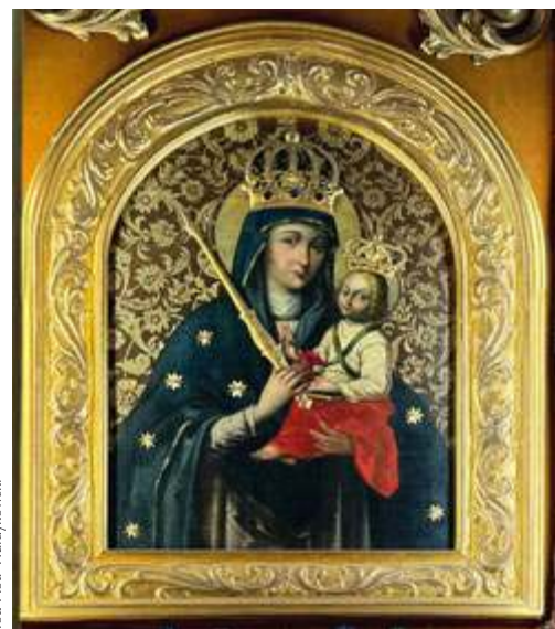
Cudowny obraz Matki Bożej Górskiej (Matki Bożej Pocieszenia)

Z pierwszych wzmianek o osadzie Góra wiemy, że w XIII w. była wsią szlachecką ziemi czerskiej, w sąsiedztwie ważnego zamku Mazowsza – Czerska. Miastem stała się