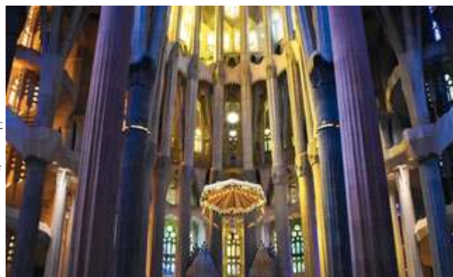
fol. Wikimedia Commons/Julian Lupyan