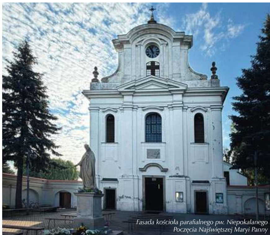
Fasada kościoła parafialnego pw. Niepokalanego Poczęcia Najświętszej Maryi Panny