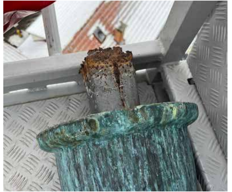
Już po demontażu iglicy można było zaobserwować korozję, czyli źródło problemu

Jak relacjonuje rzecznik PSP w Goleniowie, po dojeździe zastępcy PJRG Nowogard i wstępnym rozpoznaniu, podjęto działania