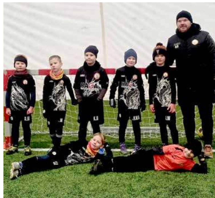
Drużyna dzielnie powalczyła na boisku w Szczecinie