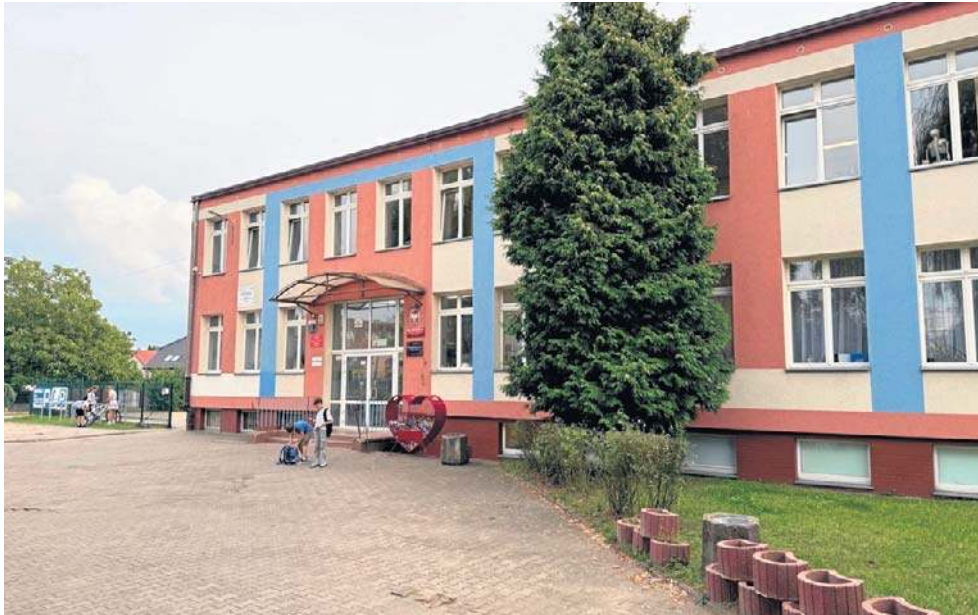
Nowoczesne, klimatyzowane kontenery mogłyby stanąć przy szkole jeszcze w wakacje. W tej chwili przygotowana jest dokumentacja

- To specyfika Gumieniec - twierdzi Krzysztof Ponikowski.