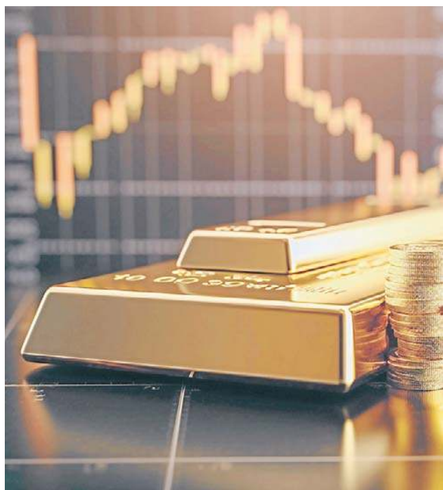
Złoto pozostanie silne ze względu na rosnące obawy geopolityczne i gospodarcze

Zdaniem ekspertów z Investors TFI coraz wyraźniej rysują się również scenariusze zmian o charakterze strukturalnym, istotnych z punktu widzenia perspektyw złota. W wymiarze geopolitycznym są to ryzyka eskalacji konfliktów oraz przesunięcia geostrategiczne wynikające z odchodzenia USA od strategii globalnego prymatu i rosnącej roli Chin. Z kolei w wymiarze gospodarczym narastający kryzys zaufania