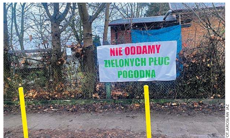
Pacjenci i personel szpitala mają ogromny problem z parkowaniem. Działkowcy zapewniają, że swoich ogródków nie oddadzą

Putin zaproszony przez Stany Zjednoczone do Rady Pokoju, która ma zarządzać Strefą Gazy str. 7