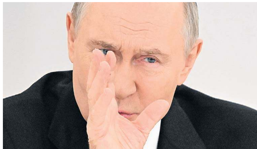
Prezydent Rosji Władimir Putin otrzymał zaproszenie od Stanów Zjednoczonych do dołączenia do Rady Pokoju do spraw Strefy Gazy

Zaproszenie dla Putina pojawiło się krótko po tym, jak prezydent USA Donald Trump zachęcił wielu światowych polityków do dołączenia do Rady Pokoju oraz jej organów, które mają zarządzać Strefą Gazy, w ogromnej mierze obróconej w gruzy w wyniku wojny z Izraelem po październiku 2023 roku.