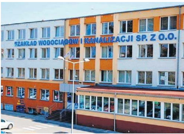
Pojawiły się zarzuty o degradacji starych pracowników i zatrudnianie nowych po znajomości

Niepokoju o szczeciński ZWiK nie ukrywa kolejny nasz rozmówca. - Doniesienia, o tym co dzieje się w ZWiK-u jeśli cho-