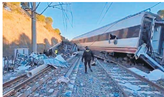
W wyniku wykolejenia się dwóch pociągów śmierć poniosło co najmniej 39 podróżnych

Pociągiem przewoźnika Iryo podróżowało z Malagi do Madrytu 317 osób. Ostatnie wagony pociągu wypadły z szyn w Adamuz w prowincji Kordoba, wjeżdżając na sąsiedni tor, po którym jechał z Madrytu do Huelvy inny pociąg, należący do przewoźnika Renfe, i który w rezultacie również się wykoleił.