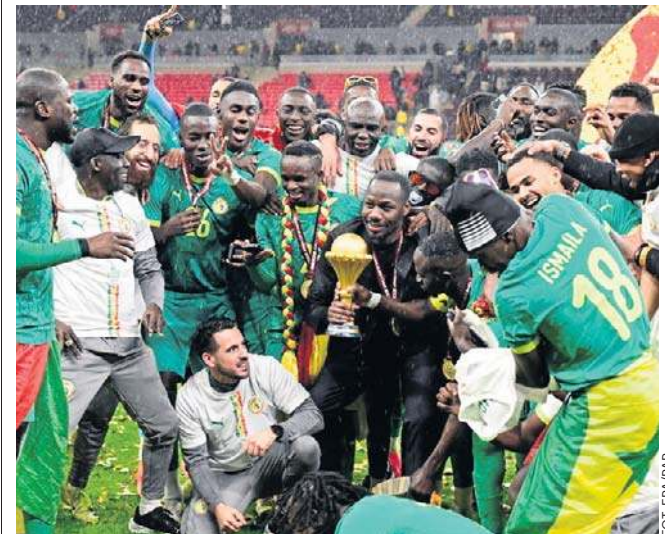
Piłkarze Senegalu celebrują zdobycie Pucharu Narodów Afryki po zwycięstwie w finale nad Marokiem 1:0 po dogrywce

Maroko nie wygrało Pucharu Narodów Afryki od 1976 roku. Miało idealną szansę na zwycięstwo u siebie, ale passa porażek trwa. Poprzedni finał rozegrało w 2004 roku. ©©