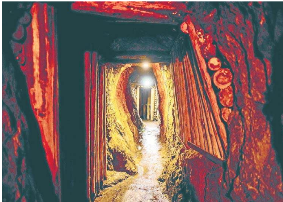
Kopalnia Złota w Złotym Stoku to dziś atrakcyjny kompleks turystyczny z wieloma ciekawostkami i tajemnicami