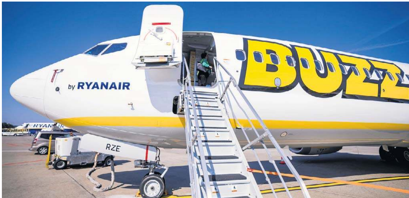
Jakie nowości w liniach czarterowych będą czekać na pasażerów w 2026 roku?

● Poprosiłem o komentarz także Michała Fijoła, prezesa PLL LOT (organizujących prze-