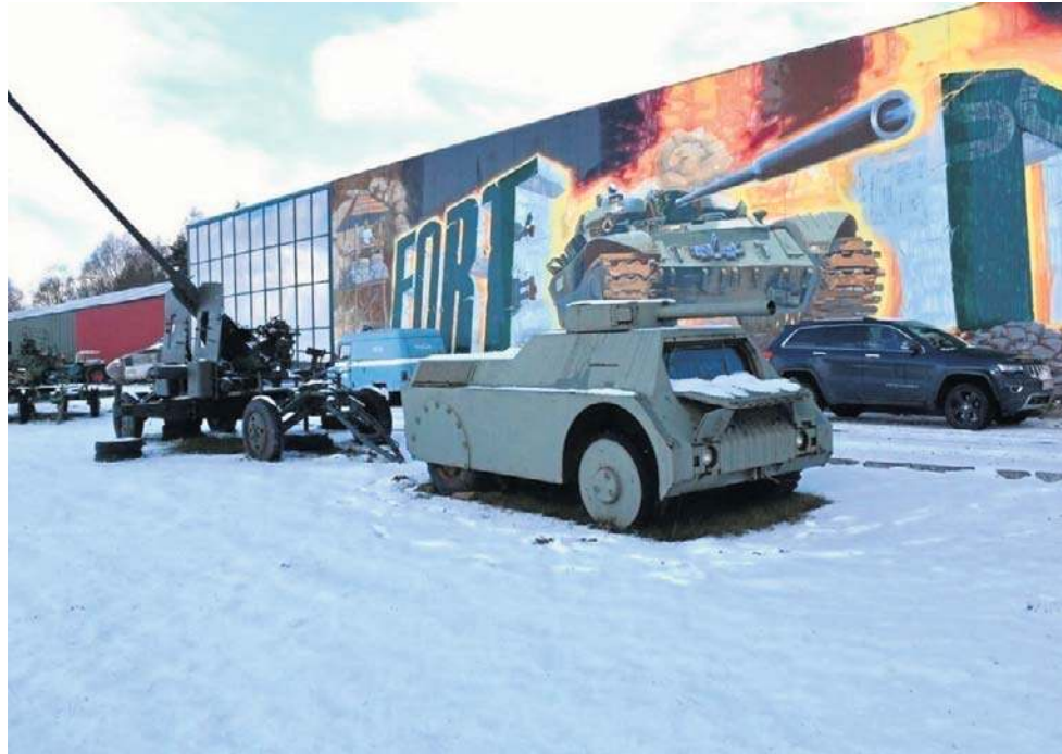
Fort Mariana w Malechowie jak co roku zaprasza na zimowy zlot pojazdów wojskowych

W dniach od 23 - 25 stycznia (piątek-niedziela) na gości będą tam czekać: bazar militarny, kuchnia wojskowa, wystawa dioram, przejażdżki ciężkim sprzętem, prezentacja pojazdów wojskowych, zabytkowego sprzętu wojskowego, amerykańskich pojazdów takich, jak: Welis, Harley Davidson, Transporter M113 i inne, zwiedzanie muzeum „TY-TAN”.