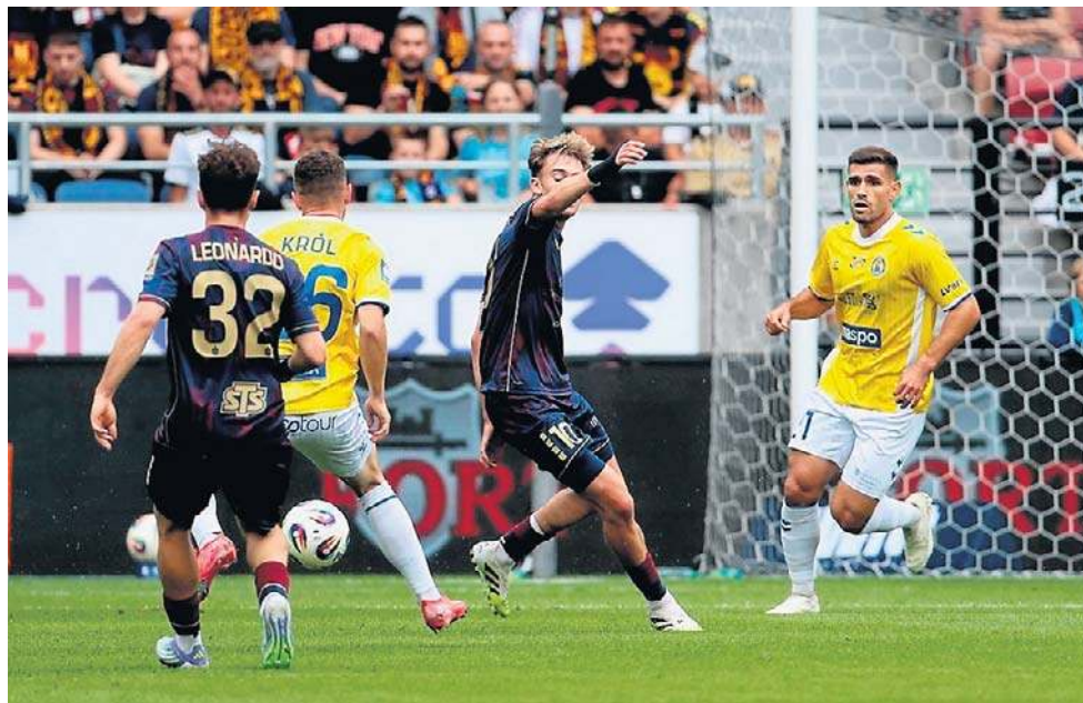
Jesienią Pogoń pokonała na swoim boisku Motor 4:1

Arkonian Waterpolo Szczecin awansowała do turnieju finałowego o Mistrzostwo Polski do lat 17, który odbędzie się 8-10 maja w Gliwicach. Juniorzy Arkonii awans przypieczętowali wygrywając w Szczecinie (2 zwycięstwa i 1 porażka).