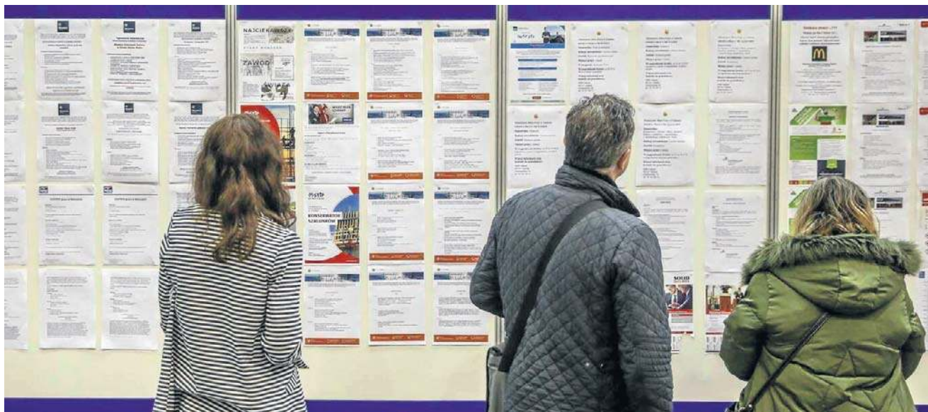
Księgowi i pracownicy finansowi należą do najbardziej poszukiwanych na rynku pracy

- Największą liczbę zgłoszeń notują rekrutacje na pozycje dyrektorskie. Tymczasem aktywność specjalistów oraz menedżerów średniego szczebla jest wyraźnie mniejsza - responsywność na ogłoszenia pozostaje ograniczona, niez-