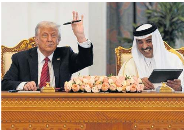
Katar ostrzega USA. Na zdjęciu prezydent USA Donald Trump i emir Kataru Tamim ibn Hamad Al-Sani

Katarskie władze obawiają się też, że są wciągane w konflikt, w którym nie chcą brać udziału po żadnej ze stron. Nie chcą też, by używana przez Amerykanów baza stała się celem irańskich ataków odwetowych. O możliwości jej zniszczenia ostrzegł w minionym tygodniu na portalu X Ali Shamkhani - doradca irańskiego przywódcy ajatollaha Alego Chameneia.