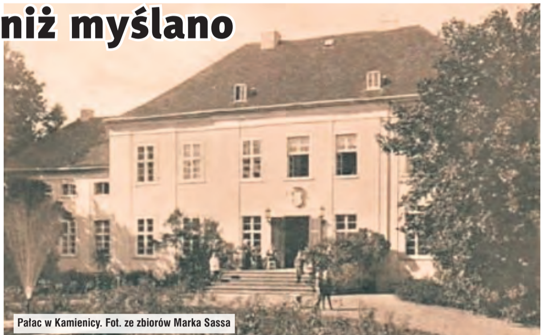
Pałac w Kamienicy.

Piotr Błok w latach 1418-1419 dał się poznać jako wyjątkowo brutalny uczestnik licznych najazdów na pograniczu polsko-krzyżackim. Wspólnie z komturem człuchowskim i jego poddanymi napadał między innymi na mieszkańców Syp-