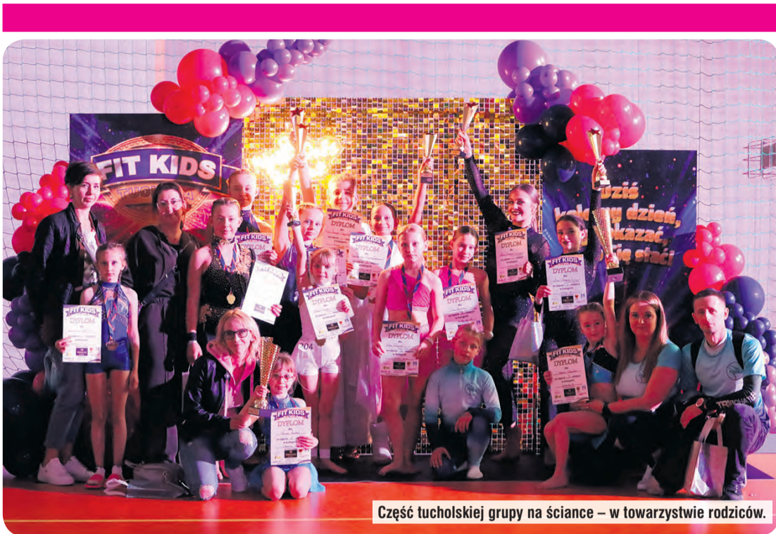
Część tucholskiej grupy na scenie – w towarzystwie rodziców.

dumę, zachwyty. Tu nie wystarczy wyjść na scenę i coś przez półtorej minuty pokazać. Tytuły najlepszych w Europie zobowiązują. I z tych właśnie zobowiązań wywiązała się grupa młodych sportowców. Ich występy wielu określiło jako zbyt krótkie, bo chciało się akrobatów nie tylko z tucholskiego klubu oglądać znacznie dłużej, niż wskazywał na to regulaminowy wymóg. Twarze wyrażające emocje, pasje, skupienie, jednocześnie samą przyjemność występowania – wszystko to każe nazwać bohaterów Fit Kids Tuchola profesjonalistami.