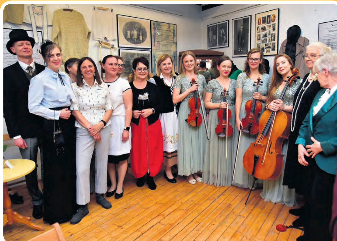
Do pamiątkowego zdjęcia z artystkami z Bydgoszczy ustawiły się pracownicy muzeum oraz osoby zaangażowane w organizację i urozmaicenie wydarzenia.

W placówce można było spotkać także leśników z Nadleśnictwa Zamrzenica, którzy – w nawiązaniu do czasowej wystawy