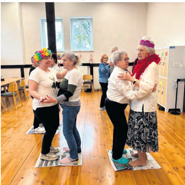
Taniec jest jedną z ulubionych aktywności ruchowych, osób korzystających z DDP. Ogłoszenie płatne

Dzienny Dom Pomocy w Śliwicach nie jest wyłącznie skierowany na seniorów! Jest otwarty dla domowników jest po prostu