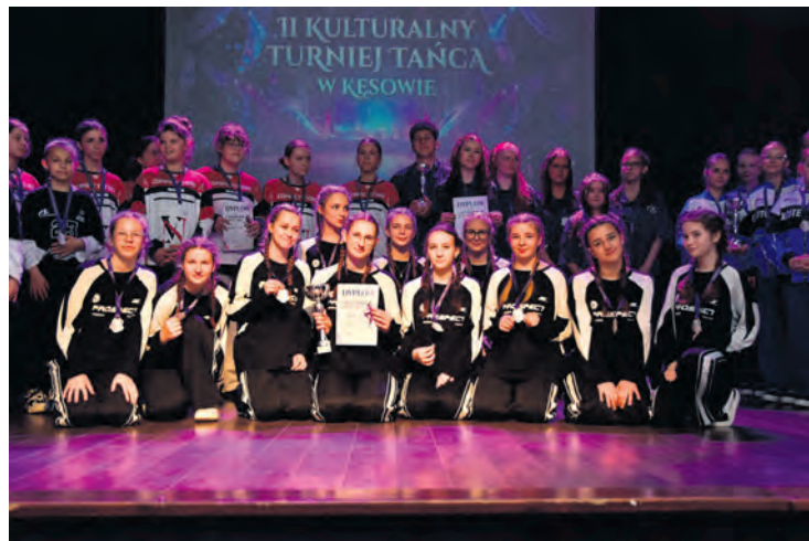
Zwycięzcy w kategorii hip-hop (12-15 lat) – Elevate.