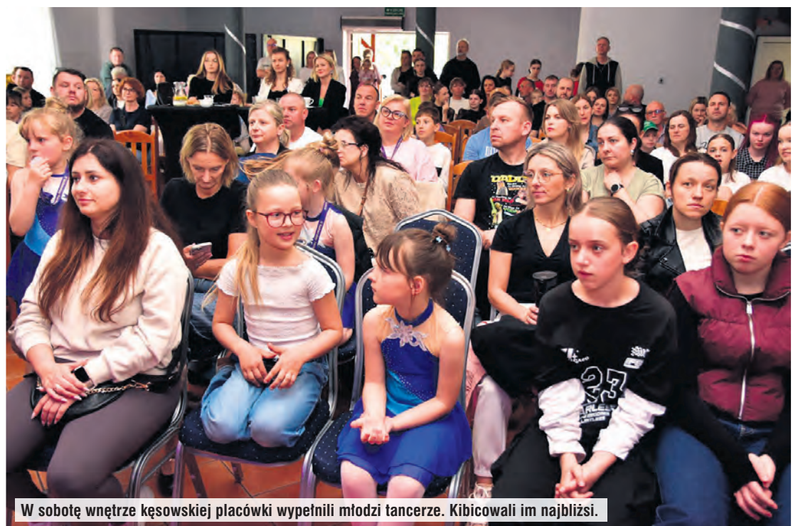
W sobotę wewnątrz kęsowskiej placówki wypełnili młodzi tancerze. Kibicowali im najbliżsi.