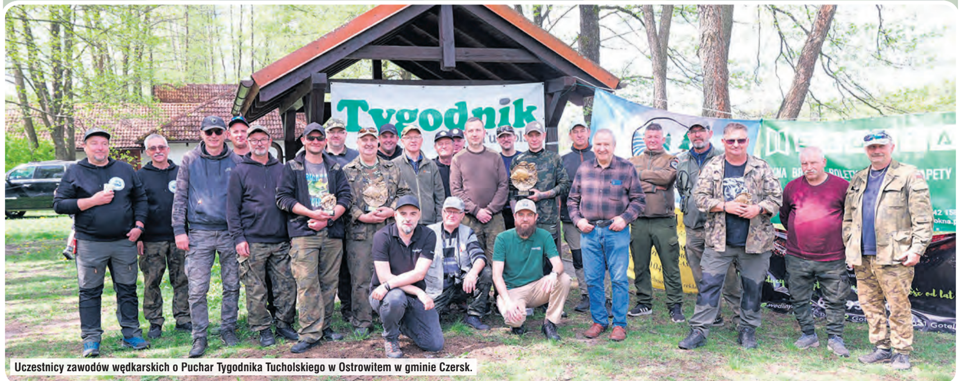
Uczestnicy zawodów wędkarskich o Puchar Tygodnika Tucholskiego w Ostrowitem w gminie Czersk.