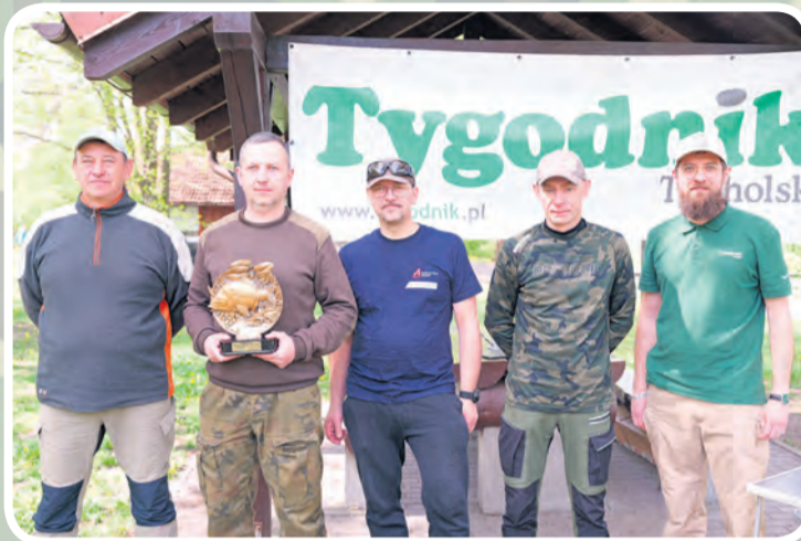
Tucholskie koło zwyciężyło nad jeziorem Ostrowite.

Od momentu, w którym do rywalizacji dołączyło koło PZW Czersk, wiedzieliśmy, że szybko przyjdzie czas, aby z turniejem wyjechać za międę. Początkowo w grę wchodziło jezioro na pograniczu powiatów tucholskiego i chojnickiego w Klocku. To właśnie w Klocku można najczęściej spotkać czerskich wędkarzy. Ostatecznie w tym roku wybór padł na Ostrowite. Węd-