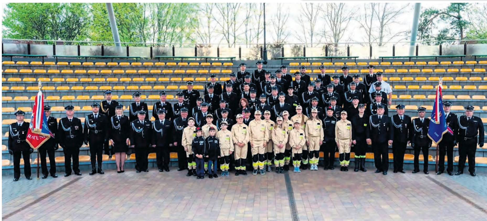
Strażacy z gminy Śliwice zostali uhonorowani medalami i wyróżnieniami.