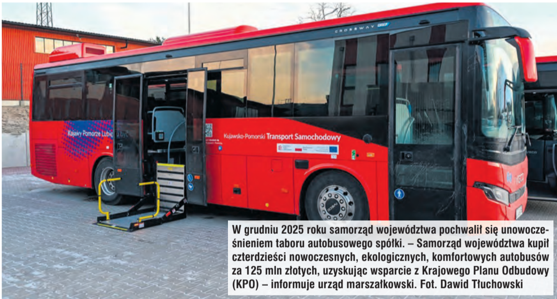
W grudniu 2025 roku samorząd województwa pochwalil się unowocześnieniem taboru autobusowego spółki. – Samorząd województwa kupił czterdzieści nowoczesnych, ekologicznych, komfortowych autobusów za 125 mln złotych, uzyskując wsparcie z Krajowego Planu Odbudowy (KPO) – informuje urząd marszałkowski.