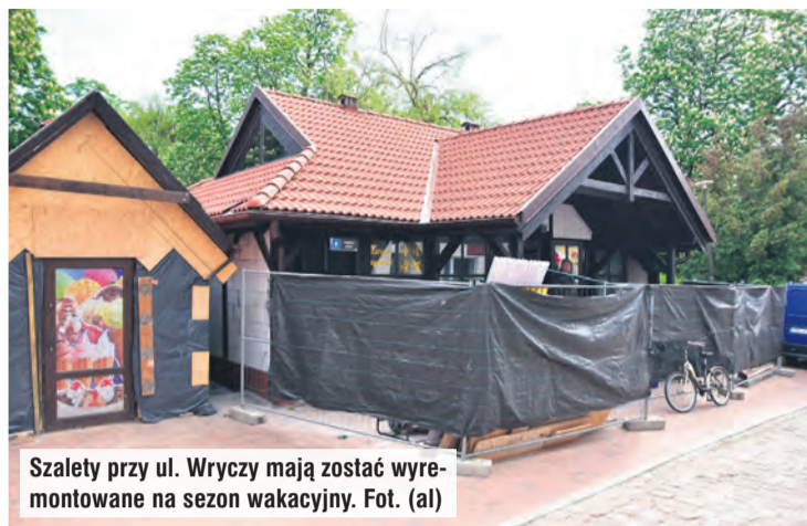
Szalety przy ul. Wryczy mają zostać wyremontowane na sezon wakacyjny.

– Jako że poruszamy się w strefie staromiejskiej, mamy już uzgodnione z konserwatorem zabytków, że te obiekty będą wyglądały praktycznie identycznie, tzn. elewacja będzie wykonana w stylu muru pruskiego, a na da-