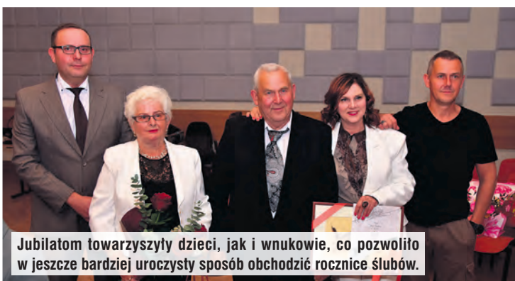
Jubilatom towarzyszyły dzieci, jak i wnukowie, co pozwoliło w jeszcze bardziej uroczysty sposób obchodzić rocznice ślubów.