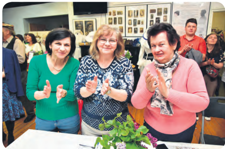
Uczestnicy wydarzenia nie żalowali oklasków utalentowanym artystkom.