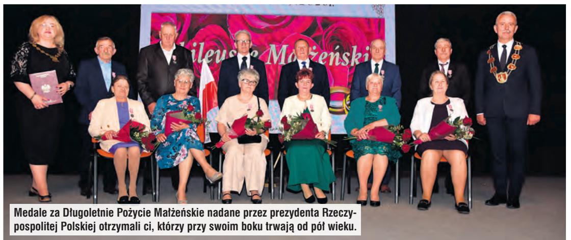
Medale za Długoletnie Pożycie Małżeńskie nadane przez prezydenta Rzeczypospolitej Polskiej otrzymali ci, którzy przy swoim boku trwają od pół wieku.