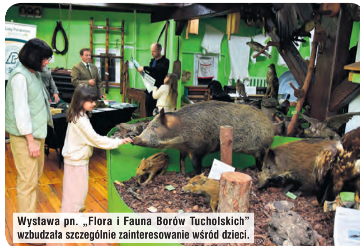
Wystawa pn. „Flora i Fauna Borów Tucholskich” wzbudzała szczególnie zainteresowanie wśród dzieci.