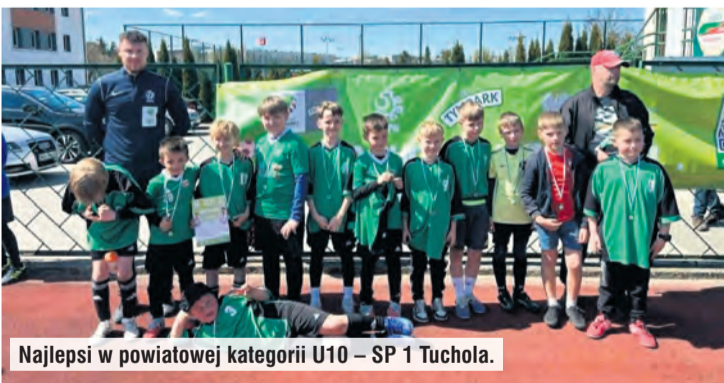
Najlepsi w powiatowej kategorii U10 – SP 1 Tuchola.