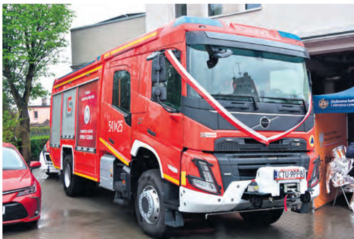
W ramach obchodów symbolicznie przekazano i poświęcono nowy pojazd pożarniczy marki Volvo.

Cywilnej. To program edukacji powszechnej zmierzający do merytorycznego wsparcia dla planowanych, systemowych rozwiązań w zakresie ochrony ludności. Jego głównym zadaniem będzie przekładanie teorii