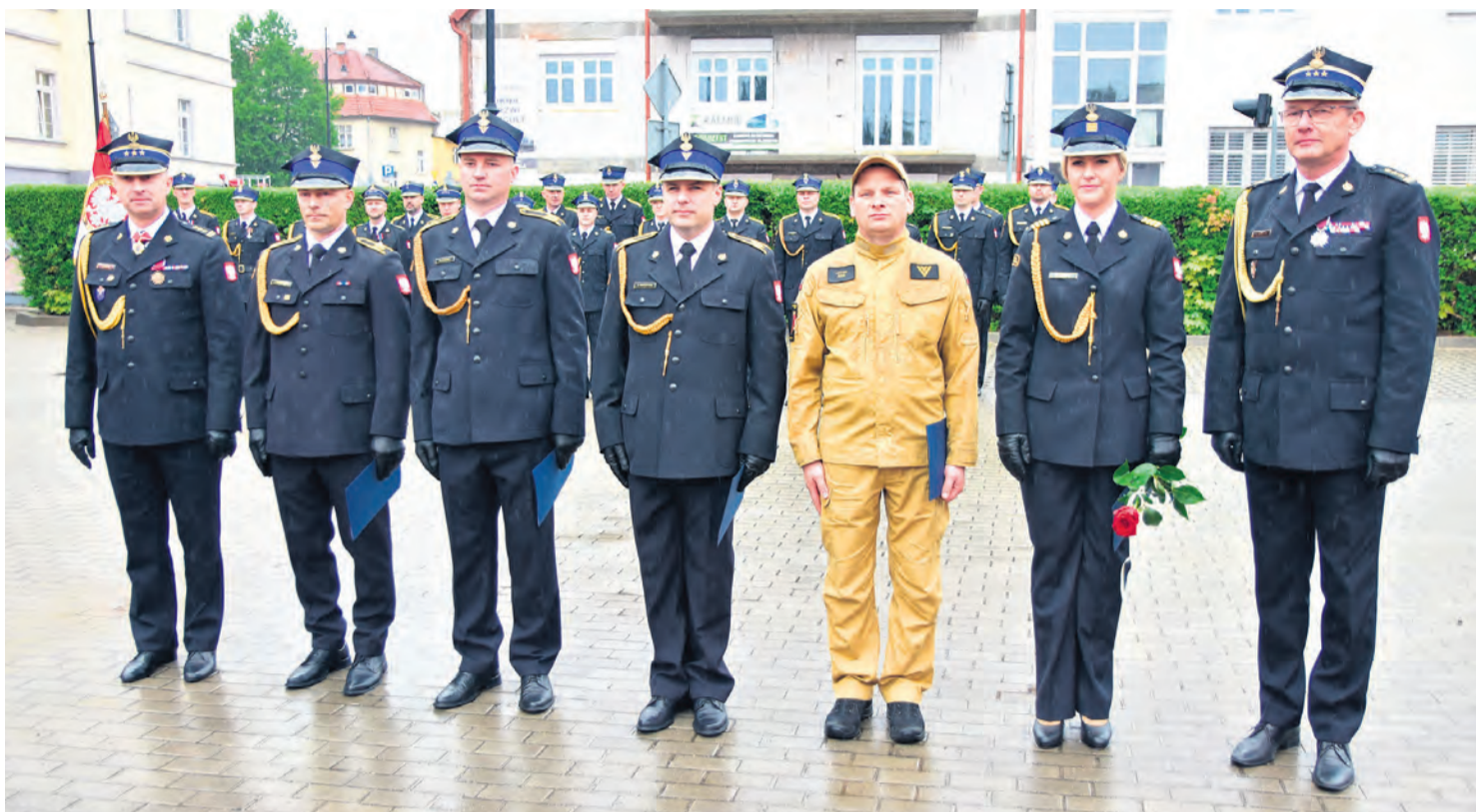
Awans na wyższy stopień podoficerski otrzymało 4 funkcjonariuszy i funkcjonariuszka tucholskiej KP PSP.

– Współczesna straż pożarna to nie tylko działania ratownicze. To również coraz szerszy obszar związany z ochroną ludności, reagowaniem kry-