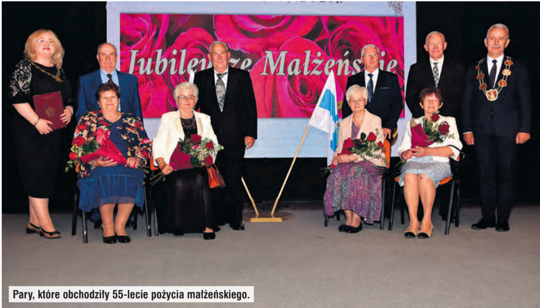
Pary, które obchodzą 55-lecie pożycia małżeńskiego.