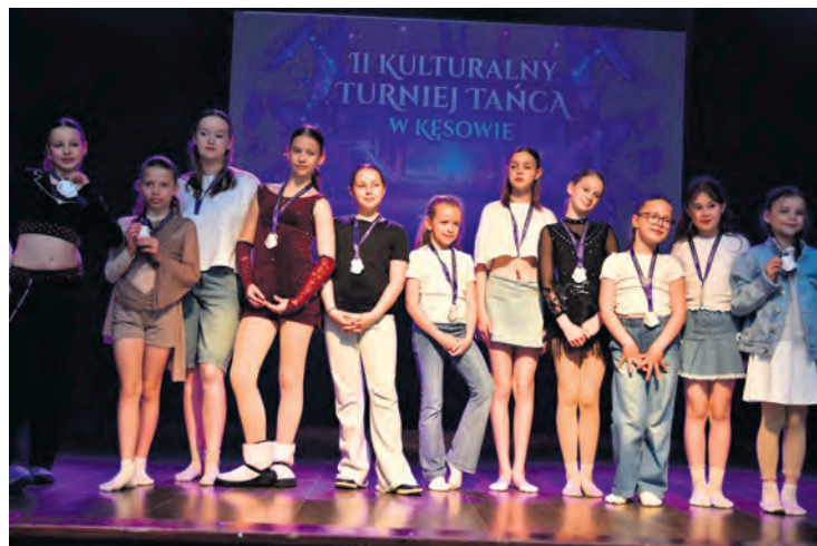
Bez względu na wynik na szyi każdego uczestnika turnieju zawieszony jest pamiątkowy medal.