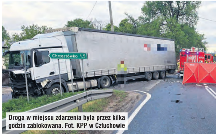
Droga w miejscu zdarzenia była przez kilka godzin zablokowana.

– W wyniku zdarzenia na miejscu zginął kierujący oplem 43-letni mieszkaniec