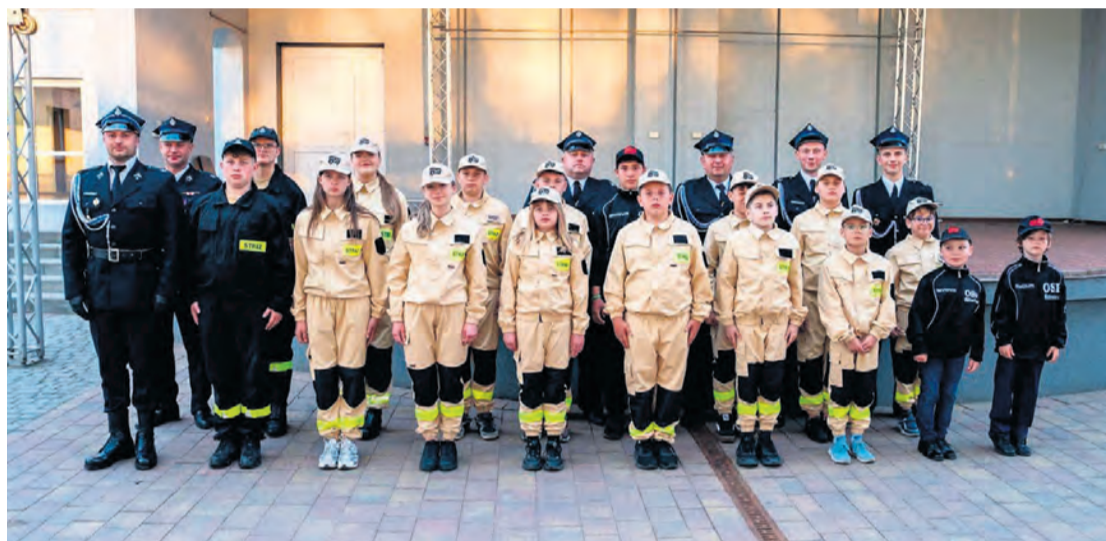
Strażacka młodzież z gminy Śliwice. Na razie można ją spotkać na gminnych i powiatowych zawodach MDP.