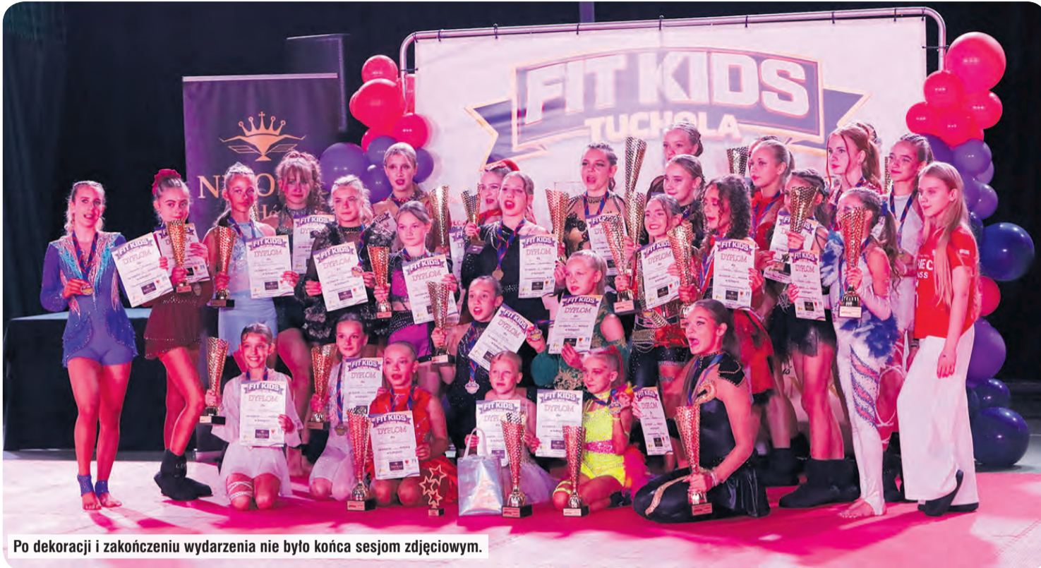
Po dekoracji i zakończeniu wydarzenia nie było końca sesjom zdjęciowym.

Kilka godzin popisów na najwyższym, europejskim poziomie mogli oglądać licznie zgromadzeni ludzie w tucholskiej hali sportowej. Mowa o poziomie Europy, bo wielu mistrzów kontynentu zaprezentowało swój talent podczas sobotniego wydarzenia zorganizowanego przez Fitness Sportowy Tuchola. Choć podium ma trzy miejsca, każde dziecko zostało zaproszone do dekoracji. My już wiemy, że na pierwszej edycji Fit Kids Tuchola z pewnością się nie zakończy.