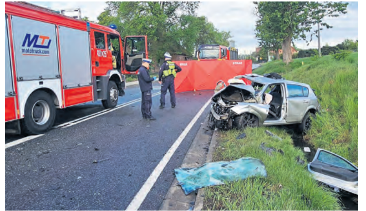
Dokładne przyczyny i przebieg zdarzenia są przedmiotem policyjnego śledztwa.

Tucholi oraz podróżująca z nim 43-letnia pasażerka, mieszkanka Chojnic. Trzeci uczestnik zdarzenia, 36-latek z Cekcyna, został przetransportowany do szpitala – informuje Agnieszka Prokop, oficer prasowa KPP w Człuchowie.