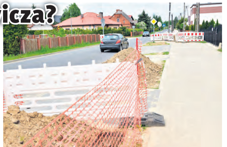
Po nieudanym remoncie ulica Mickiewicza objęta jest jeszcze okresem 5-letniej gwarancji. Z uwagi na to, ENEA Operator podpisał umowę z gwarantem. Przebudowę drogi realizowało Przedsiębiorstwo Budowy Dróg i Mostów ze Świecia.

W bydgoskim oddziale dystrybucji ENEA słyszymy, że zakres inwestycji obejmuje kablowanie istniejącej, napowietrznej infrastruktury elektroenergetycznej średniego napięcia 15 kV na terenie Tucholi, co wiąże się również