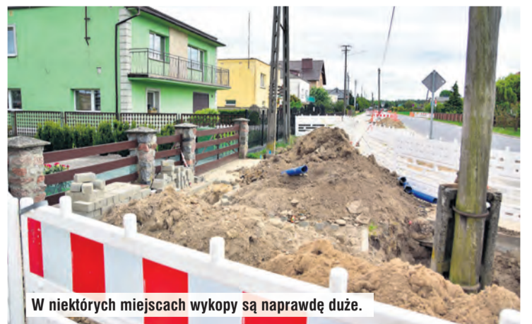
W niektórych miejscach wykopy są naprawdę duże.

siedziba PUP w Tucholi plac Wolności 23, pok. 203