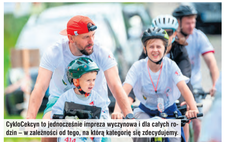
CykloCekcyn to jednocześnie impreza wycynowa i dla całych rodzin – w zależności od tego, na którą kategorię się zdecydujemy.