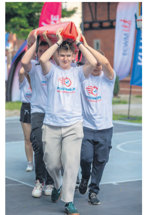
Ubiegłoroczne spotkanie młodych „Przystanek JP II”.

Organizatorem wydarzenia jest samorząd województwa kujawsko-pomorskiego. Partnerzy: ECWM, Chorągiew Kujawsko-Pomorska ZHP, Diecezja Toruńska, Franciszkanie Prowincji św. Franciszka z Asyżu w Poznaniu, Laboratorium św. Jana Pawła II w Toruniu, Wydział Teologiczny UMK w Toruniu.