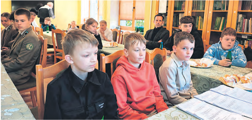
Uczestnicy turnieju odpowiadali na pytania, których zakres tematyczny obejmował m.in. ratownictwo medyczne czy prewencję.

Założeniem Ogólnopolskiego Turnieju Wiedzy Pożarniczej (OTWP) jest promowanie wśród młodych osób będących uczniami szkół podstawowych i ponadpodstawowych wiedzy z m.in.: znajomości przepisów przeciwpożarowych, zasad postępowania na wypadek pożaru, praktycznych umiejętności posługiwania się pod-