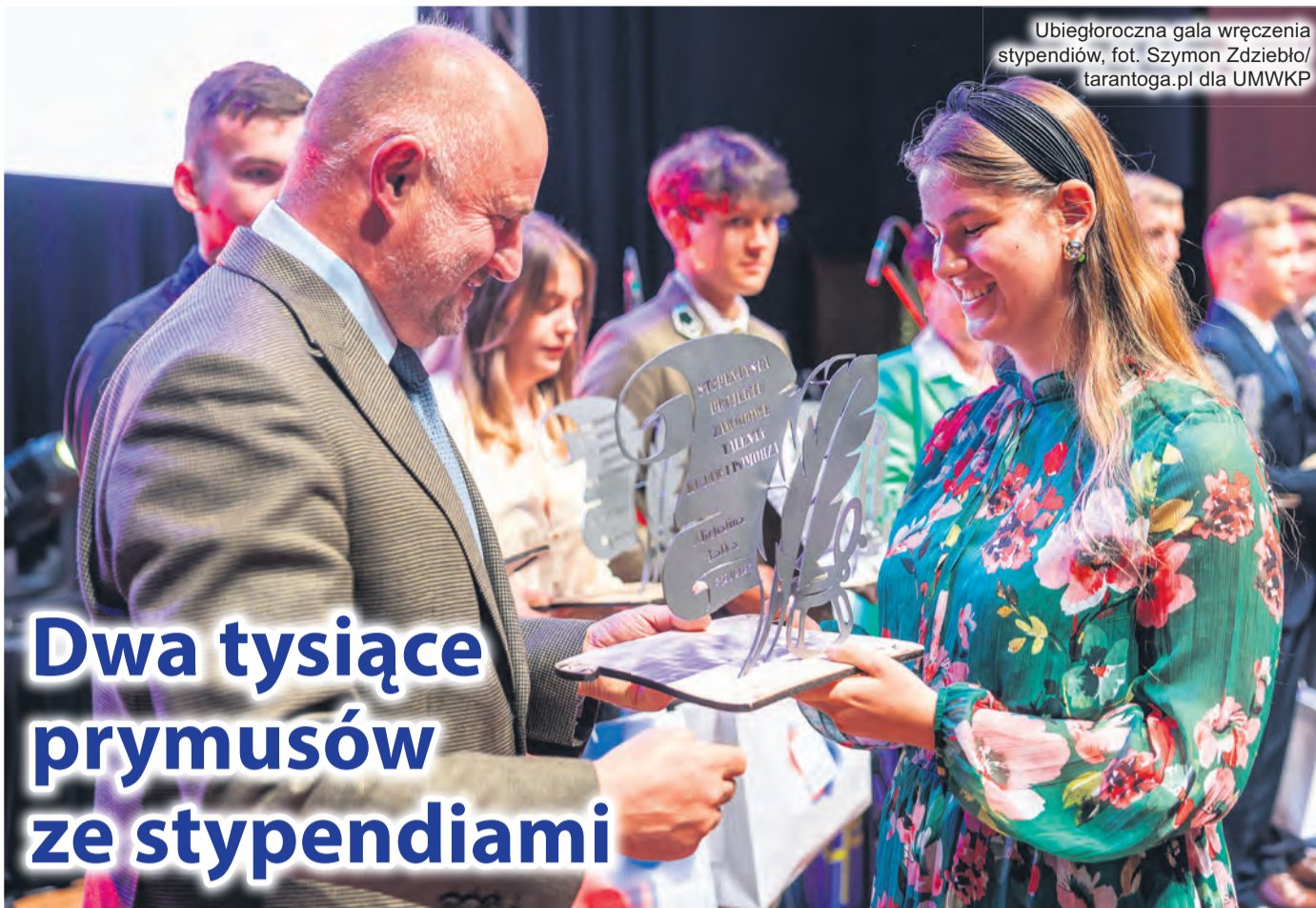
Ubiegłoroczna gala wręczenia stypendiów