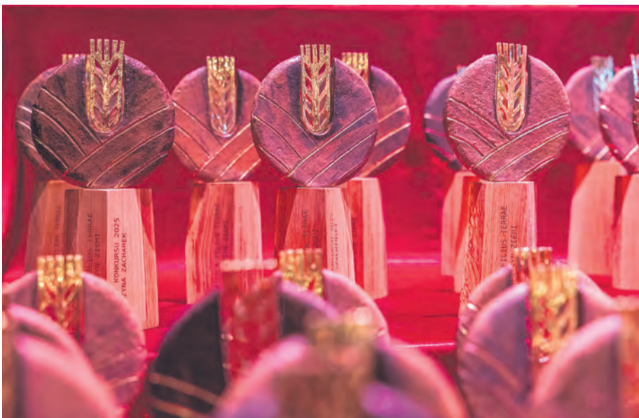
Statuetka „Agricola – syn ziemi”

Trwa nabór zgłoszeń do prestiżowego dorocznego konkursu o nagrodę marszałka województwa „Agricola – syn ziemi”. Inicjatywa ma na celu wyróżnienie najlepszych, najbardziej innowacyjnych i przedsiębiorczych rolników oraz aktywne społecznie mieszkańcy obszarów wiejskich.