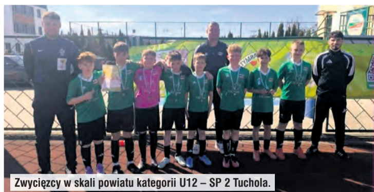
Zwycięcy w skali powiatu kategorii U12 – SP 2 Tuchola.