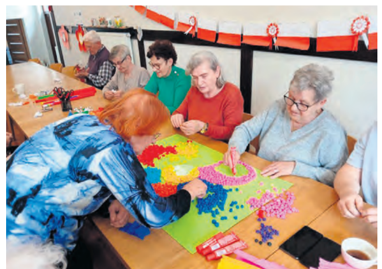
Dzienny Dom Pomocy w Śliwicach funkcjonuje od poniedziałku do piątku.

potrzebują wsparcia w codziennym funkcjonowaniu nie tylko z powodu wieku, ale również stanu zdrowia i niepełnosprawności.