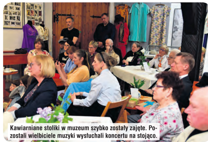
Kawiarniane stoliki w muzeum szybko zostały zajęte. Po zostali wielbiciele muzyki wysłuchali koncertu na stojąco.

– UniQuartet tworzą utalentowane i pełne pasji do muzyki instrumentalistki z Bydgoszczy. Panie mają na swoim koncie wiele angażów krajowych i międzynarodowych, biorą udział w prestiżowych konkursach. Obecnie wszystkie od kilku lat pracują w Filharmonii Pomorskiej, występują w kraju i za granicą z największymi osobistościami muzyki poważnej