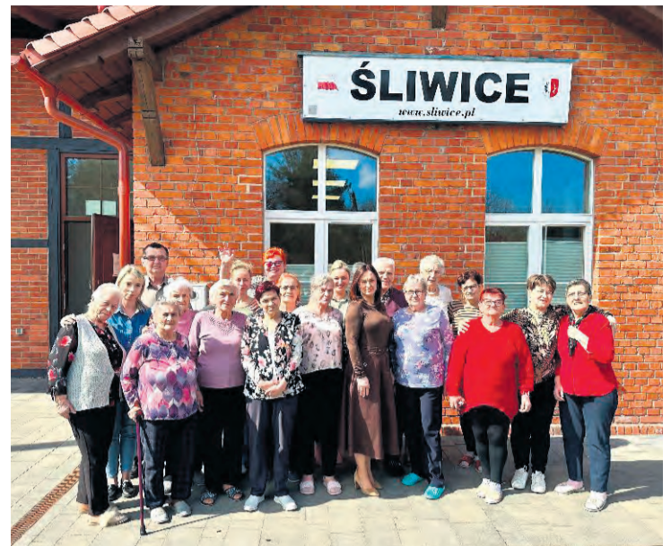
Najważniejszą kwestią dla osób rozważających dołączenie do DDP, to zniwelowanie bariery komunikacyjnej poprzez zapewnione dojazdy.

Dzień w śliwickim DDP ma stały harmonogram. Domownicy przyjeżdżają około godziny 8:30, potem mają śniadanie. Udają się na poranną gimnastykę. Kolejne godziny to dedykowane zajęcia ze specjalistami bądź wyżej wymienione aktywności. O godzinie 14:00 jest obiad, a po nim chwila odpoczynku. Po godzinie 15:00 rozpoczynają się odwozy mieszkańców, które realizowane są w kilku turach, bo korzy-