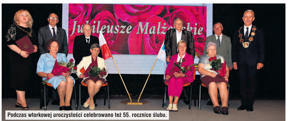
Podczas wtorkowej uroczystości celebrowano też 55. rocznice ślubu.