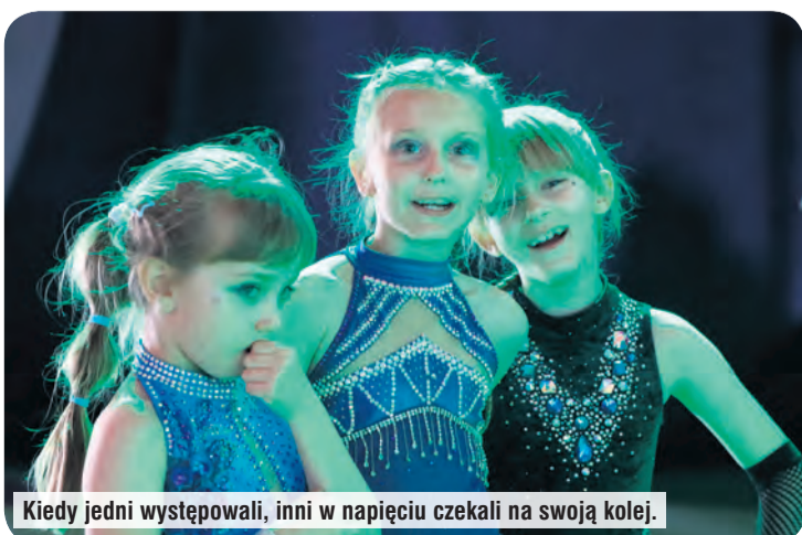
Kiedy jedni występowali, inni w napięciu czekali na swoją kolej.