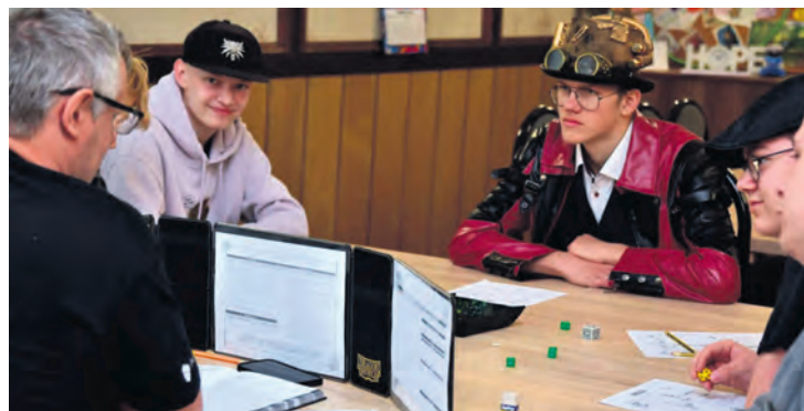
Wydarzenie organizowane przez Klub Gier Planszowych K20 ma już stałe grono fanów, a z roku na rok dołączają kolejni.