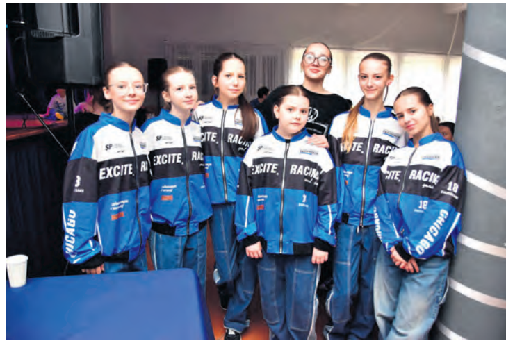
Porywalizować do Kęsowa przyjechały także Czerszczanki.