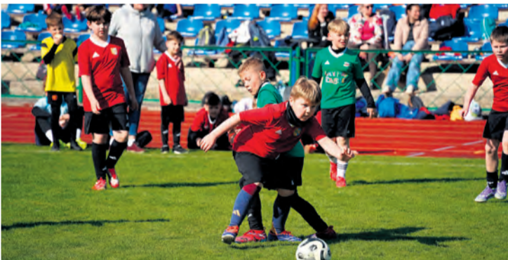
Pojedyunki indywidualne często decydowały o wyjściu przed bramkarza rywali.

Mecze w kategorii U8 trwały raz po 20 minut ze względu na niewielką liczbę drużyn, z kolei w starszych grupach każde spotkanie to 15 minut gry. Wszystkie zespoły rozegrały po pięć meczów, co jest dość intensywnie spędzonym czasem. Siedem godzin turniejowych upłynęło pod znakiem walki fair.