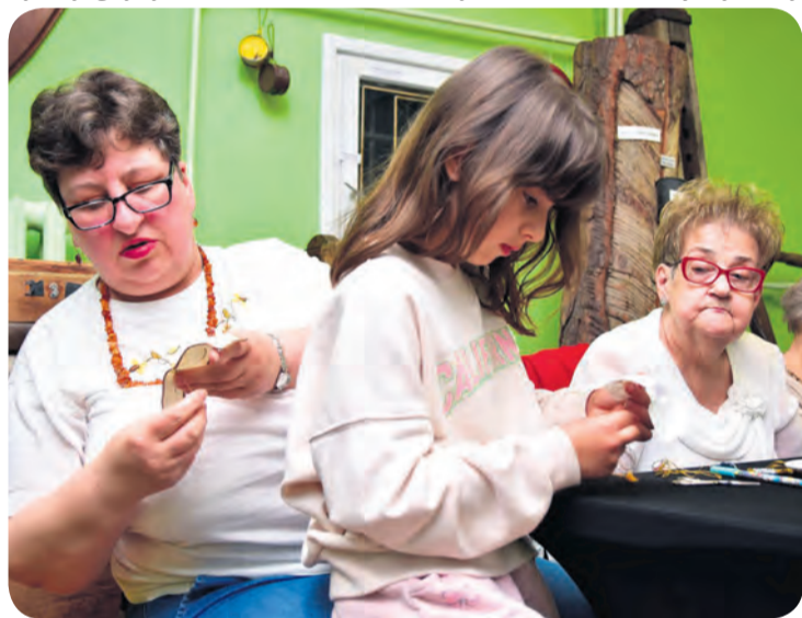
Hafciarki nie pozwoliły ani przez chwilę nudzić się dzieciom.