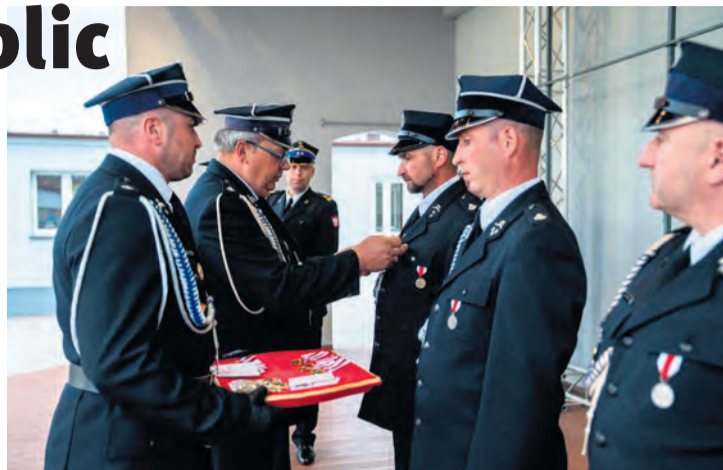
Medale i odznaczenia wypełniły Dzień Strażaka dla jednostek z terenu gminy Śliwice.

Przypomnijmy, że na terenie gminy Śliwice mieszkańcy mogą liczyć na druhów Ochotniczych Straży Pożarnych z: Rosochatki,