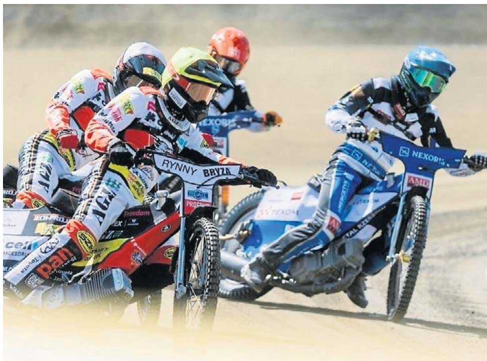
Cellfast Wilki Krosno i Stal Rzeszów w stosunku do minionego sezonu mocno zmieniły swoje składy, ale wśród kibiców derbowa gorączka wcale nie jest mniejsza

- Wszystko jest super jeżeli chodzi o tor, będzie idealnie. Przed meczem z Orłem Łódź też na torze leżała plandeka, w odpowiednim czasie ściągaliśmy ją i tor był super. Jeżeli chodzi o formę, dyspozycję zawodników, są gotowi do jazdy na 100 procent. Tak, jak to jest dzisiaj w żużlu, decyduje dyspozycja dnia zawodnika i dopasowanie motocykli. Trzeba zrobić punkty, tak jak każdy klub, chcemy wygrać, na pewno będziemy się mocno o to starali - kończy Kasprzak.