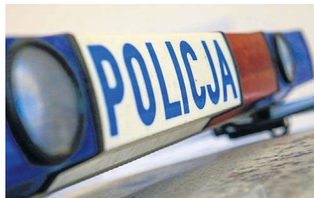
Do tragicznego zdarzenia doszło w miejscowości Grzegorzówka pod Rzeszowem

- Z niewyjaśnionych dotąd przyczyn 23-latkę wspięła się na konstrukcję słupa wysokiego napięcia, gdzie doszło do porażenia prądem - infor-