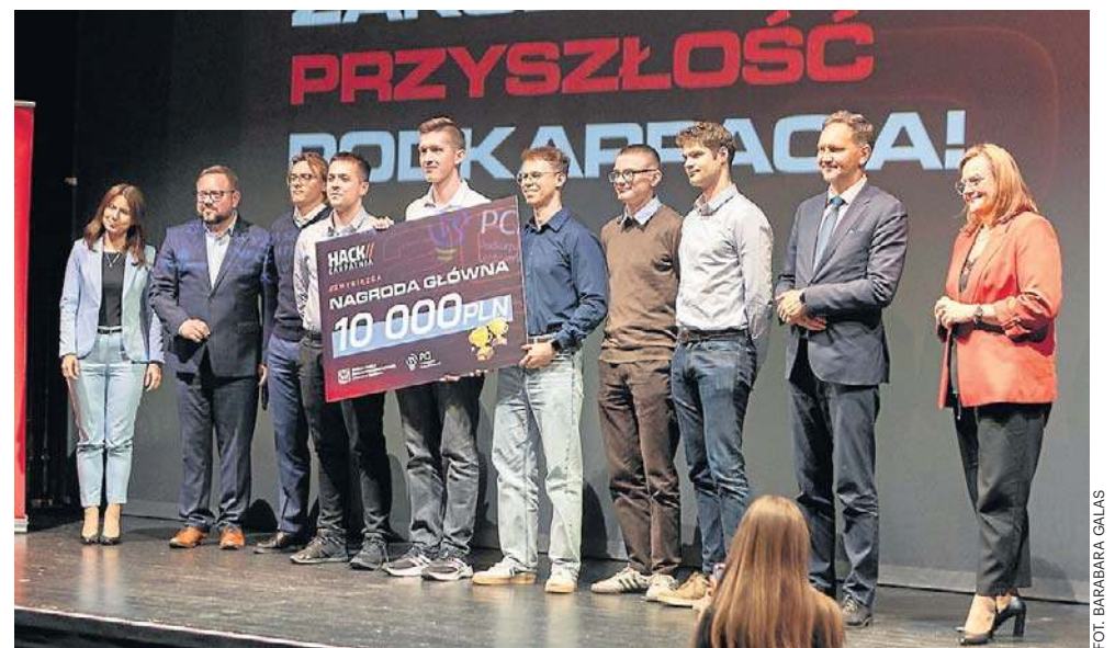
Wielki finał HackCarpathia 2026 odbył się 20 kwietnia w Rzeszowie

Wielki finał odbył się 20 kwietnia w Rzeszowie. Na sce-