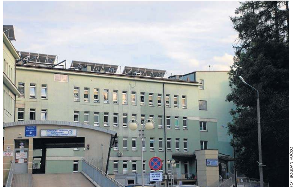
Szpital Specjalistyczny w Jaśle poparł ogólnopolską akcję protestacyjną „Czarny tydzień”

Ogólnopolski Związek Pracodawców Szpitali Powiatowych alarmuje, że obecna polityka finansowania ochrony zdrowia doprowadza do załamania i realnie zagraża bezpieczeństwu pacjentów. - Brak rozliczeń za 2025 rok, ograniczanie finansowania nadwykonoń oraz zaniżone wyceny świadczeń oznaczają, że zdecydowana większość szpitali powiatowych kończy rok stratą, a skumulowane wyniki liczone w skali kraju sięgają miliardów złotych. Jednocześnie setki szpi-