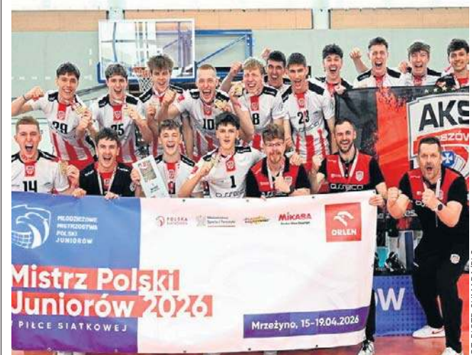
Siatkarze AKS V LO Rzeszów pokazali świetną grę i dużą klasę. Są najlepsi w Polsce, zbierają zasłużone gratulacje