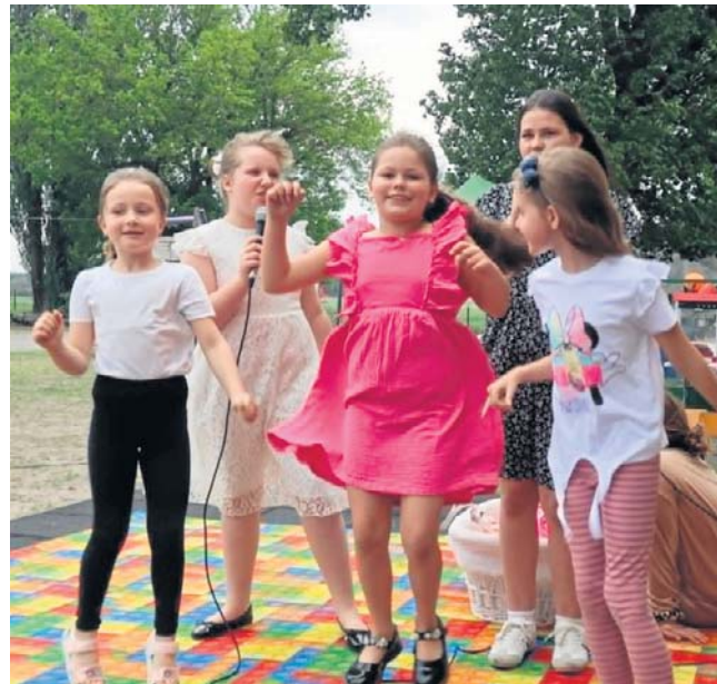
W szkole w Świętem uczy się w sumie 47 dzieci łącznie z przedszkolakami

Szkoła w Świętem to placówka nietypowa. Od 2001 roku prowadzi ją stowarzyszenie, którego prezesem jest Renata Borkowska. Działa dzięki subwencji oświatowej i odpisom 1,5 procenta podatku. Obecnie uczy się tu 47 dzieci łącznie z przedszkolakami -