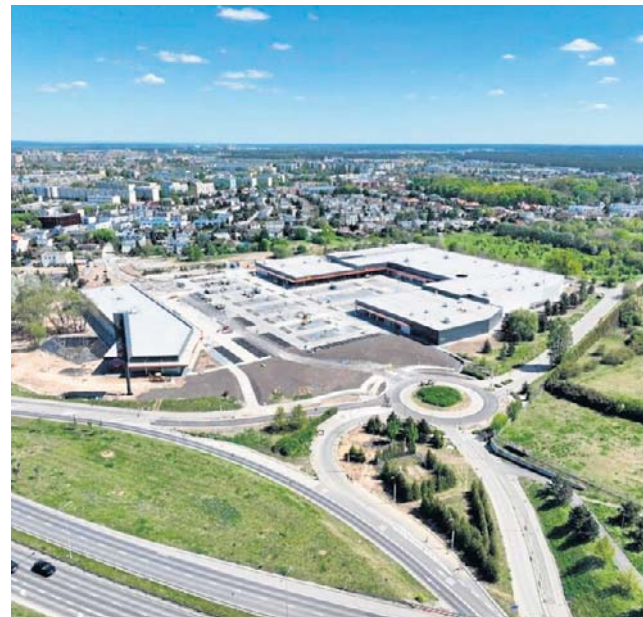
Centrum handlowe Comfy Park Bydgoszcz jest już gotowe i czeka na pierwszych klientów

Comfy Park Bydgoszcz ma 16 000 metrów kwadratowych powierzchni i składa się z dwóch obiektów. W przyszłości ma zostać rozbudowany o kolejne 4 000 metrów