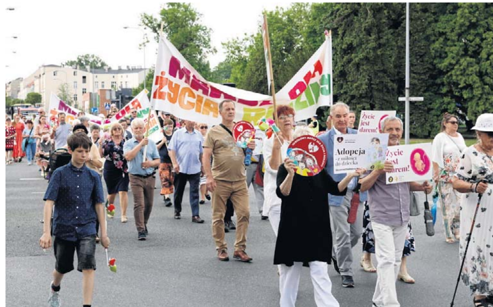
Ponad 200 osób ze śpiewem i modlitwą na ustach przeszło ulicami centrum miasta

W ogrodzie elżbietanek, w pobliżu „Okna życia”, odbył się piknik rodzinny z festynowymi atrakcjami. Jak co roku na uczestników marszu czekał tort ufundowany przez mar-