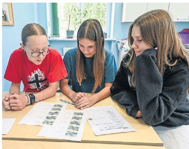
W finale wzięli udział uczniowie z 8 szkół podstawowych z klas VI-VIII, którzy posiadają kartę rowerową

Wszyscy uczestnicy z wielkim zaangażowaniem wykonywali poszczególne zadania. Ostatecznie najlepsza okazała się drużyna SP z Białych Błot. Drugie miejsce zajęła SP nr 56 Bydgoszcz, a trzecie SP nr 38 Bydgoszcz. ©©