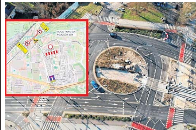
Utrudnienia potrwać do 3 czerwca 2026 roku