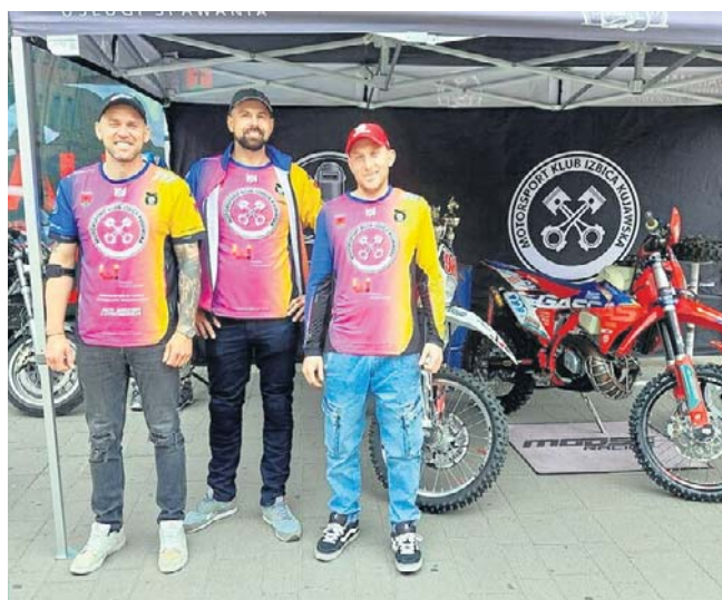
Zaprezentowała się grupa z Izbicy Kujawskiej

Krew w ambulansie Regionalnego Centrum Krwiodawstwa i Krwiolecznictwa oddało w sumie kilkadziesiąt osób