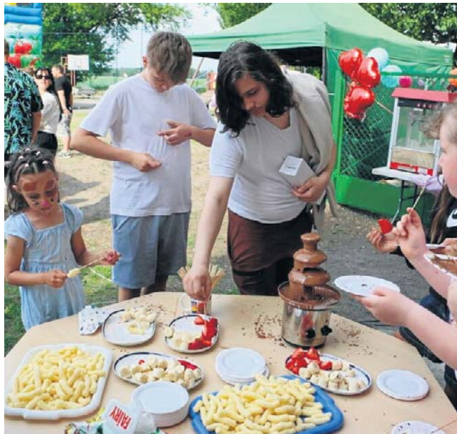
To wydarzenie na stałe wpisało się w kalendarz szkolnych imprez

Rodzinny piknik rozpoczęła msza święta odprawiona na boisku szkolnym.