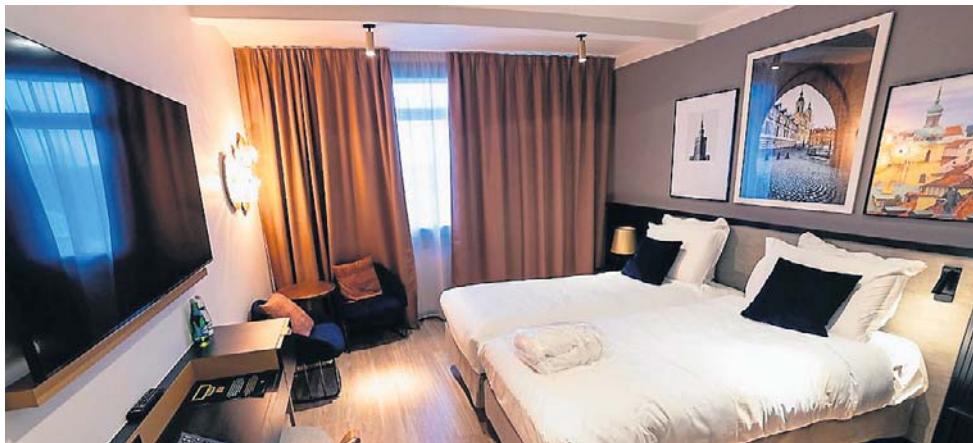
44 procent obłożenia to za mało, by utrzymać hotel

Wiele osób uważa, że hotele są drogie, ale rzeczywistość wygląda inaczej. Gdyby ceny były rzeczywiście za wysokie, hotele osiągałyby bardzo dobre wyniki finansowe. Tymczasem wiele obiektów ma dziś problemy z rentownością, a część funkcjonuje praktycznie na granicy opłacalności. Nie można po prostu dowolnie podnosić cen pokoi, ponieważ klient ma