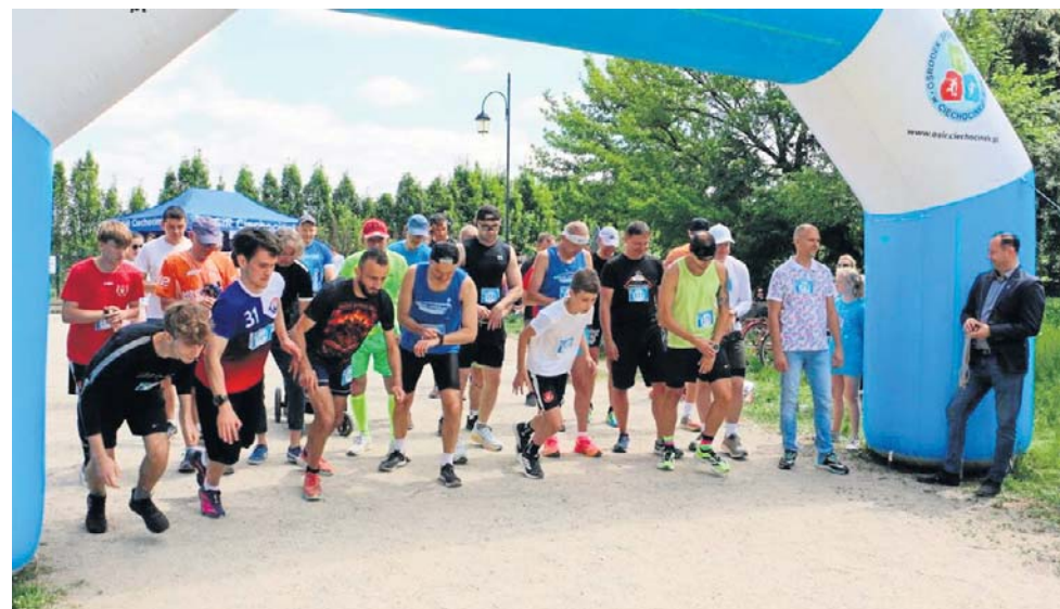
Jak podkreślali organizatorzy, liczyła się przede wszystkim dobra zabawa

Każdy uczestnik otrzymał pamiątkowy medal, jednak -