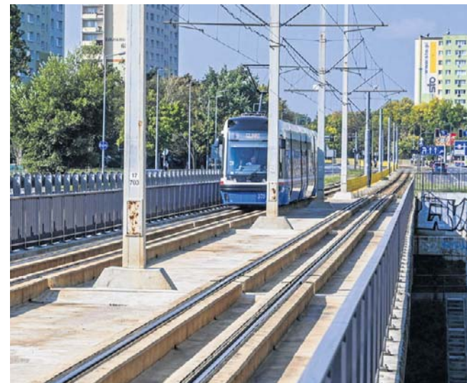
Tramwaje w trakcie prac przeniosą się na sąsiedni wiadukt drogowy

Zapytaliśmy drogowców, na jakim etapie są prace projektowe oraz kiedy mają rozpocząć się roboty budowlane. Gdy zapo-