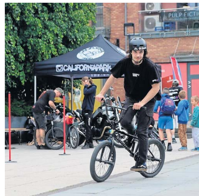
Jedno ze stoisk przy Wzorcowni - California Park