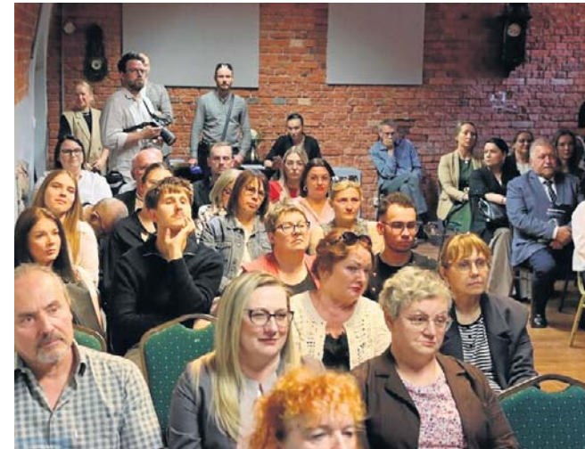
Podsumowaniu inwestycji towarzyszyła prezentacja w Centrum Kultury „Browar B.”