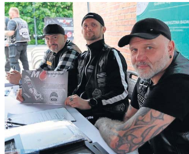
Krwiodawcy otrzymali specjalne podziękowania

Krew w ambulansie Regionalnego Centrum Krwiodawstwa i Krwiolecznictwa oddało w sumie kilkadziesiąt osób