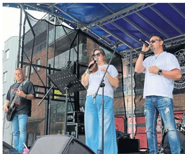
Na scenie zespół Dead Line