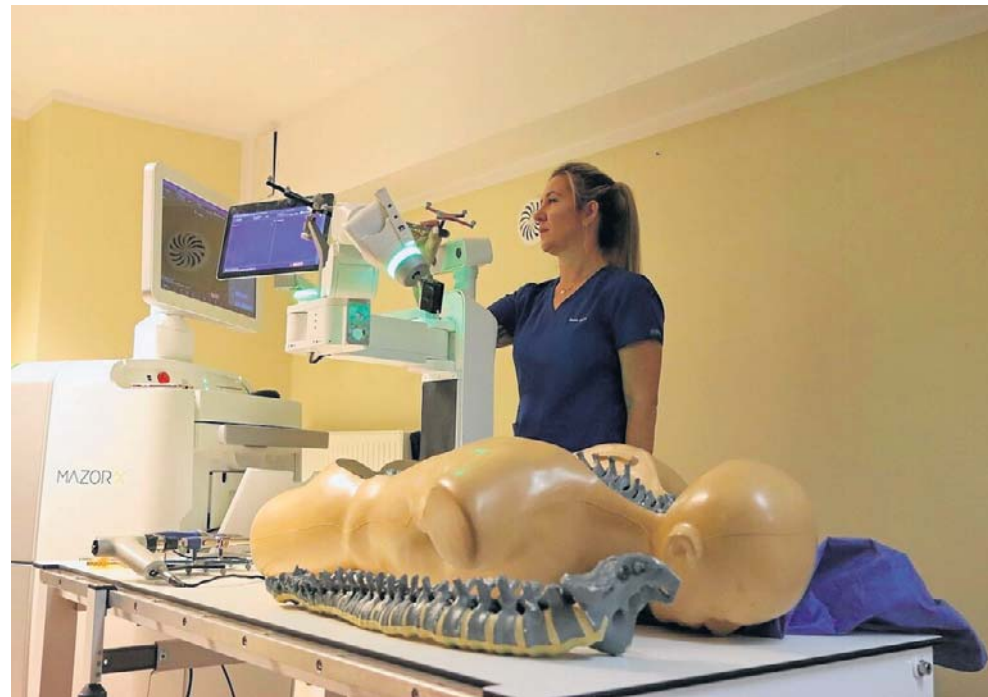
Tak przebiegał pokaz szpitalnego robota chirurgicznego

To przełomowy moment, który istotnie zmienia pozycję szpitala w regionalnym systemie ochrony zdrowia. Wdrożenie chirurgii robotycznej otwiera nowy rozdział w dostępności nowoczesnych, małoinwazyjnych metod leczenia dla mieszkańców południowo-zachodniej części województwa kujawsko-pomorskiego, umożliwiając realizację zaawansowanych procedur na miejscu, bez konieczności kierowania pacjentów do odległych ośrodków.