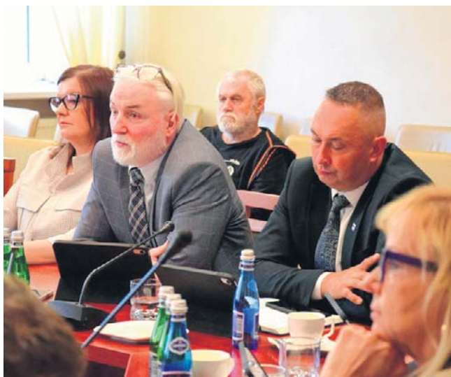
Podczas minionej sesji radni rozliczali burmistrza Żnina z wykonania budżetu 2025. Włodarz otrzymał absolutorium