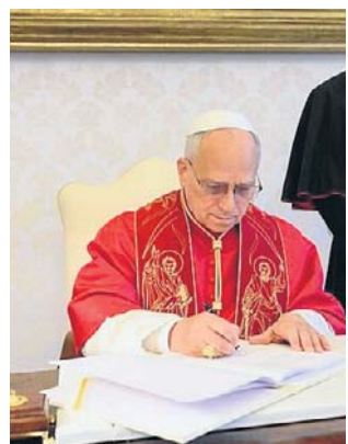
Papież podpisuje encyklikę „Magnifica humanitas”

Dokument otwierają następujące słowa: „Wspaniałe człowieczeństwo stworzone przez Boga staje dziś wobec decydującego wyboru: wznieść nową wieżę Babel albo budować mia-