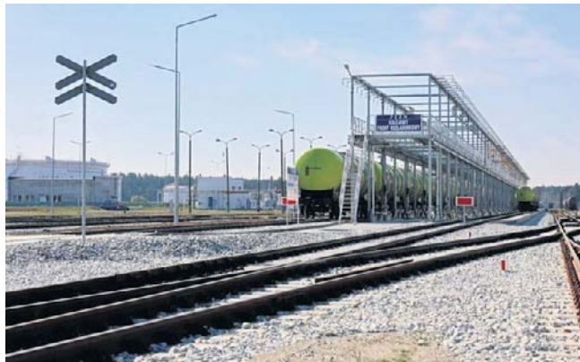
Stacja kolejowa paliw w Nowej Wsi Wielkiej

Inwestycja umożliwi jednoczesny przeładunek do 36 wagonów-cystern i dwukrotnie zwiększa zdolności bazy w za-