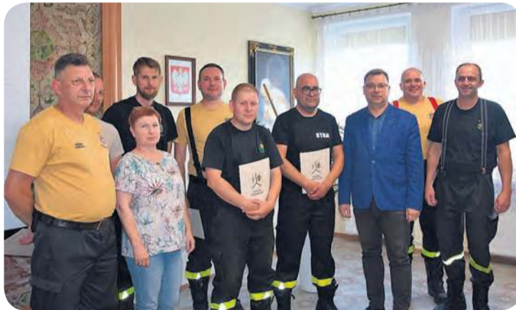
Przedstawiciele władz gminy oraz jednostek OSP po podpisaniu porozumień.

Wyposażenie, które wcześniej trafiło do gminnego magazynu