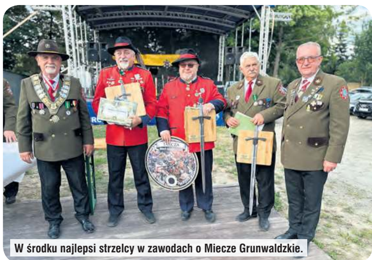
W środku najlepsi strzelcy w zawodach o Miecz Grunwaldzki.