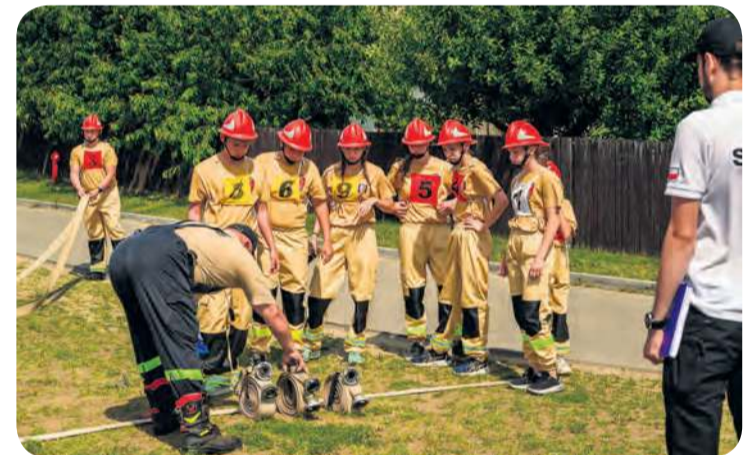
Ostatnie instrukcje przed startem.

we od samego sobotniego poranka. A że na stadionie w Cekcynie zbyt dużo cienia się nie znajdzie, to trzeba kombinować. Na przykład Zdroje wjechały na zawody z parasolami. A dla wszystkich w końcu odpalono chłodzącą kurtynę wodną.