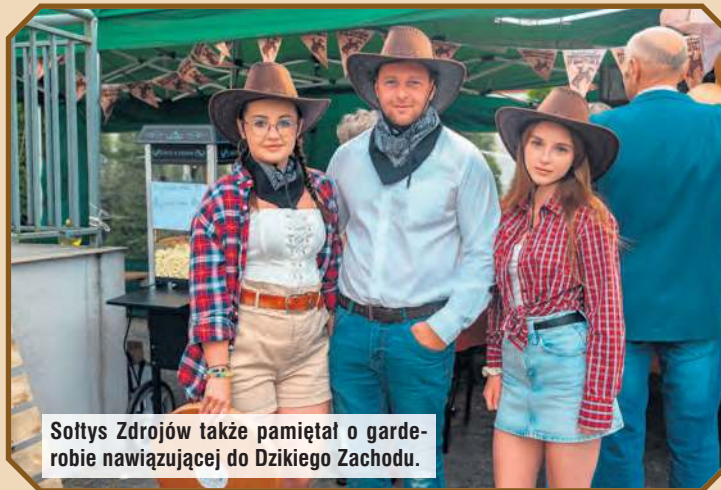
Soltyś Zdrojów także pamiętał o garderobie nawiązującej do Dzikiego Zachodu.

zyskała wyjątkowy, klimatyczny charakter. Impreza w Zdrojach nie może obyć się bez zaangażowania tamtejszej jednostki OSP. Ciekawymi inicjatywami wykazała się Młodzieżowa Drużyna Pożarnicza, która zapraszała do rozwiązywania quizu „Bezpieczni na co dzień” z tylko na pozór łatwymi pytaniami. Ponadto miejscowe drużyny i druhowie przygotowali zadanie do wykonania, które polegało na spakowaniu plecaka ewakuacyjnego.