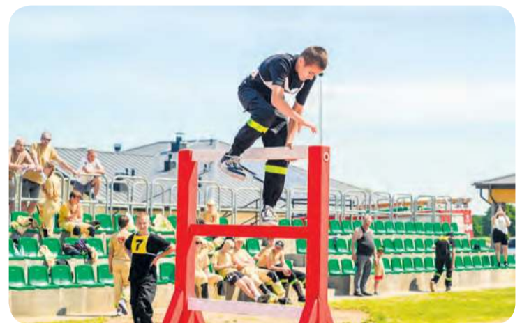
Sztafeta podczas zawodów to nie przelewki.