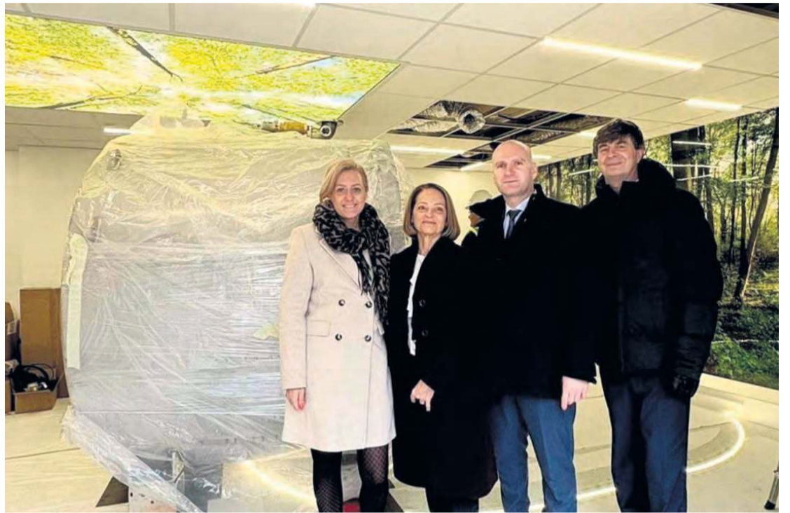
W listopadzie zeszłego roku w pracowni instalowany był magnes. Ta jednak nadal nie działa, co niepokoi mieszkańców powiatu tucholskiego.

– Chodzi o ograniczenie badań obrazowych i endoskopii. To spowodowało, że w tym