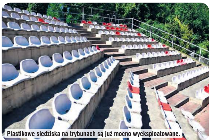
Plastikowe siedziska na trybunach są już mocno wyeksploatowane.

– Jeśli uda się pozyskać środki, modernizacja amfiteatru stanie się faktem w przyszłym roku. Wartość inwestycji to prawie