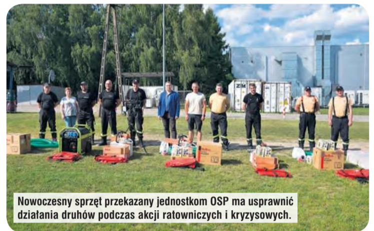
Nowoczesny sprzęt przekazany jednostkom OSP ma usprawnić działania druhów podczas akcji ratowniczych i kryzysowych.