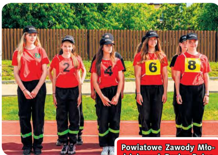
Dziewczęca drużyna z Cekcyna.

Choć pisanie o pogodzie w relacjach z wydarzeń jest nieco banalne, w tym przypadku trzeba podkreślić, że młodzież mierzyła się nie tylko z dwiema konkurencjami, ale też upałem, wręcz skwarem, co było bardzo uciążli-