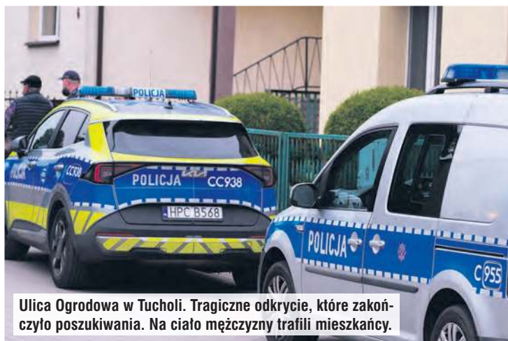
Ulica Ogrodowa w Tucholi. Tragiczne odkrycie, które zakończyło poszukiwania. Na ciało mężczyzny trafili mieszkańcy.