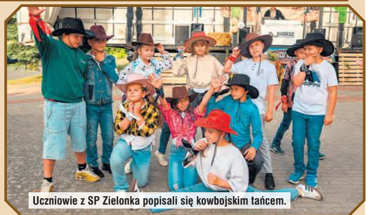
Uczniowie z SP Zielonka popisali się kowbojskim tańcem.

Wieczorem festyn zakończyła wspólna zabawa taneczna przy muzyce DJ-a Horse. Wielu uczestników pojawiło się w kowbojskich i westernowych strojach, dzięki czemu impreza