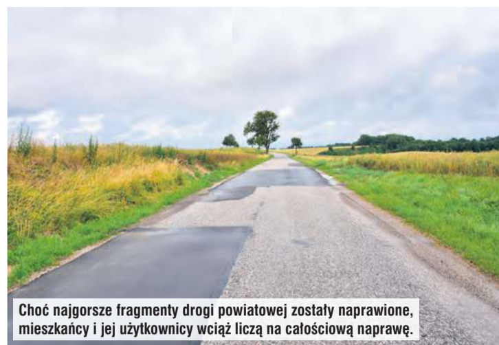
Choć najgorsze fragmenty drogi powiatowej zostały naprawione, mieszkańcy i jej użytkownicy wciąż liczą na całościową naprawę.

Powiat przypomina, że „już na przełomie maja/czerwca br.” rozpoczęty został remont cząstkowy wraz z likwidacją przełomów. To działanie zostało określone jako konieczne, aby przywrócić bezpieczeństwo ruchu, zapobiec degradacji drogi i zatrzymać zaleganie wody. Likwidacja