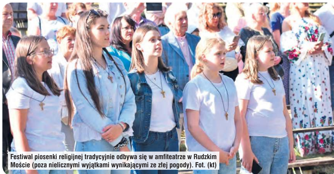
Festiwal piosenki religijnej tradycyjnie odbywa się w amfiteatrze w Rudzkim Moście (poza nielicznymi wyjątkami wynikającymi ze złej pogody).

Na jubileuszowy XXX Ogólnopolski Festiwal Piosenki Religijnej – Bory Tucholskie 2026 zapraszają Parafia Opatrzności Bożej w Tucholi – Rudzkim Moście oraz Tucholski Ośrodek Kultury. Tegoroczna odsłona wydarzenia odbędzie się pod hasłem „Uczniowie – Misjonarze”.