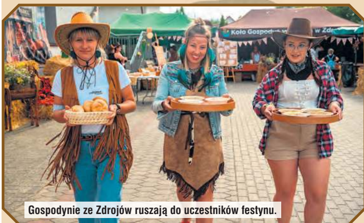
Gospodynie ze Zdrojów ruszają do uczestników festynu.