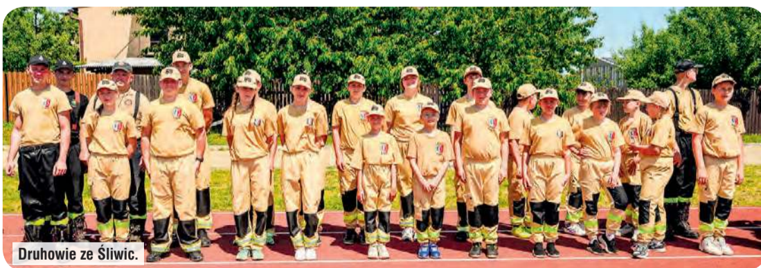
Druhowie ze Śliwic.