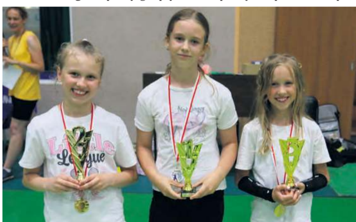
Zwycięczynie z uśmiechami stawały do dekoracji.