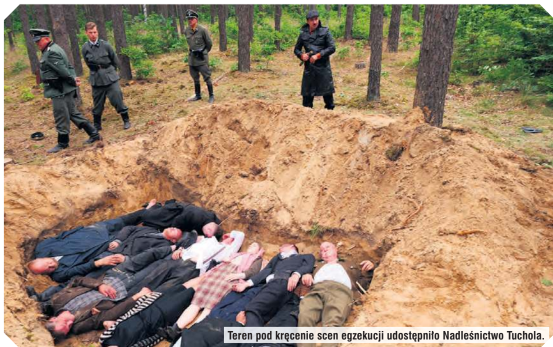
Teren pod kręcenie scen egzekucji udostępniło Nadleśnictwo Tuchola.