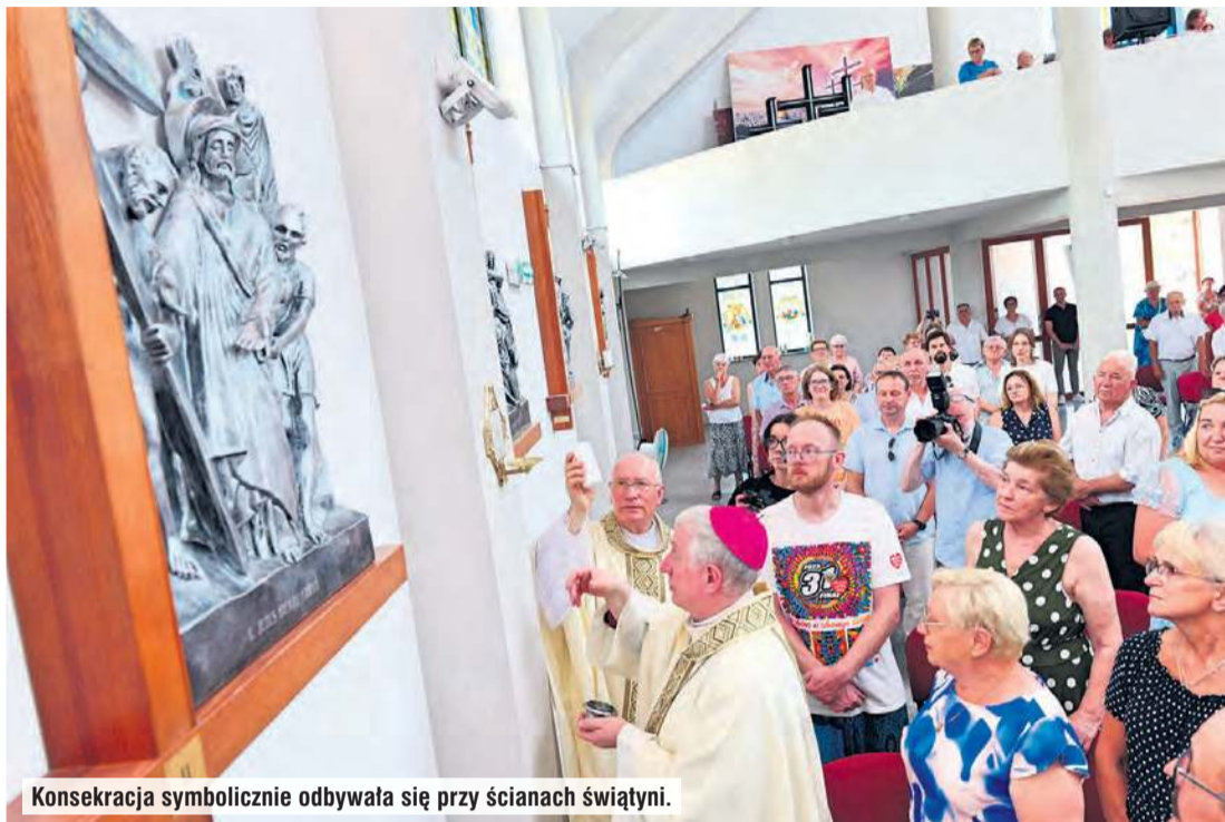
Konsekracja symbolicznie odbywała się przy ścianach świątyni.

– Wyrażamy naszą wdzięczność za poświęcenie kościoła