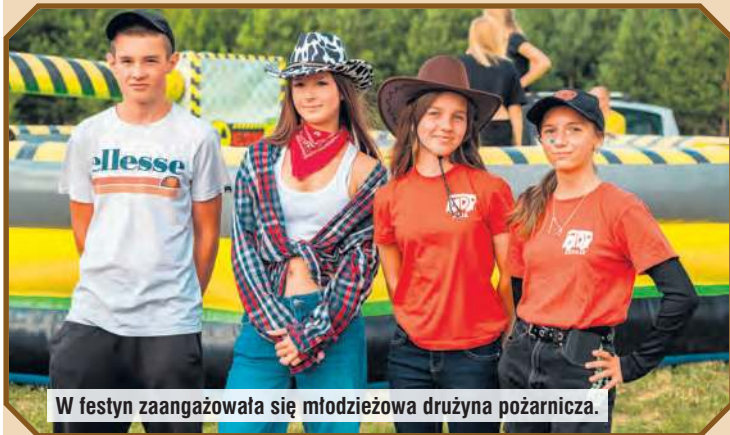
W festyn zaangażowała się młodzieżowa drużyna pożarnicza.