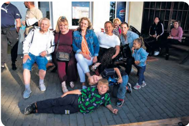
Nad Rudnicą bawiono się całymi rodzinami.