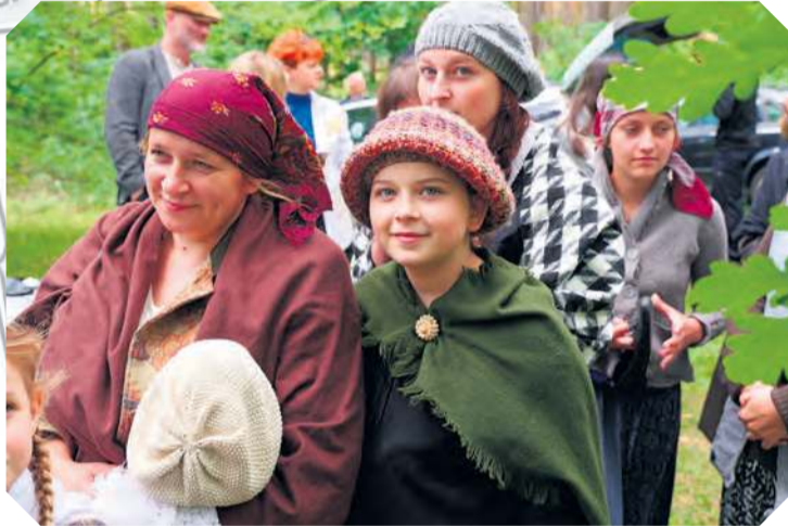
Na planie filmowym „Medalika”, tym razem w lesie w Tucholi, niedaleko ul. Budowlanej. Twórcy filmu początkowo mieli zamiar kręcić sceny po drugiej stronie ul. Świeckiej, niedaleko Pomnika Pomordowanych. Porzucili ten pomysł, aby nie naruszać spokoju w miejscu pamięci. Wybrali miejsce bardzo odosobnione dzięki przychylności Nadleśnictwa Tuchola.

Choć wszyscy uczestnicy zdjęć wiedzieli, że mają do czynienia z filmową rekonstrukcją,