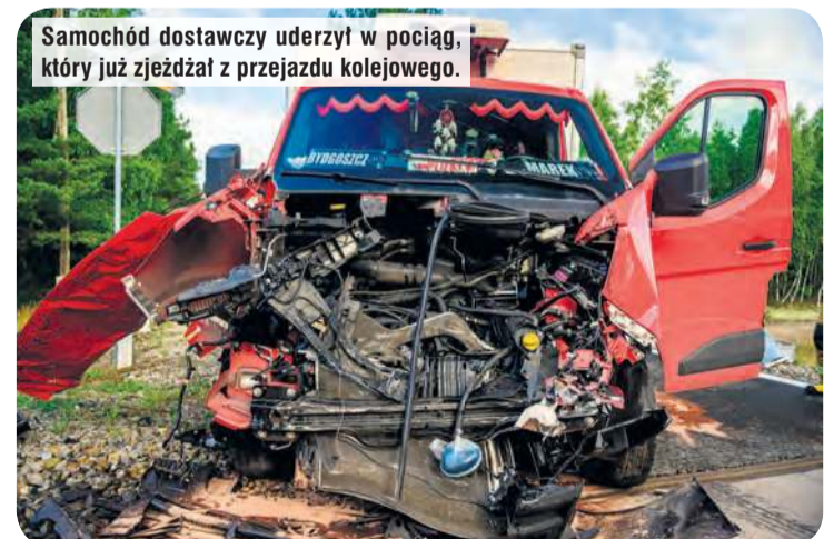
Samochód dostawczy uderzył w pociąg, który już zjeżdżał z przejazdu kolejowego.

We środę (8 lipca) około godziny 7:00 na przejeździe kolejowym pomiędzy Lińskiem a Okoninami Nadjeziornymi doszło do kolizji samochodu dostawczego typu bus z szynobusem relacji Czersk – Bydgoszcz. Jaką przyczynę tego zdarzenia podaje nam tucholska policja?