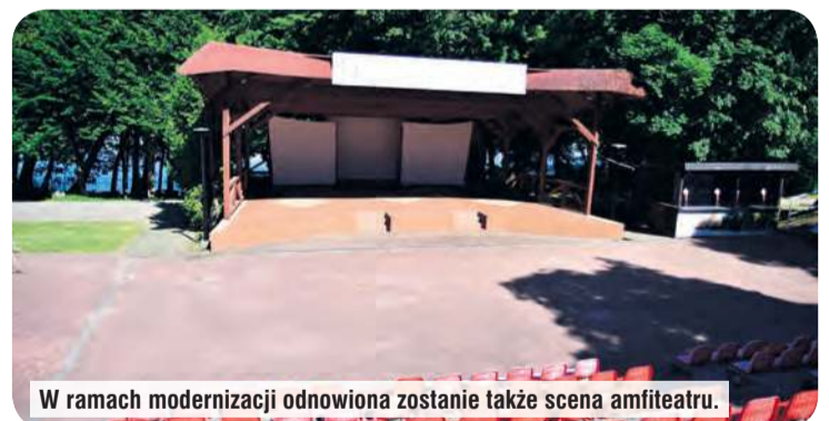
W ramach modernizacji odnowiona zostanie także scena amfiteatru.

Planowany jest również remont całej sceny oraz uszczelnienie