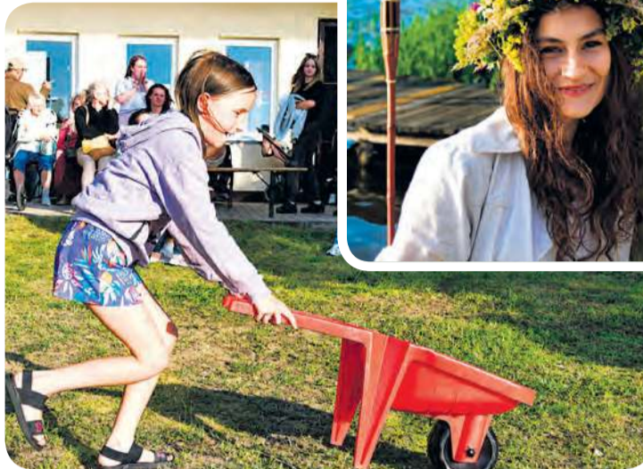
Najmłodszy brał chętnie udział w konkurencjach zręcznościowych.