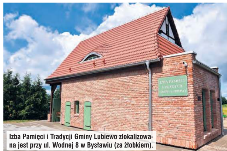
Izba Pamięci i Tradycji Gminy Lubiewo zlokalizowana jest przy ul. Wodnej 8 w Bysławiu (za żłobkiem).

Każde spotkanie to okazja do wspólnego spędzenia czasu, poznania lokalnych tradycji i skosztowania domowych wypieków oraz potraw. Dodatkową atrakcją