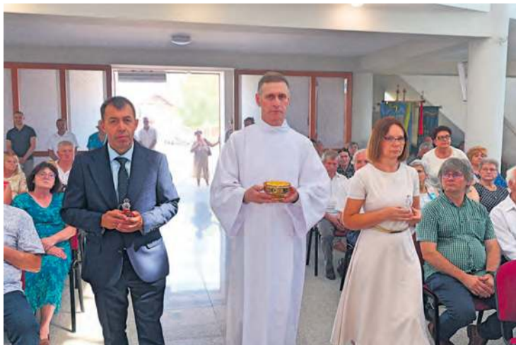
Do ołtarza podchodzą przedstawiciele rady parafialnej.