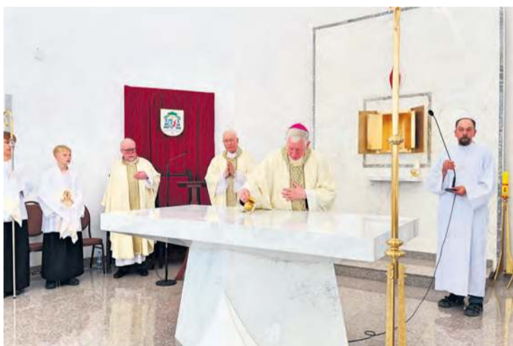
Namaszczenie okazałego, nowego ołtarza.