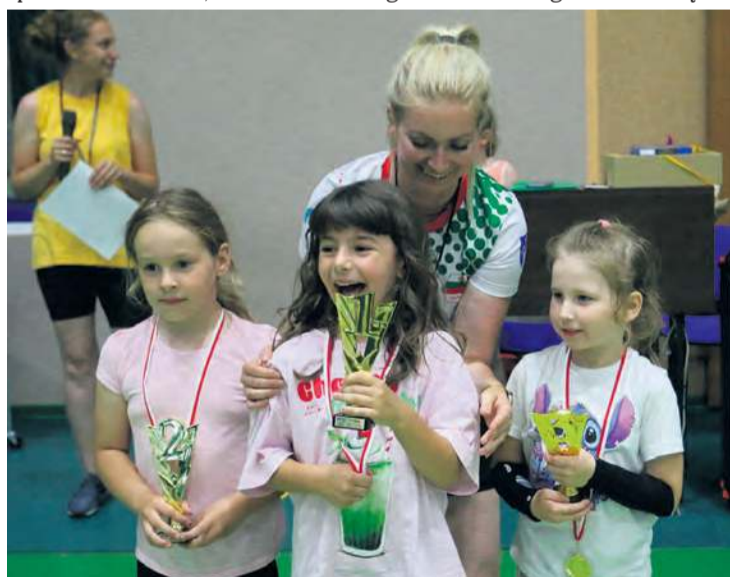
Przejęte sukcesem dziewczynki niełatwo było poskromić w okazywaniu radości.