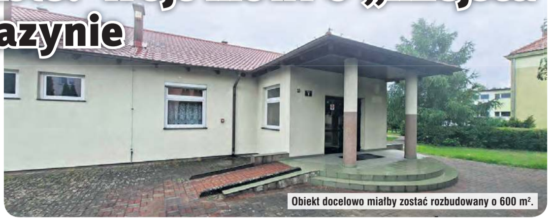
Obiekt docelowo miałby zostać rozbudowany o 600 m 2 .

– Chcemy go powiększyć o około 600 m 2 . Tam mają być zlokalizowane zastępcze miejsca szpitalne, ale budynek ma być wykorzystywany dwójako, bo jako szkoła, a w czasach – nie daj