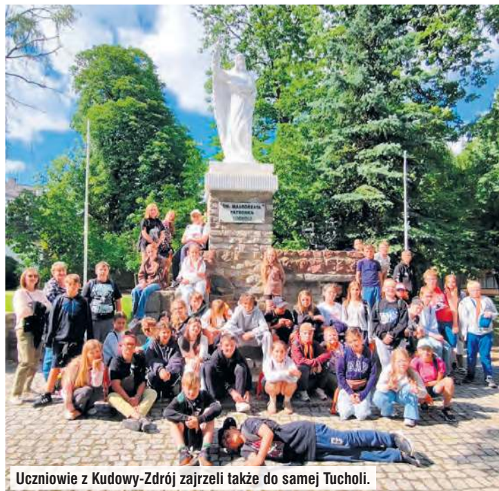
Uczniowie z Kudowy-Zdrój zajrzeli także do samej Tucholi.