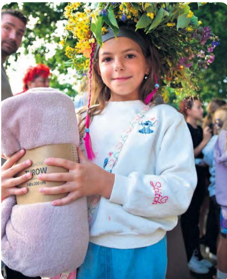
Dziewczynki chętnie brały udział w warsztatach plecenia wianków i późniejszym konkursie.

Zgodnie z tradycją, po rozstrzygnięciu konkursu uczestnicy puścili wianki na wodę.