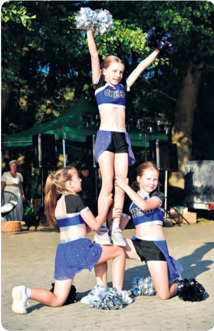
Przed publicznością zaprezentowały się zespoły taneczne działające przy WDK w Raciążu.

Jednym z najważniejszych punktów programu były warszta-