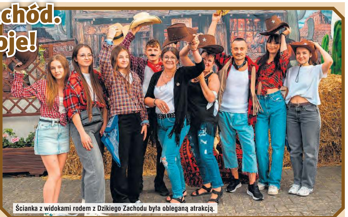
Ścianka z widokami rodem z Dzikiego Zachodu była obleganą atrakcją.

się byk rodeo, nie brakowało również konkursów i zabaw dla dzieci oraz dorosłych. Najmłodszy chętnie korzystali z dmuchanych zjeżdżalni, fotobudki oraz stoisk z watą cukrową i popcornem. Warto podkreślić, że taniec kowbojski został wykonany przez uczniów klasy III ze Szkoły Podstawowej w Zielonce. Grupę