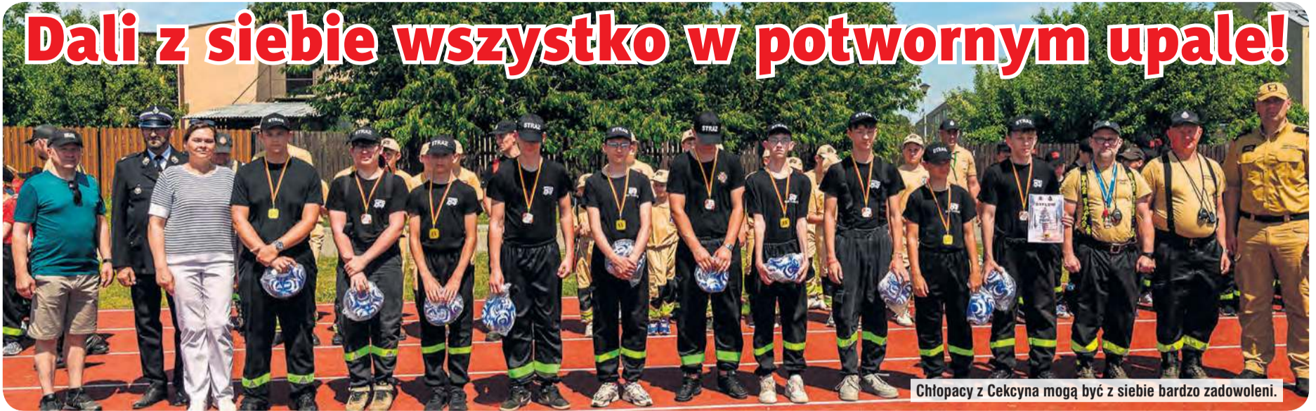
Chłopcy z Cekcyna mogą być z siebie bardzo zadowoleni.

Sobotnia pogoda wymagała wykrzesania z siebie ogromnych pokładów sił. Młodzieżowe Drużyny Pożarnicze z powiatu tucholskiego stanęły na wysokości zadania, startując w zawodach powiatowych, które odbyły się w Cekcynie. Sprawdźcie, które ekipy wywalczyły podium.