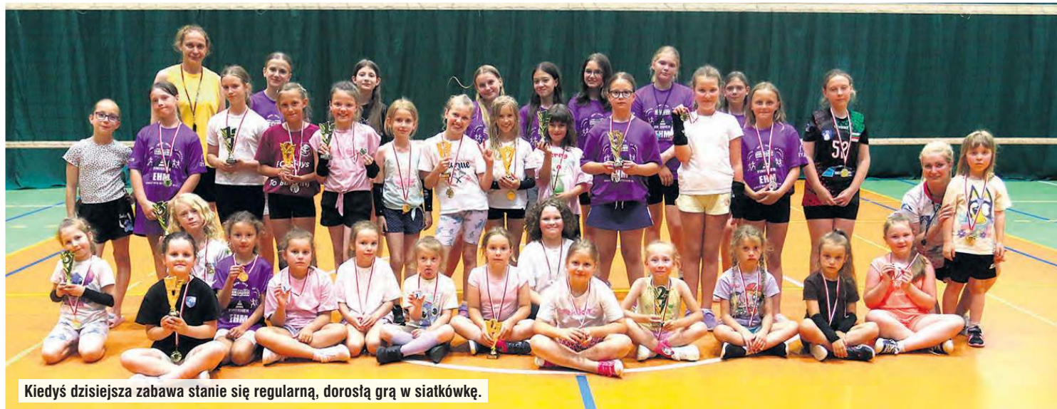
Kiedyś dzisiejsza zabawa stanie się regularną, dorosłą grą w siatkówkę.