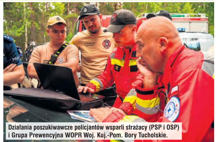
Działania poszukiwawcze policjantów wsparli strażacy (PSP i OSP) i Grupa Prewencyjna WOPR Woj. Kuj.-Pom. Bory Tucholskie.

– Dzisiaj [poniedziałek 6 lipca – red.] w godzinach wieczornych na terenie jednej z posesji w Tucholi zostało odnalezione ciało zaginionego mężczyzny. Policjanci, pod nadzorem prokuratora, wykonują niezbędne czynności procesowe. Wstępnie wykluczono udział osób trzecich. Zwłoki zostaną zabezpieczone i przekazane do Zakładu Medycyny Sądowej w Bydgoszczy – podał oficer prasowy Komendy Powiatowej Policji w Tucholi Łukasz Tomaszewski . Później informację o śmierci pana