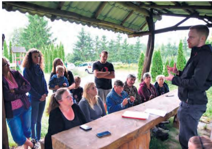
Mieszkańcy liczą, że władze gminy Lubiewo przychylą się do ponawianej prośby utworzenia sołectwa Teolog.