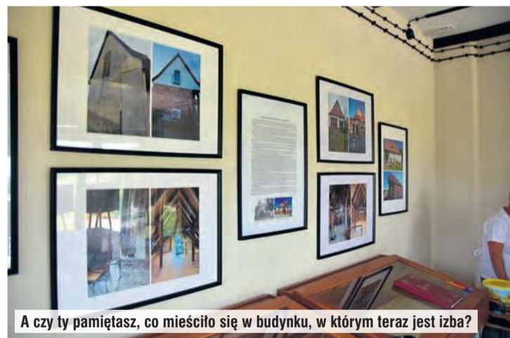
A czy ty pamiętasz, co mieściło się w budynku, w którym teraz jest izba?