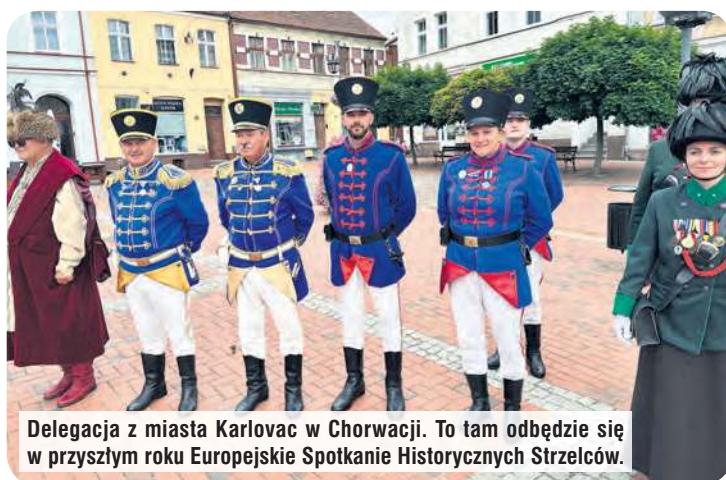
Delegacja z miasta Karlovac w Chorwacji. To tam odbędzie się w przyszłym roku Europejskie Spotkanie Historycznych Strzelców.

ne dla organizacji strzeleckich. Co więcej, przywilej warzenia i sprzedaży piwa należał do typowych królewskich nadań dla tego rodzaju bractw nie tylko w Polsce. Z kolei zachowane, najstarsze dokumenty dotyczące tucholskiego stowarzyszenia pochodzą z roku 1835.