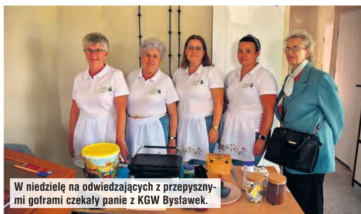
W niedzielę na odwiedzających z przepysznyymi goframi czekały panie z KGW Bysławek.