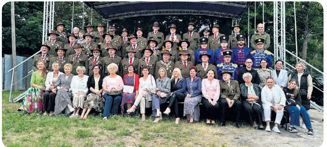
Bracia z Tucholi podczas pierwszego dnia święta – wraz z najbliższymi i gośćmi z Chorwacji.

W dokumencie nie ma wprawdzie bezpośredniego odniesienia do bractwa strzeleckiego, jednak bracia otrzymali prawo, a wręcz mieli obowiązek posiadania broni służącej do obrony miasta – szpady, muszkietu i kuszy. Właśnie takie prawa i obowiązki są charakterystycz-