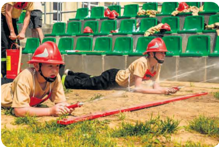
Ćwiczenie bojowe podczas zawodów.