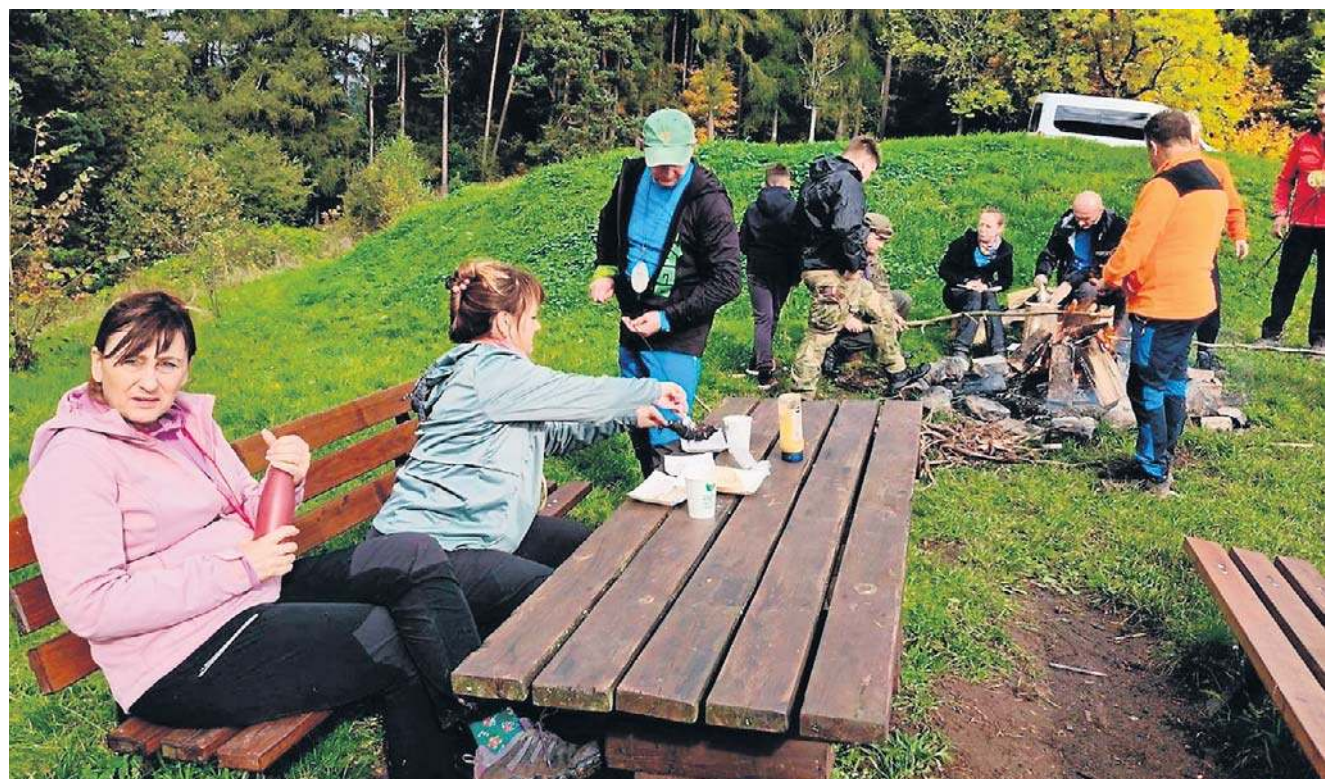
W każdym plecaku znajdowały się jakieś smakołyki. Przy ognisku okazywało się, co kto zabrał ze sobą na wędrowkę.