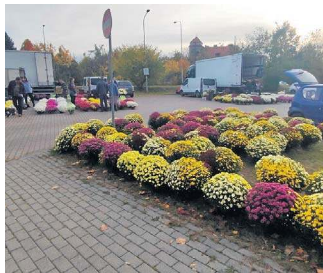
Przed Wszystkimi Świętymi parking przy Kasztanowej zapełnia się handlującymi i kupującymi. Potem zamiera...

Tymczasem weekendowe targowisko dla rolników w Wałbrzychu istnieje od kilku lat. Niestety, ożywa na krótko tylko jesienią. Mało kto wie, gdzie go szukać, choć wkrótce ponownie stanie się miejscem, łączących wytwórców z kupującymi. Bez pośredników.