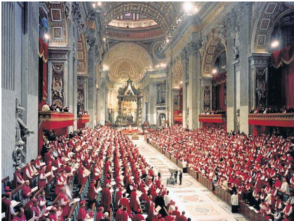
Sobór rozpoczął ingres 2540 ojców soboru do Bazyliki Świętego Piotra, a następnie odbyła się uroczysta msza święta do Ducha Świętego.