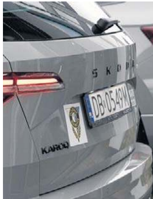
Auta koszykarzy mają z tyłu logo wałbrzyskiego klubu.

Potwierdza to fakt, że nasza ekstraklasowa drużyna staje się uznana marką i może liczyć na wsparcie i zaangażowanie renomowanych partnerów. Górnik Zamek Książ nie zawodzi. Rozpoczął sezon w ekstraklasie