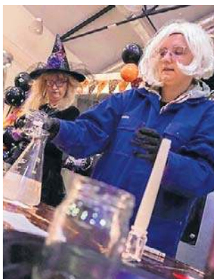
Halloweenowe spotkania w SK to już tradycja.