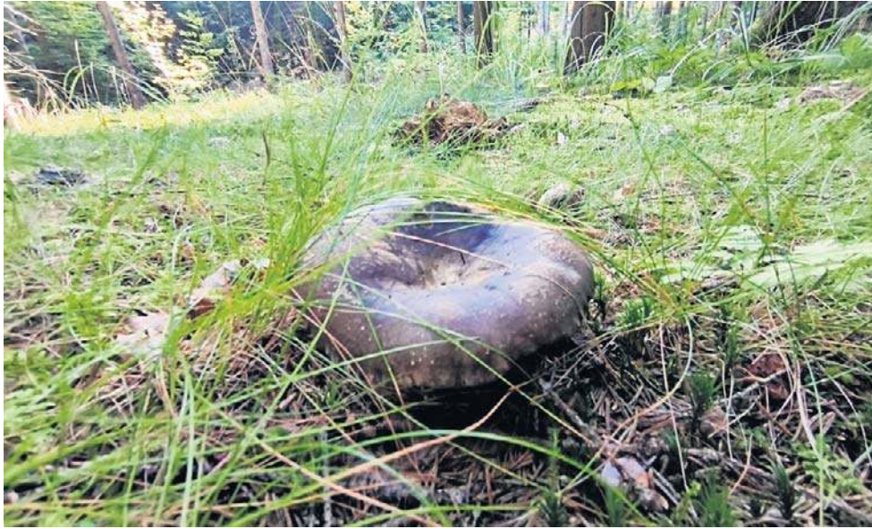
Taki piękny okaz znaleźliśmy niedawno w Górach Kamiennych. Ma ich być coraz więcej!

Do połowy września mieszkańcy południa regionu czytali