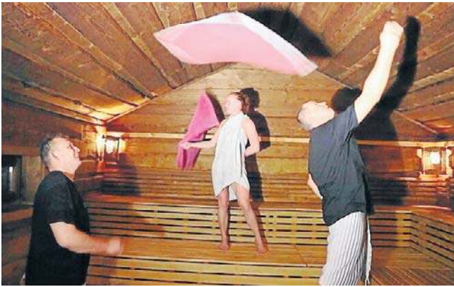
Nocne Saunowanie cieszy się wielkim zainteresowaniem klientów. Pierwsza edycja sprzedała się błyskawicznie.