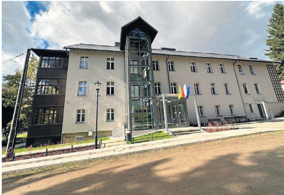
Tak prezentuje się z zewnątrz odnowiony Zakład Opieki Leczniczej Górnik w Sokołowsku.

Sanatoria Dolnośląskie postanowiły go wyremontować, inwestując pieniądze spółki i dotację z Urzędu Marszałkowskiego. 13 października obiekt uroczyste otwarto w towarzystwie licznych zaproszonych gości.