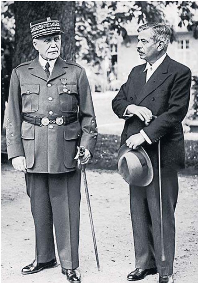
Dwaj liderzy Vichy: marszałek Philippe Pétain i Pierre Laval, 1942 rok. Obaj zostali skazani na karę śmierci, ale Pétain ostatecznie dostał dożywocie.

Ale już 10 lipca zebrane w Tuluzie Zgromadzenie Narodowe Republiki Francuskiej udzieliło nadzwyczajnych pełnomocnictw premierowi, marszałkowi Philippe'owi Pétainowi, który na ich podstawie ogłosił się „głową państwa fran-