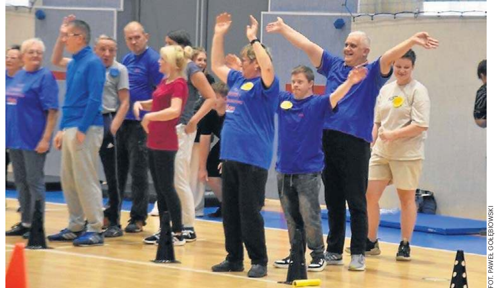
Dziesiątki osób w różnym wieku rywalizowały, a właściwie to bawiły się i poznawały.

To ten klub zainicjował organizację zawodów. Zaprosił do udziału m.in. Domy Seniora z Białego Kamienia i Sobięcina, warsztaty terapii zajęciowej, Centrum Aktywności Lokalnej, Zespół Szkół nr 7 oraz Liceum Społeczne w Wałbrzychu. W sumie siedem drużyn.