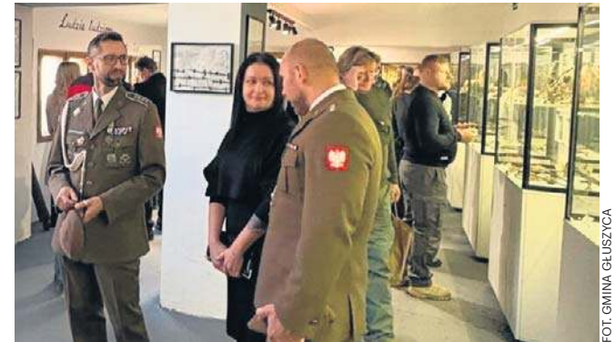
W Muzeum Inżynierii i Techniki Motoryzacji w Głuszycy znalazły się przedmioty, odnalezione w najbliższej okolicy.

Jak łatwo się domyślić, są tu prezentowane eksponaty z czasów II wojny światowej - z miejsc, w których budowano kompleks Riese. Jak podkreślają organizatorzy, nie chodzi o sensację, związane z wielkimi tajemnicami, ale raczej o upamiętnienie ludzi, więźniów obozów koncentracyjnych,