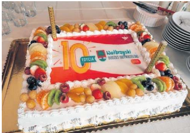
Tort na jubileusz. W 10. edycji WBO walczyły ze sobą argumenty 33 projekty, pięć zyskało dofinansowanie.

szom w umiejętności gry w koszykówkę, będzie też można prowadzić istotne rozgrywki w różnych częściach miasta.