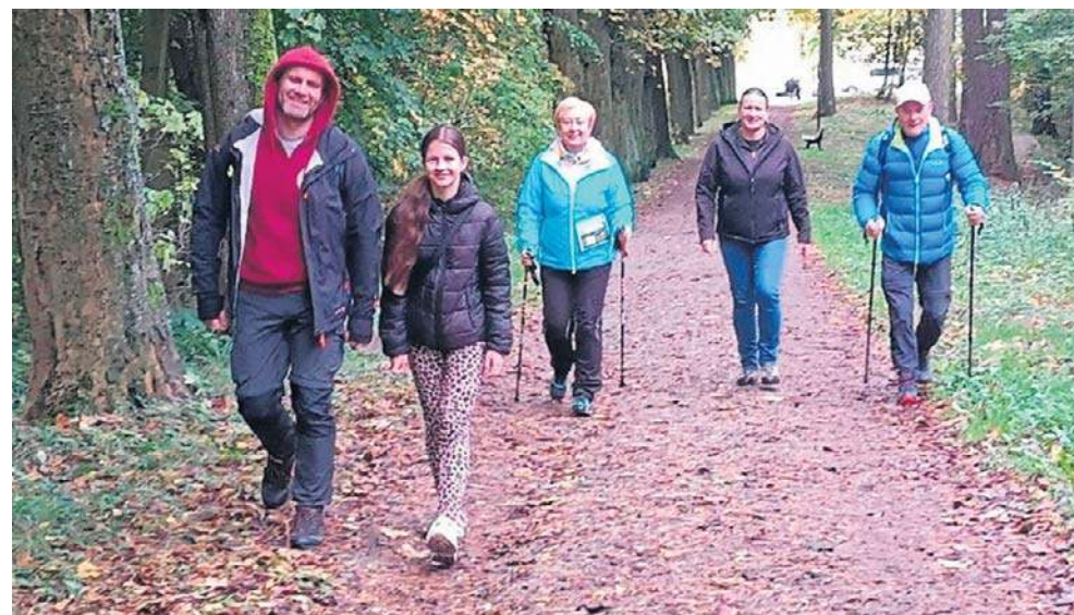
Trasa nie była szczególnie trudna technicznie. Zdarzały się nawet płaskie odcinki.