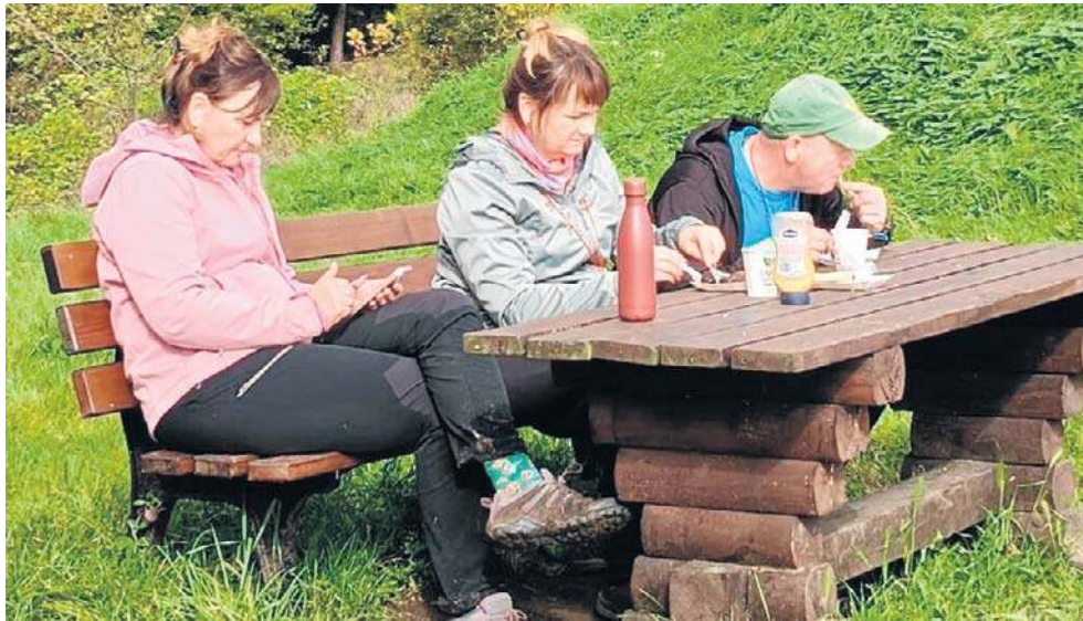
Drugie śniadanie na łonie przyrody? Doprawdy, trudno o przyjemniejsze doznanie!