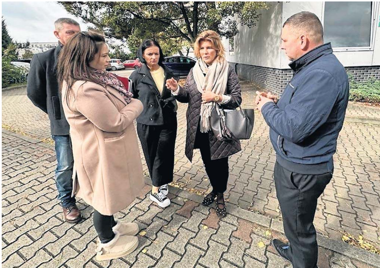
Mieszkańcy domagali się w siedzibie KOWR we Wrocławiu wstrzymania sprzedaży działki. I taką obietnicę otrzymali.

Mieszkańcy już kilka miesięcy temu interweniowali w siedzibie KOWR alarmując, że hałda może być niebezpieczna. Przed laty przeprowadzono badania które mówiły, że nie wolno hałdy ruszać, bo może dojść do katastrofy. Nie było jednak doku-