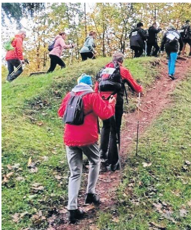
Trochę błota na górskich, leśnych ścieżkach było, ale nie tyle, żeby znacząco utrudnić wędrowkę.