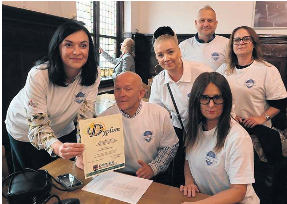
Radość zwycięzców. W Wałbrzychu powstanie „Biało-Niebieska Strefa Basketu”!

Zyskane dofinansowanie to 900 tys. zł. Zgodnie z głosowaniem mieszkańców, w tym z Podzamcza i Piaskowej Góry, trafi ono na nowoczesne, mobilne boiska sportowe. Młodzież i starsi będą mogli się kształcić dzięki tym fundu-