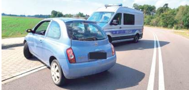
Auto zatrzymało się w zatoce autobusowej, po czym kierowca i pasażer osobówki zaczęli awanturować się ze znajdującą się tam kobietą

Gmina Biała Podlaska: Żołnierze 64 Batalionu Lekkiej Piechoty zwrócili uwagę na nietypowe zachowanie kierowcy. Nie mylili się. 30-latek był kompletnie pijany i – jak się później okazało – nie ma prawa siadać za kółko. Próbując uciekać, przejechał po stopie kolegi.