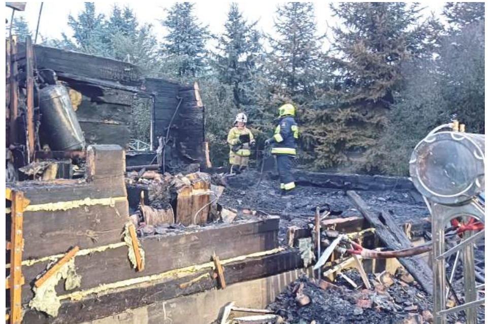
W wyniku pożaru drewnianego domu życie straciło dwóch mężczyzn: 81-latek i 52-latek

W nocy z 12 na 13 września doszło do dramatycznych wydarzeń w miejscowości Kuzawka w gminie Terespol (powiat bialski). W wyniku pożaru drewnianego domu życie straciło dwóch mężczyzn: 81-latek i 52-latek, najprawdopodobniej ojciec i syn.