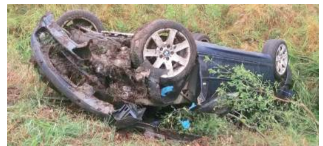
Samochód dachował i wylądował w przydrożnym rowie

Gmina Drelów: W miejscowości Szóstka w miniony czwartek, 11 września, doszło do wypadku drogowego.