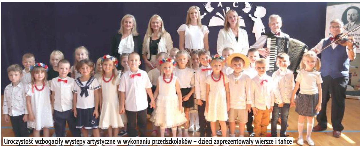
Uroczystość wzbogaciły występy artystyczne w wykonaniu przedszkolaków – dzieci zaprezentowały wiersze i tańce

Nowy rok szkolny 2025/2026 został uroczystie zainaugurowany w gminie Międzyrzec Podlaski. Gospodarzem tegorocznych obchodów była Publiczna Szkoła Podstawowa im. Kornela Makuszyńskiego w Rzeczychy, we współpracy z Przedszkolem im. Doroty Gellner.