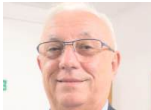
J były radny

Wzburzony prezydent na to zaatakował wnioskodawcę skargi: