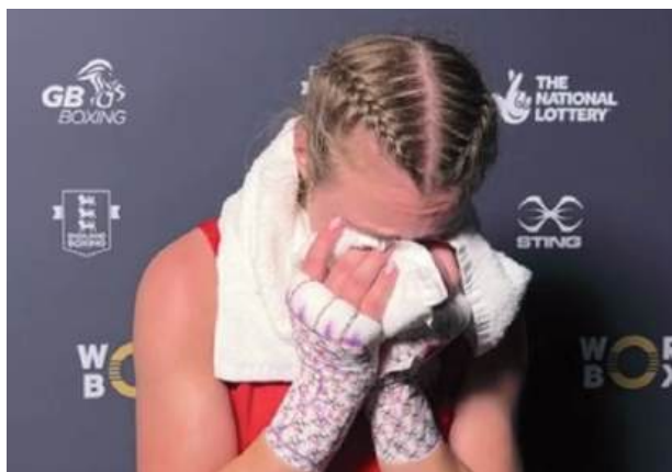
Pięściarka Paco Lublin była bardzo rozczarowana werdyktem sędziów. Trudni było jej powstrzymać emocje

Awans do najlepszej czwórki turnieju w kategorii 57 kg