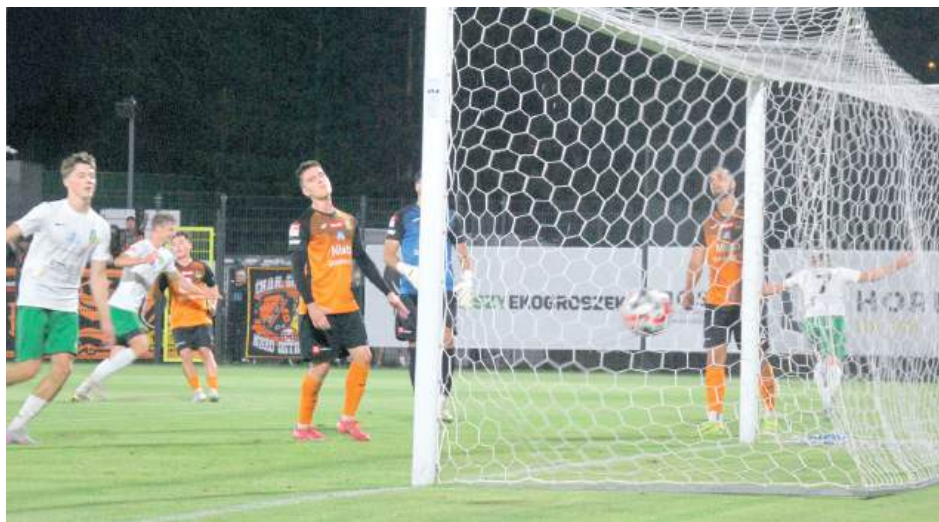
Zaczęło się pięknie. Po ostatnim gwizdku powody do radości mieli gracze gości