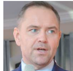
Karol Nawrocki prezydent RP

Jednocześnie śledczy zidentyfikowali wiadomość, jakoby rozważano przedstawienie zarzutu popełnienia przestępstwa dowódcy operacyjnemu sił zbrojnych, który miał podjąć