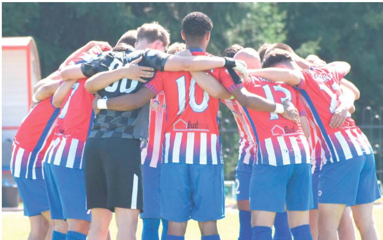
Huragan zajmuje obecnie ostatnie miejsce w tabeli. Jeśli sytuacja się nie poprawi, drużynę czeka spadek do klasy okręgowej

Dla zespołu z Międzyrzeca była to już szósta porażka z rzędu.