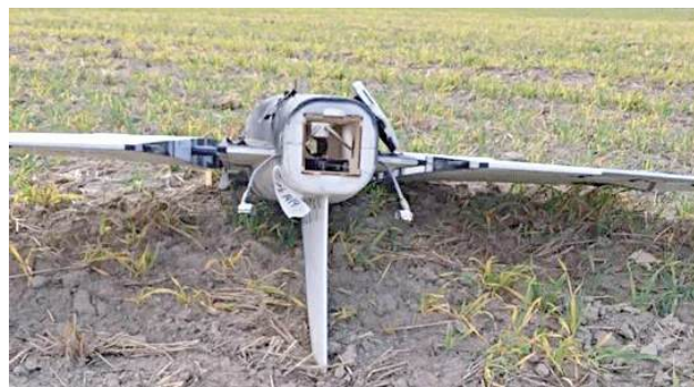
To dron, który spadł w Wohyniu

POW. RADZYŃSKI: Byliśmy w środę w Wohyniu, gdzie w godzinach porannych odkryto drona. Maszyna spadła na pole, ale w niedużej odległości od zabudowań. - Jestem zszokowany - mówi nam jeden z mieszkańców. Bohaterem internetu został za to właściciel wspomnianego pola.