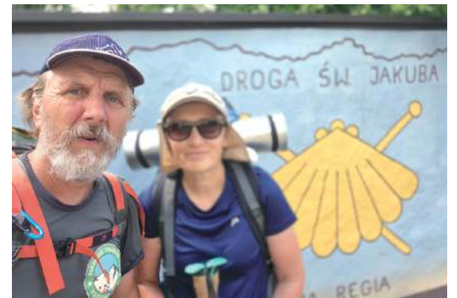
Puławianie wyruszyli z domu. Pierwszy etap swojej wędrowki Szlakiem Św. Jakuba zakończyli w Zgorzelcu, 970 km od Puław

To nie była łatwa droga. Prowadziła przez pola, wystawiała na próbę ludzkie ciało, ale i stawiała przed wędrowcami życzliwych ludzi. Para puławian stała oko w oko z dzikimi zwierzętami, z pokorą przyjmowała pogodę, by w ten sposób dotrzeć do celu. A to dopiero pierwszy etap ich wędrowki.