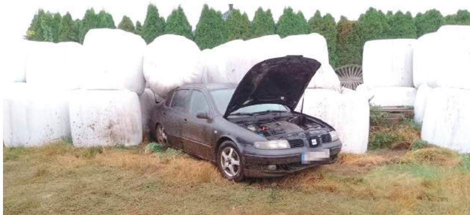
Kierujący Seatem Toledo, 29-letni mieszkaniec gminy Ulan-Majorat stracił panowanie nad pojazdem

Do zdarzenia doszło w czwartek (11 września) w miejscowości Stok, w gminie Ulan-Majorat.