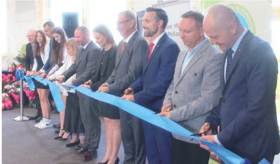
Ceremonia otwarcia sali sportowej w Zespole Szkół Ogólnokształcących nr 3 przy ul. Narutowicza.

Pod koniec sierpnia 2024 roku kolejne otwarcie ofert wykazało, że tym razem najtańsza oferta złożona przez konsorcjum