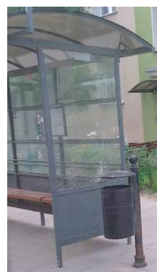
Do końca nie mogło być zbyt idealnie. Szyba została rozbita...

Miejscowi młodzi chuligani chcieli także przypomnieć