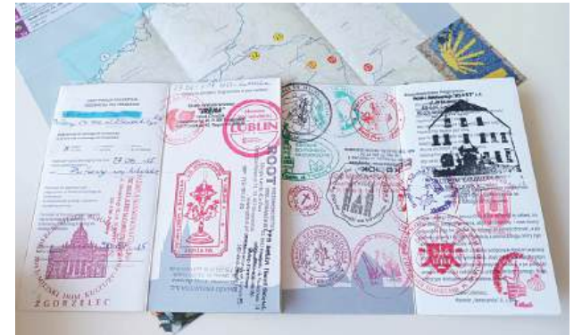
Puławianie przemierzali szlak Świętego Jakuba ze specjalnym paszportem, w którym zbierali pieczętki potwierdzające pobyt w danym miejscu, związanym z kultem jednego z apostołów