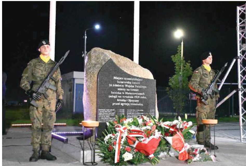
W obchodach udział wzięli m.in. przedstawiciele władz samorządowych, służb mundurowych, szkół i organizacji społecznych, a także licznie zgromadzeni mieszkańcy gminy

W tym roku mieszkańcy gminy Terespol, przedstawiciele władz i służb mundurowych, spotkali się, by oddać hołd bohaterom tamtych dni. Uroczystości rozpoczęły się syreną alarmową i dymem rac w barwach narodowych – symbolicznym przypomnieniem tragedii sprzed 86 lat. Po emisji filmu