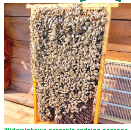
Widowiskowa pszczoła rodzina naszego Czytelnika z Lubartowa