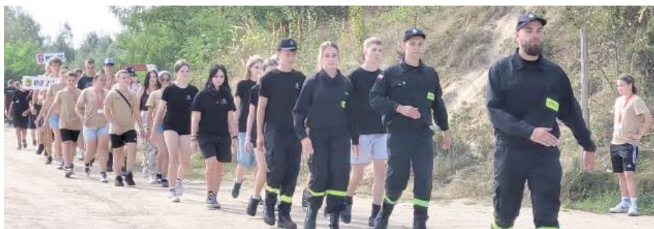
„Razem w Ogniu Przygody” to inicjatywa, która pozwala młodzieży rozwijać pasję, poznawać pracę służb i spędzać czas w ciekawy, bezpieczny sposób. Organizatorzy już zapowiadają kolejne spotkania w przyszłym roku

Na Międzyrzeczkich Jeziorkach 29 sierpnia odbyła się kolejna odsłona zmagania Młodzieżowych Drużyn Pożarniczych w ramach cyklu „Razem w ogniu przygody”. W wydarzeniu wzięło udział około 110 dzieci i 20 opiekunów z dziesięciu jednostek OSP z całego powiatu bialskiego.