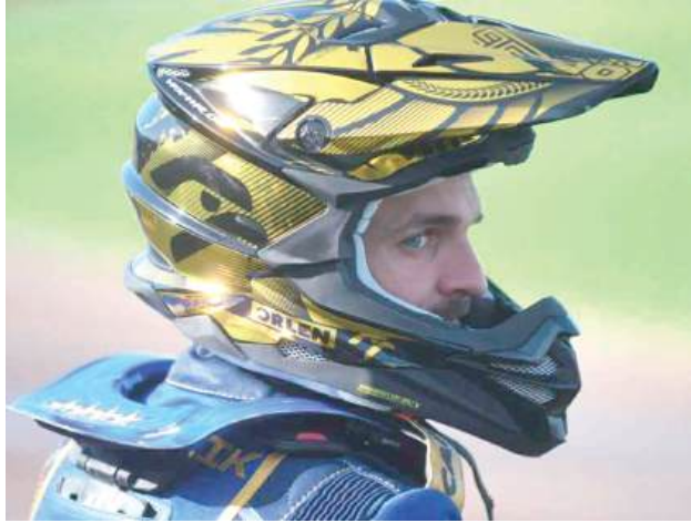
Znowu to zrobił! Bartosz Zmarzlik już po raz szósty został mistrzem świata na żuźlu!