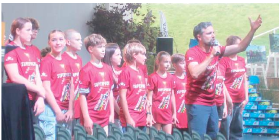
Prezydent szczególnie docenił dzieci i młodzież za jazdę po wspólny sukces. Na zdjęciu superpuchar i jego różne kopie, które trafiły do najofiarniejszych

Imponujące, bo już „kosmiczne” i nawet „galaktyczne” rozmiary, przybrało fetowanie nadzwyczajnego sukcesu Białej Podlaskiej, jakim było zdobycie Superpucharu Rowerowej Stolicy Polski. Rozdano najwytrwalszym rowerzystom tysiące koszulek, 40 rowerów, 94 kaski i wiele innych gadżetów oraz „królewskie” korony dla najaktywniejszych.