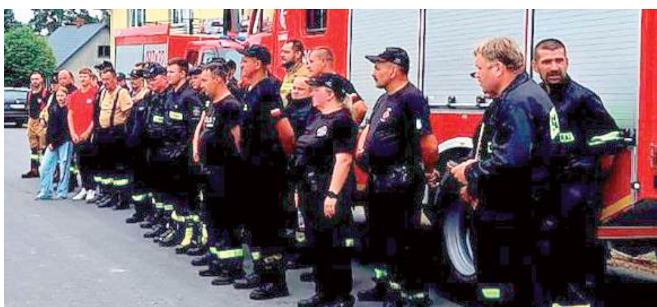
Policjanci natychmiast rozpoczęli szeroko zakrojone działania, w które zaangażowano również funkcjonariuszy Wydziału Poszukiwań i Identyfikacji Osób KWP w Lublinie, funkcjonariuszy Państwowej Straży Pożarnej w Opolu Lubelskim, druhów z okolicznych OSP oraz mieszkańców

POWIAT OPOLSKI: Dramatyczne poszukiwania 70-letniego mieszkańca Idalina (gmina Józefów nad Wisłą) zakończyły się szczęśliwie. Senior, który w sobotę, 6 września przed południem wyszedł z domu do lasu i nie wrócił do miejsca zamieszkania, został odnaleziony następnego dnia kilka kilometrów od domu.