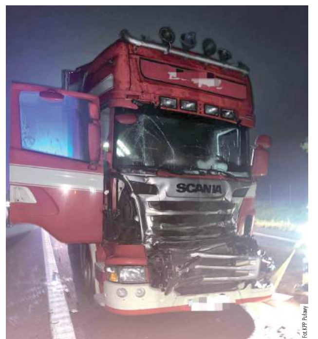
Kierowca osobówki jadący przed ciężarówkami nagle zaczął zawracać. W efekcie jego nieodpowiedzialnego manewru doszło do zderzenia dwóch samochodów dostawczych marki Scania

Policjanci ustalają szczegóły zdarzenia, w tym kierowcę samochodu osobowego, który zawracając na drodze ekspresowej popełnił wykroczenie - infor-