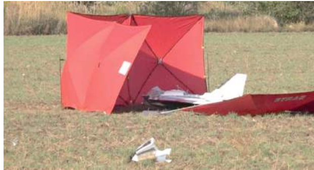
Wiatr powalił na ziemię fragment parawanu ochronnego i ukazał się kadłub drona z oderwanym od niego poza parawanem fragmentem

- Dziś w mojej miejscowości Czosnówka spadł dron – na szczęście upadł na pole, z dala od zabudowań i nikomu nic się nie stało. Te wydarzenia pokazują, jak blisko