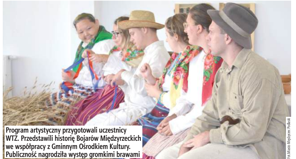
Program artystyczny przygotowali uczestnicy WTZ. Przedstawili historię Bojarów Międzyrzeczek w współpracy z Gminnym Ośrodkiem Kultury. Publiczność nagrodziła występ gromkimi brawami