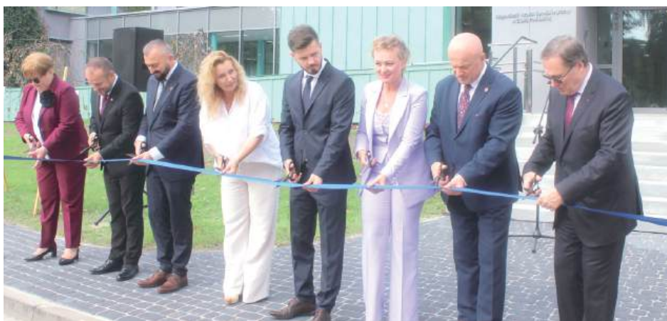
Cięcie wstęgi przed pawilonem opieki długoterminowej było częściowo skoordynowane

Uroczyste otwarcie w miniony piątek wybudowany za ok. 7 mln zł nowy pawilon opieki długoterminowej w Wojewódzkim Szpitalu Specjalistycznym w Białej Podlaskiej. Powstał w Zakładzie Opiekuńczo-Lecznym w Ośrodku „Domowy Szpital” przy ul. Spółdzielczej.