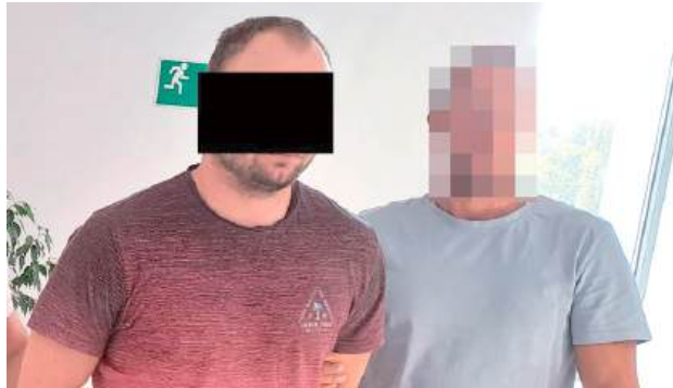
Obaj poszukiwani trafili do policyjnego aresztu. Zostaną doprowadzeni do jednostek penitencjarnych, gdzie odbędą zasądzone kar

Skuteczne działania funkcjonariuszy z Ryk zakończyły się zatrzymaniem dwóch mężczyzn, którzy ukrywali się przed wymiarem sprawiedliwości i unikali odbycia zasądzonych kar więzienia. 25-letni mieszkaniec Warszawy oraz 36-letni mieszkaniec powiatu ryckiego wpadli w ręce policjantów – pierwszy podczas legitymowania, a drugi dzięki pracy operacyjnej kryminalnych. 25-latek został