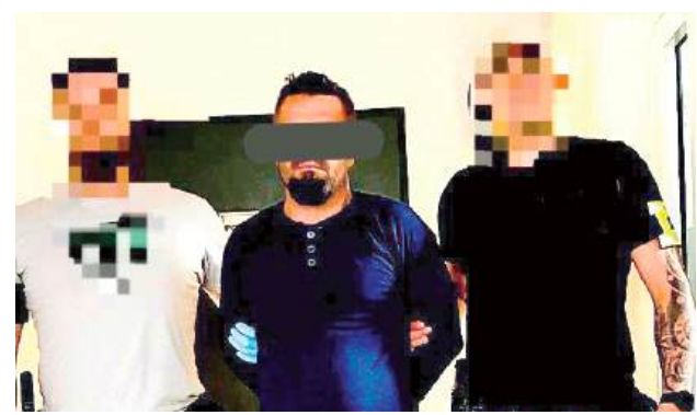
34-latek stanął przed sądem

Jest akt oskarżenia ws. 34-latka z powiatu parczewskiego, który miał znęcać się fizycznie i psychicznie nad swoją matką. Groził kobiecie zabójstwem poprzez wysadzenie w budynku butli z gazem.