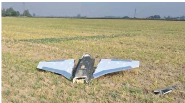
Jak wskazuje jeden z mieszkańców, maszyna spadła około 300 metrów od zabudowań

Hitem internetu w ostatnich dniach stała się natomiast rozmowa dziennikarza „Faktu” z mieszkańcem Wohynia. Pan