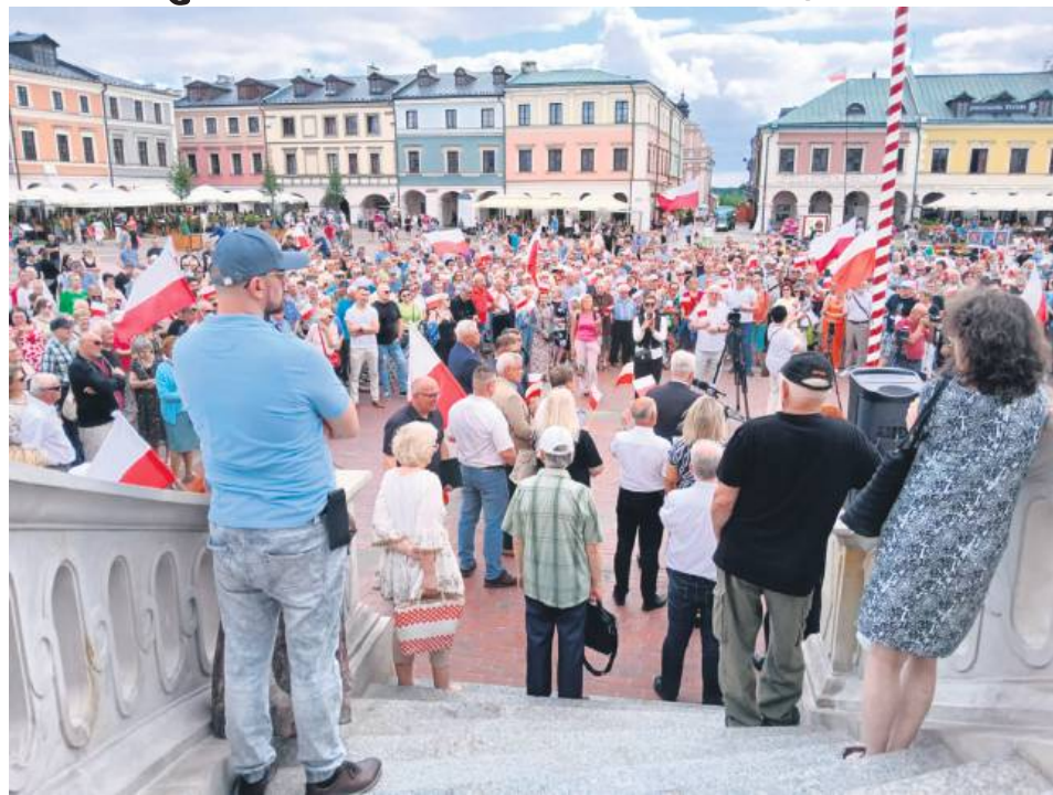
W pikiecie wzięło udział kilkaset osób.