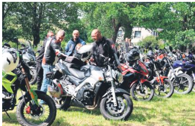
Zlot motocyklowy był częścią wydarzenia.