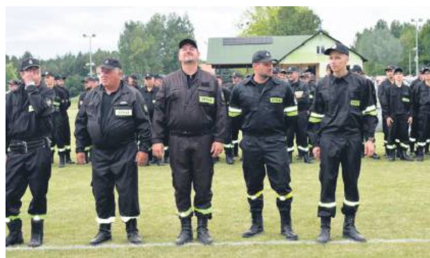
Druhowie rywalizowali o miano najlepszych w gminie.

Drużyny zmierzyły się w trzech konkurencjach: musztrze, sztafecie 7 x 50 metrów oraz ćwiczeniach bojowych. Zawody przeprowadzone zostały z zacho-