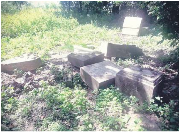
Na cmentarzu w Dobromierzycach przewrócono 15 nagrobków.

O dewastacji zawiadomiono władze gminy oraz właściciela cmentarza. Poinformowano również ukraiński konsulat w Lublinie ze względu na obecność nagrobków ukraińskich. W sumie zniszczono 14 nagrobków. Prawie wszystkie, poza jednym, mają napisy ukraińskie i rosyjskie.