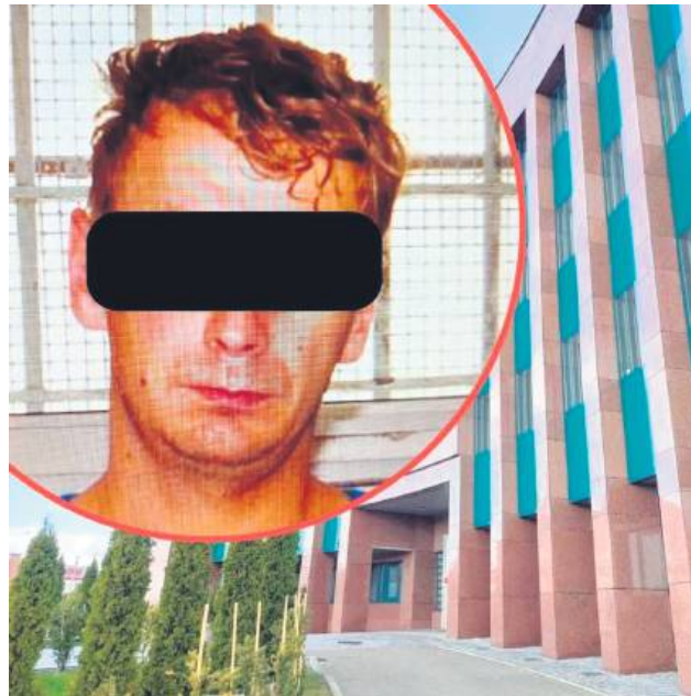
Sąd Okręgowy w Zamościu uznał mężczyznę za winnego wszystkich zarzucanych mu czynów.

Do tragedii doszło nad ranem 3 lipca 2024 roku. Bartłomiej B., dzielnym bratem, uderzył go siekierą podczas snu. Następnie zadał ciosy ojcu, który kłęczał i się modlił. Brat zginął na miejscu, ojciec zmarł dwa miesiące później w szpitalu. Po dokonaniu zbrodni Bartłomiej B. zadzwonił na policję i wskazał miejsce,