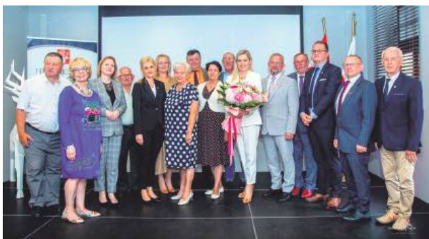
Burmistrz Hrubieszowa otrzymała wotum zaufania i absolutorium, jednak za trzy tygodnie mieszkańcy wezmą udział w referendum w sprawie odwołania jej oraz Rady Miejskiej.

Rada Miejska Hrubieszowa obradowała 27 czerwca. Podczas absolutorijnej sesji miejscy radni zapoznali się z Raportem o stanie Miasta Hrubieszowa za 2024 r. oraz ze sprawozdaniem z wykonania zeszłorocznego budżetu miasta. Raport jest