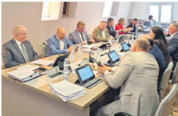
Sesja absolutoryjna odbyła się 25 czerwca.

Radni Rady Powiatu Tomaszowskiego udzielili zarządowi wotum zaufania i podjęli uchwałę w sprawie absolutorium z tytułu wykonania budżetu za 2024 rok. W trakcie sesji absolutoryjnej tylko jeden radny zgłosił zastrzeżenie do inwestycji. Chodzi o kort tenisowy.