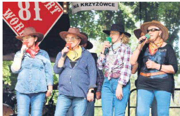
Na scenie królowała muzyka country.

Porosło, Madastone oraz Guitar Force, serwując publiczności solidną dawkę rockowego brzmienia. Niedziela, 29 czerwca, upłynęła pod znakiem rodzinnej atmosfery. Jedną z atrakcji była możliwość lepienia naczyń z gliny pod okiem instruktora z Pracowni Ceramicznej WARTO. Zarówno dzieci, jak i dorośli byli ciekawi tego rzemiosła. Dużym zainteresowaniem cieszyły się także stoiska Powiatowej Inspekcji Pracy w Lublinie oraz Nadleśnictwa Tomaszów