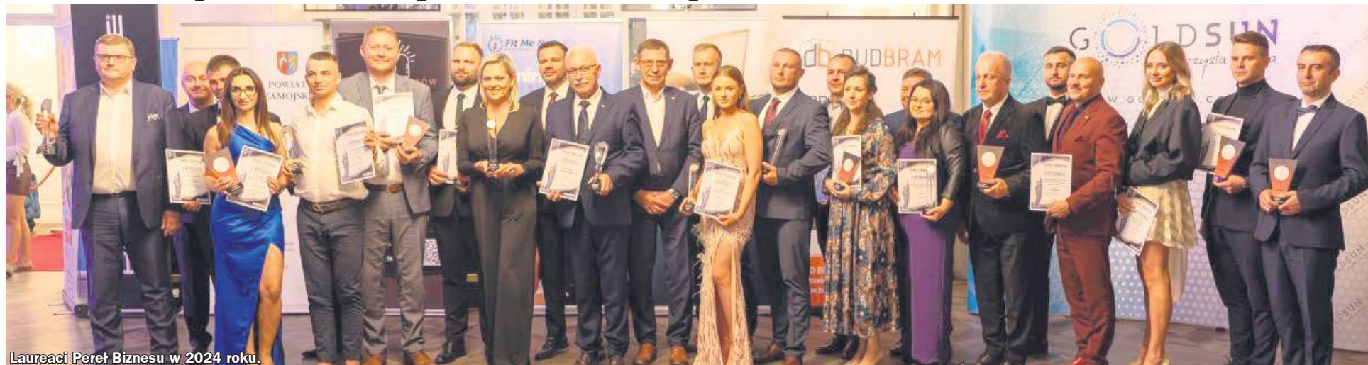
Laureaci Perły Biznesu w 2024 roku.