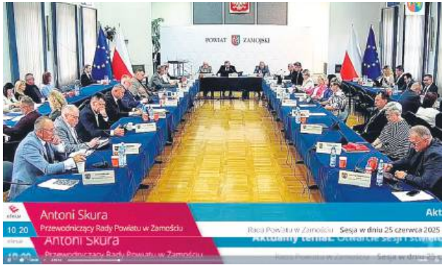
Absolutoryjna sesja Rady Powiatu w Zamościu odbyła się 25 czerwca.

W 2024 r. oddano do użytkowania 41,1 km nowej nawierzchni dróg powiatowych. Całkowity koszt inwestycji wyniósł ponad 71,8 mln zł (dofinansowanie zewnętrzne – 53,8 mln zł, budżety gmin – 7,4 mln zł, wkład własny – 10,5 mln zł). Dodatkowo Zarząd Dróg Powiatowych w Zamościu wykonał łącznie ok. 2,2 km nowej nawierzchni