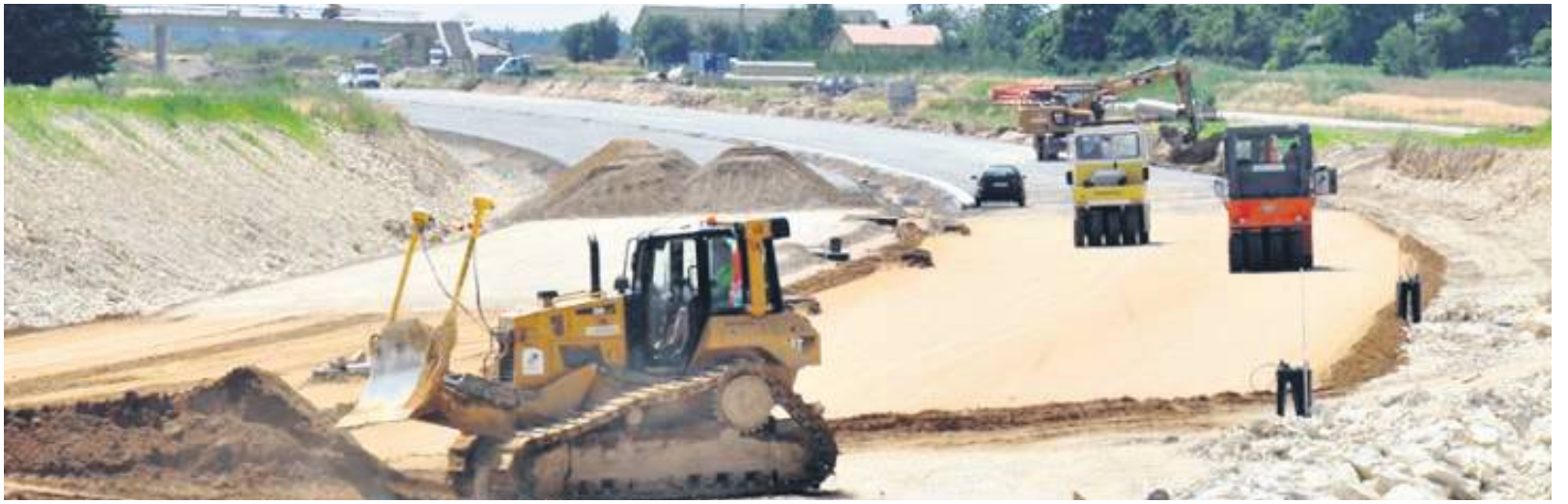
Inwestycja ma pochłonąć ponad 440 mln zł.

Nowy, 12,5-kilometrowy odcinek ekspresówki zostanie poprowadzony po wschodniej stronie obecnej DK17. Zacznie się na węźle Zamość Wschód (skrzyżowanie z DK74 w Jarosławcu), ominie Barchaczów i Łabunie, a zakończy się na węźle Zamość Południe w pobliżu Wólki Łabuńskiej (węzeł zlokalizowany będzie na skrzyżowaniu z drogą prowadzącą w kierunku miejscowości Tyszowce). – Na całej trasie