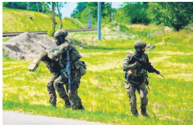
Uczestnicy ćwiczenia mieli wyznaczone zadania: ugaszenie pożaru (straż pożarna), uruchomienie Kontenerowej Elektrowni Polowej (19NBOT), zabezpieczenie miejsca zdarzenia (policja) oraz neutralizacja i zniszczenie grup dywersyjnych (19 NBOT, 2 PR oraz SG).