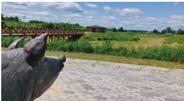
Legendarny wieprz patrzy na wyschnięte jezioro.

Wieprzów jest jedną z najstarszych miejscowości w gminie Tarnawatka. Nazwa wsi pochodzi od rzeki Wieprz, której źródło wypływa z położonego w środku wsi Wieprzowego Jeziora. O miejscu krąży legenda, a na jej pamiętkę w Wieprzowie stoi pomnik wieprza – bohatera tej opowieści. Według niej przed wielu laty pewien niesforny wieprz uciekł gospodarzowi z zagrody. Na wolności oddał się swojemu ulubionemu zajęciu, czyli ryciu