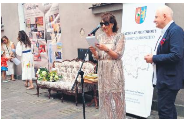
Prof. Lech Majewski dołączył do zasłużonych postaci dla miasta, odsłaniając 27 czerwca swoją tablicę w słynnej zamojskiej Alei Sław.

Nazwisko kandydata do zamojskiej Alei Sław ogłoszono 19 maja. – W roku jubileuszu 80-lecia Państwowego Liceum Sztuk Plastycznych im. Bernardo Moranda w Zamościu bohaterem 18. edycji wydarzenia będzie absolwent tej szkoły, prof. Lech Majewski – zakomunikowała