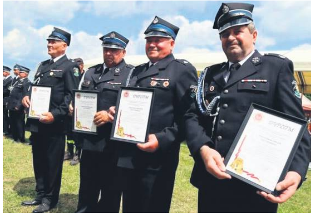
Pięciu druhów z Ubrodowic odznaczono „Medalami za Zasługi dla Pożarnictwa”, a dziewiętnastu strażaków uhonorowano odznakami „Za wysługę lat”.