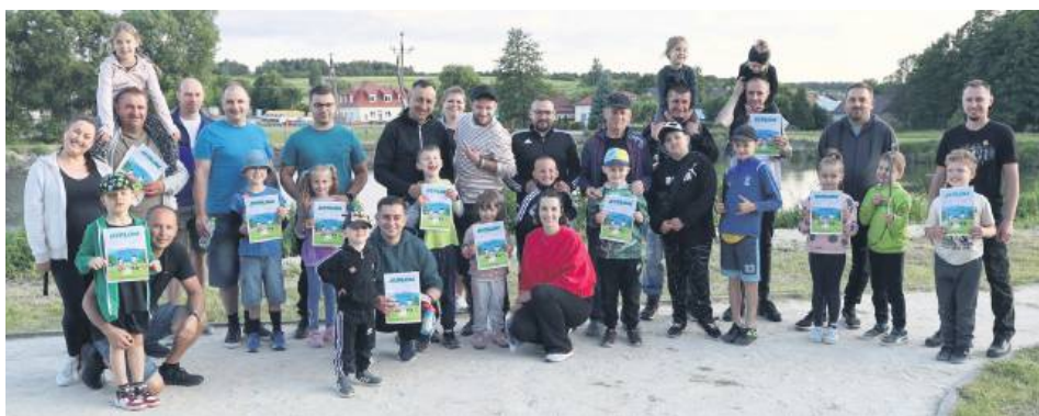
Po grze terenowej było wspólne grillowanie.

Nad zbiornikiem wodnym Zagóra w Bełżcu odbyła się druga edycja Pikniku z Tatą. Współorganizowany przez Gminny Ośrodek Pomocy Społecznej w Bełżcu piknik okazał się prawdziwym świętem rodzinnej integracji, dobrej zabawy i wspólnego spędzania czasu na świeżym powietrzu.