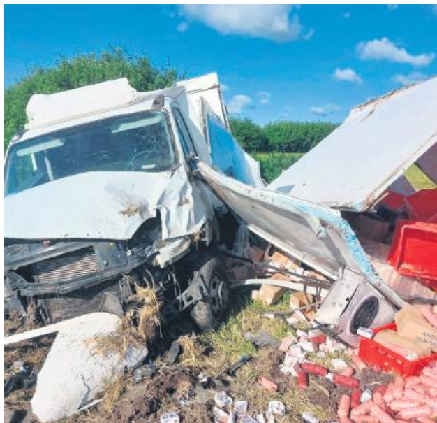
Ciężarówka przewróciła się na DK17. Kierowca miał dużo szczęścia.