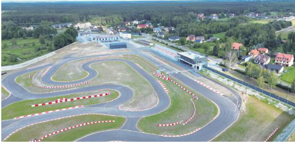
Autodrom jest jednym z najnowocześniejszych torów.

– Autodrom wraz z infrastrukturą towarzyszącą to wielka szansa dla rozwoju gospodarczego, nie tylko miasta Biłgoraja, ale całego powiatu. Dotyczy to zarówno sfery sportów motorowych, a przez to promocji naszego regionu w kraju i poza jego granicami, jak i kwestii gospodarczych. Do użytku oddaliśmy dziś perełkę motoryzacyjną, jeden z najlepszych