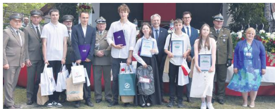
Zwycięzcy powiatowego konkursu.

cmentarzach Zamojszczyzny. Ich tragiczny los podzieliła także ludność cywilna okolicznych wsi. Wspólnie wstawiamy do apelu poległych, aby oddać cześć polskim patriotom i bohaterom, którzy swym czynem, nieugiętą wolą walki i najwyższym poświęceniem dali świadectwo umiłowania ojczyzny oraz niezwykłej odwagi w wypełnianiu żołnierskiej przysięgi – mówił. Wójt zaznaczył, że ci, którzy pozostali w Osuchach, na zawsze będą symbolem wierności ideałom w imię wspólnego dobra oraz nauką patriotyzmu dla wszystkich, którym bliska jest suwerenność Polski.