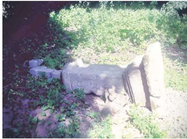
Policjanci ustalają, kto dopuścił się tej dewastacji.