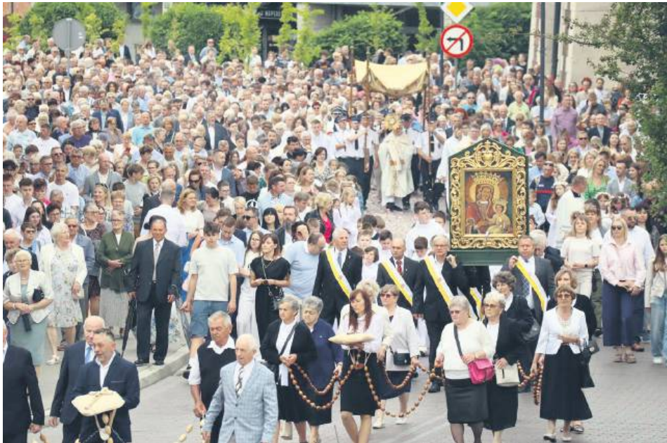
Procesja Bożego Ciała w Zamościu.

Jeśli chodzi o frekwencję, to zdecydowanym liderem w całej diecezji zamojsko-lubaczowskiej jest Horyniec-Zdrój. Jak wynika z opracowania księdza Zygmunta Jagielto , opublikowanego w tegorocznym „Zamojskim Informatorze Diecezjalnym”, wspomniana parafia liczy 2 100 wiernych, a 13 października ubiegłego roku do kościoła poszło aż 1 970 z nich, co daje 93,80 proc.! Pamiętajmy jednak, że Horyniec-Zdrój to znane w całej Polsce uzdrowisko i można