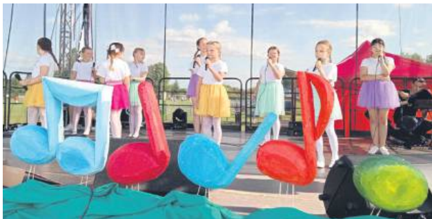
II Powiatowy Konkurs Piosenki Wakacyjnej „Łaszczowskie Nutki”.

Od 20 do 22 czerwca miasto Łaszczów obchodziło swoje święto. W piątek, pierwszego dnia, młodzi mieszkańcy i goście wzięli udział w grze miejskiej przygotowanej przez Liceum Ogólnokształcące w Łaszczowie. Uczestnicy wyruszyli w teren, rozwiązywali zagadki i odkrywali lokalne tajemnice. Na zakończenie gry odbyło się losowanie nagród i upominków, które wręczył