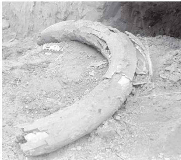
Mamuci kiel wydobyto z ziemi na jednej z posesji na przedmieściach Hrubieszowa. Co stało się z nim potem – nie wiadomo.

Cz erpak Zamojski, publikowany przez Książnicę Zamojską, poinformował niedawno, że na początku lipca 1980 r., na przedmieściach Hrubieszowa, podczas prac ziemnych natrafiono na kiel mamuta. Z ziemi wydobyli go tamtejsi strażacy. Mamuci cios ważył 70 kg i miał 165 cm długości. Został znaleziony zupełnie przypadkowo podczas kopania rowu melioracyjnego, na głębokości około 1,80 m „przy drodze (z Hrubieszowa) na Gródek, za torami”. Operator koparki zgłosił znalezisko strażakom – Stanisławowi Let-