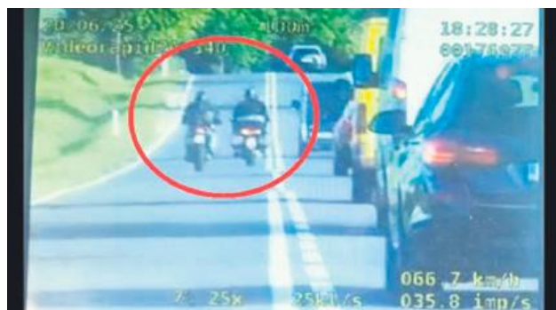
Wysokimi mandatami zakończyła się brawurowa jazda dwóch motocyklistów na DK 17.

Policjanci z tomaszowskiej drogówki zatrzymali dwóch motocyklistów – 49-latkę z Gdańska oraz 39-latkę z Płocka. Mężczyźni, kierując motocyklami marki BMW na DK 17