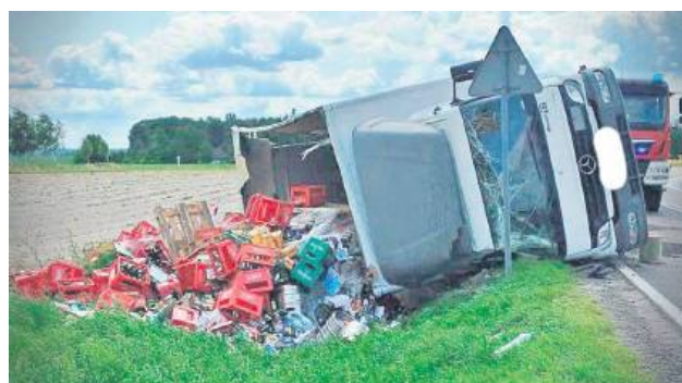
W wyniku kolizji w Alojzowie straty wyniosły ponad 200 tys. zł, a kierowca ciężarówki został ukarany mandatem w wysokości 1,1 tys. zł oraz 10 punktami karnymi.

Kierowca ciężarówki, 39-latek z Chełma, najpewniej jechał zbyt szybko i na zakręcie w Alojzowie (gmina Werbkowice) stracił panowanie nad dostawczym mercedesem. Samochód przewożący butelkowane piwo zjechał na pobocze i przewrócił się na bok. Część skrzynek z piwem wypadła na zewnątrz, a przewożone w nich butelki potłukły się. Straty oszacowano na ponad 200 tys. zł.