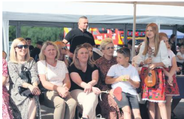
Na uczestników Dni Łaszczowa czekała świetna zabawa.