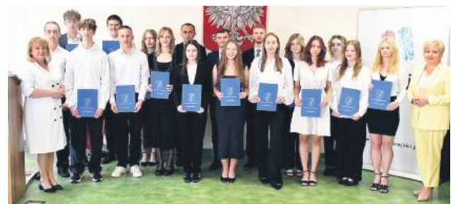
Uczniowie I LO im. ONZ.