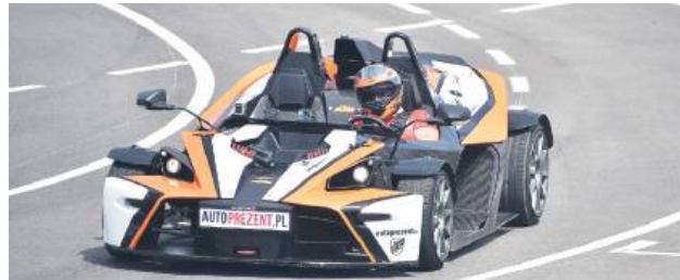
Podczas wydarzenia organizatorzy przewidzieli m.in. pokazy jazdy po torze.