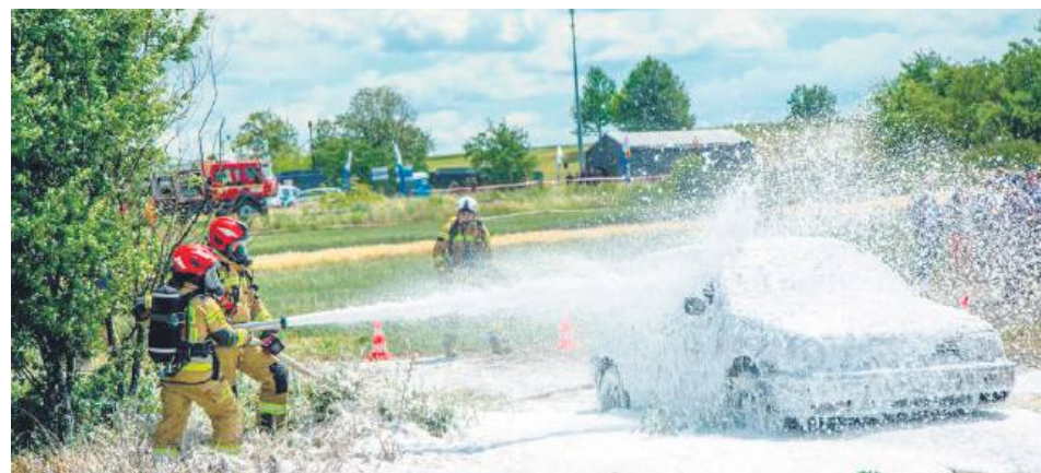
Jednym z zadań było ugaszenie pożaru.