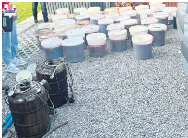
Próbki zabezpieczonej cieczy policjanci przekazali do dalszych badań.

I podsumowuje: – W sumie zabezpieczonych zostało około 2000 litrów alkoholu oraz inne elementy niezbędne do jego produkcji. Próbkę zabezpieczonej cieczy policjanci przekazali do dalszych badań. Dzięki sprawnie