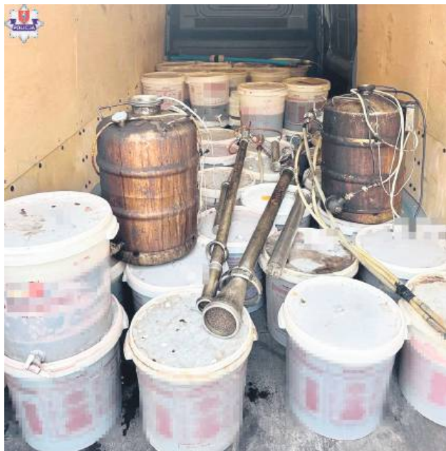
Policjanci zabezpieczyli w bimbrowni prawie 2000 litrów alkoholu.