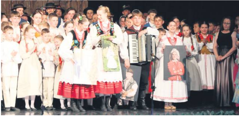
45 lat to piękna rocznica. Zespół Folklorystyczny „Roztocze” świętował na deskach Tomaszowskiego Domu Kultury.