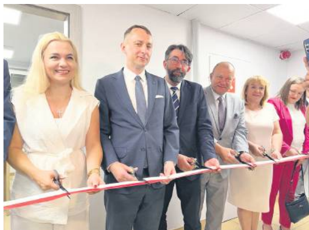
Wniosek o paszport można już złożyć w Biłgoraju.

Biuro znajduje się na trzecim piętrze i czynne będzie od poniedziałku do piątku w godzinach 8:00-12:00. Prace nad jego utworzeniem rozpoczęły się jeszcze w 2024 roku. Nowy punkt to znaczące ułatwienie dla mieszkańców całego regionu, którzy do tej pory musieli korzystać z punktów w innych miastach województwa.