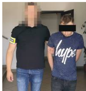
32-latek z gm. Tomaszów Lubelski odpowie za kradzież pieniędzy.

Policjanci z Wydziału Kryminalnego Komendy Powiatowej Policji w Tomaszowie Lubelskim zatrzymali 32-letniego mieszkańca gminy Tomaszów Lubelski, podejrzanego o kradzież pieniędzy z namiotu na terenie ośrodka wczasowego.