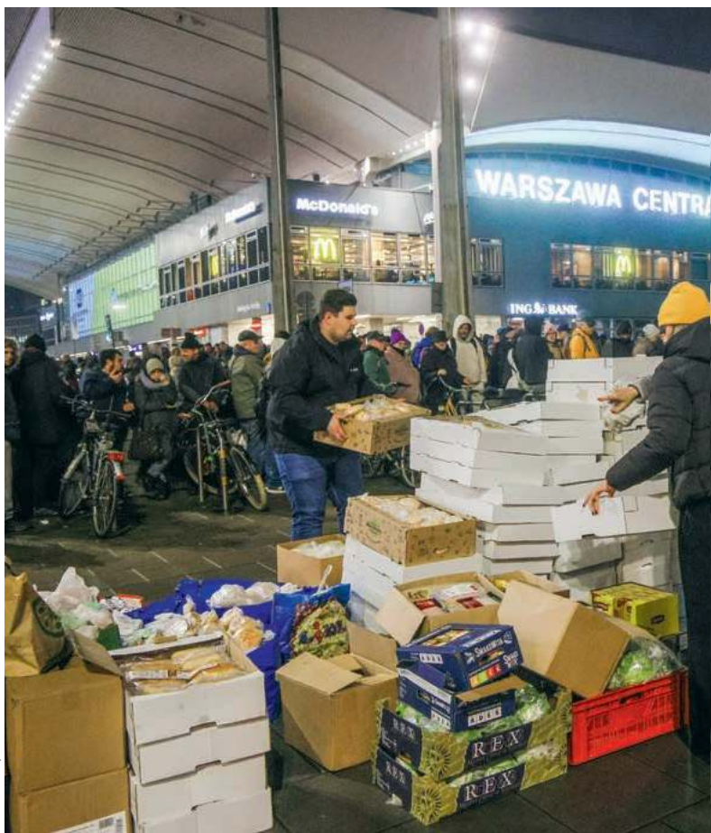
RAFAŁ GUZ / PAP