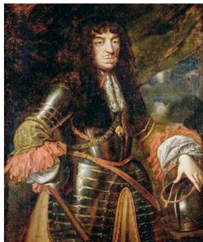
Jan Kazimierz Waza pędzla Daniela Schultza

rzezi; rokoszanie wyszukiwali zwłaszcza cudzoziemców służących w szeregach królewskich. Wtedy powstał wierszyk: „Siecz Francuzów, siecz, wyostrzywszy miecz / Bij Francuzów, bij, wziąwszy dobry kij / Wal Francuzów, wal, wbiwszy ich na pal / Męcz Francuzów, męcz, a jak możesz – dręcz”.