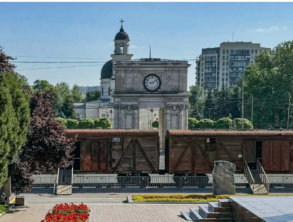
Sowieckie wagony przed siedzibą mołdawskiego rządu w wystawę o represjach w czasach komunizmu. Kiszyniów, 16 czerwca 2026 r.

obywateli Mołdawii. Ściągają do stolicy ludzie z wszystkich zakątków kraju.