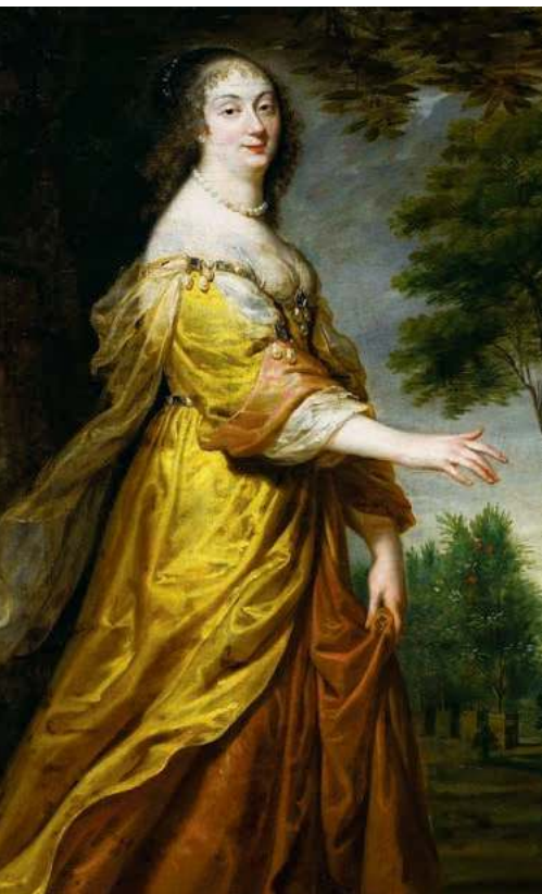
Maria Ludwika Gonzaga, obraz Justusa van Egmonta z 1645 r.

Ludwik XIV nie zamierzał jednak zbyt długo finansować armii Jana Kazimierza. Król, prowadzący 11 tys. ludzki wojska koronnego i 6 tys. litewskiego, dążył więc do ostatecznej konfrontacji z Lubomirskim, który miał 12 tys. żołnierzy.