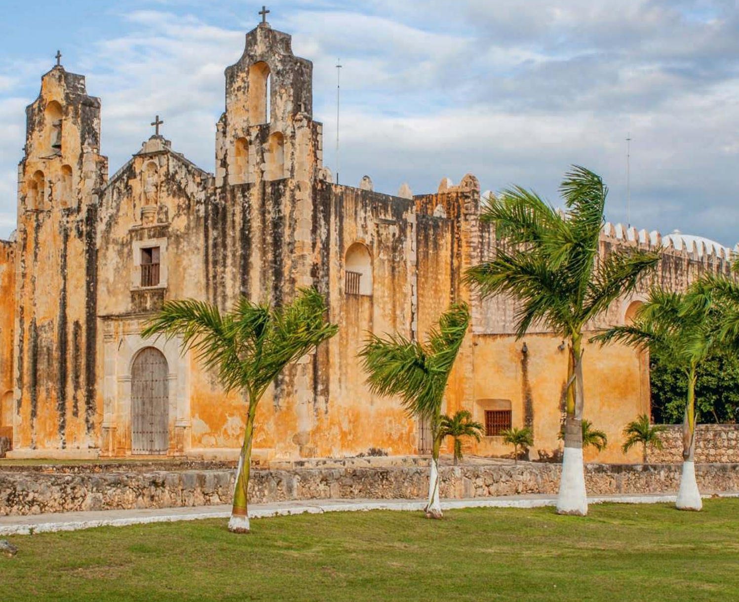
Kościół pofranciszkański z XVI w., Maní

techezę, a potem wybieramy się na spacer i regionalny obiad, wyśmienite poc chuc – wieprzowinę marynowaną w cytrusach i upieczoną na grillu.