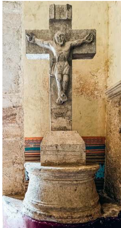
„Jezus ma niski wzrost, płaskie czoło, co w tradycji Majów jest szczególnie piękne”. Krucyfiks w kościele w Maní.

rolnictwo ekologiczne z tradycyjnymi metodami upraw Majów. Konkretnie, od młodości pracuje w szkole rolniczej U Yits Ka'an (Rosa, który spada z nieba) na obrzeżach Maní.