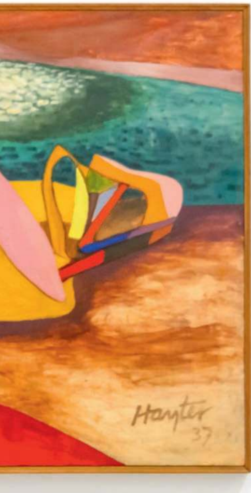
Na wystawie „Jesteś w sercu zmian. Surrealizm i antyfaszyzm” w Muzeum Sztuki Nowoczesnej w Warszawie. W tle obraz Stanleya Williama Haytera „Krajobraz ludożerczy”, 1937 r.

trójwymiarowo litery H. Wrażenie dziwne, alienujące, zwłaszcza w tle stalowych blatów i stołków barowych.