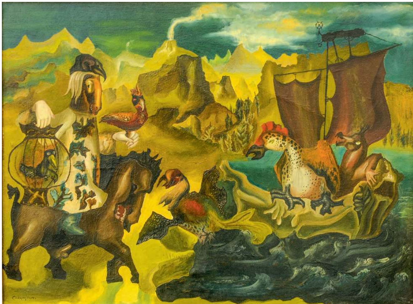
Leonora Carrington, „Arka Noego”, ok. 1938, kolekcja prywatna

→ kobiecą histerią. W przedziwny sposób splatało się to z kultem wszystkiego, co zagadkowe, zawieszony w prawie do bytu, odpowiadające, zwykle przypadkiem, tajemnym pragnieniom podmiotu.