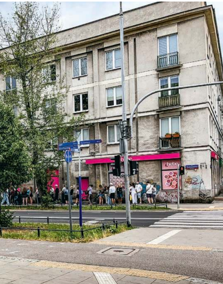
Kolejka po drożdżówki. Warszawa, lipiec 2026 r.