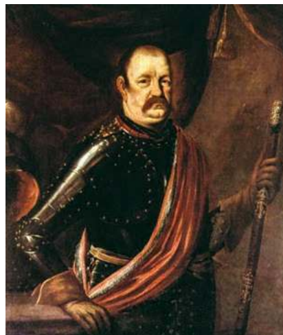
Jerzy Sebastian Lubomirski, ok. 1667 r., obraz Jana de Herdta

Na słoczonych po przeprowie królewskich dragonów i trzy pułki jazdy spadła nagle szarża rokoszan. Walka nie trwała dłużej niż pół godziny. Później doszło do