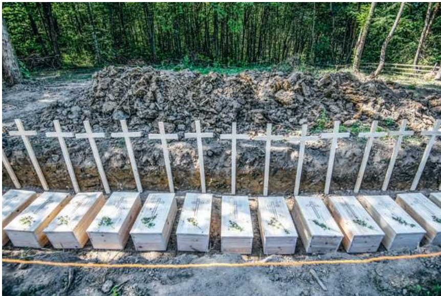
VLADYSLAV MUSTIENKO / PAP

Pogrzeb ekshumowanych szczątków polskich ofiar zbrodni wołyńskiej na terenie dawnej wsi Puźniki w dzisiejszym obwodzie tarnopolskim. Puźniki, Ukraina, 6 września 2025 r.