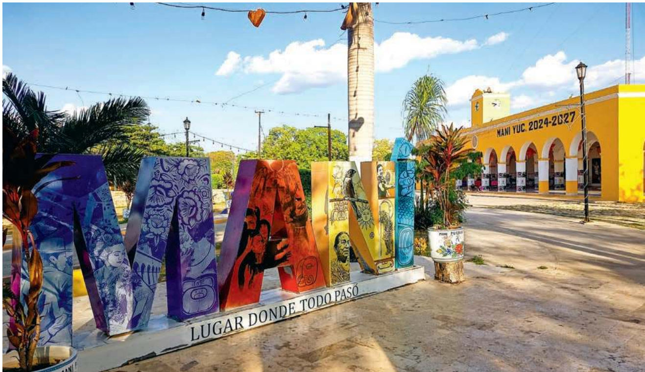
Główny plac w Maní