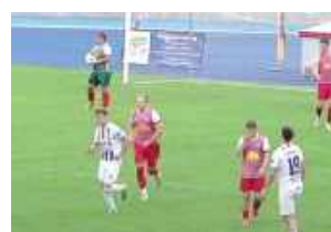
Gracze Opolanina żegnają się z IV ligą

Zapowiadają się spore zmiany w zespole. Co dalej?