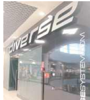
Taki widok zastaną kupujący, którzy chcieliby zrobić zakupy w sklepie Diverse w Galerii Zielonej w Puławach

Czy pomieszczenie przechodzi remont i sklep zostanie otwarty ponownie? Czy może Diverse wyprowadza się z Galerii Zielonej i będziemy mieli do dyspozycji tylko jeden sklep tej marki w Centrum Handlowym „Karuzela” na ul. Dęblińskiej?