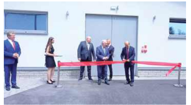
Jubileusz był także okazją do oficjalnego otwarcia nowo wybudowanej zwierzątarni

Ważnym momentem dla Instytutu była przeprowadzona w tym roku restrukturyzacja,