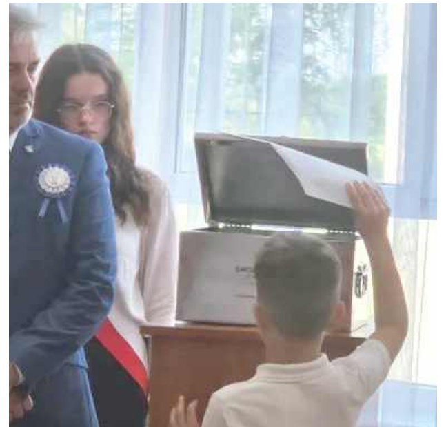
Do kapsuły czasu uczniowie włożyli m.in. pamiątkowe zdjęcia byłych i obecnych uczniów, nauczycieli, teksty przemówień, a nawet tygodniowy jadłospis szkolnej stołówki.