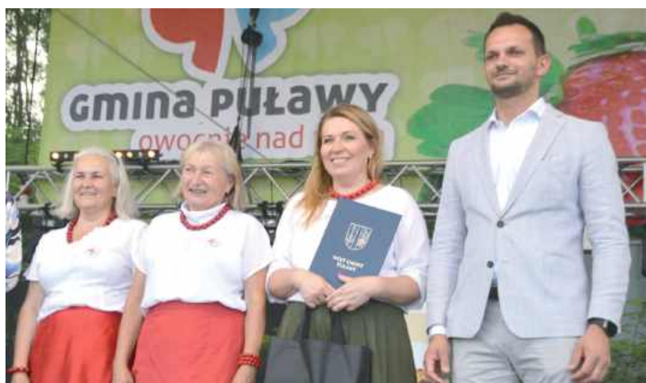
Konkursy rozstrzygane w czasie „Truskawkobrania” to już tradycja tej gminnej imprezy

Organizatorzy – Gmina Puławy – zapraszają wszystkich lokalnych pasjonatów gotowania do udziału w rywalizacji, której bohaterką jest niekwestionowana królowa owoców – truskawka. Do konkursu mogą zgłosić się mieszkańcy gminy, a forma potrawy jest niemal nieograniczona: liczą się zarówno klasyczne dzemy i konfitury, jak i ciasta, desery, pierogi czy