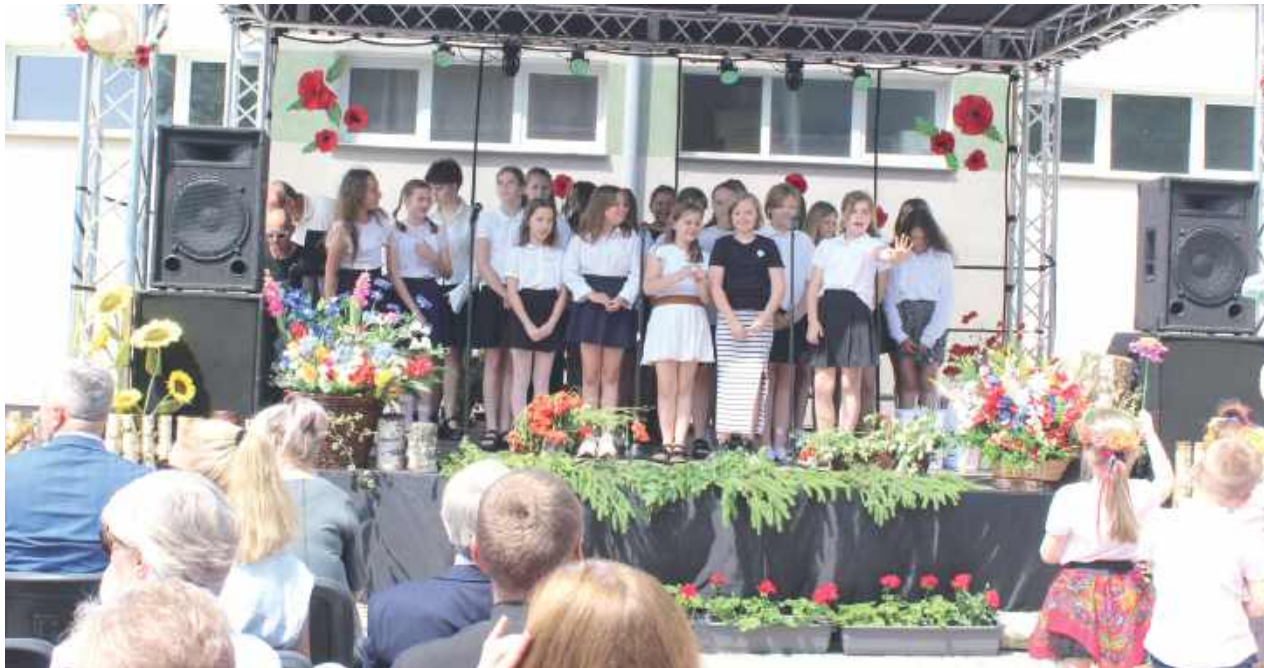
Część oficjalną zakończyło wspólnie odśpiewanie przez młodzież szkoły piosenki z repertuaru Blue Café - „Zapamiętaj”