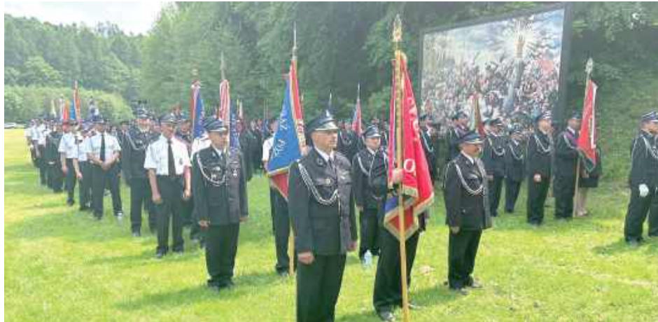
W tym roku w uroczystościach w Kębłę wzięło udział 50 jednostek OSP z ośmiu powiatów