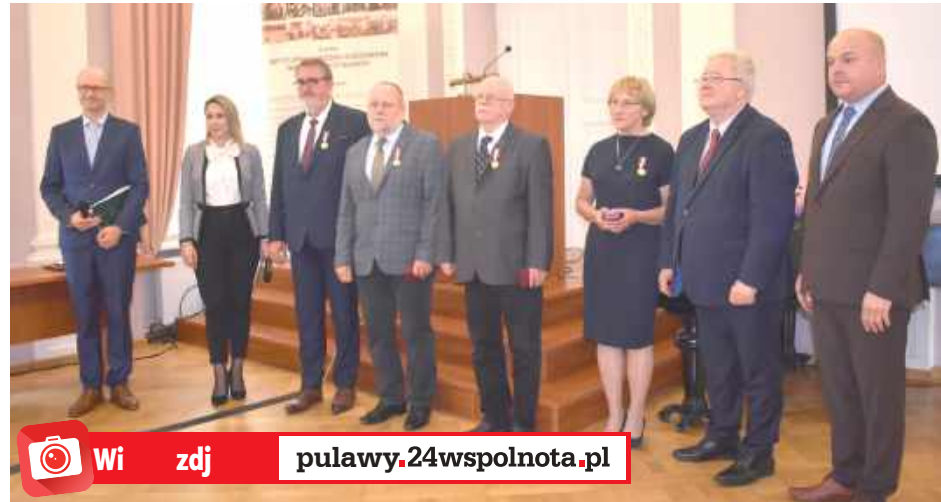
Uroczystość 75-lecia IUNG była także okazją do wręczenia odznaczeń dla pracowników. Aktu dekoracji dokonał Minister Rolnictwa i Rozwoju Wsi Czesław Siekierski (drugi z prawej)

W uroczystościach wzięł udział Minister Rolnictwa i Rozwoju Wsi Czesław Siekierski, który wręczył pracownikom instytucji odznaczenia za Długoletnią Służbę i „Zasłużony dla Rolnictwa”. Gratulacje na ręce dyrektora złożyli przedstawiciele wielu podmiotów, z którymi IUNG współpracuje.