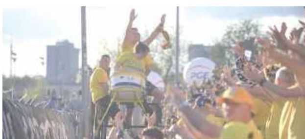
Kibice podkreślają, że trybuny obiektu przy Al. Zygmunto-wskich wypełniają się co mecz, a żużlowy mistrz Polski z Lublina skutecznie promuje miasto w całym kraju

O niepokoju i narastającym poczuciu frustracji piszą do prezydenta Krzysztofa Żuka przedstawiciele Stowarzyszenia Lubelskich Kibiców Speedway Euphoria. Kibice Orlen OIL Motoru Lublin domagają się nowoczesnego stadionu.