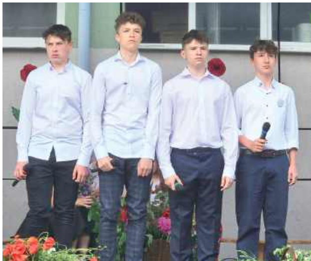
Uczniowie w trakcie występu na szkolnej akademii