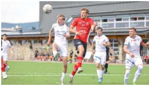
Lubartowianie zakończyli przygodę z III ligą spotkaniem z Podhalem. Przegrali 0:4