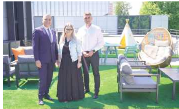
Nowocześnie zaaranżowana przestrzeń dostarczy wielu radosnych chwil zarówno dzieciom jak i dorosłym.

poparcie wśród mieszkańców – głos oddało aż 621 osób. Nowa przestrzeń zachwyca aranżacją: wygodne fotele, kanapy i leżaki zachęcają do zanurzenia się w lekturze, a otoczenie żywych roślin i zabawki dla najmłodszych sprawiają, że to miejsce jest idealne zarówno dla dorosłych, jak i rodzin z dziećmi. Całoci do-