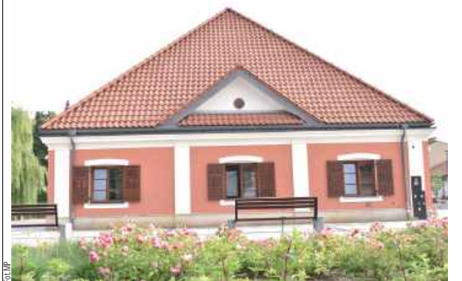
Oba lokale, które chce wynająć Gmina Końskowola znajdują się na parterze wyremontowanego ratusza w centrum miejscowości

Gmina Końskowola chce wynająć dwa lokale w miejscowym Ratuszu. Jeden jest przeznaczony pod kawiarnię, drugi pod sklep.