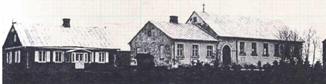
Przedwojenne zdjęcie kościoła protestanckiego w Cycowie wraz z przylegającym do niego budynkiem parafialnej szkoły i mieszkanie pastora

O puszczony kościółek, który kiedyś był cerkwią unicką, a potem prawosławną. Ewangelicki dom modlitwy, który był też szkołą, magazynem i wiejskim domem kultury.