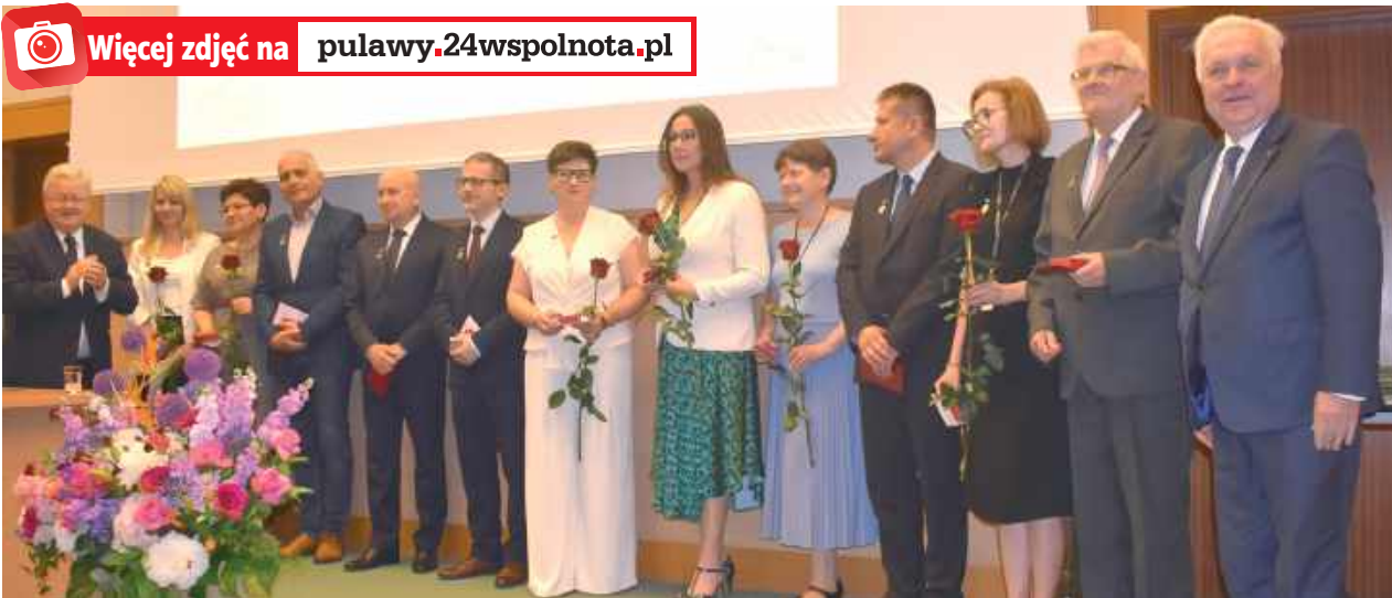
Minister Rolnictwa Czesław Siekierski wręczył 14 pracownikom PIWet odznaczenia „Zasłużony dla Rolnictwa”

80-lecie Państwowego Instytutu Weterynaryjnego zgromadziło wielu znamienitych gości - przedstawicieli władz państwowych, samorządowców czy instytucji na co dzień współpracujących z PIWet-em. Było również okazją do wręczenia odznaczeń od prezydenta RP, resortowych oraz dyplomów dla długoletnich pracowników Instytutu.