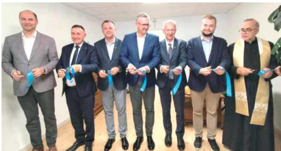
W biurze będą dyżurować poseł Kazimierz Choma, poseł Michał Moskal oraz senator Stanisław Gogacz

W poniedziałek, 15 września w Opolu Lubelskim odbyło się uroczyste otwarcie Biura Senatorsko-Poselskiego parlamentarzystów PiS przy ul. Kościuszki 10A.