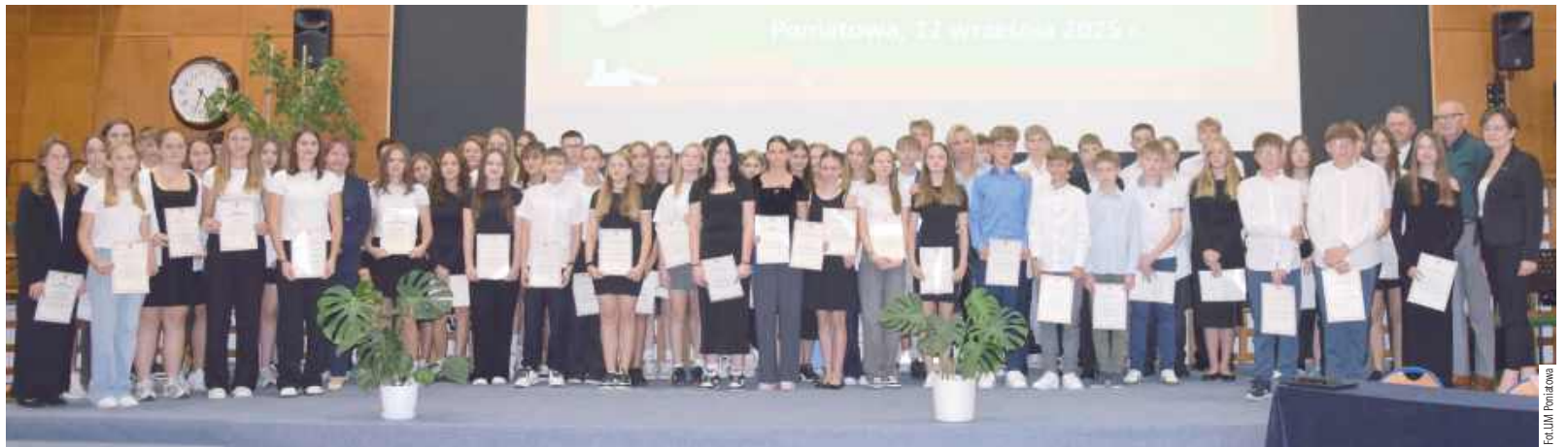
W gronie stypendystów znalazło się kilkudziesięciu uczniów m.in. ze Szkoły Podstawowej im. Stefana Żeromskiego w Poniatowej, ze szkół w Niezabitowie, Kowali, Kraczewicach, Poniatowej Kolonii oraz ze Społecznej Szkoły Podstawowej w Dąbrowie Wronowskiej