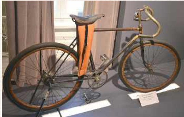
Rower wystawiany w Muzeum Augusta Zamoyskiego w Jabłoni, na którym artysta przejechał z Paryża do Zakopanego, ale pochodzi z tej samej firmy i nieznacznie się od niego różni

August Zamoyski każdą okazję do wykazania się tężyzną fizyczną, narobienia wokół siebie dużo zamieszania i dobrej zabawy wital z wielkim entuzjazmem.