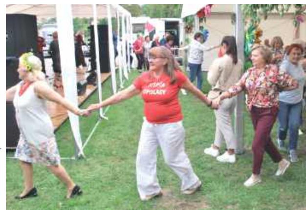
Wydarzenie miało charakter wspólnej biesiady. Nie obyło się więc bez tańców!

Gastronomicznego z Zespołu Szkół Zawodowych w Opolu Lubelskim zadbał o ciepłe dania, a gospodynie z Karczmisk uraczyły uczestników słodkimi wypiekami oraz regionalnym specjałem – pierogami z bobu, które szybko zniknęły ze stołów.