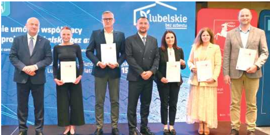
W wydarzeniu uczestniczyli przedstawiciele gmin z całego regionu, w tym liczna reprezentacja powiatu opolskiego

Spotkanie było pierwszym krokiem do realizacji dużego regionalnego projektu pn. „Lubelskie bez azbestu”, który ma na celu ochronę zdrowia mieszkańców i środowiska naturalnego poprzez usunięcie rakotwórczego eter-