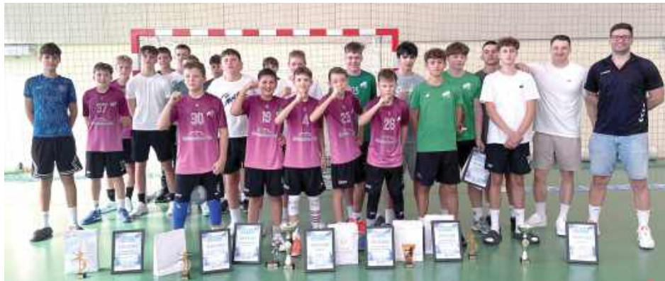
Mistrzowie i wicemistrzowie ze Szczypiorniaka Puławy!