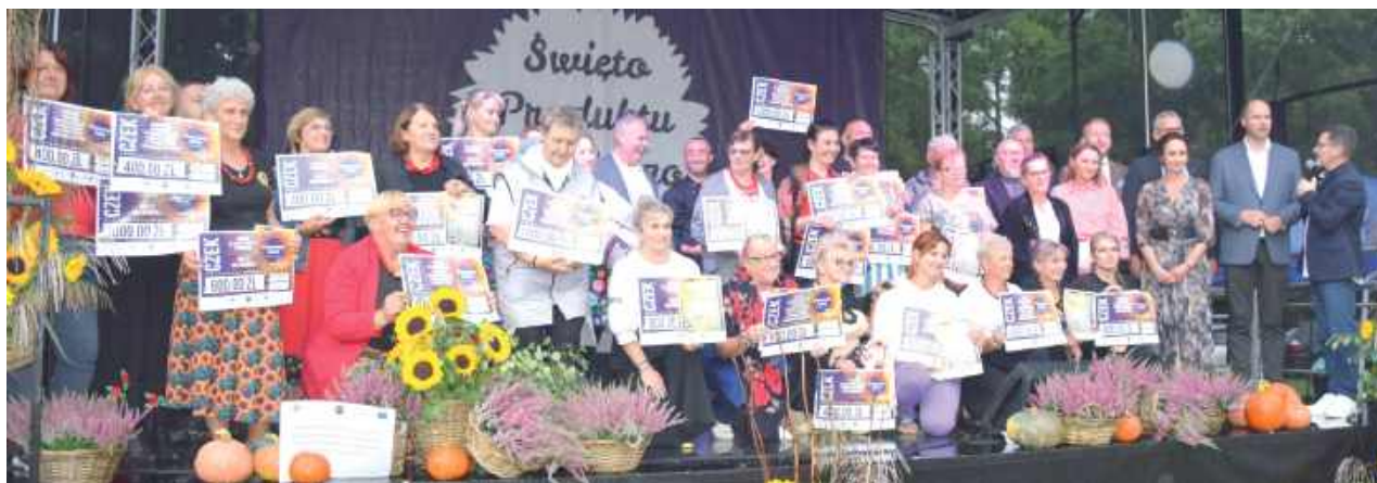
Do tegorocznej edycji konkursów kulinarnych zgłoszono blisko 100 specjałów w sześciu kategoriach – od dań mięsnych, przez przetwory i wypieki, po dania kuchni myśliwskiej i rybnej

Szczególną atrakcją imprezy był pojedynek pod hasłem „Swojskie jadło by się zjadło”. Przy kuchennych stołach zmierzyły się przedstawicielki Kół Gospodyń Wiejskich z całego powiatu i szefowie kuchni lokalnych restauracji, m.in. z „Pełnej Michy”, „Cukrowni” czy „Hotelu Montis”. Emocji i śmiechu nie brakowało – publiczność miała okazję nie tylko oglądać, ale i degustować efekty rywalizacji.