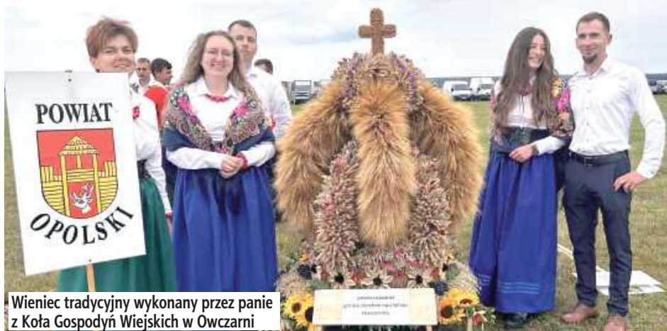
Wieniec tradycyjny wykonany przez panie z Koła Gospodyń Wiejskich w Owczarni

Duma Powiatu Opolskiego wzrosła jeszcze bardziej, gdy okazało się, że wieńce z Kluczkowic