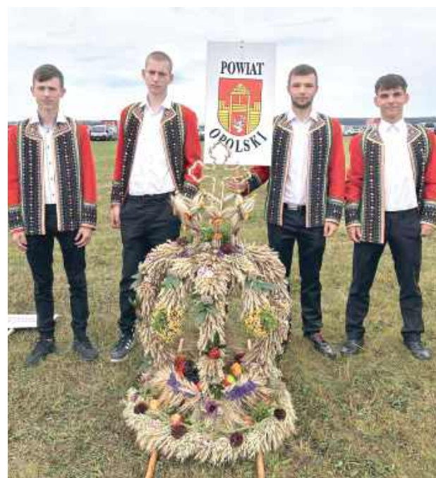
Wieniec współczesny przygotowany przez uczniów Technikum Ogrodniczego w Kluczkowicach