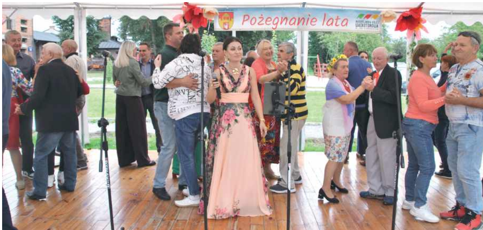
Dzięki muzyce, śpiewom, regionalnym potrawom i życzliwej atmosferze wydarzenie miało niepowtarzalny klimat

Po części oficjalnej przyszedł czas na zabawę. Wy-