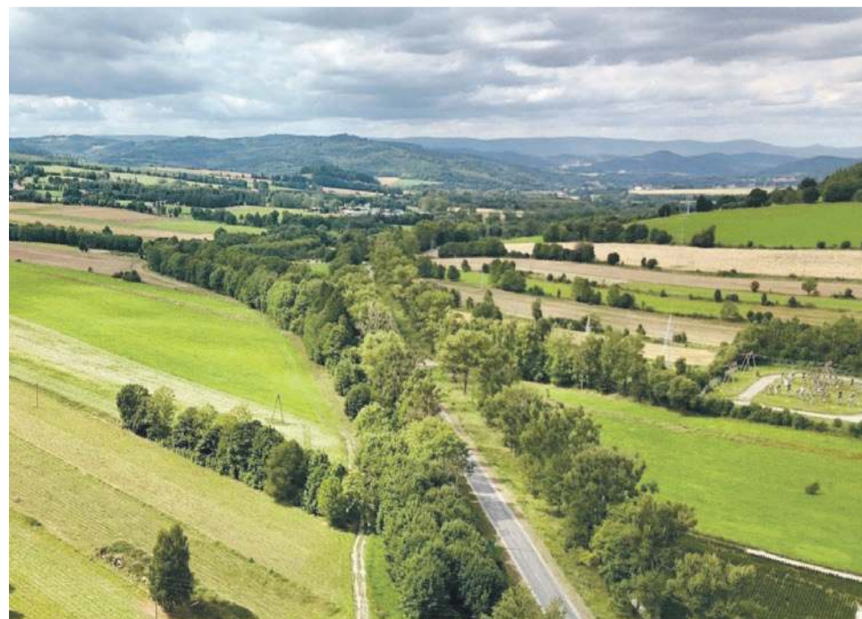
„Dolny Śląsk na dobrej drodze” to autorski program samorządu województwa