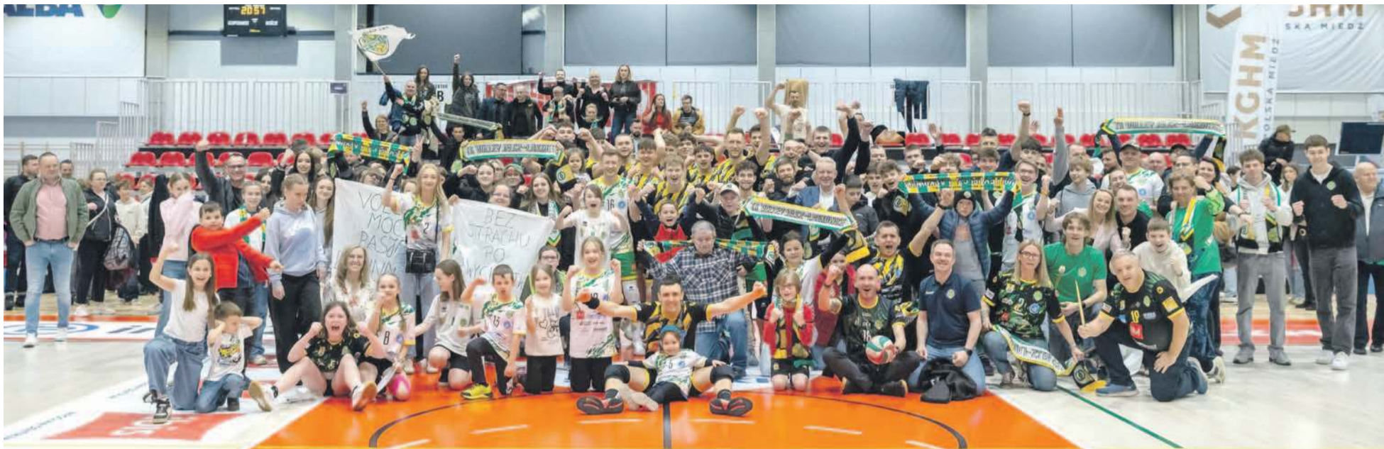
Nie zawiedli siatkarze i niezawiedli kibice, więc w niedzielę wspólnie cieszyli się z awansu do turnieju półfinałowego