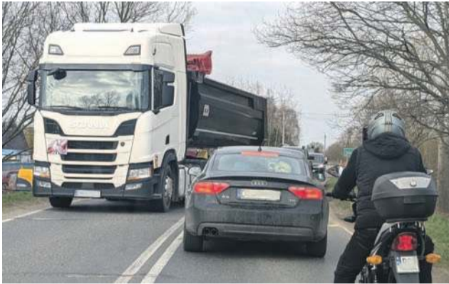
Przyzwyczajajcie się do takich widoków

już o nim wiemy, warto się przygotować i powoli z nim oswoić. Przez lata wszyscy kierowcy klęli na czym świat stoi i prosili o remonty właśnie tych dróg, bo najgorsze, a przez lata nic się nie działo. No to się zadziało. Oczywiście zaraz będzie wysyp mądrych porad, jak można by było to zorganizować lepiej, ale... niewiele możemy tu zdziałać. Była okazja, mamy swojego człowieka we władzach dolnośląskich, które zarządzają Dolnośląską Służbą Dróg i Kolei we Wrocławiu, więc grzechem byłoby nie skorzystać. Przypomnę, że pieniędzy nigdy na te remonty nie wystarczyło, aż nadarzyła się powódź, która „szczęśliwie” liźnęła obie te drogi, więc spokojnie można było wykorzystać nadzwyczajne środki na zwalczanie skutków powodzi. A skoro nadzwyczajne, to i tryb ich