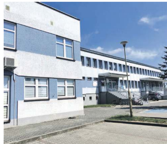
Przychodnia Rejonowo-Specjalistyczna w Jelczu-Laskowicach