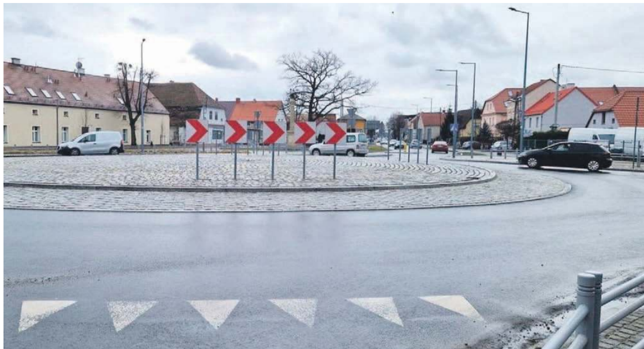
Kolejne rondo w Oławie ma nazwę