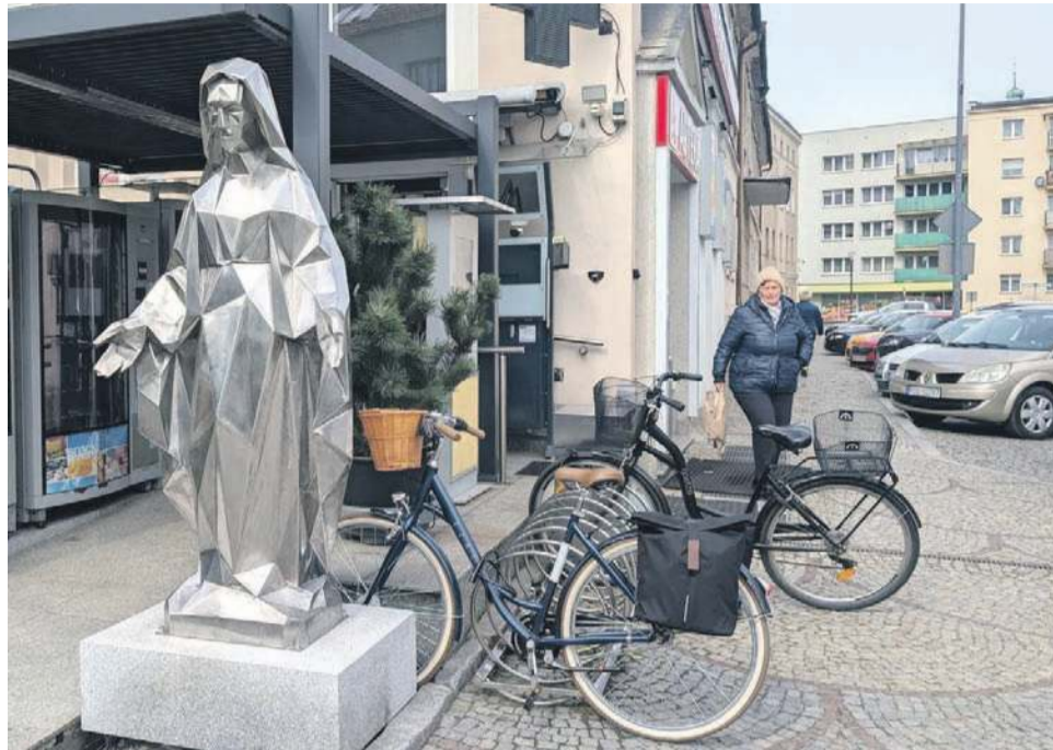
Parę dni temu przed „Apteką pod Lwem” w Oławie stanęła taka figura

podziękować za uratowanie go, u artysty na Podlasiu zamówił właśnie taką figurę, zrealizowaną z 465 kawałeczków metalu. I dostarczył do Oławy.