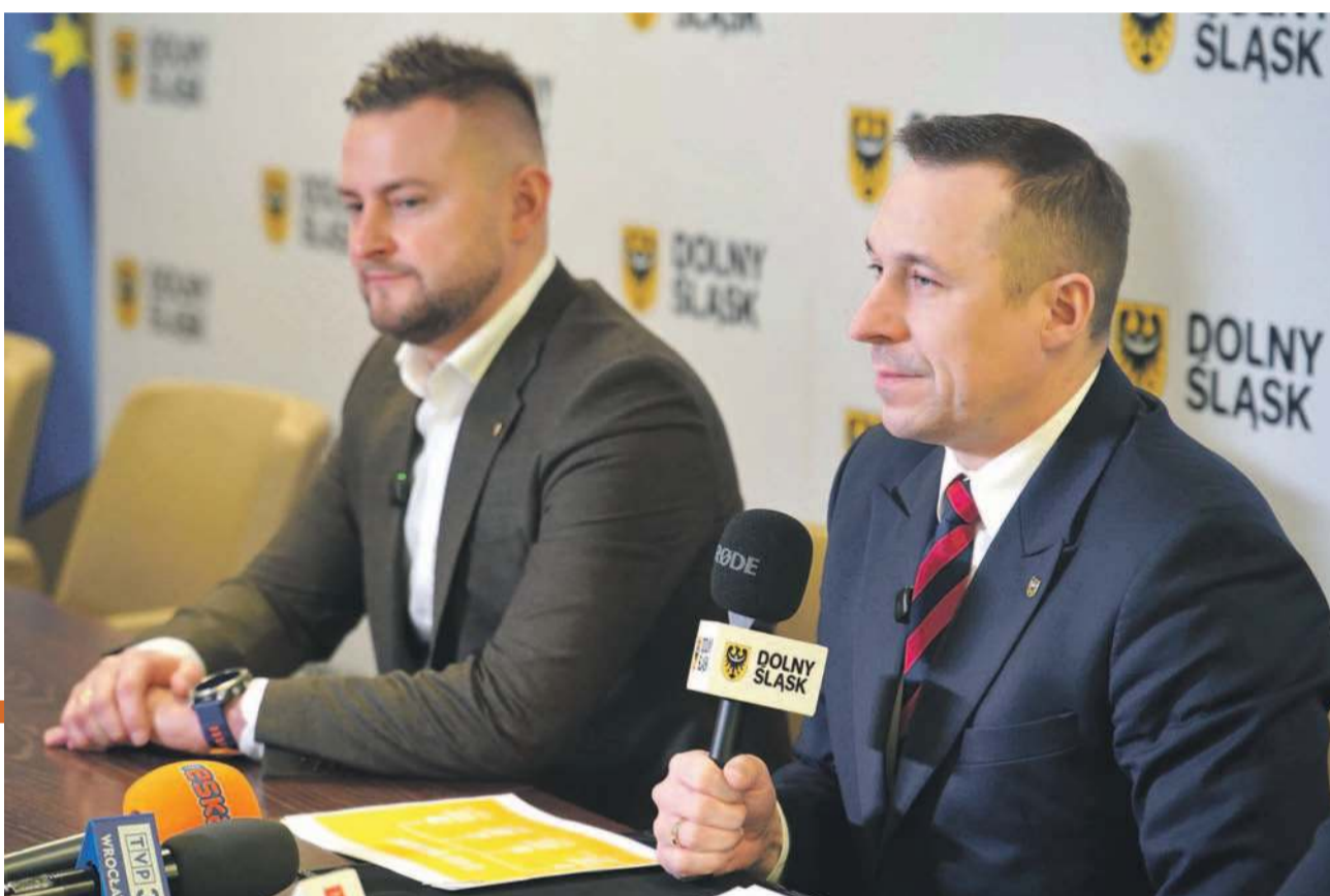
„Dolny Śląsk na dobrej drodze” to autorski program samorządu województwa

W tym roku działania przenoszą się do powiatów: lwóweckiego, złotoryjskiego, karkonoskiego, kamiennogórskiego, wałbrzyskiego, świdnickiego, dzierzoniowskiego, kłodzkiego i ząbkowickiego. W 2027 roku program obejmie powiaty: wrocławski, oławski, strzebiński, legnicki, jaworski, średzki, górowski i wołowski.