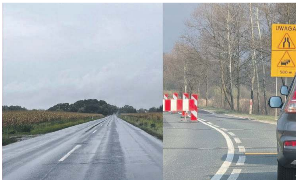
Wkrótce na drodze z Oławy do Jelcza-Laskowic trzeba się spodziewać w kilku miejscach sygnalizacji świetlnej i... korków

A my przypominamy, że właśnie przy okazji tych dobrych informacji rozpoczyna się najtrudniejszy okres dla zmotoryzowanych z powiatu oławskiego jeżdżących po tej stronie Odry, czyli z Oławy do Jelcza-Laskowic, do Bystrzycy, Janikowa, Minkowic Oławskich itp. Ponieważ na trasie z Oławy do Janiko-