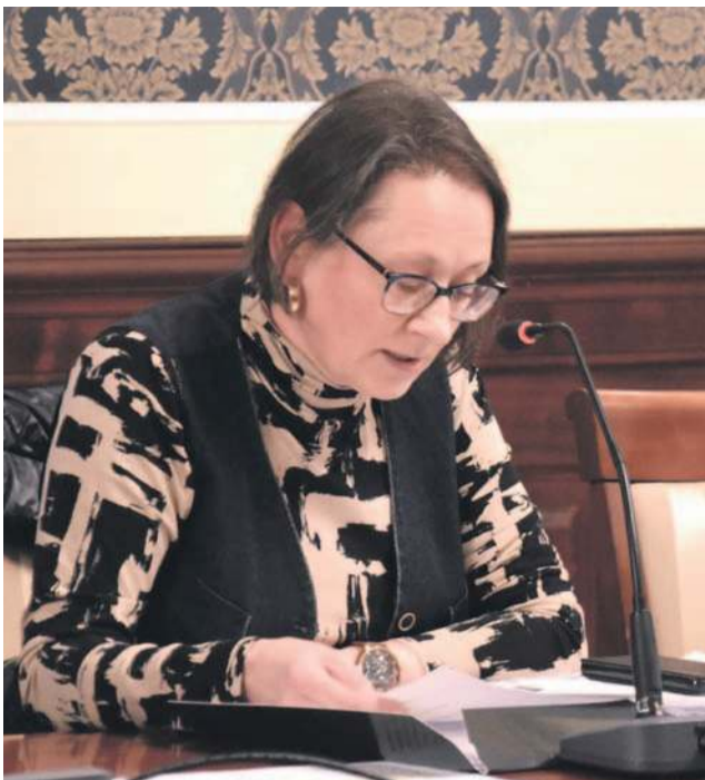
Radna Elżbieta Brezdeń złożyła projekt o nadaniu rondo imienia wnuczki króla Jana III Sobieskiego