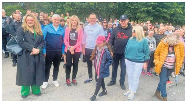
Bieg na sześć łap przyciągnął kilkaset osób.

Trasa biegu została wytyczona w pobliskim lasku. W tegorocznej edycji udział wzięło 120 biegaczy. Każdy z uczestników pokonywał trasę indywidualnie w towarzystwie psa ze schroniska. Zarówno biegacze, jak i ich czworonożni partnerzy bez problemu ukończyli wyznaczoną trasę. - To wydarzenie organizujemy każdego roku i za każdym razem spotyka się