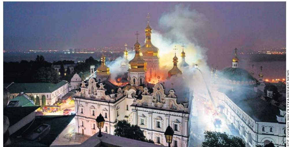
Prawosławna Ławra Peczerska stanęła w płomieniach po uderzeniu dronem. Według dyrekcji klasztoru ikony i inne cenne przedmioty udało się uratować

Reuters zaznacza, że atak nastąpił wkrótce po rozmowie