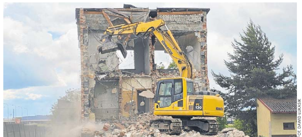
Trwają wyburzenia domów przy ulicy Łódzkiej pod budowę drogi ekspresowej przez Kielce. Ma zniknąć kilkaset budynków

Decyzja o Zezwoleniu na Realizację Inwestycji Drogowej (tak zwany ZRID) obej-