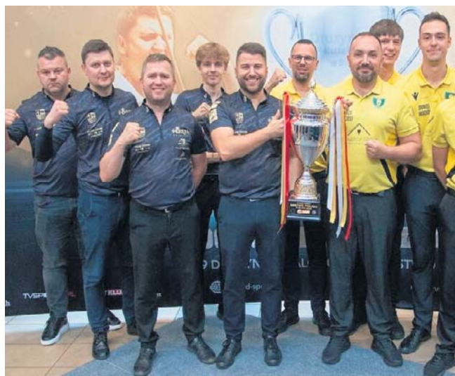
Fortis Bilard Kielce w finale Bilardowej Ekstraklasy zagra o dziesiąty tytuł Drużynowego Mistrza Polski

Partnerem III zjazdu i półfinałów Ekstraklasy było Miasto Katowice. Organizatorem Bilardowej Ekstraklasy jest Polski Związek Bilardowy. ©©