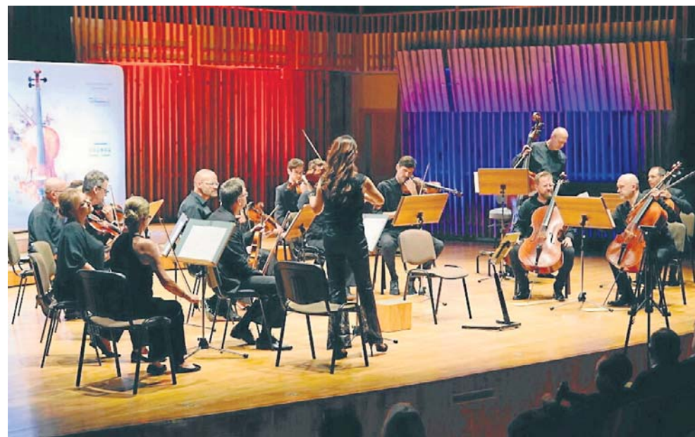
Koncert odbył się w sali Zespołu Szkół Muzycznych imienia Oskara Kolberga w Radomiu. To był ostatni koncert Radomskiej Orkiestry Kameralnej w sezonie 2025/2026.

Połączenie brzmienia orkiestry smyczkowej z dwoma akordeonami nadało koncer-