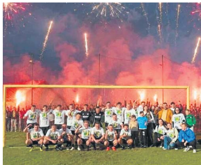
Tak Postęp Łaziska świętował swój awans do piłkarskiej A klasy