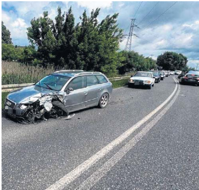
W kraksie, do której doszło w Szczukowicach brały udział trzy samochody

- Badanie wykazało, że kierujący Audi miał w organizmie 0,3 promila alkoholu, nigdy natomiast nie miał uprawnień do kierowania - dodaje policjant.