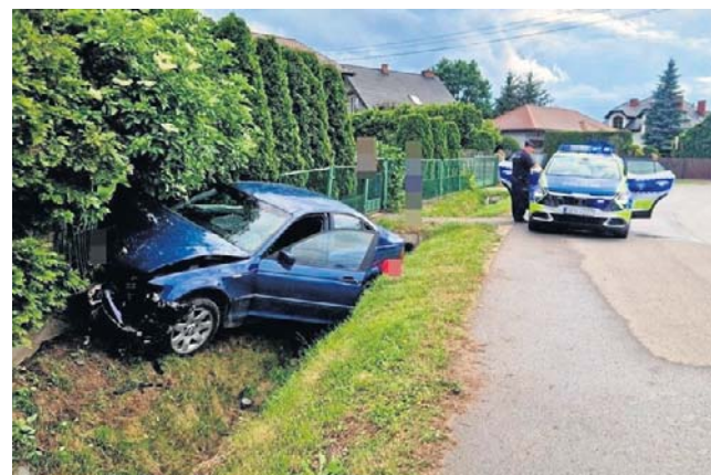
20-letni pijany kierowca BMW stracił panowanie nad pojazdem, zjechał z drogi i uderzył w ogrodzenie.

Funkcjonariusz z Wydziału Kryminalnego Komisariatu Policji I w Radomiu przebywał prywatnie w sąsiedztwie miejsca zdarzenia. Gdy usłyszał huk, natychmiast wybiegł