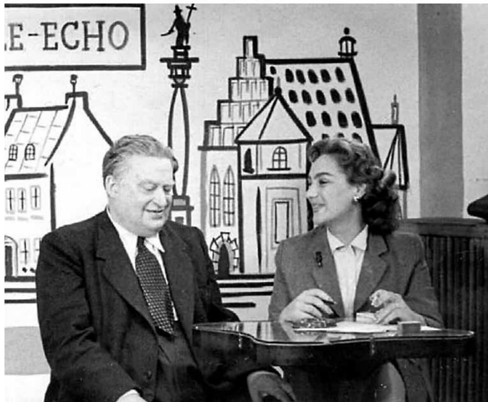
Cat szybko wskoczył w PRL-owskie realia. Zapraszano go nawet do telewizji. Romans z realnym socjalizmem skończył się w 1964 r., gdy został sygnatariuszem „Listu 34”