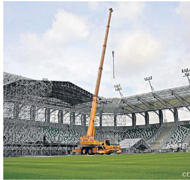
Na stadionie Radomiaka Radom trwają przygotowania do koncertu Jeana Michela Jarre'a

Wiadomo, że artysta przyjeżdża do Polski w środę, 17 czerwca. Wiadomo, że będzie podróżował zwykłym samolotem rejsowym, stąd wiemy już, że nie przywitamy go na lotni-