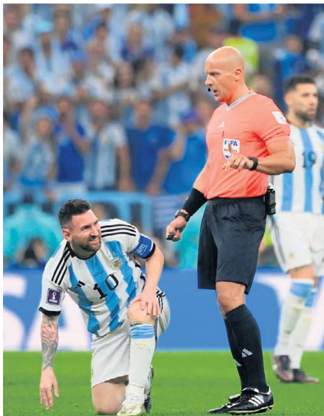
Szymon Marciniak sędziował Lionelowi Messiemu m.in. w finale mistrzostw świata 2022 Argentyna - Francja

Przygotowania do mundialu Marciniak zaczął już kilka miesięcy temu, zanim dowiedział się, że w ogóle otrzyma zaproszenie. W grudniu przeszedł zabieg kontuzjowanej nogi. Potem oszczędzał się w PKO Ekstraklasie. Aż w ostatnim dniu maja wyfrunął na zgrupowanie do Stanów Zjednoczonych. W wywiadzie