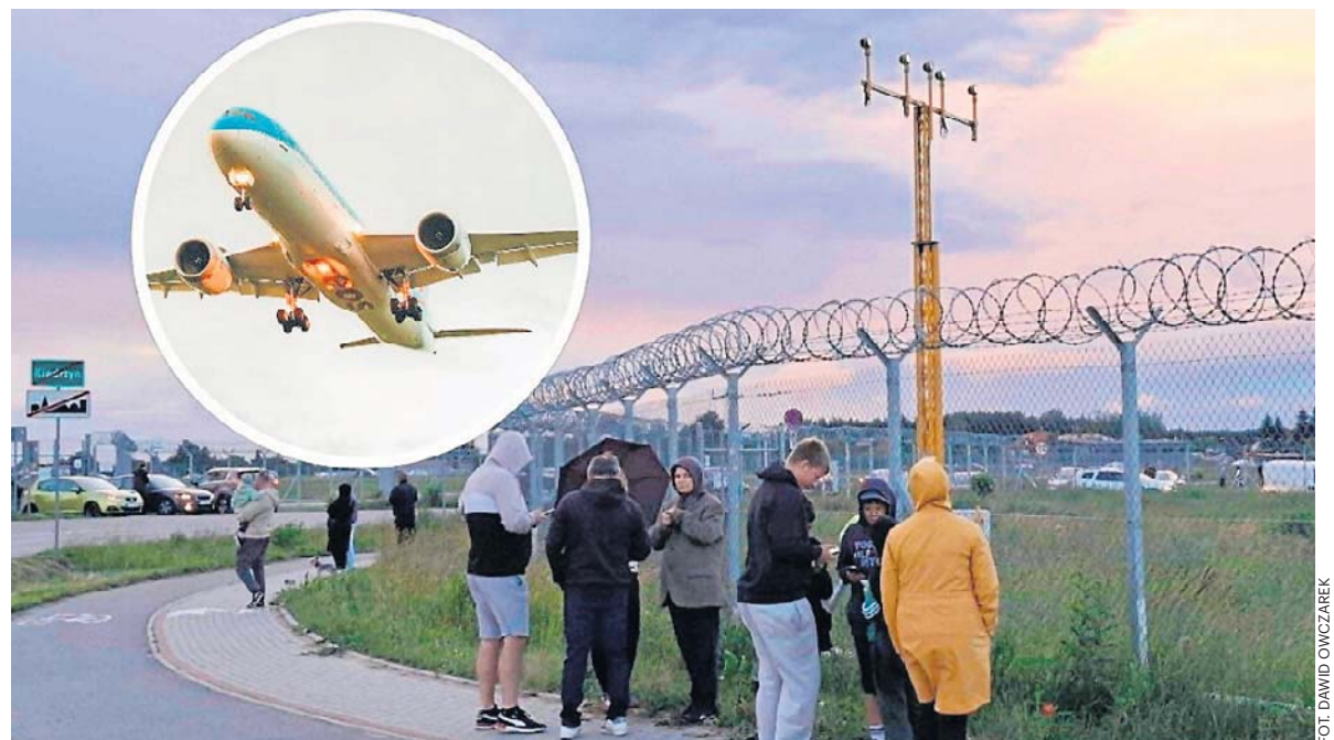
Na samolot pod lotniskiem oczekiwało wielu spotterów, którzy cieszyli się na widok maszyny.

Awans Kozienic, spadają Promna i Warka. W Decathlon 5 lidze niemal wszystko jest już jasne strona 16