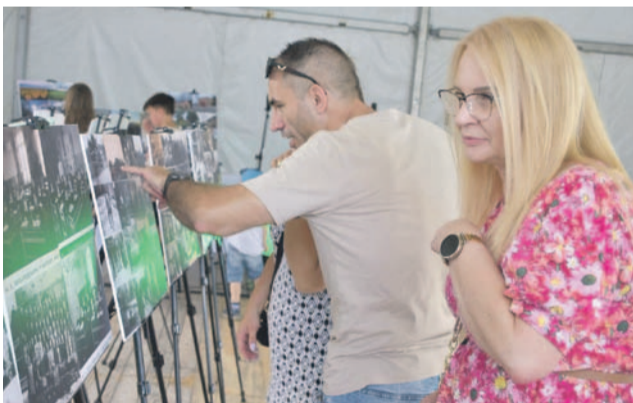
Części oficjalnej towarzyszyła wystawa starych miłocickich zdjęć