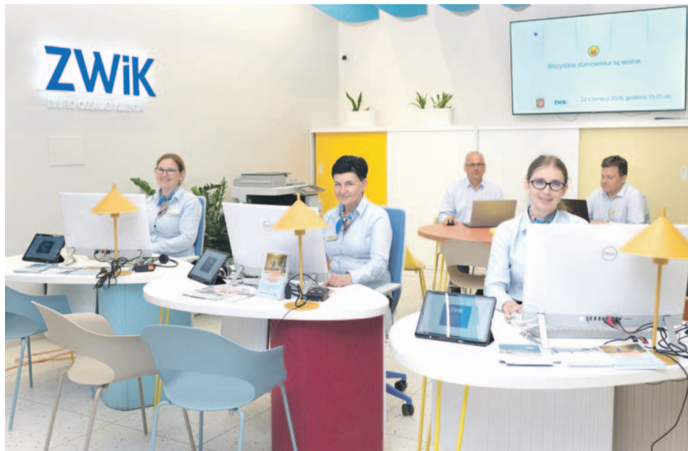
BOK ZWiK mieści się na II piętrze Galerii Oławskiej