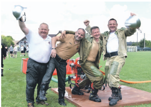
Ekipa „Oldbojów z OSP Domaniów” nie miała sobie równych

PSP z Oławy i Wrocławia, bo druhowie nie raz zgłaszali zastrzeżenia do przyznanych punktów karnych więc wielu sytuacjom trzeba się było przyjrzeć jeszcze dokładniej.