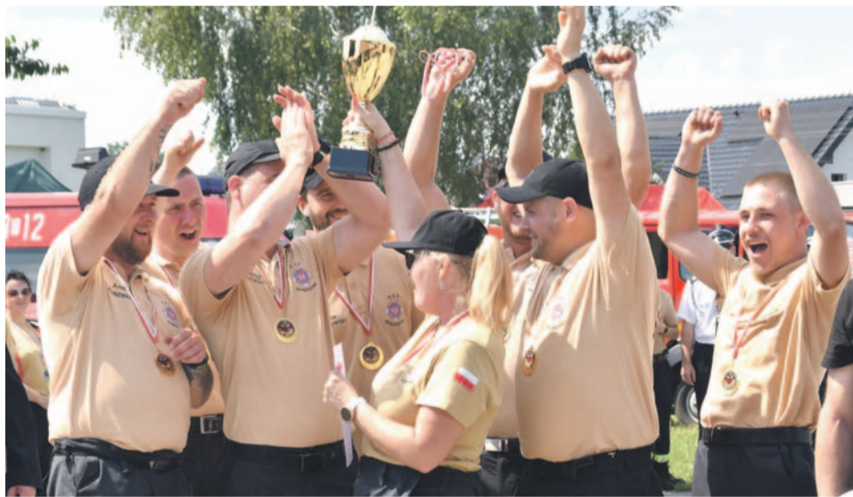
Drużyna OSP z Goszczyny wygrała tegoroczne zawody w kategorii męczyzna

9 kobiecych i 19 męskich z gmin: Oława, Jelcz-Laskowice, Domaniów i Siechnice. Mimo lejącego się z nieba żaru rywalizujący dawali z siebie wszystko by jeszcze bardziej podgrzać atmosferę i dostarczyć kibicom emocji, co się udało. Na nudę nie mogli też narzekać sędziowie - strażacy