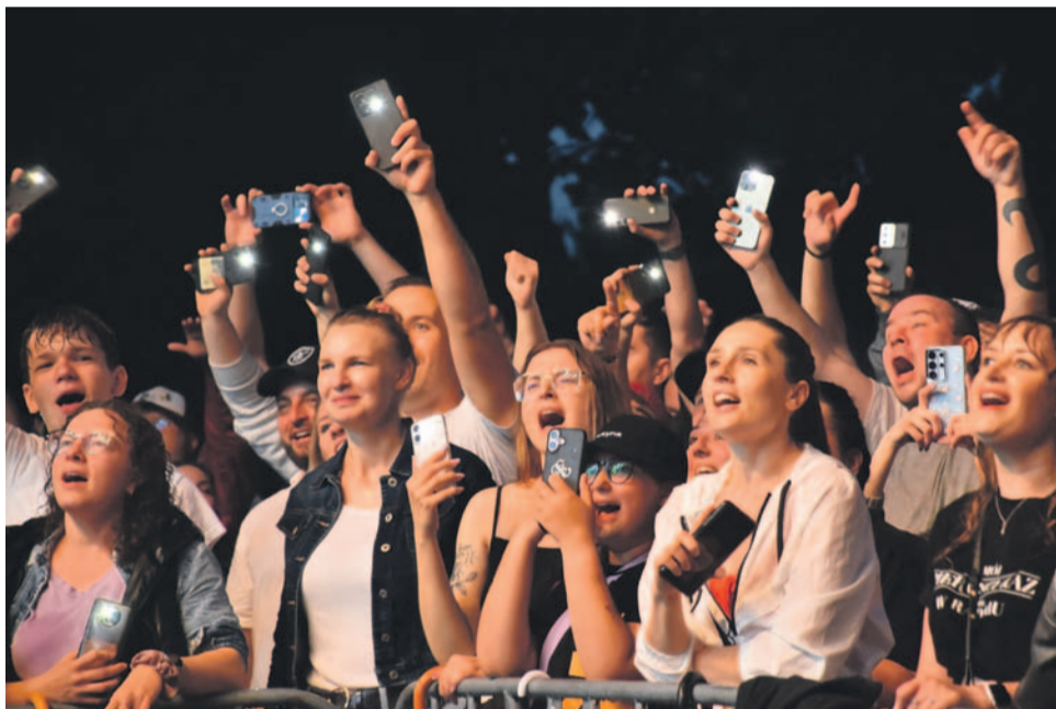
...i publiczność znanego rapera