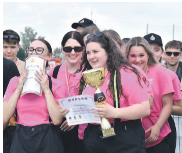
Na najwyższym stopniu podium stanęły dziewczyny OSP w Domaniowie