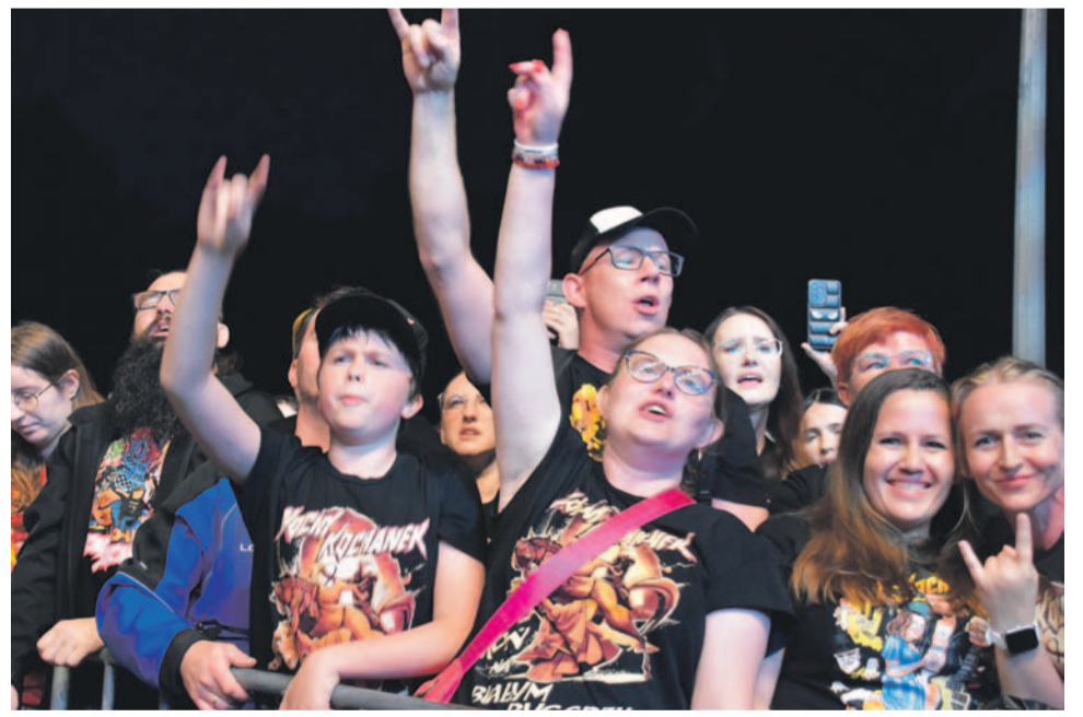
Tak swoich fanów bawił Nocny Kochanek