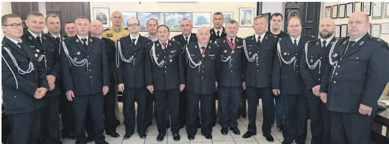
Nowy Zarząd Oddziału Miejsko-Gminnego w Jelczu-Laskowicach OSP RP