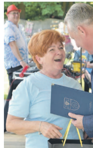
Emocji nie brakowało