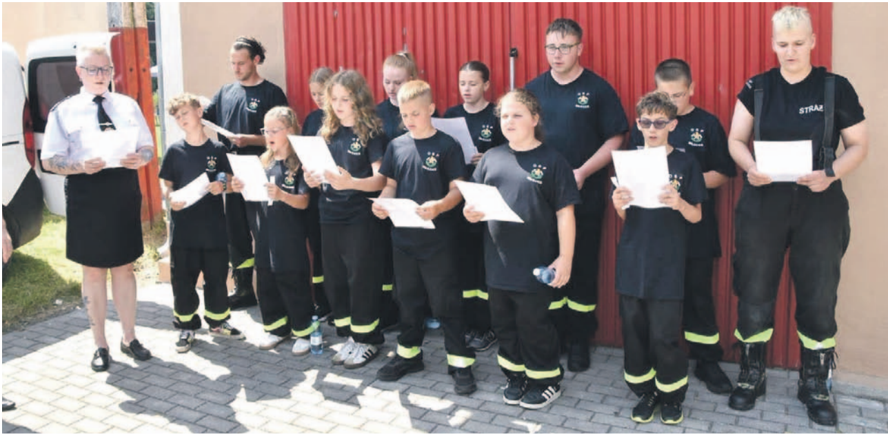
Przed odsłonięciem pamiątkowej tablicy młodzi druhowie odśpiewali hymn OSP „Rycerze Floriana”