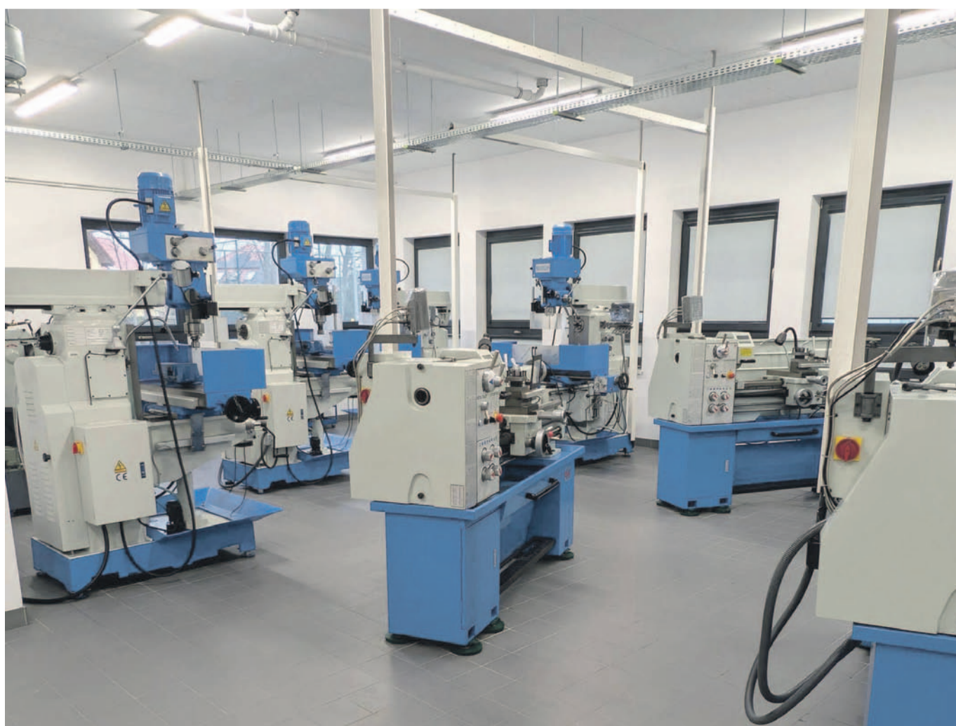
Przy szkole wybudowano nowoczesne warsztaty. To było jedno z marzeń Marii Domaradzkiej