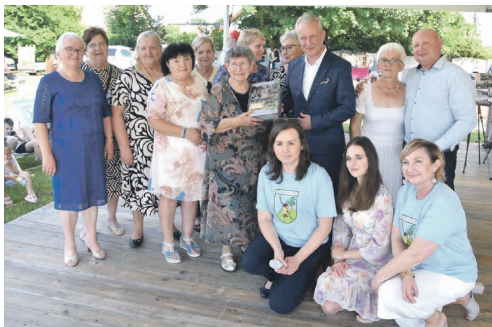
Podziękowania były też dla organizatorów uroczystości