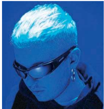
Młody raper może pochwalić się współpracą z czołowymi artystami polskiej sceny hipopowej