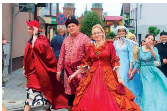
Korowód Dziejów Raciąża to było niezwykle, widowiskowe wydarzenie