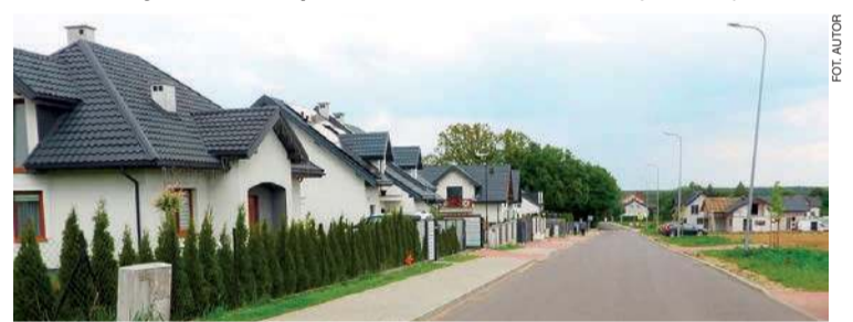
Fragment położonego tuż pod Mławą Szydłówka. Te nowe domy świadczą o tym, że jest to miejsce osiedlania się szczególnie młodych małżeństw

W obiekcie w Krzywonosiu, zaopatrującym w wodę siedem miejscowości (1,2 tys. mieszkańców), jedna studnia się „zapadła”, działła rezerwowa. Trzeba tu zbudować nowe ujęcie wody, odwiert