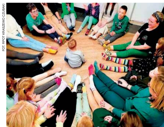
W finansowanej przez samorząd województwa mazowieckiego placówce podopieczni mają zapewnioną opiekę, która jest dostosowana do ich potrzeb.

nym, ze sprzężeniami, spektrum autyzmu, zespołem Downa, zespołem FAS, traumami dziecięcymi, zaburzeniem zachowania i więzi oraz chorobami współistniejącymi: neurologicznymi, kardiologicznymi, układu trawienia oraz zaburzeniami psychicznymi.