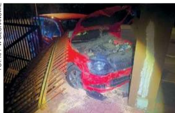
Zdarzenie na ul. Ludowej

- Jak wynika z ustaleń policjantów, kierujący samochodem osobowym marki Skoda Fabia, 36-letni mieszkaniec powiatu ciechanowskiego, zjechał z drogi i uderzył w ogrodzenie jednej z posesji. Mężczyzna miał w organizmie 2,5 promila alkoholu. Na miejsce zdarzenia skierowano patrol policji. Podczas interwencji funkcjonariusze przeprowadzili badanie stanu trzeźwości kierującego. Alkomat wykazał ponad 2,5 promila alkoholu w organizmie