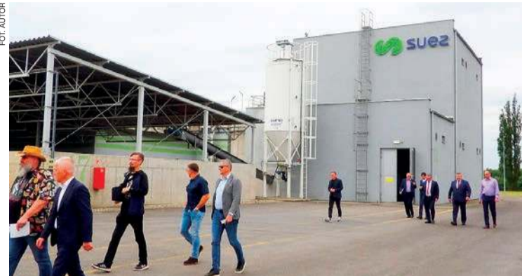
Miejska oczyszczalnia ścieków w Mławie

Miejska oczyszczalnia ścieków w Mławie, zbudowana, sfinansowana i zarządzana przez firmę SUEZ Woda S.A., jest dobrym przykładem partnerstwa publiczno-prywatnego (PPP) – nie mieli wątpliwości uczestnicy wizyty studyjnej w tym obiekcie i seminarium.