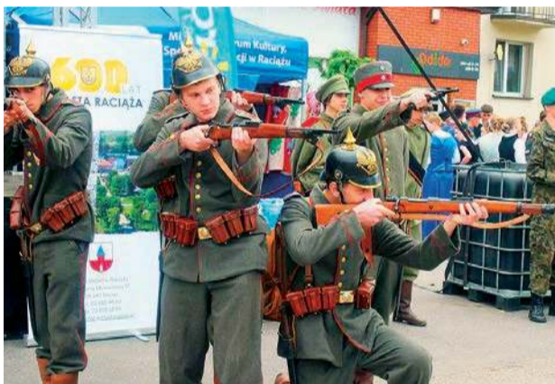
Organizatorzy opowiedzieli w ciekawy sposób historię miasta