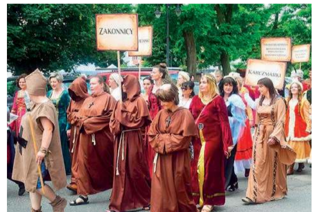
Szli i zakonnicy, i karczmarki

Szkół w Raciążu, I wojnę światową – Społeczne Towarzystwo Oświatowe STO w Raciążu, natomiast stowarzyszenia seniorów i mieszkańcy Raciąża wcielił się w rolę swoich przodków z okresu dwudziestolecia międzywojennego i II wojny światowej.