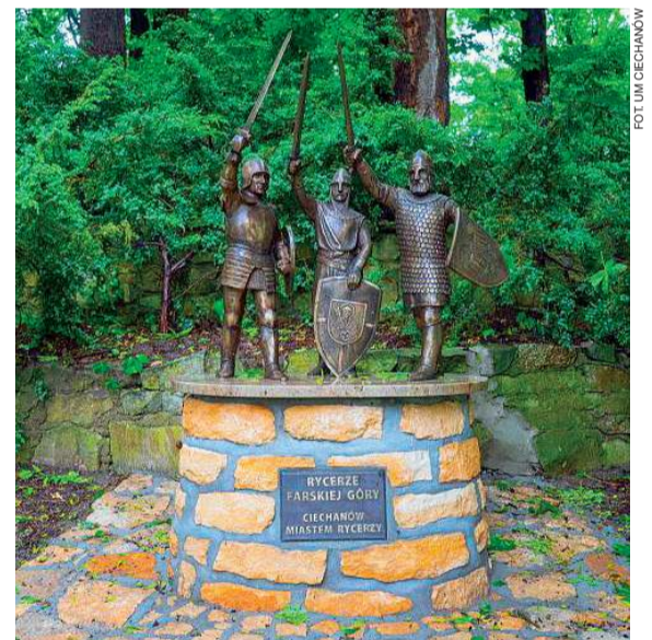
RK Rycerze Farskiej Góry

Jest to piąta z rzeźb na terenie Ciechanowa - przed zamkiem stoi Cieszo, na deptaku w centrum miasta Zygmunt Waleczny, przy przedszkolu na ul. Nadrzeczej Janusz I Starszy, a obok Hotelu Korona Onufry. Trzy nowe postaci rycerzy na Farskiej Górze jeszcze nie mają imion – wybiorą je mieszkańcy miasta w konkursie, który wkrótce zostanie ogłoszony.