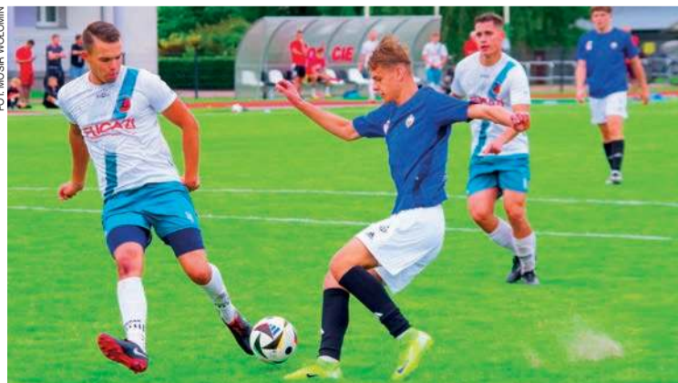
Piłkarze Żbika przegrali na wyjeździe w Wołominie

30. kolejka (14-15 czerwca): Drukarz - Bug, Delta - Narew, Wkra - Marcovia, Mazur - Łomianki, PAF - Huragan, Żbik - Sokół, Nadnarwianka - Polonia II