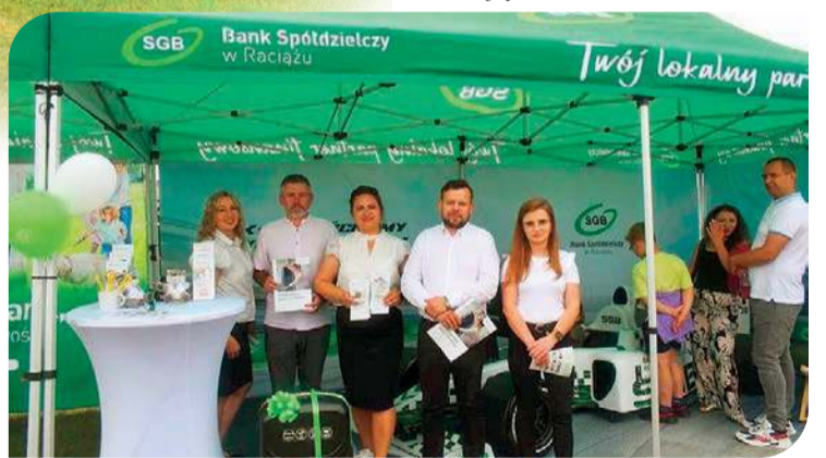
A wśród wystawców był również Bank Spółdzielczy w Raciążu

z wodą w rolnictwie i zmianami klimatycznymi, można było porozmawiać ze specjalistami o wyzwaniach, z jakimi mierzy się rolnictwo oraz o praktycznych sposobach przeciwdziałania skutkom suszy i ekstremalnych zjawisk pogodowych, a także rolnictwie 4.0 – prezen-