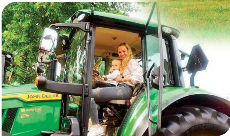
Jak dni rolnictwa, to i nowoczesne maszyny