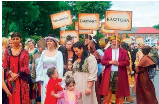
To była kolorowa i ciekawa opowieść o historii miasta