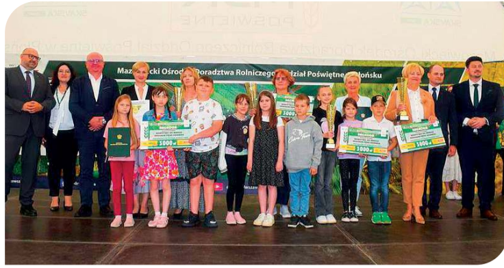
Dyrekcja MODR nagrodziła płońskie podstawówki za projekt dotyczący uprawy poletek przez dzieci

Jubileuszowe wydarzenie, które odbyło się w miniony weekend, 7-8 czerwca w płońskim oddziale Mazowieckiego Ośrodka Doradztwa Rolniczego, objęte