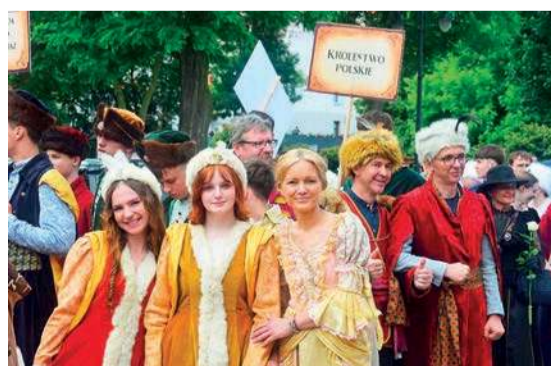
A kto nie był, niech żałuje

- I tym jest właśnie Raciąż, wspólnotą wielu pokoleń – powiedział.