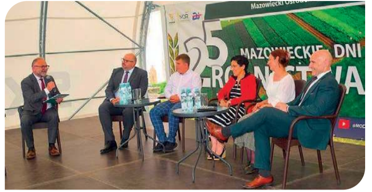
Odbyła się debata poświęcona rolnictwu