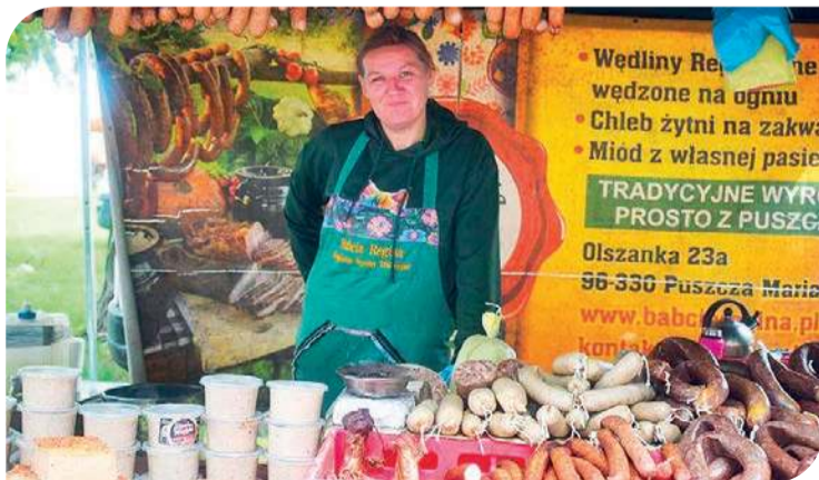
Mazowieckie Dni Rolnictwa to również produkty regionalne

z wodą w rolnictwie i zmianami klimatycznymi, można było porozmawiać ze specjalistami o wyzwaniach, z jakimi mierzy się rolnictwo oraz o praktycznych sposobach przeciwdziałania skutkom suszy i ekstremalnych zjawisk pogodowych, a także rolnictwie 4.0 – prezen-