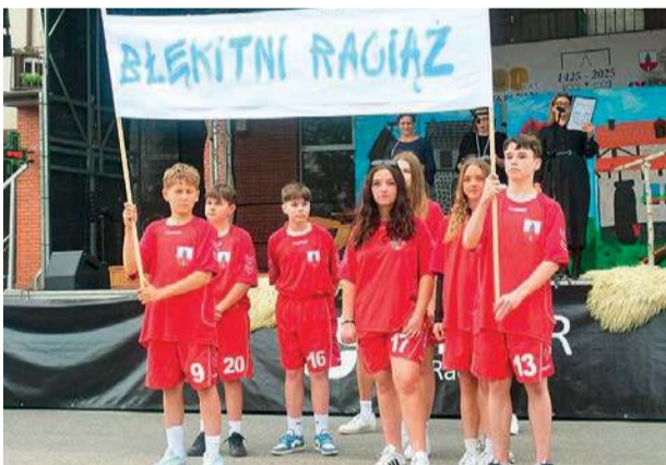
Sybolem miasta są również Błękitni Raciąż