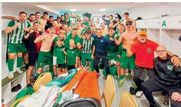
Piłkarze Makowianki zadowoleni po zwycięstwie nad MKS Piaseczno

34. kolejka (11-14 czerwca): Mszczonowianka - Żąbkovia, Troszyn - Pilica, Ursus - Makowianka, Piaseczno - Hutnik, Wieszło - Błonianka, Mazovia - Oskar, Przasnysz - Legionovia, Wilga - Tygrys, Józefovia - Talent