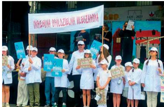
Wśród raciąskich zakładów pracy była Spółdzielnia Mleczarska